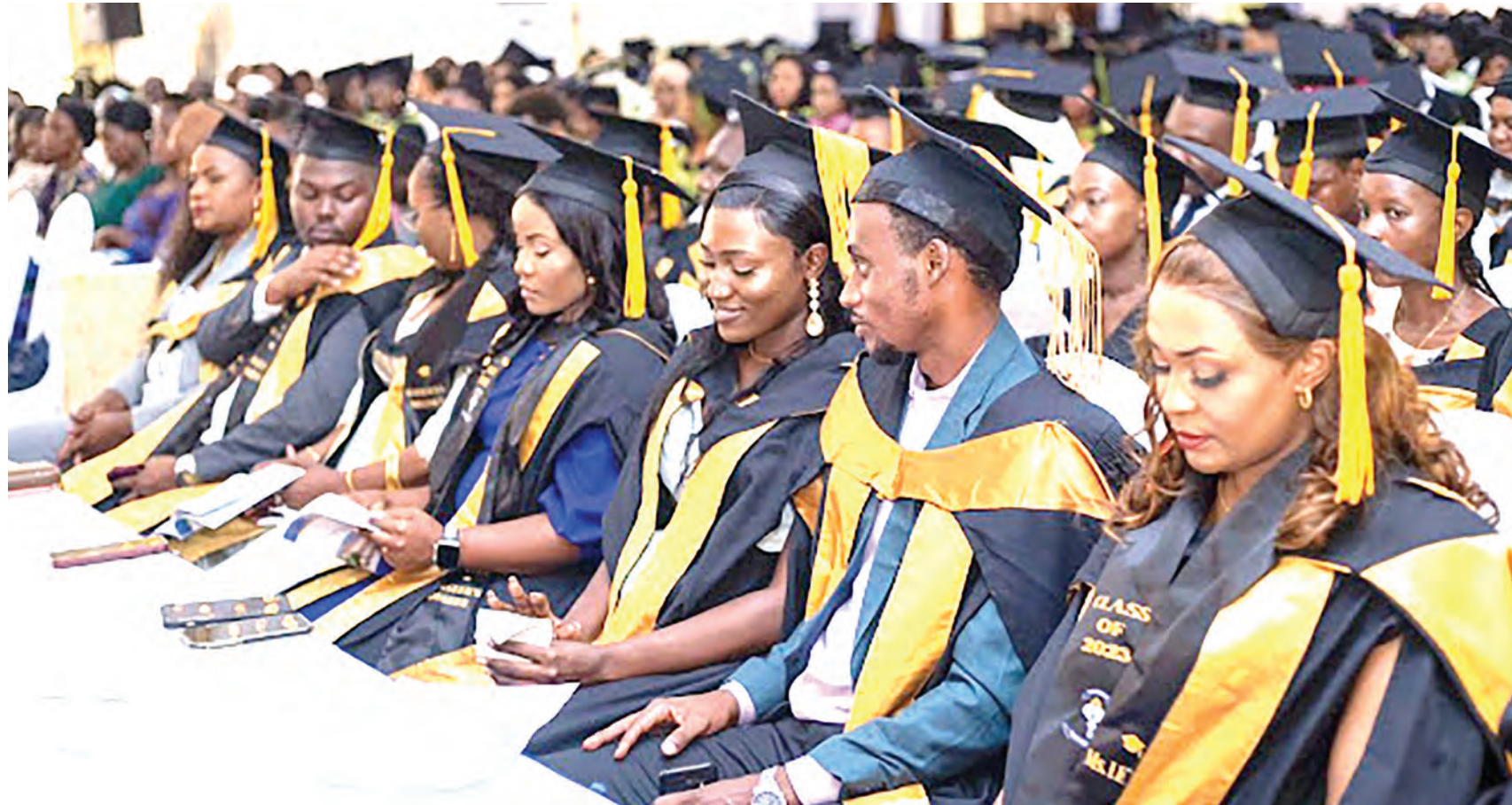
Wahitimu katika Mahafali ya 47 ya Taasisi ya Ustawi wa Jamii, chuoni Kijitonyama, siku chache zilizopita, Dar Es Salaam.

Chuo pia katika majukumu, ilikuwa ni kimbilio kwa wananchi, ambao nchi zao zilikuwa katika mapambano ya kudai uhuru katika kuanda wataalamu, wakati mataifa hayo yakipambania uhuru na ikizingatiwa mchango mkubwa wa Tanzania katika juhudi za ku-