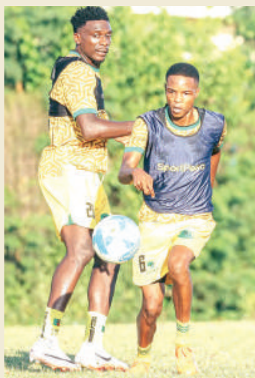
Musonda (kushoto) na Skudu