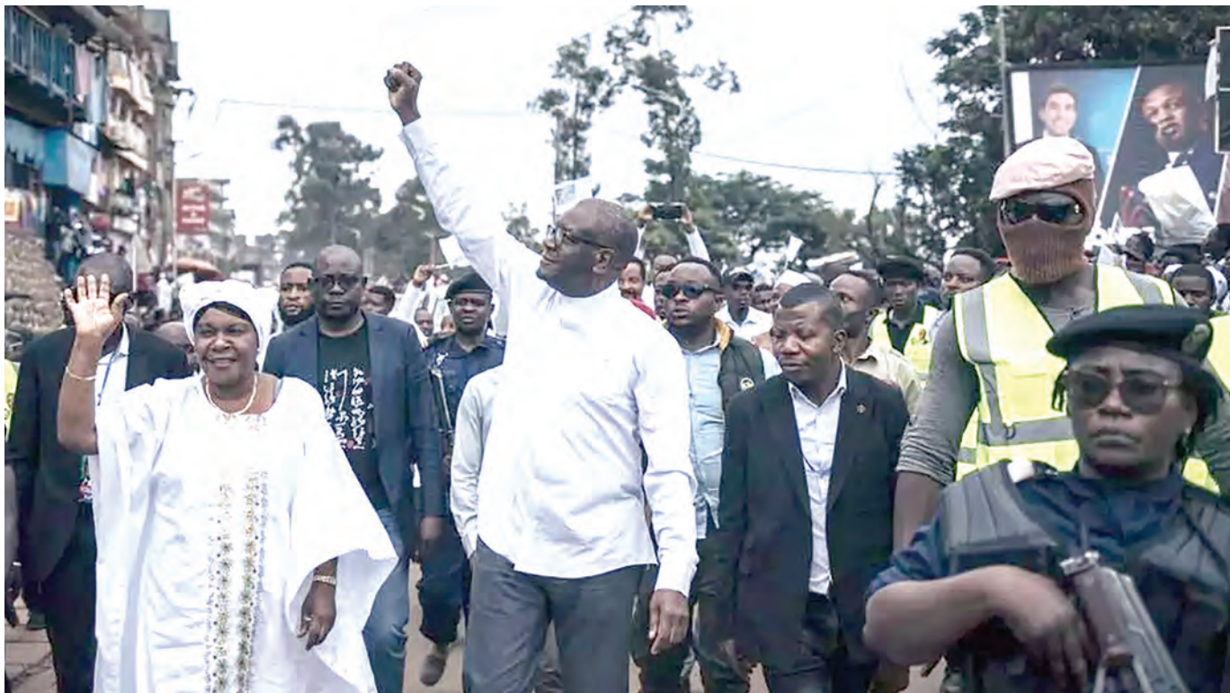
Mgombea wa urais nchini DRC, Dk. Denis Mukwege, akiwasalimia wafuasi wake wakati alipowasili kwenye mkutano wake wa kampeni eneo la Bukavu.

Kulingana na Tume ya Uchaguzi ya DRC (CENI), zaidi ya wagombea 100,000 wanawania nafasi mbalimbali ikiwamo ubunge na udiwani na 22 kwa nafasi ya urais.