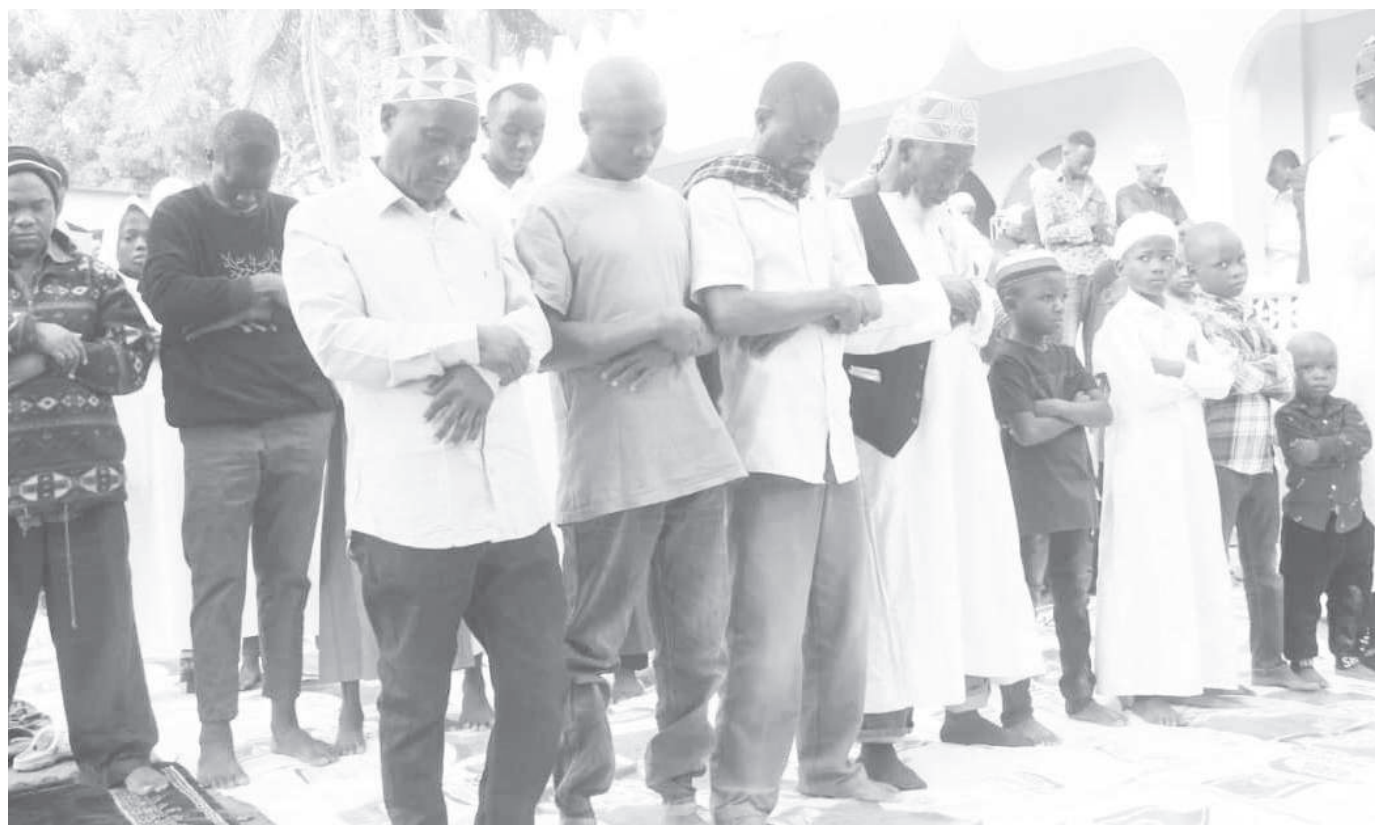
Baadhi ya waumini wa dini ya kiislamu wa mji mdogo wa Mirerani wilayani Simanjiro mkoani Manyara, wakishiriki swala ya Eid El Adha katika Msikiti wa Masjid Noor jana.

Aidha, alisema ili kuhakikisha mtoto anapata elimu bora wamewekeza kwenye miundombinu rafiki na wezeshi na mafunzo kwa walimu kuanzia ngazi ya chekechea na kusisitiza wazazi kuchangia uji kwa wanafunzi wa chekechea mpaka darasa la saba.