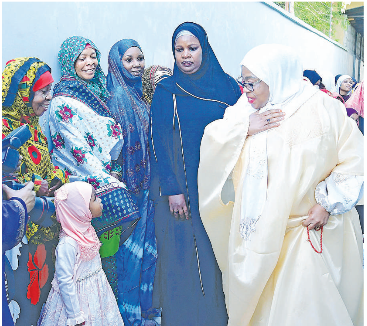
Rais Samia Suluhu Hassan akisalimiana na baadhi ya wananchi na waumini wa dini ya Kiislam baada ya kumalizika kwa Swala ya Eid Al Adha katika Msikiti wa Mikocheni kwa Warioba jijini Dar es Salaam jana.

Pia, aliwakumbusha Watanzania kushiriki haki yao ya kikatiba ya uchaguzi kwa kuomba kuchaguliwa au