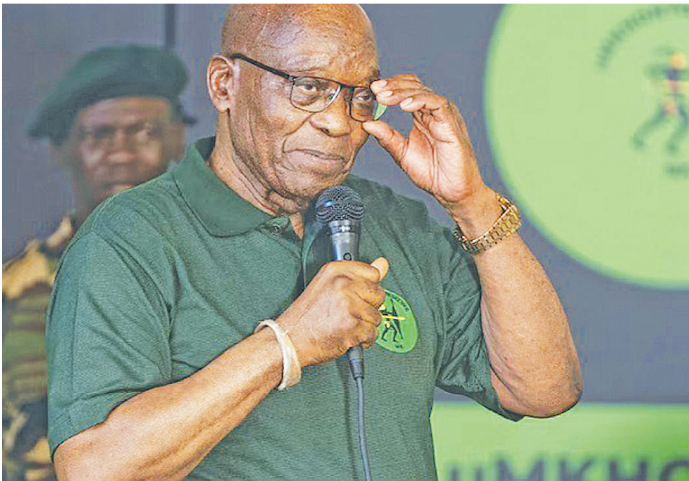
Rais wa zamani wa Afrika Kusini, Jacob Zuma, akizungumza na waandishi wa habari jana nchini humo.