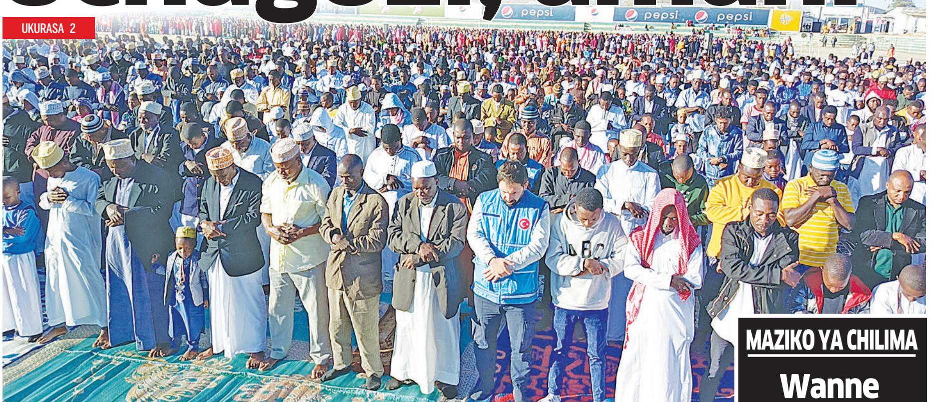
Waumini wa dini ya Kiislam mjini Iringa wakiswali Swala ya Eid Al Adha katika Uwanja wa Samora jana.