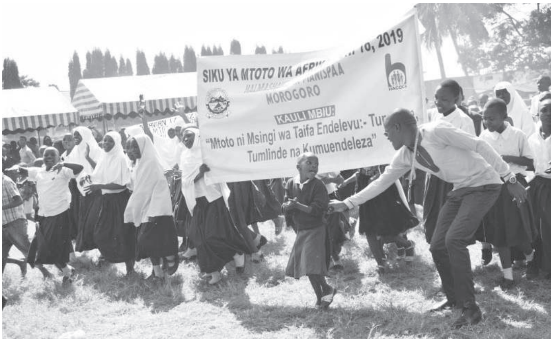
Watoto wakishiriki maadhimisho ya Siku ya Mtoto Afrika.

• Sheria na adhabu zipo, zitumike kumlinda