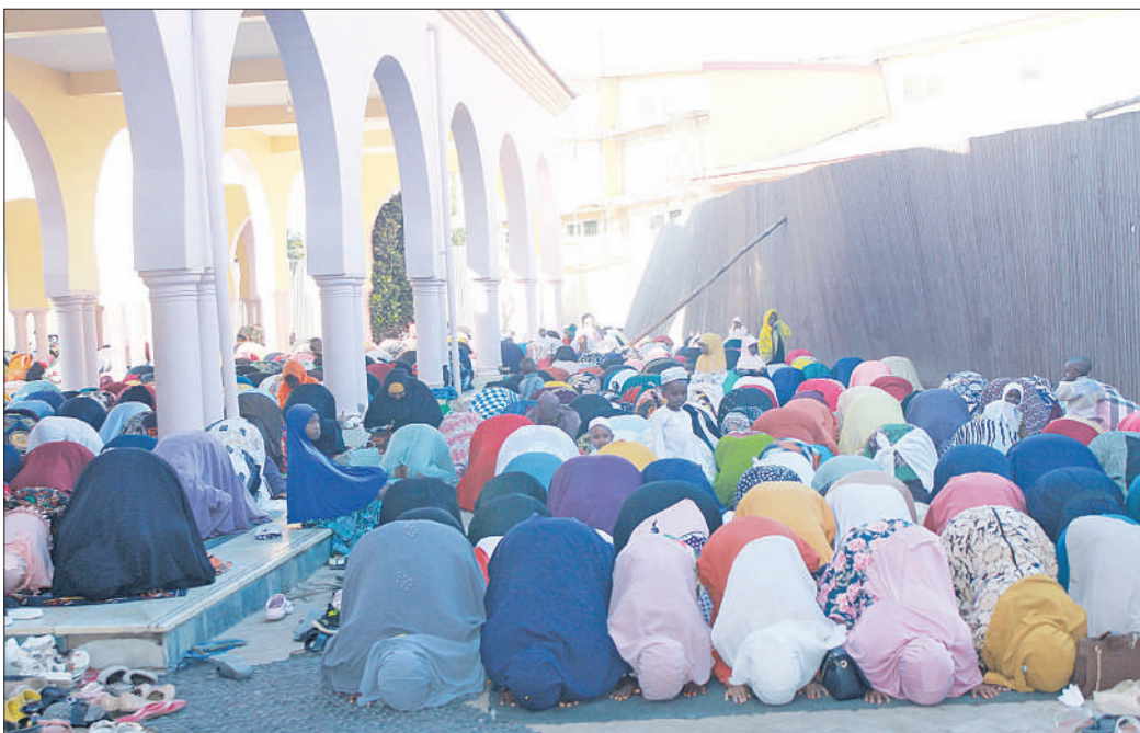
Waumini wa dini ya Kiislamu wakiswali katika ibada ya sikukuu ya Idd -El - Adha iliyofanyika Msikiti Mkuu wa Gadaff Dodoma jana.