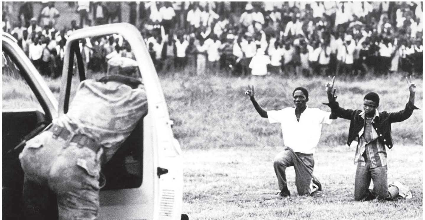
Namna yalivyokuwa maandamano ya watoto, Soweto, Afrika Kusini, hata kuzaa Siku ya Mtoto Afrika, tukio la mwaka 1976. .

Ni mwaka 2018, Makonda aliwatangazia wakazi wa Dar es