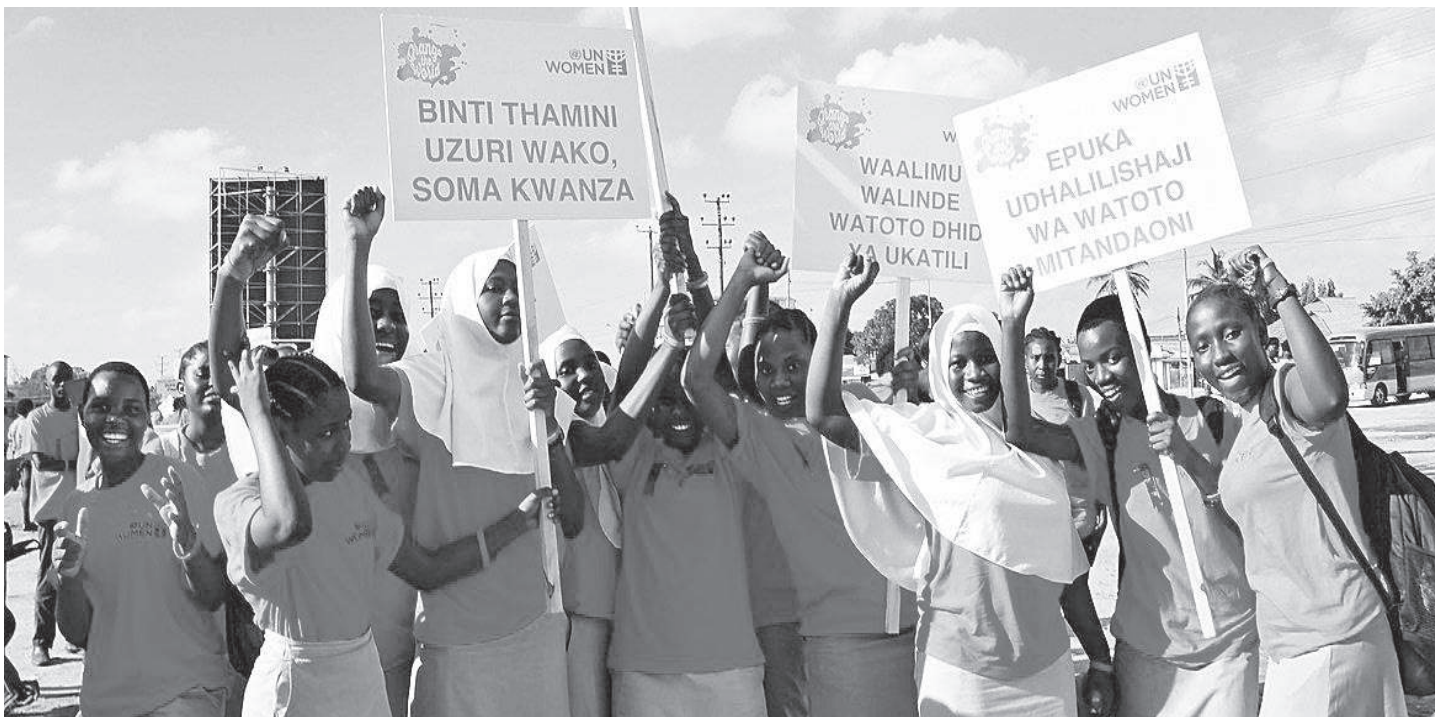
Wanafunzi wasichana mkoani Dar es Salaam, wakiwa kwenye maandamano kupinga ukatili wa kijinsia.

• Mzazi, mwalimu, polisi...wanaguswa mahali hapa