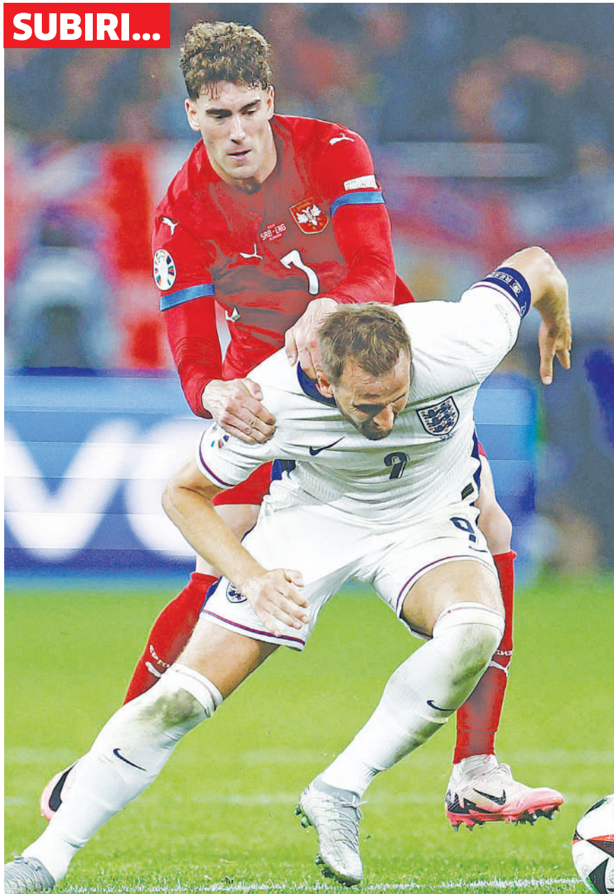
Mshambuliaji wa England, Harry Kane, akipunguzwa kasi kwa kuvutwa bega na kiungo wa Serbia Sergej Milinkovic-Savic, kwenye mechi ya michuano ya Euro iliyopigwa juzi katika Uwanja wa Veltins-Arena, Ujerumani. England ilishinda bao 1-0. Habari UK 21.