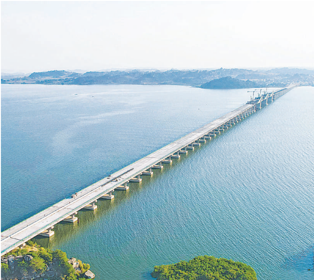
Mwonekano wa Daraja la J.P. Magufuli (Kigongo - Busisi) kilometa 3.2 linalojengwa kuunganisha Barabara Kuu ya Usagara - Sengerema - Geita kupita Ziwa Victoria na ujenzi wa barabara unganishi ya kilometa 1.66, utekelezaji wake ukiendelea na sasa kufikia asilimia 90.