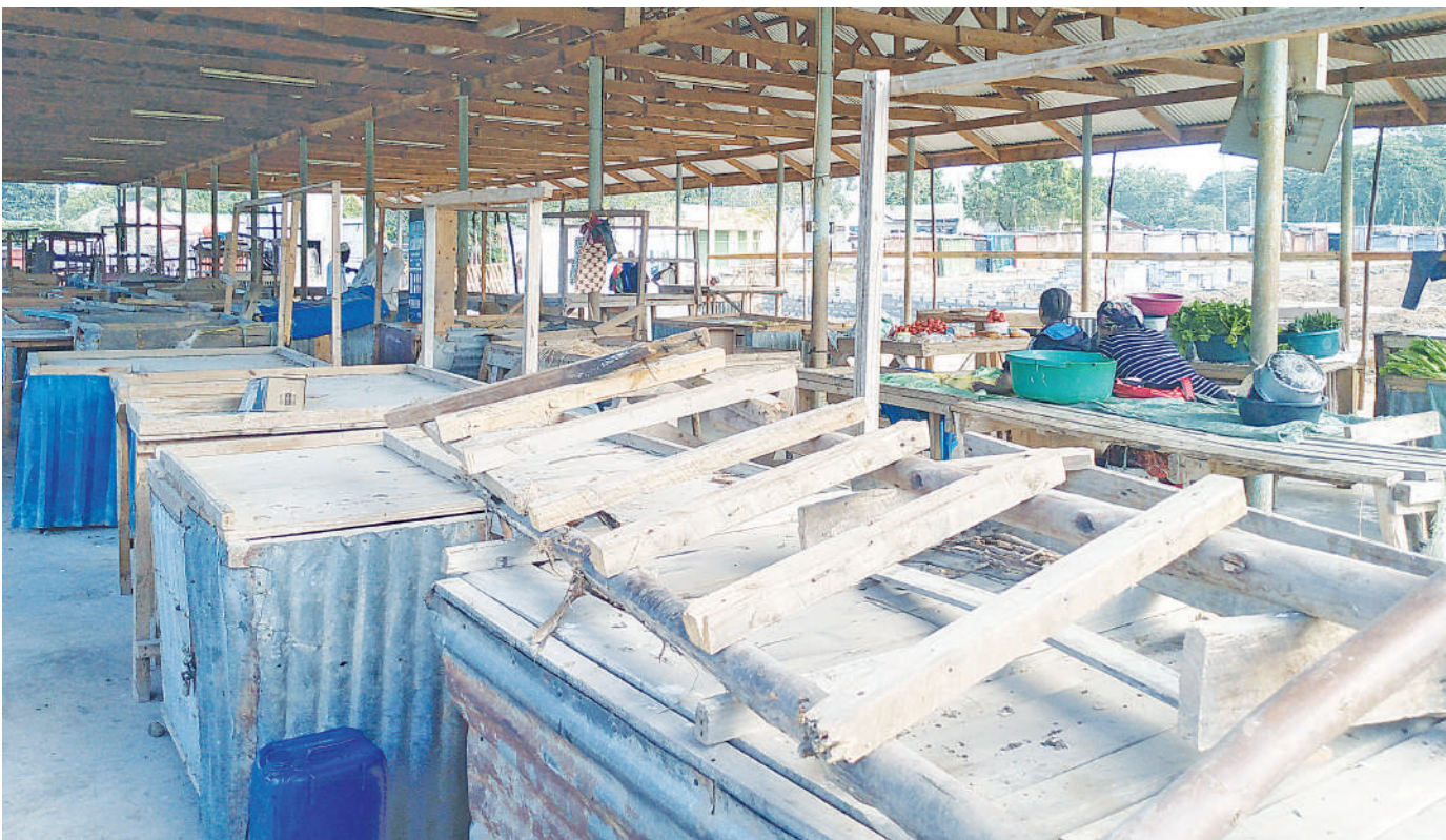
Meza zikiwa tupu katika Soko la Kinyerezi jijini Dar es Salaam juzi, kutokana na wafanyabiashara kulikimbia kwa sababu hakuna wateja.

Alisema kutokana na hali hiyo wamekuwa wakitumia gharama kubwa kusafirisha mazao kutoka kwenye mashamba kwenda barabarani kwa kuwatafuta vibarua wa kujitwisha kichwani.