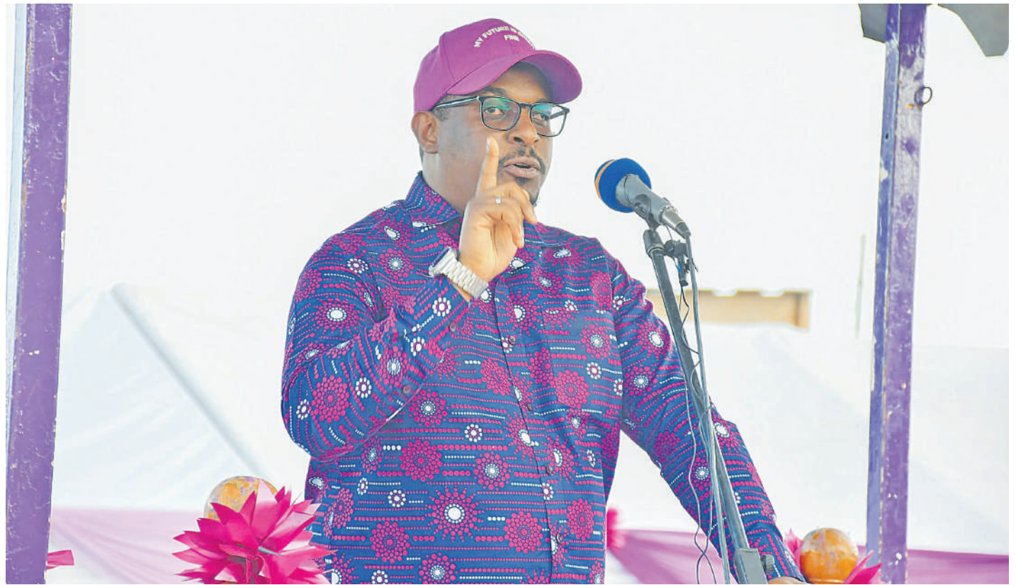
Mwanasheria wa Chama cha ACT-Wazalendo ambaye ni Waziri wa Biashara na Maendeleo ya Viwanda, Omar Said Shaman, akizungumza katika mkutano wa hadhara wa chama hicho uliofanyika Jimbo la Magomeni Zanzibar jana.

Alisema: "SAB tunawaahidi wananchi wa Kisarawe kupata tuzo ya ufugaji kuku kwani Kisarawe imekua ikuchukua tuzo ya ufugaji ng'ombe tu lakini msimu ujao tutakwenda kuendelea kuiheshimisha katika masuala ya ufugaji kuku."