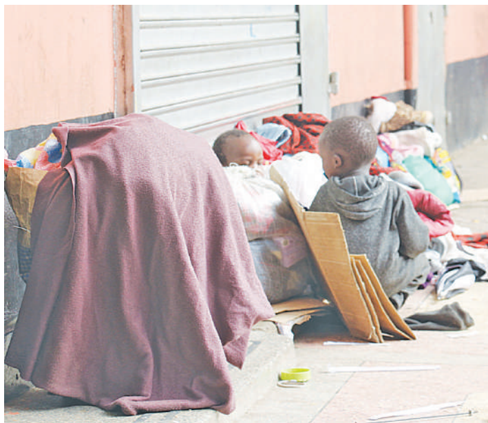
Watoto wa umri wa chini ya miaka minane wakiwa kwenye mazingira magumu mtaani.

Kwa mujibu wa maelezo yake, kipindi hicho ni wakati muhimu wa kuboresha maendeleo ya binadamu na hivyo kupata mtaji bora wa rasili-