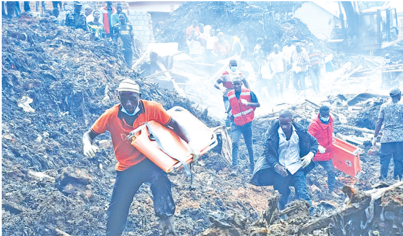
Maofisa wa Msalamba Mwekundu wakishirikiana na wananchi waliojitokeza katika shughuli za uopoaji wa miili ya watu waliofunikwa na jaa la taka Kampala, jana.