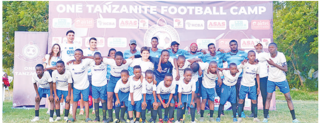
Makocha wa FC Barcelona wakiwa wamesimama na wachezaji chipukizi wa Chuo cha Soka cha Tanzanite kwenye kambi iliyofadhiliwa na Airtel Tanzania hivi karibuni huko Kunduchi, Dar es Salaam.

"Kilichopigwa marufuku ni mkusanyiko uliokuwa umeitishwa na viongozi wa chama cha CHADEMA huko jijini Mbeya kwa kivuli cha kuadhimisha Siku ya Vijana Duniani," alisema.