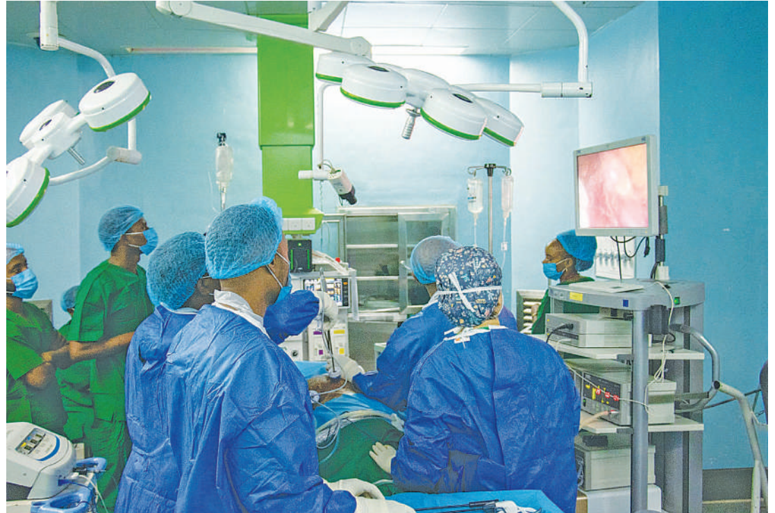
Timu ya Madaktari Bingwa wa Upasuaji wa Mfumo wa Mkojo na Figo kutoka Hospitali ya Taifa Muhimbili (MNH)-Mloganzila, wakiendelea na upandikizaji figo kwa mgonjwa ambaye figo yake imeshindwa kufanya kazi.

Goima, alisema miongoni mwa sababu za magonjwa sugu ya figo ni unywaji pombe uliokithiri, uvutaji sigara, matumizi holela ya dawa za kutuliza maumivu, presha na unywaji holela wa dawa za kienyeji.