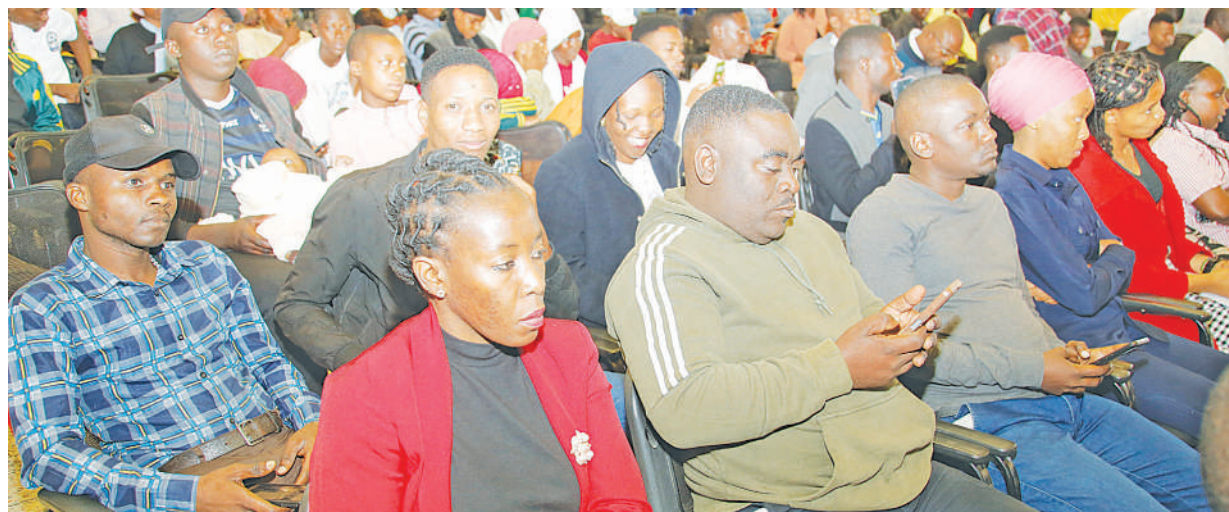
Baadhi ya vijana kutoka mikoa mbalimbali hapa nchini wakishiriki maadhimisho ya Wiki ya Vijana Kimataifa yanayoendelea jijini Dodoma jana, maadhimisho hayo yalianza Agosti 10 na kilele chake ni leo.

Alisema serikali kupitia iliyokuwa Tume ya Rais ya Kurekebisha Mashirika ya Umma (PSRC), ilibinafsisha kiwanda cha Chai cha Mponde mwaka 1999 kwa Umoja wa Wakulima Wadogo wa Chai uliofahamika kwa jina la Usambarara Tea Growers Association (UTEGA).