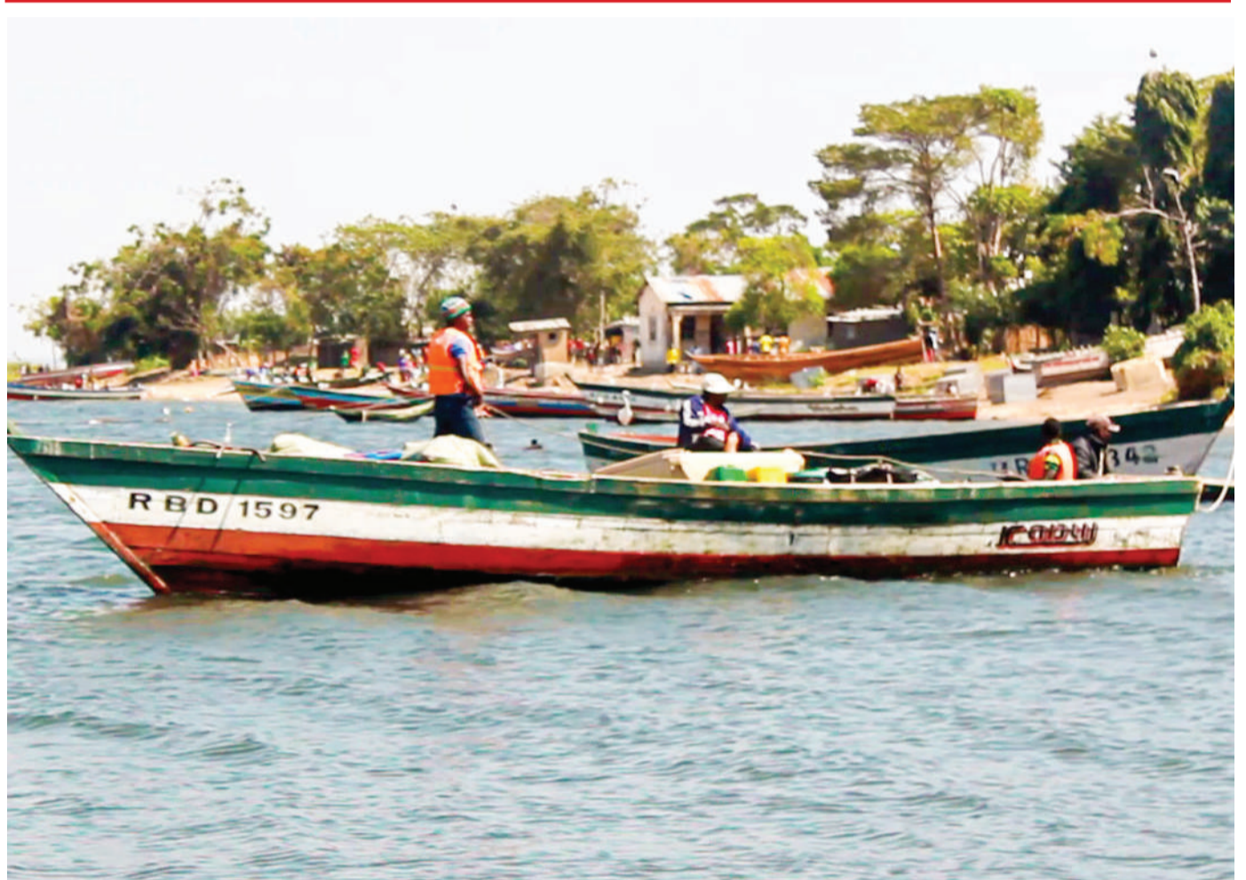
Wavuvi wa mwalo wa Barabara ya Ukerewe, jijini Mwanza, wakiwa kwenye mtumbwi wakijiandaa kuelekea kutega nyavu katika Ziwa Victoria jana.

Alisema kuna wakati wafanyabiashara wa eneo hilo wanakosa fedha za kununua madini na kusababisha washindwe kuuza madini waliyonayo.