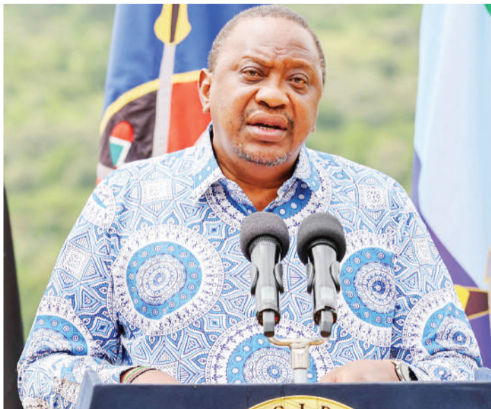
Rais mstaafu wa Kenya, Uhuru Kenyatta.

Wangukuwa wakweli kwamba Azimio haiwezi kuuzika kwenye Mlima Kenya, tusingekuwa hapa tulipo leo lakini kwangu mimi ni mkweli na watu wanatakiwa kunizoea.