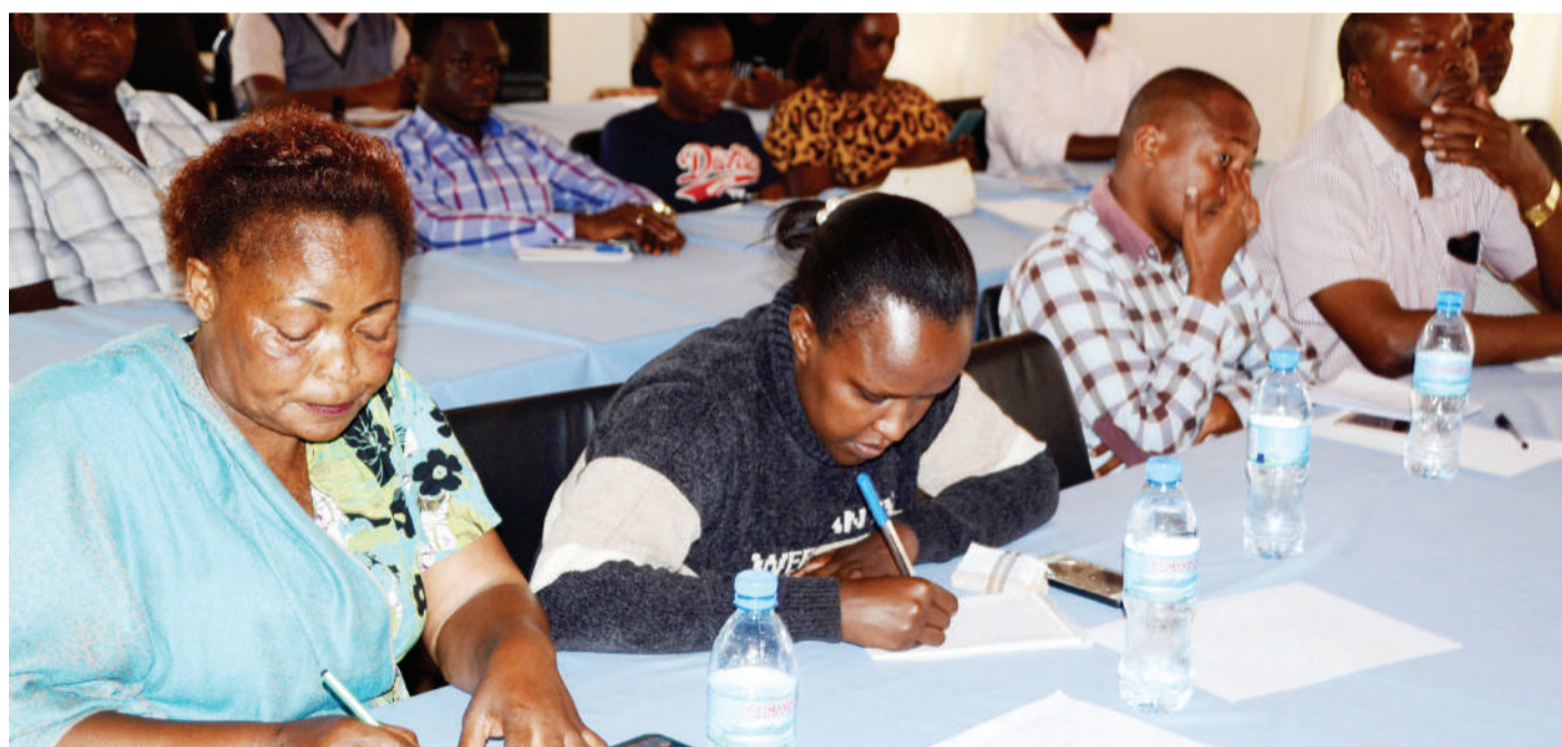
Baadhi ya wafanyabiashara wakishiriki semina maalumu ya kuwajengea uelewa wa mabadiliko ya sheria mbalimbali za kodi, iliyoendeshwa na Ofisa Msimamizi wa Kodi na Elimu wa Mamlaka ya Mapato Tanzania (TRA), Odupo Papa (hayupo pichani), mjini Moshi, mkoani Kilimanjaro jana.

Meneja wa mfuko huo, alisema endapo makundi hayo mawili watajiunga kwenye vikundi hivyo watakuwa na uhakika wa kupata matibabu watakopokuwa na ugonjwa wa aina yoyote.