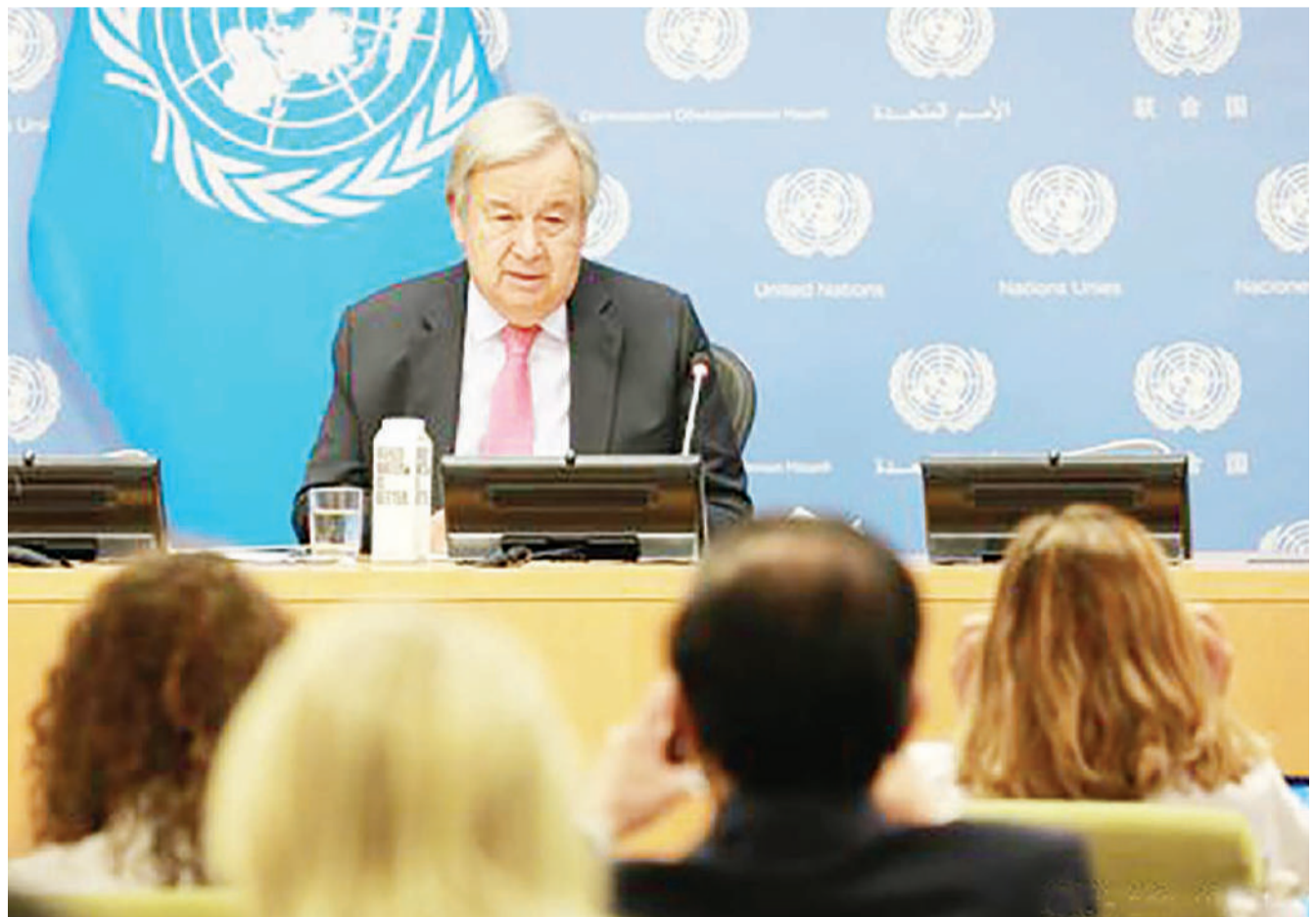
Katibu Mkuu wa Umoja wa Mataifa (UN) Antonio Guterres akihutubia katika kikao maalumu cha kilele kilichokuwa kikizungumzia mustakabali wa elimu duniani.