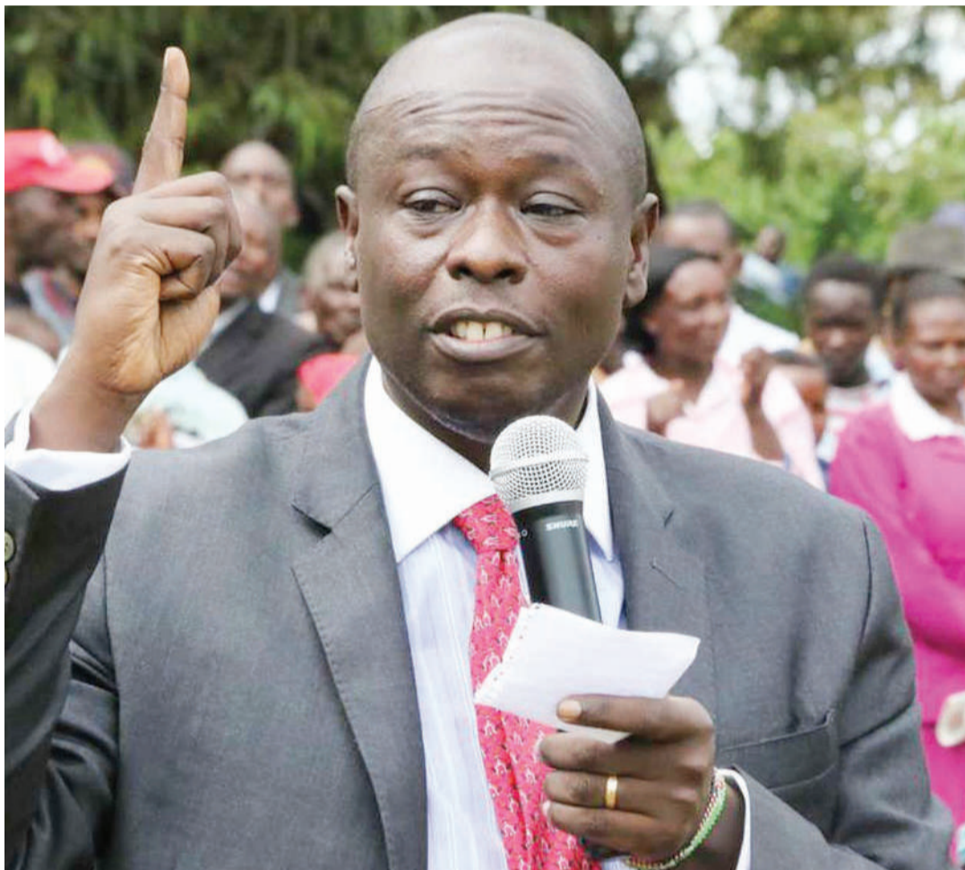
Naibu Rais wa Kenya na Mfalme wa Mlima Kenya, Rigathi Gachagua.