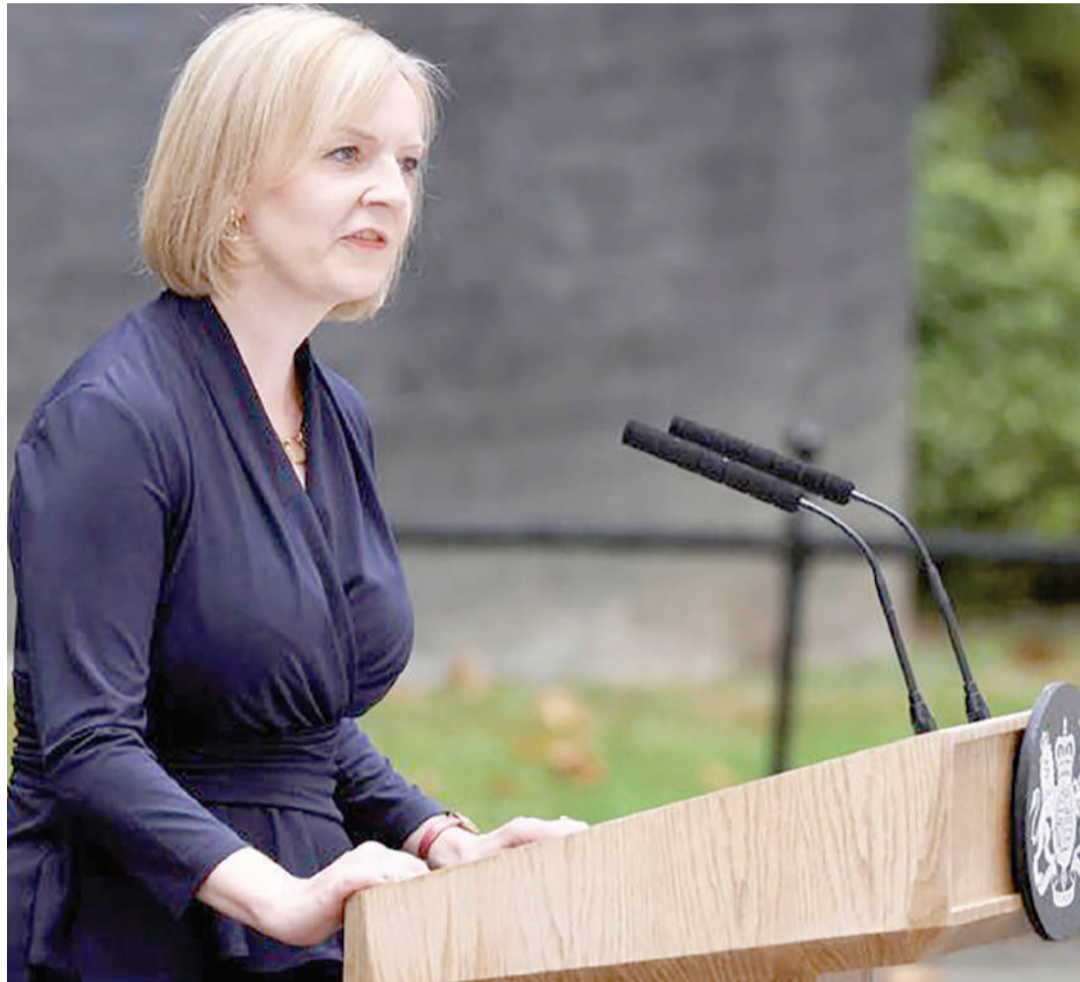
Waziri Mkuu wa Uingereza Liz Truss na Naibu wake Therese Coffey, kinamama hao kutoka Chama cha Conservative ndiyo viongozi wakuu wa nchi hiyo.