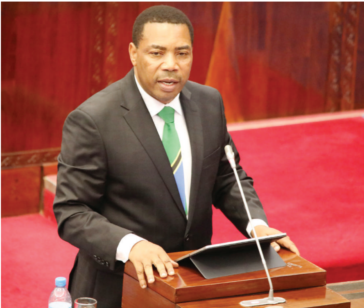
Waziri wa Fedha na Mipango, Dk. Mwigulu Nchemba