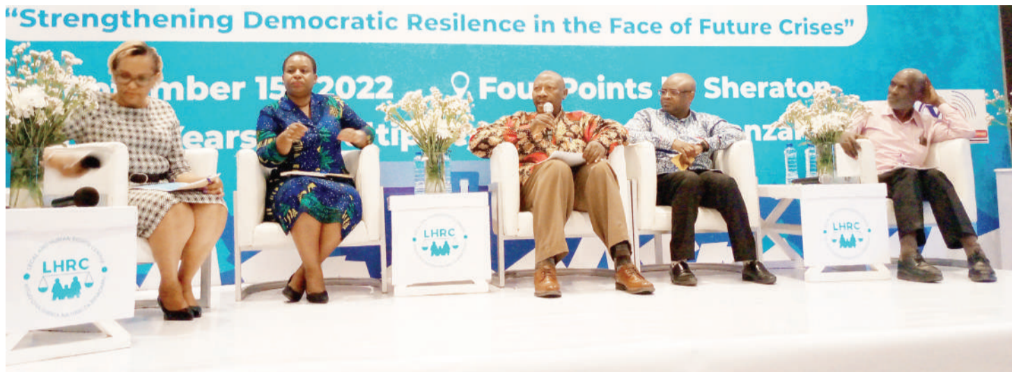
Wadau wa siasa wakiwa katika mjadala.