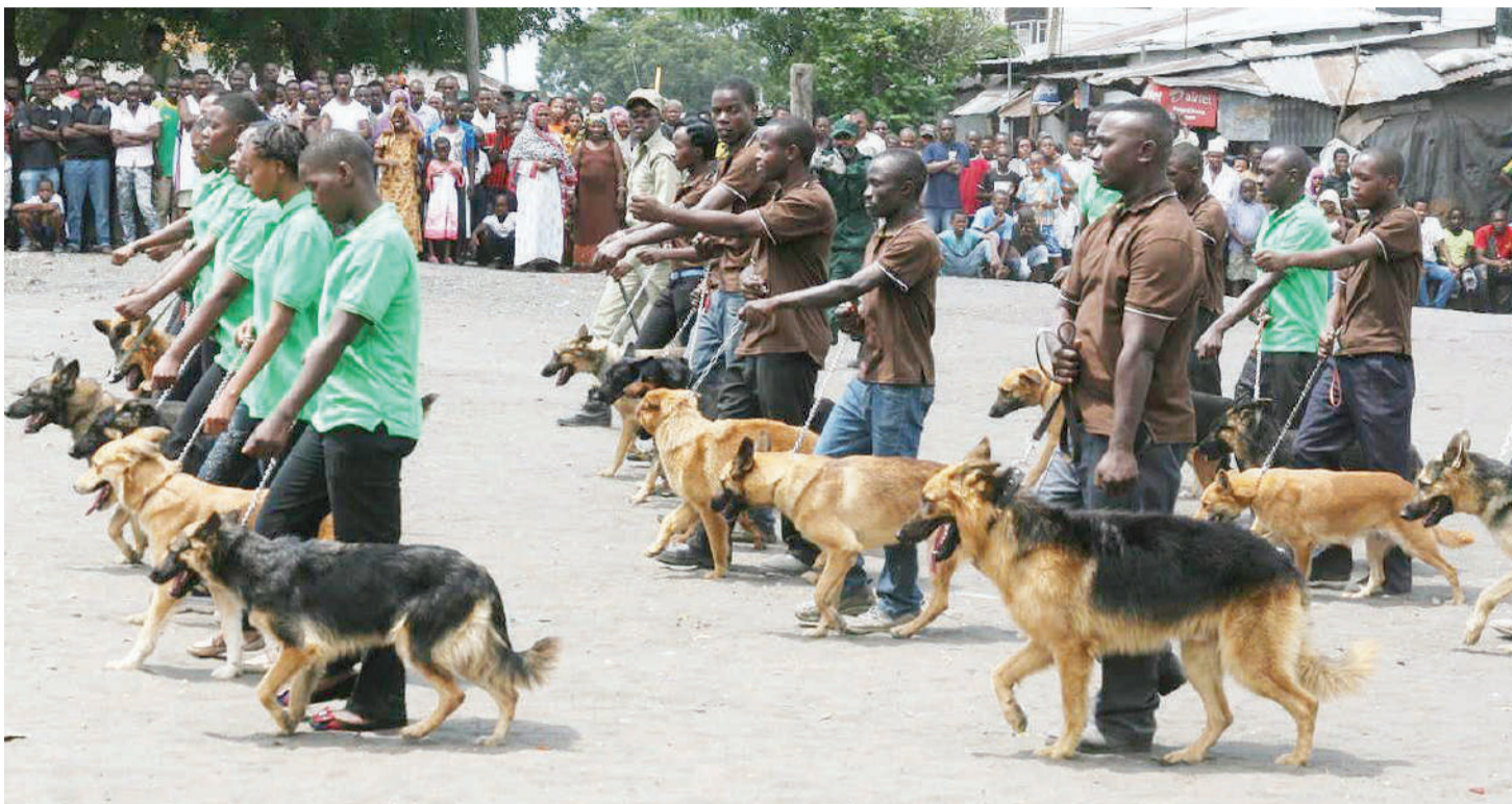
Ulinzi shirikishi kukabiliana na wahalifu usitegemee polisi na sungusungu hata wanyama kama mbwa maalumu wanaweza kutumiwa kukabiliana na maeneo yenye uhalifu sugu.