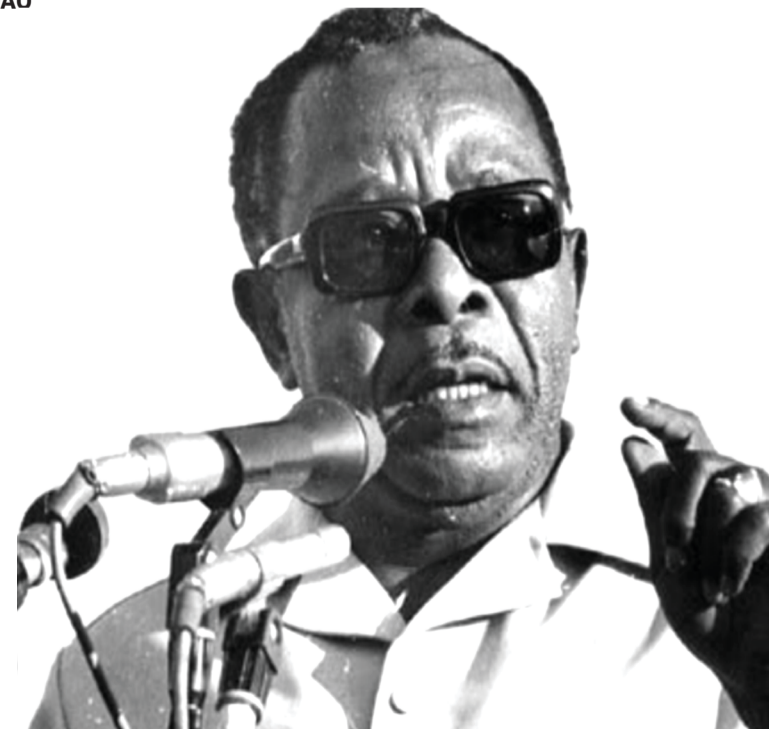
Rais wa pili wa Zanzibar, Aboud Jumbe.

• Watetezi wa serikali mbili walidai kwamba, muundo huu umekuwapo kwa miaka hamsini iliyopita. Matatizo mengi yaliyojitokeza yameweza kutatuliwa, na kero nyingi zimeondolewa. Wanadai kwamba, muundo wa serikali tatu utaleta mzozo mkubwa baina ya Serikali ya Tanganyika na Serikali ya Zanzibar katika suala la kuchangia fedha za kuendesha Serikali ya Muungano. Kwa kuwa Zanzibar haina uwezo wa kuchangia kiasi kikubwa, katika muundo wa serikali tatu, Tanganyika