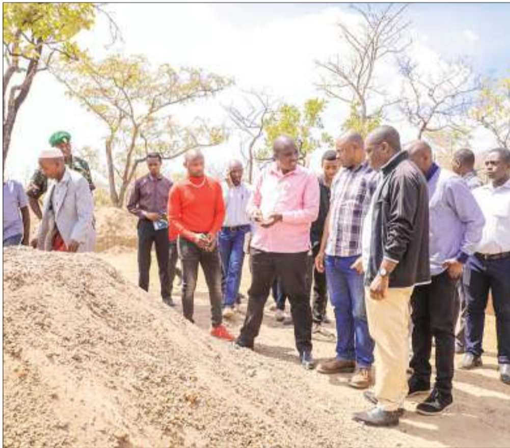
Waziri wa Madini, Dotto Biteko (wa tatu kulia), akiangalia mchanga wenye madini ya chuma katika eneo la Michiga, wilayani Nanyumbu, mkoani Mtwara juzi, akiwa katika ziara ya kukagua shughuli mbalimbali za sekta ya madini.