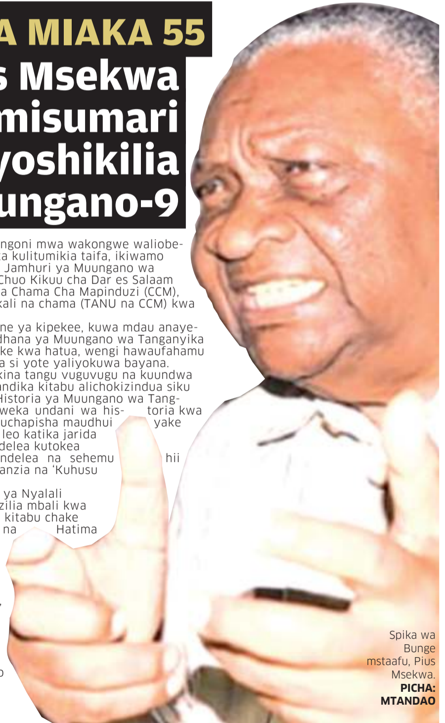
Spika wa Bunge mstaafu, Pius Msekwa.