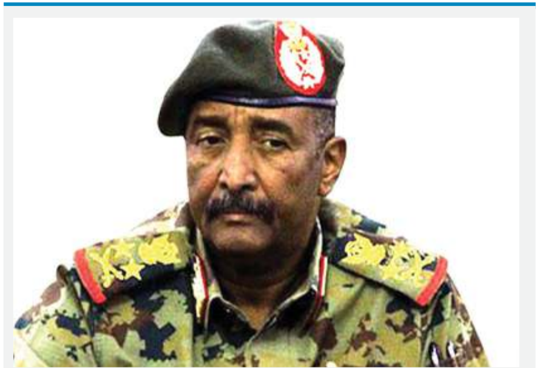
Kiongozi wa Baraza la Kijeshi Sudan, Jenerali Abdel Fattah al-Burhan.

Kwa uchambuzi wangu: Idadi ya serikali siyo kinga dhidi ya Muungano kuvunjika. Idadi yoyote ya serikali, (ziwe ni mbili au ni tatu) siyo kinga ya uhakika ya kuzuia Muungano usivunjike, kwani upo uzoefu wa nchi nyingine zilizowahi kuungana, lakini, muungano wao ukavunjika bila kusaba-