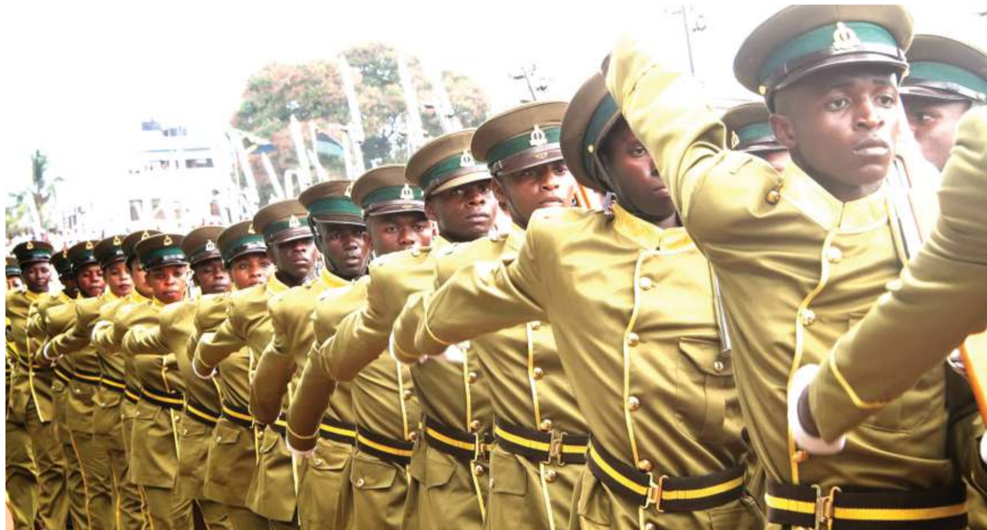
Moja ya manjonjo ya sherehe za Muungano wa Tanzania.

(iv) Kuhusu Madai ya Tume ya Jaji Kisanga Tume ya Mwalimu Nyerere hakupata nafasi ya kupinga pendekezo la serikali tatu ambalo lililolewa na Tume ya Jaji Kisanga, kwa sababu taarifa ya tume hiyo iliwasilishwa kwa Rais Benjamin Mkapa kwa barua iliyoandikwa tarehe 20 Agosti, 1999, wakati