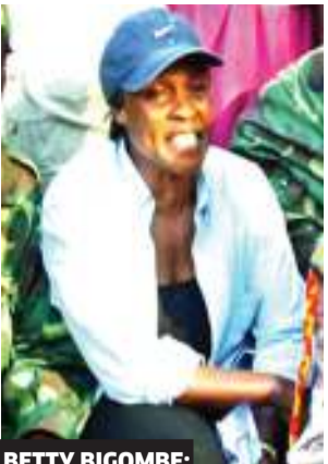
BETTY BIGOMBE; Mwanamke aliyemshawishi Kony kukutana na Museveni Uganda