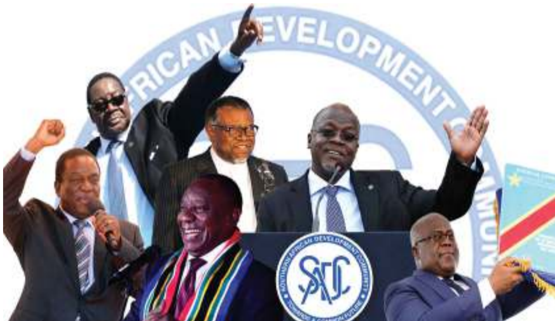
Baadhi ya marais wa nchi wanachama wa SADC, Rais Felix Tshisekedi wa DRC (wa kwanza kulia), Rais John Magufuli wa Tanzania (wa pili kulia), Rais Cyril Ramaphosa wa Afrika Kusini (mbele aliyekunja mikono), Rais Emerson Mnangagwa wa Zimbabwe (kushoto), Rais wa Malawi, Peter Mutharika (nyuma kushoto) na Rais wa Namibia Hage Geingob (katikati nyuma).

kuhusisha zaidi ongezeko la viwanda, akitoa mfano kwamba Tanzania imeanzisha viwanda takribani 4000 kwa kipindi cha miaka mitatu iliyopita.