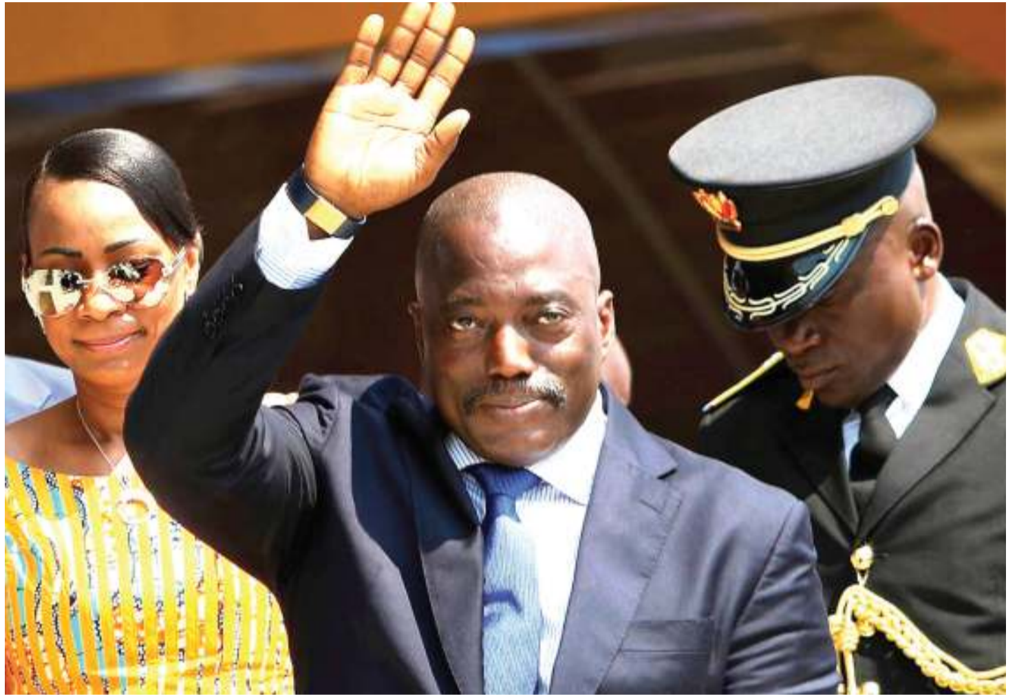
Rais wa zamani wa DRC, Joseph Kabila (aliyenyoosha mkono), anadaiwa kuchangia ucheleweshaji wa kuundwa kwa Baraza la Mawaziri nchini humo.

li, haitakuwa rahisi kupangua 'le systeme Kabila,' kama ambavyo inaitwa kwa Kifaransa.