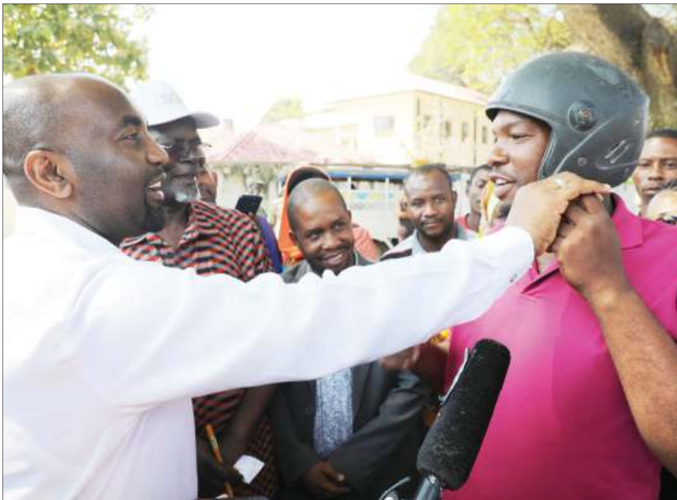
Naibu Waziri wa Mambo ya Ndani, ambaye pia ni Mwenyekiti wa Baraza la Taifa la Usalama Barabarani, Mhandisi Hamad Masauni (kushoto), akimwelekeza dereva bodaboda jinsi ya kufunga kofia ngumu, wakati wa utoaji wa elimu kwa madereva na watumiaji wa barabara, zoezi lililofanyika Visiwani Zanzibar jana, kwa lengo la kuwapeusha na ajali zinazoweza kuzuilika.

Hivi karibuni Baraza la Mitihani la Taifa (Necta) lilitangaza matokeo ya kidato cha sita na katika matokeo hayo, Zanzibar ilitoa shule tano za mwisho zinazoshika mkia.