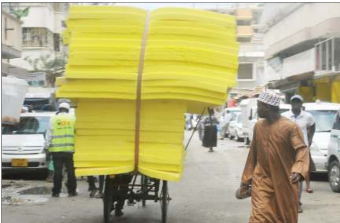
Mwendesha guta akiwa amelisheni vipande vya magodoro katika Mtaa wa Nyamwezi eneo la Kariakoo, jijini Dar es Salaam jana, na kumfanya ashindwe kuona nyuma kitendo ambacho ni hatari kwa usalama barabarani.