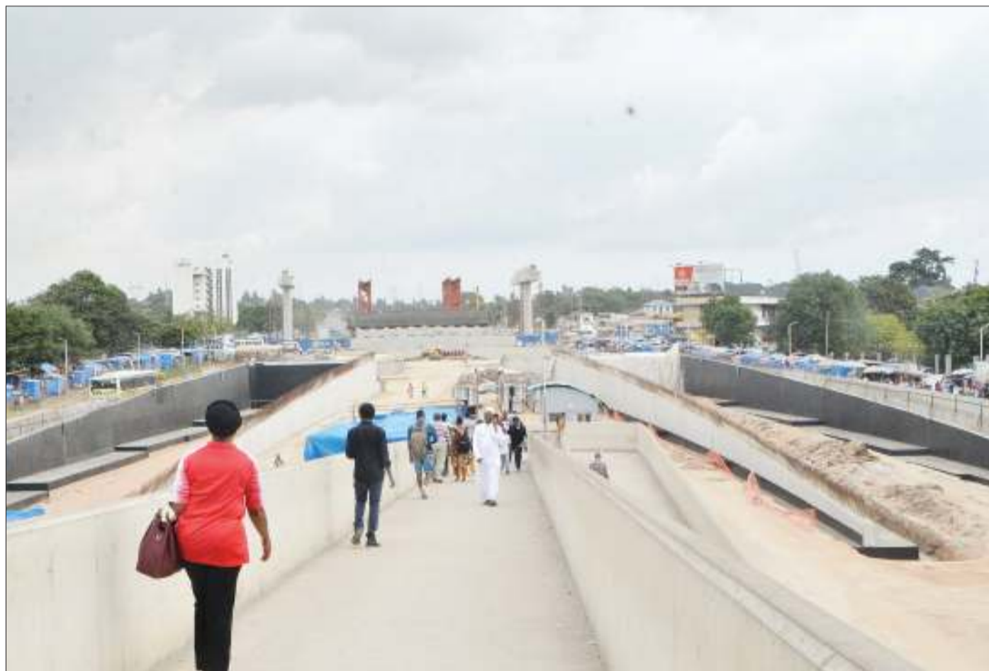
Mwonekana wa sehemu ya ujenzi unaoendelea wa barabara za mpishano (Ubungo Interchange), katika eneo la mataa ya Ubungo, jijini Dar es Salaam jana.

Ziwa hilo lililoko katika Kijiji Malowa, lina ukubwa wa hekta 421, huku utafiti mbalimbali wa kitaalamu ukieleza chanzo chake ni kimetokana na mlipuko wa volkano uliosababisha ardhi kudidimia na hatimaye kuwa na bonde kubwa la maji yakitokea chini kwa chini kwenye miamba.