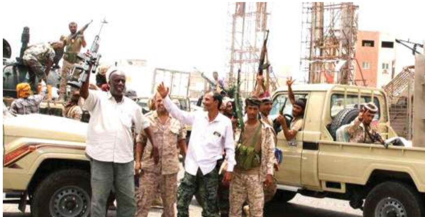
Wapiganaji wa jeshi lililojitenga linalosaidiwa na Umoja wa Falme za Kiarabu wakiwa mjini Aden baada ya mapambano na vikosi vya serikali.

Hata hivyo, majaribio ya kupambana na mlipuko wa sasa yamekuwa magumu, kutokana na kuwapo kwa makundi ya wanamgambo na mashaka kuhusu misaada wa tiba kutoka nchi za kigeni. BBC