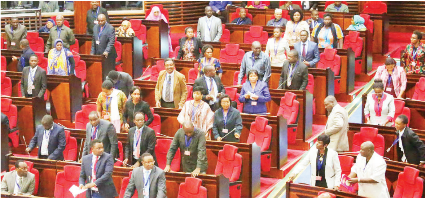
Wabunge wakiwa kazini.