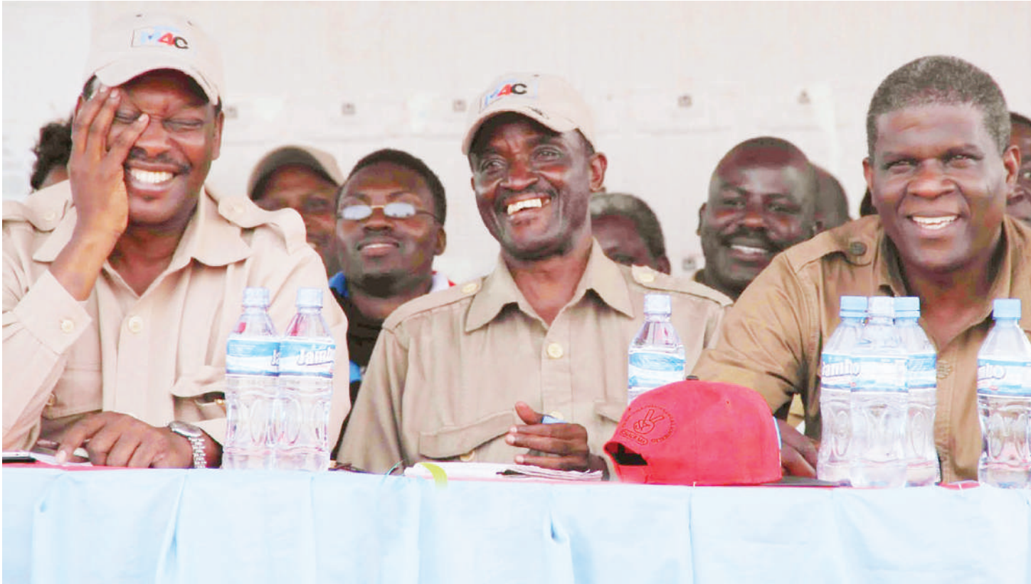
Lwakatare katika mikutano ya ya chama chake cha zamani kabla ya kuikimbia Chadema.