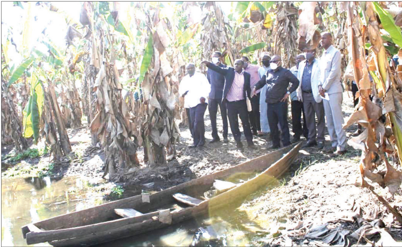
Katibu Mkuu Wizara ya Maji, Prof. Kitila Mkumbo (wa tatu kulia), baada ya kuwasili katika Kijiji cha Kyaka, kwenye eneo litakalojengwa chanzo cha maji cha Mradi wa Kyaka Bunazi, wakati wa hafla ya uzinduzi wa ujenzi wa mradi huo, wilayani Missenyi, mkoani Kagera juzi.