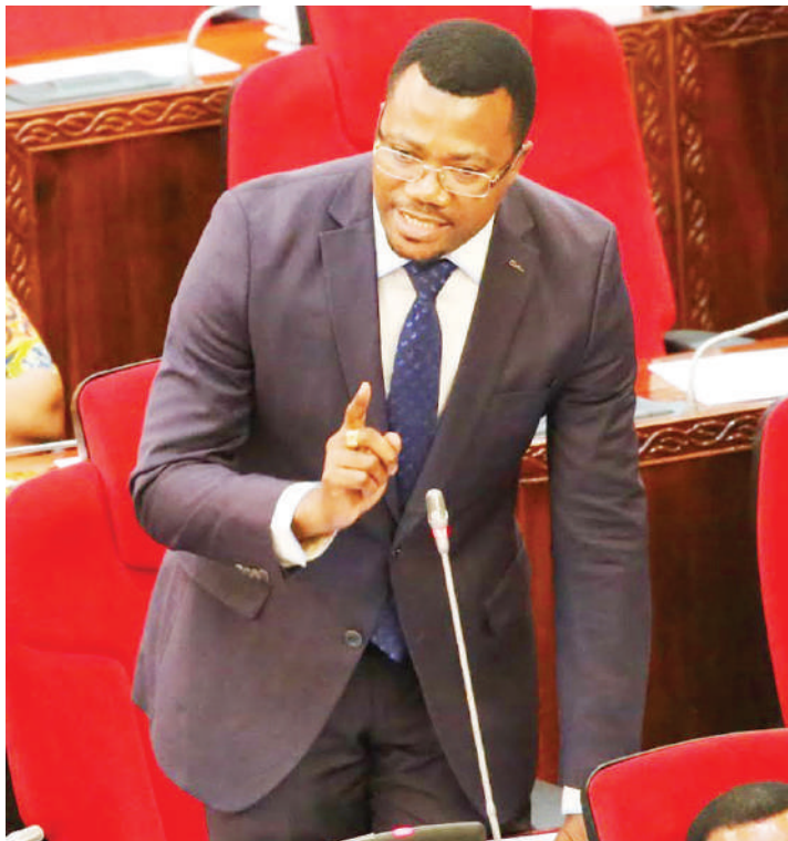
Waziri wa Mifugo na Uvuvi, Luhaga Mpina, akijibu hoja na kutoa ufafanuzi bungeni.

Majukumu ya DPP yapo kikatiba na hayaingiliwi na mtu yeyote, anapokata rufani anakuwa na sababu ya kufanya hivyo, inaweze kana kuna kutafsiriwa vibaya kwa sheria.