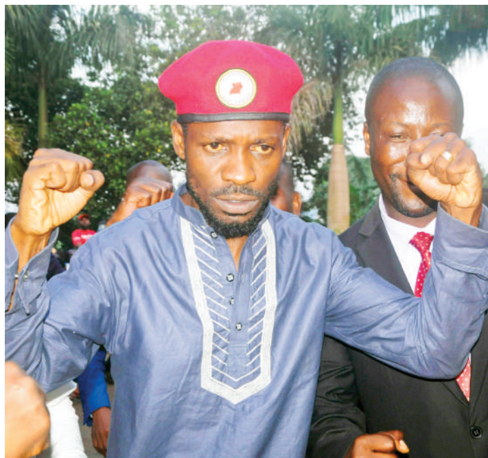
Bobi Wine, mwanamuziki na mwanasiasa matata nchini Uganda, aliyetangaza kugombea urais mwakani.

Chama chake cha National Resistance Movement (NRM) kilitalwala Uganda kama taifa la chama kimoja hadi kura ya maamuzi ilipofanyika 2005 na kurejesha mfumo wa vyama vingi.