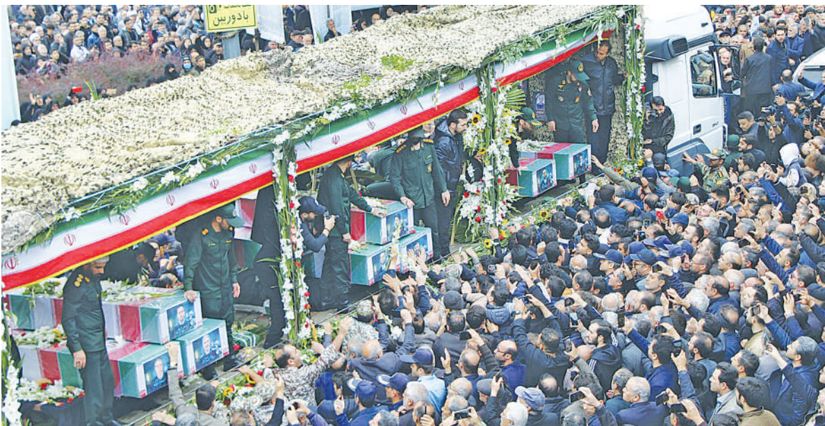
Gari lilobeba jeneza la aliyekuwa rais wa Iran, Ebrahim Raisi na viongozi wengine likipita mbele ya umati wa watu kwa ajili ya kuaga katikati ya jiji la Tehran jana.