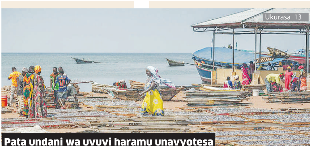
Pata undani wa uvuvi haramu unavyotesa uchumi buluu kustawi Afrika Mashariki