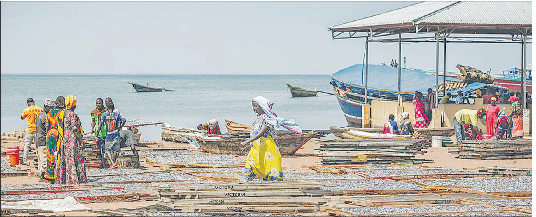
Samaki wakikaushwa kwa jua kwenye eneo la mwaloni Kigoma, Tanzania, ikiwa ni sehemu ya uchumi wa buluu.

• Simulizi; ikolojia inavyobomoka, uharamia baharini