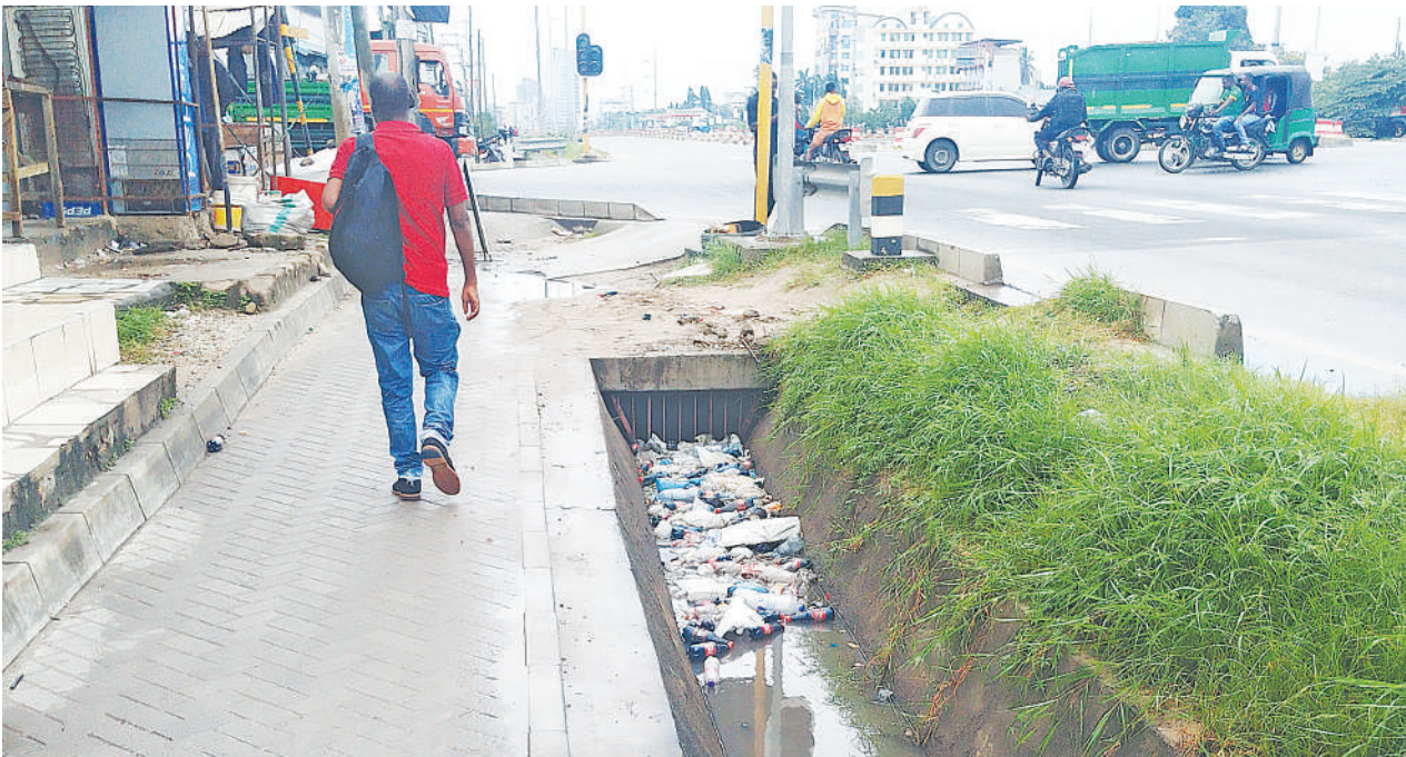
Takataka za chupa tupu za plastiki zikiwa zimetupwa kwenye mtaro wa maji ya mvua kando ya Barabara ya Bagamoyo, eneo la mataa ya kona ya ITV Mwenge, Manispaa ya Kinondoni, Dar es Salaam jana. Baadhi ya mamalishe na wafanyabiashara wa maduka wa eneo hilo, wanao wajibu wa kuufanyia usafi mtaro huo kutokana na kuwa taka hizo zinatumwa na wateja wa bidhaa wanazozuia.

“Kampuni yetu inatoa shukrani zake kwa wadau wote ambao wamechangia kufanikisha ushirikiano huu. Tunapoen-delea mbele, tumejipanga kufanya kazi pamoja kulinda usalama wa chakula wa taifa na kuwaunga mkono wakulima na wafugaji wenye bidii ambao ni uti wa mgongo wa uchumi wetu,” aliongeza.