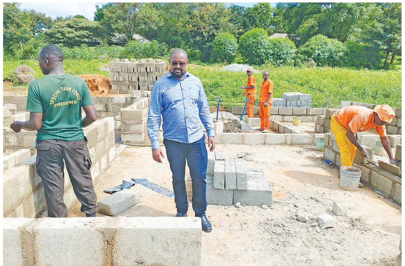
Mbunge wa Jimbo la Moshi Mjini, Priscus Tarimo (wa pili kushoto), akikagua maendeleo ya ujenzi wa kituo cha polisi katika kata ya Karanga, Manispaa ya Moshi, mkoani Kilimanjaro mwishoni mwa wiki, kinachojengwa kwa nguvu za wananchi.

Ujenzi wa kituo hicho ulianza Mei 18 mwaka 2024 na utagharimu cha Sh. bilioni 1.6 hadi kukamilika kwake.