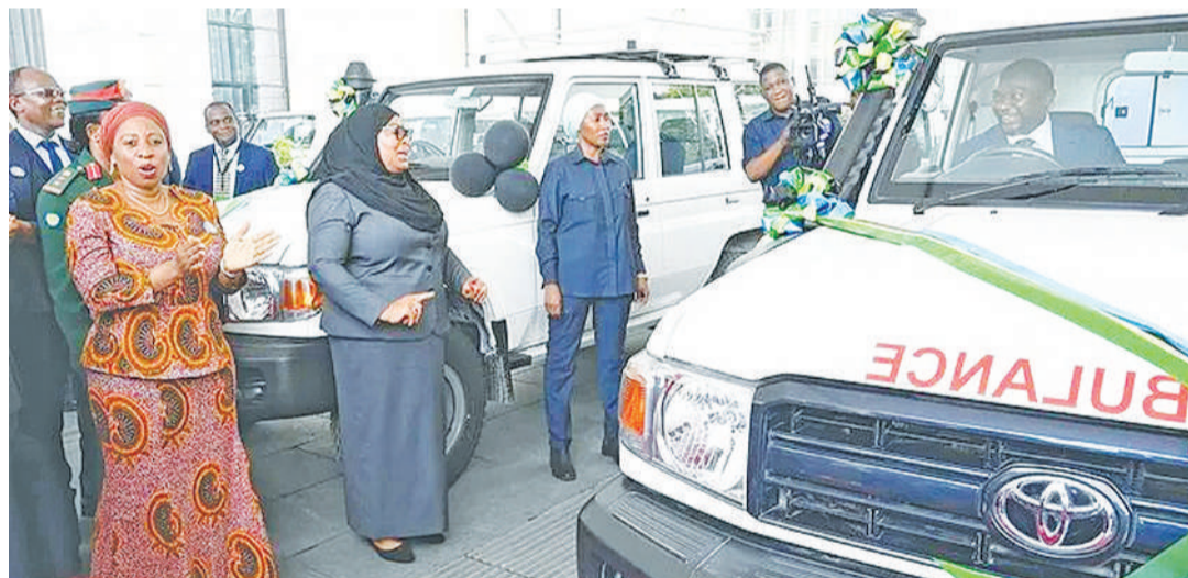
Rais Samia akizindua magari ya kubeba wagonjwa, katika hafla iliyofanyika, Dar es Salaam Oktoba, 2023.

Pia, ni hali inayofanya hata alipojikita katika mamlaka ya kisiasa, huwa habaki mbali na mambo hayo; leo akiwa mkuu wa nchi ni adimu sana kumkuta ziara na matendo yake yako mbali na sekta za afya, maendeleo ya watoto na