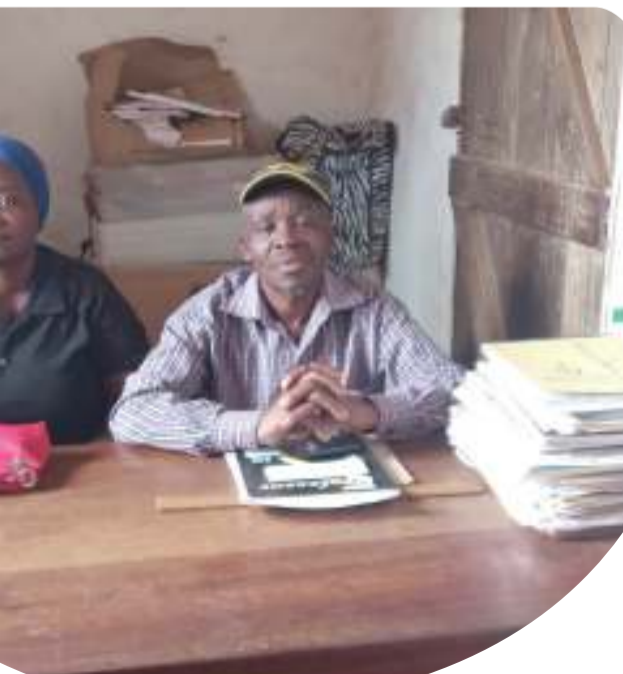
Viongozi wa Serikali ya Kijiji cha Mpale wakiwa ofisini kwao

onyesha hali ya usambazaji umeme, kijini Mpale, Ko-017.