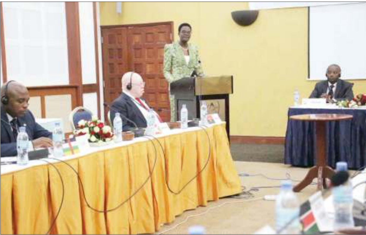
Naibu Spika wa Bunge, Dk. Tulia Ackson, akifungua Kikao cha Tano cha Kamati ya Demokrasia na Utawala cha Baraza la Wabunge wa Mabunge ya Jumuiya ya nchi za Maziwa Makuu (FP-ICGLR) jijini Arusha jana.