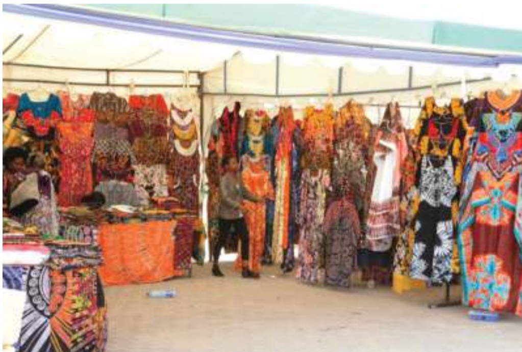
Kinamama wajasiriamali wakiwa kazini, kutekeleza ajenda ya mkutano wa Beijing, China.

“ Katika kipindi hicho cha miaka 25 ya Beijing tut-aona hali ikoje na mabadiliko yaliyopatikana, yatajulikana kutokana na kutimia miaka 25,”