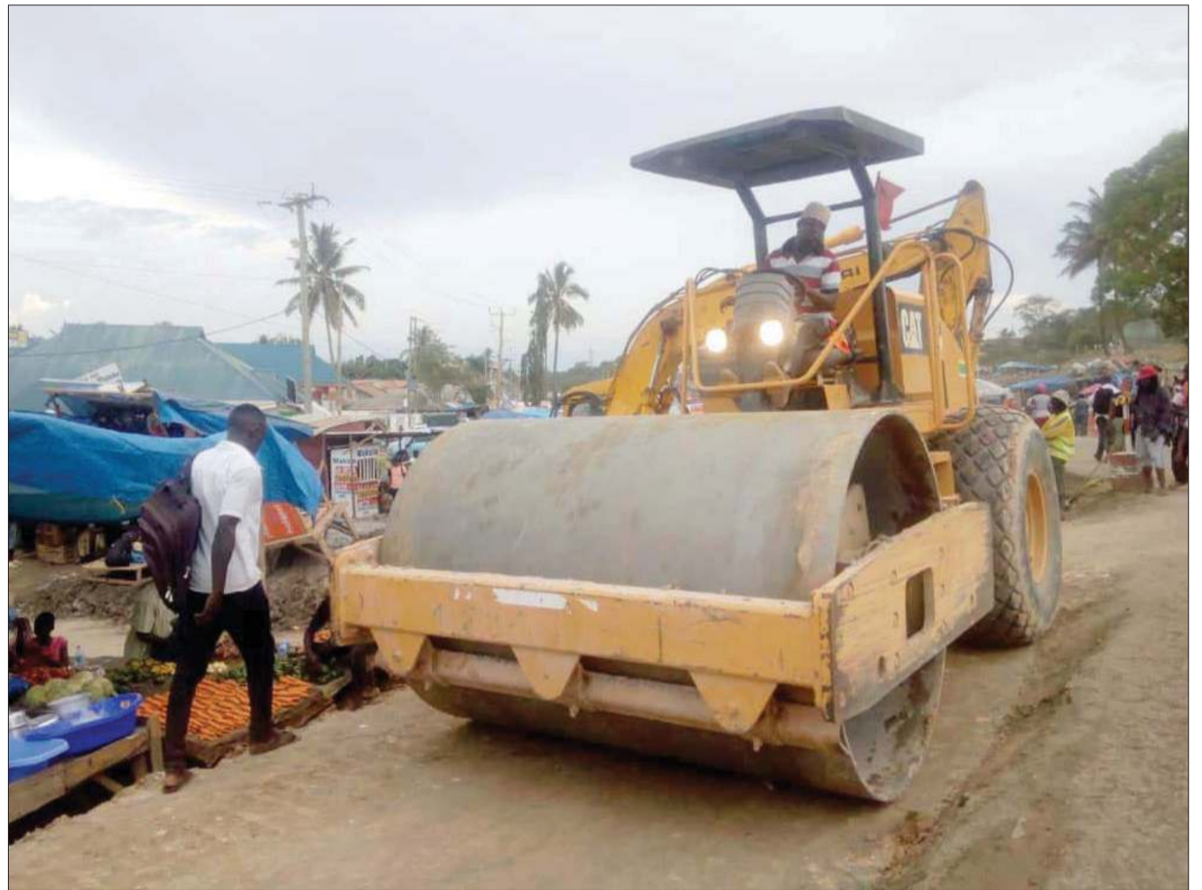
Kazi ya ujenzi wa barabara ikiendelea Mbezi Mwisho, jijini Dar es Salaam juzi. Hata hivyo, wafanyabiashara wadogo wa eneo hilo wamekuwa wakikumbana na changamoto ya kuhamishwa kupisha ujenzi huo.

Mloya alisema maendeleo makubwa yanaletwa na utalii na ndio maana wameamua kusimamia raia wasio wema kuacha vitendo vya ujangili.