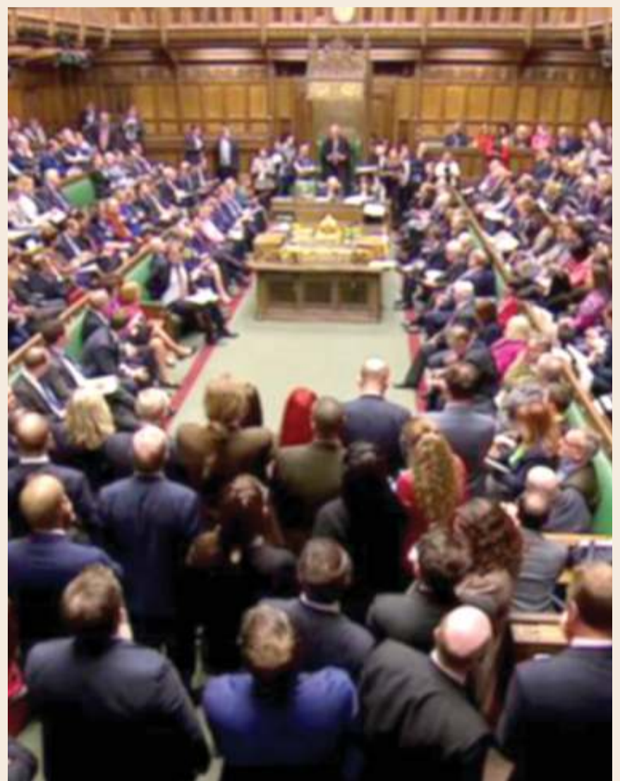
Wabunge wakiwa katika mjadala juu.

Dk. Bayabato anataja baadhi ya mifano ya mbadala huo majumbani, ni kutafuta kuni, kuchota maji na kutafuta mafuta ya taa.