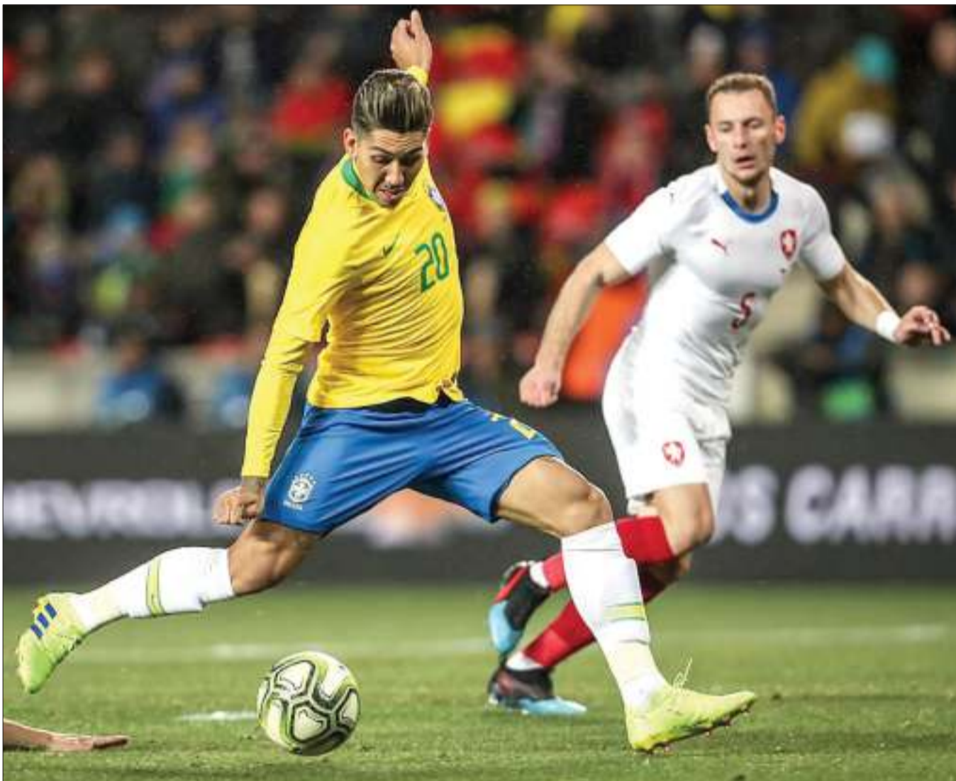
Straika wa Brazil, Roberto Firmino ambaye anaichezea Liverpool akijiandaa kupiga shuti katika mechi ya kirafiki dhidi ya wenzao wa Jamhuri ya Czech iliyochezwa mapema wiki hii. Brazil ilishinda mabao 3-1.