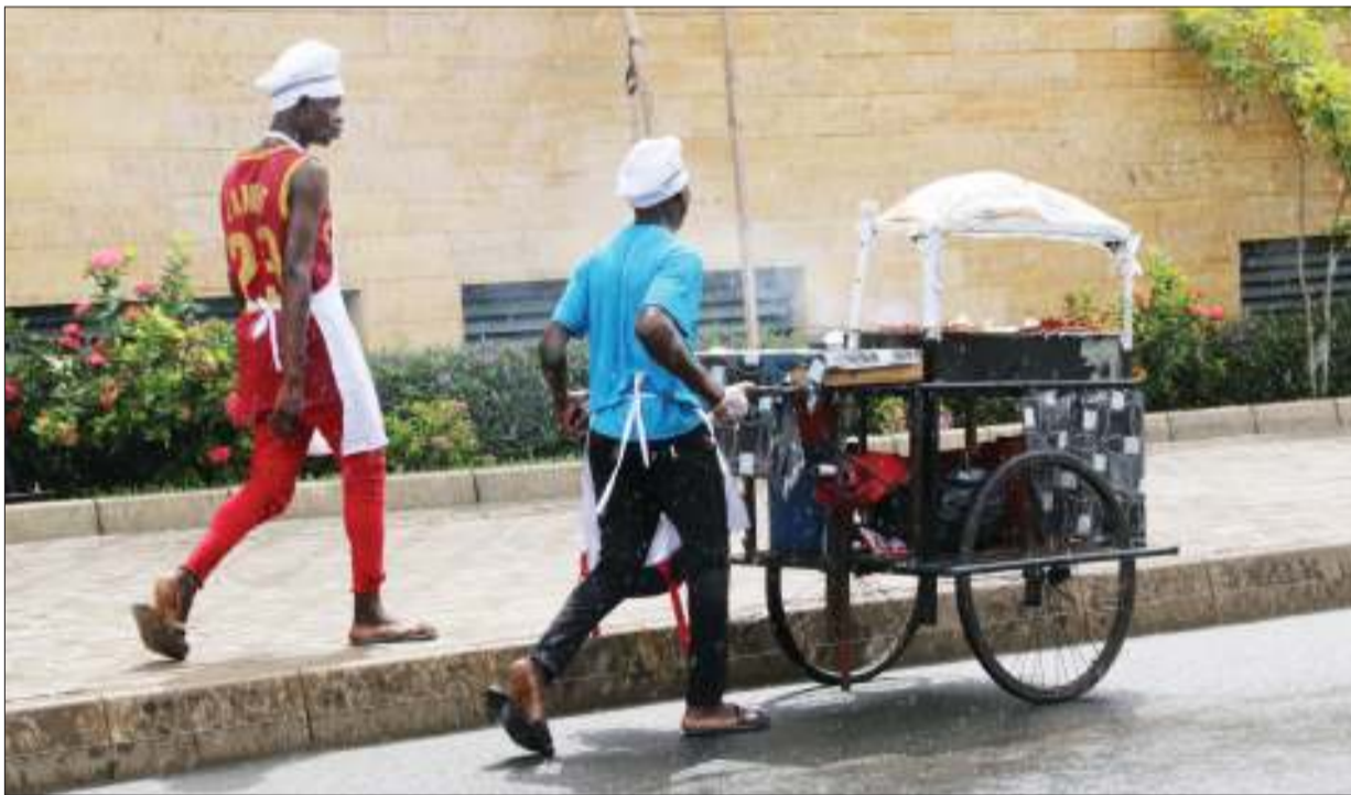
Vijana walioji-ajiri kwa kubuni jiko linalotembea la kuchoma mishikaki na vitu mbalimbali wakiwa katika mawindo ya wateja Barabara ya Morogoro eneo la Mnazi Mmoja jijini Dar es Salaam jana.

Alisema Mbeya-WSSA, inategemea ankra ya maji kwa ajili ya kijiendesha ikiwa ni pamoja na kuboresha miundombinu, kusambaza mtandao wa maji, kutibu maji pamoja na mishahara ya watumishi na uendeshaji wa ofisi, hivyo kutolipa ankra ni kuikwamisha mamlaka hiyo.