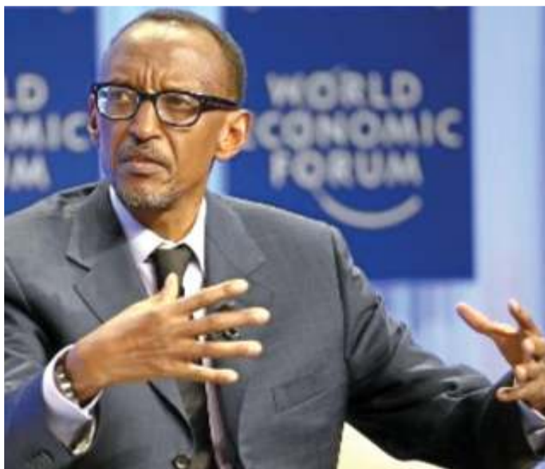
Rais Paul Kagame, akizungumza kwenye kongamano hilo

“Vilevile kuna mamilioni ya lita za maziwa yaliyokuwa yakisafirishwa kutoka Rwanda kuelekea nchini Kenya kwenye viwanda vya Kenya hayo yali-zuiliwa pia kwa miezi hadi yakaharibika”