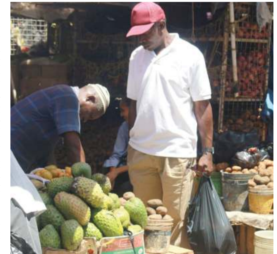
Mfanyabiashara wa matunda akimuzia mteja wake katika soko la Kariakoo, jijini Dar es Salaam jana.