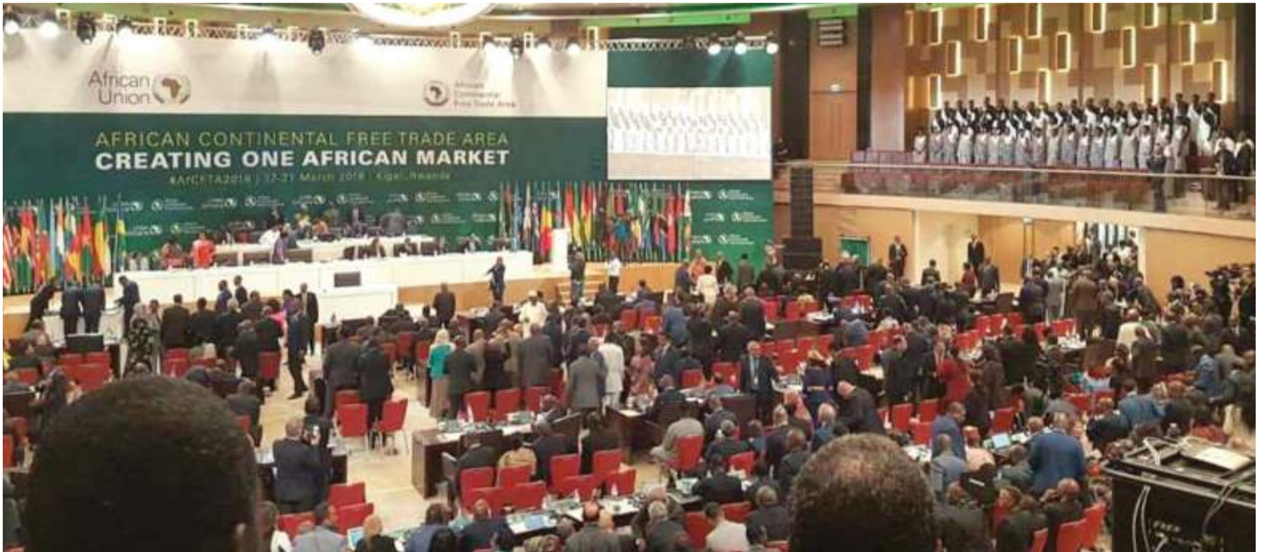
Mkutano wa biashara Afrika, mwaka jana jijini Kigali, Rwanda.