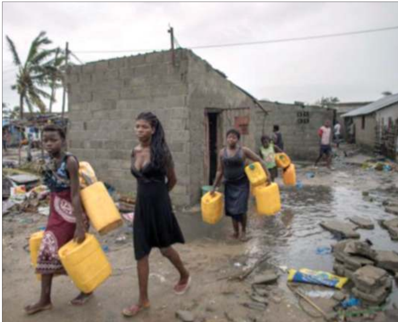
Wakazi wa kijiji cha Praia Nova, nchini Msumbiji wakiendelea na shughuli zao, kwa sasa wakazi hao wamerejea katika makazi yao baada ya kimbunga Idai kuikumba nchi hiyo.

Katika taarifa iliyotolewa kwa waandishi wa habari jana, Boeing ilisema kuwa kubadilishwa kwa mfumo wa usalama wa ndege zake hakumaanishi kukiri kuwa mfumo ulikuwapo ulisababisha ajali. BBC