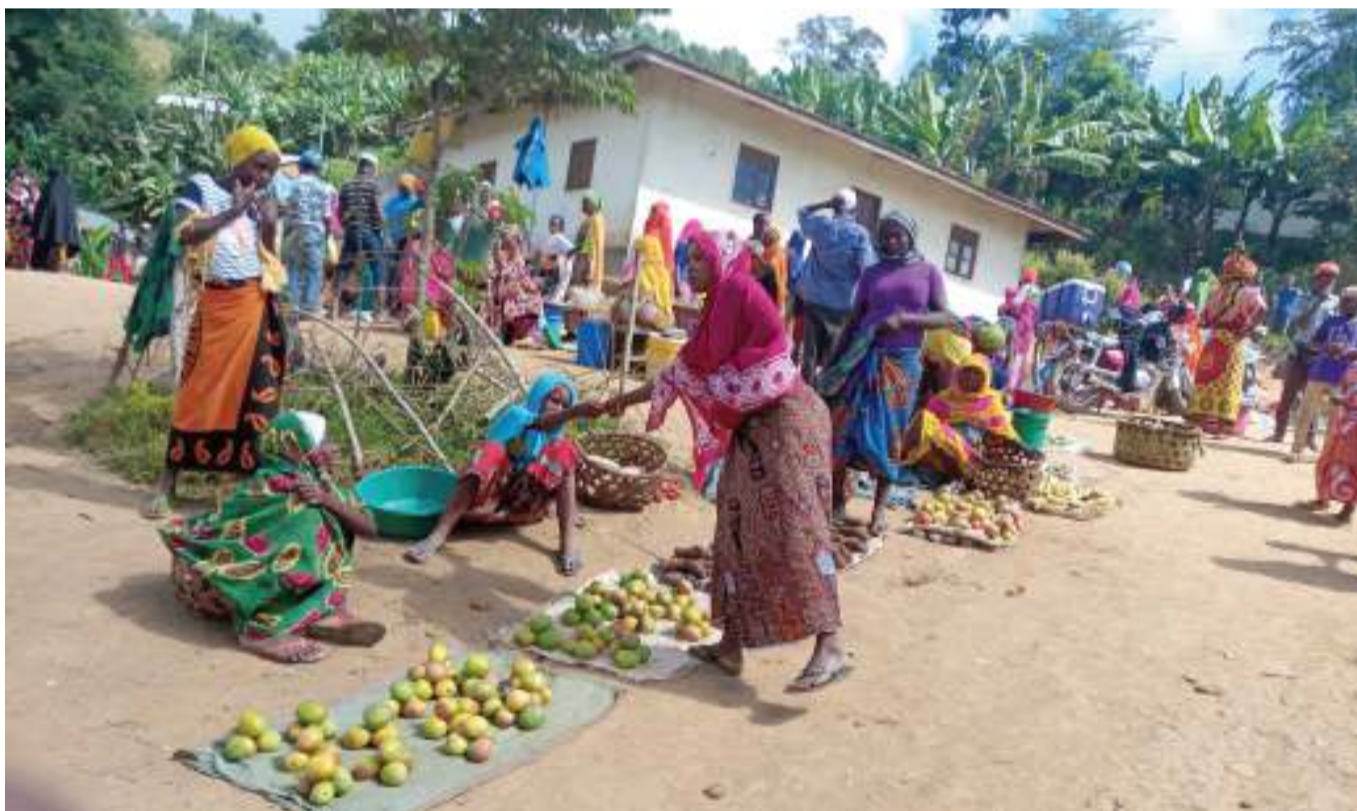
Kinamama wa kijijini Mpale, Korogwe wakiwa sokoni. Kwa sasa ni wahitaji wakubwa wa huduma rasmi ya umeme.