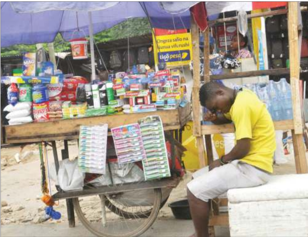
Mfanyabiashara mdogo maarufu kama Machinga, akijipumzisha wakati akisubiri wateja katika eneo la Ilala Mchikichini, jijini Dar es Salaam jana.