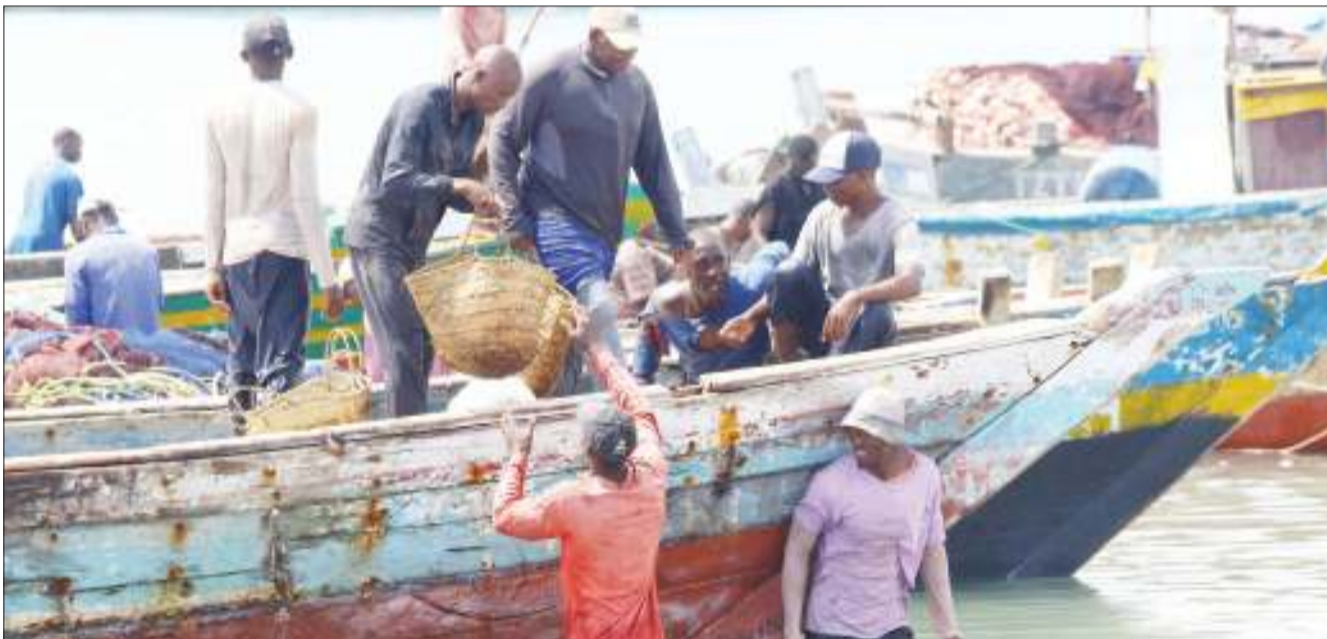
Wabeba mizigo katika Soko la Feri jijini Dar es Salaam, wakipokea vikapu vya samaki kwa ajili ya kupeleka mnadani katika soko hilo.