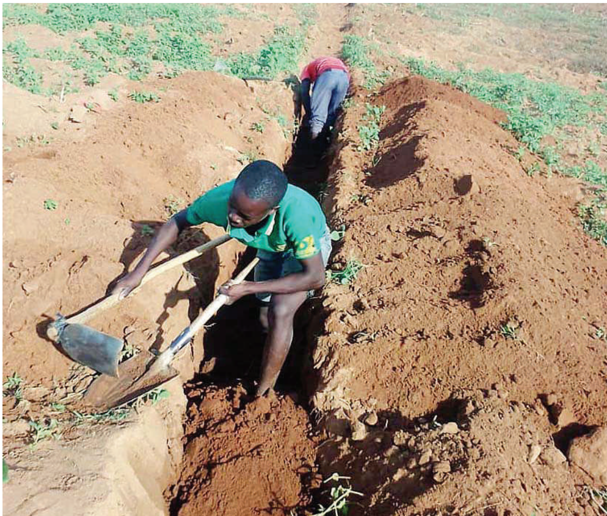
Mafundi wakichimba mtaro kwa ajili ya kuweka mabomba ya kusambazia maji kutoka Ziwa Victoria kwenda vijiji vya Bwasi, Bugunda na Kome, Musoma Vijijini mkoani Mara, mwishoni mwa wiki.

Vikosi vya FIB vipo nchini Jamhuri ya Kidemkrasia ya Congo (DRC), kwa kushirikiana na vile vya kutunza amani vya Umoja wa Mataifa (UN), huku mkutano ukiweka kipaumbele ajenda ya usalama kwenye ukanda huo, hasa eneo la Mashariki mwa DRK.