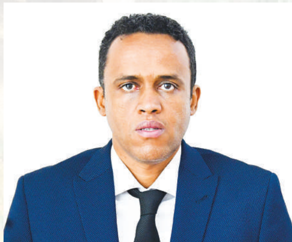
Mhe. Hussein Mohammed Bashe (Mb) Waziri wa Kilimo