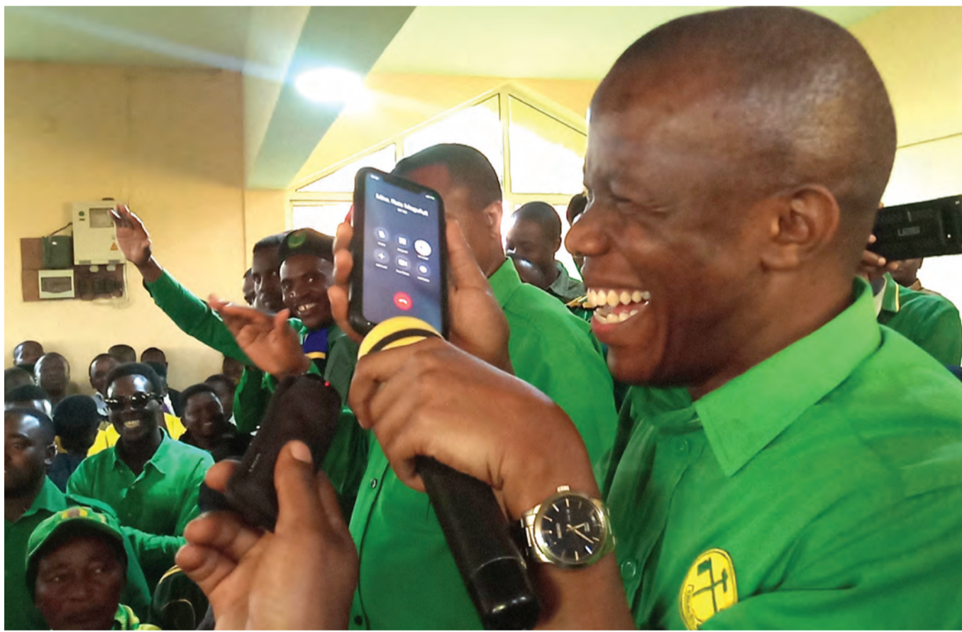
Katibu wa Itikadi na Uenezi wa CCM Taifa, Humphrey Polepole, akipokea simu ya Mwenyekiti wa CCM Taifa, Rais John Magufuli juzi, wakati akizungumza na wanafunzi wa vyoo vikuu mkoani Iringa. Habari Uk. 3.