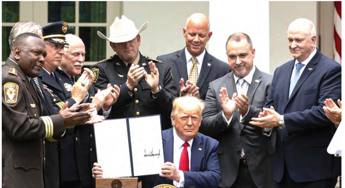
Rais wa Marekani, Donald Trump, akionesha sheria mpya aliyosaini inayowahusu polisi kutenda kazi vizuri.