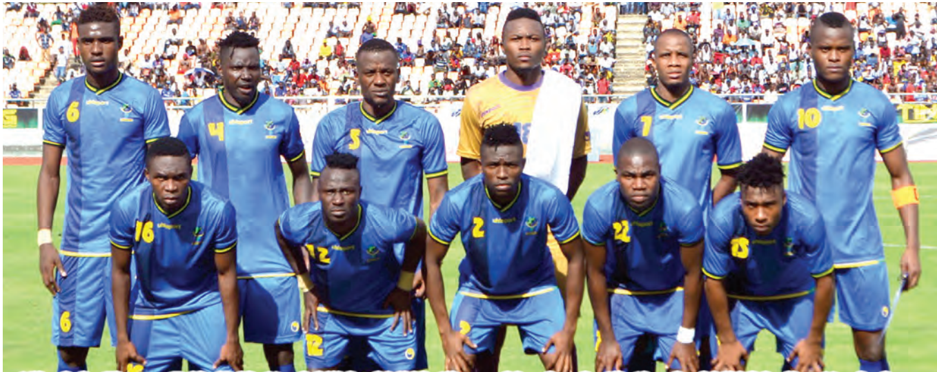
Kikosi cha Timu ya Taifa (Taifa Stars), kilichoshiriki katika mechi za kusaka tiketi ya kushiriki fainali za Kombe la Mataifa ya Afrika mwaka jana (AFCON 2019), ndani ya uongozi wa miaka mitano ya Rais John Pombe Magufuli.