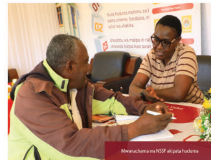
Mwanachama wa NSSF akipata huduma

kwa hali na mwajiri ameridhia na amempa barua ya kustaafu.