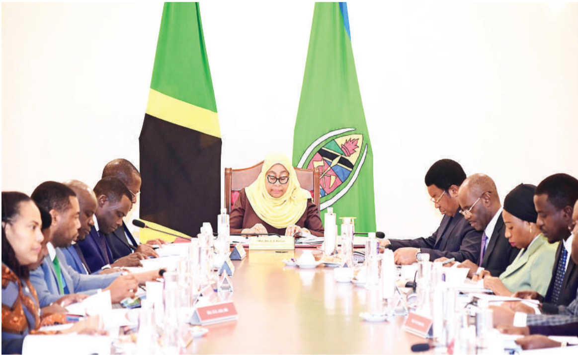
Rais Samia Suluhu Hassan, akiongoza Kikao cha Baraza la Mawaziri katika Ikulu Chamwino, mkoani Dodoma jana.