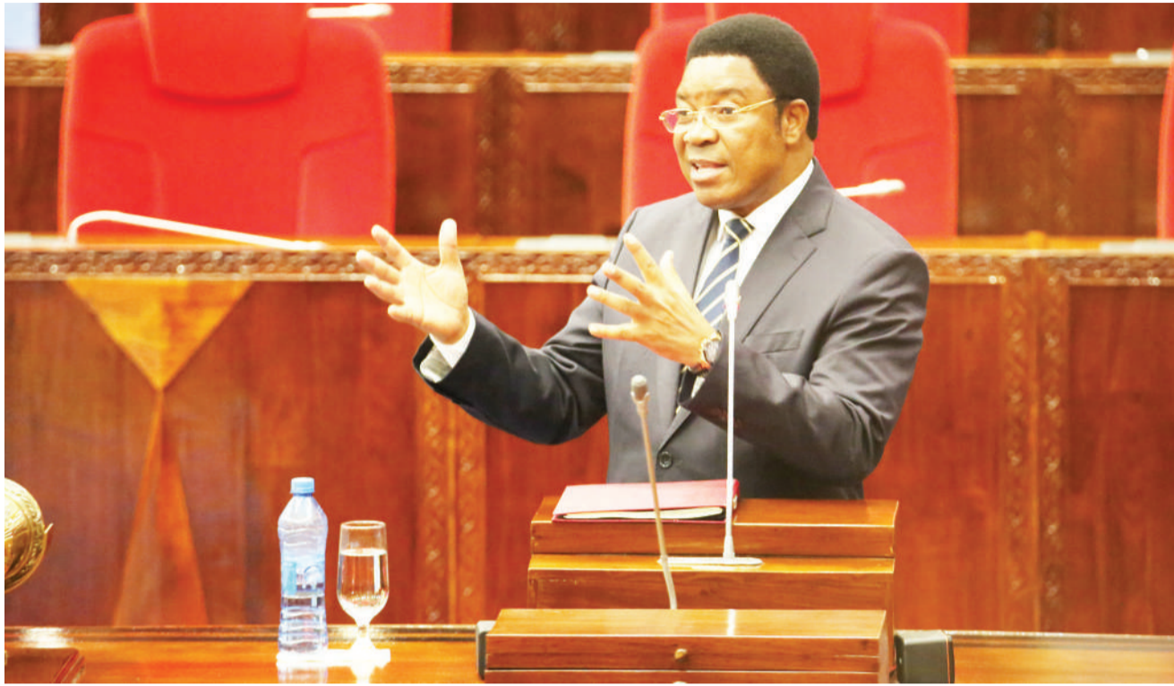
Waziri Mkuu Kassim Majaliwa akijibu maswali yaliyoulizwa na baadhi ya Wabunge kwenye kipindi cha maswali kwa Waziri Mkuu, Bungeni jijini Dodoma jana.