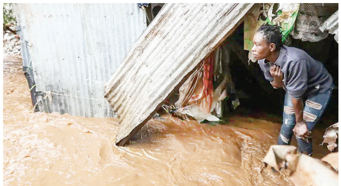
Raia wa jiji la Nairobi akikabiliana na mafuriko baada ya mvua nyingi kunyeshwa nchini Kenya katika siku za hivi karibuni.

Vita vya Gaza vilianza Oktoba 7, mwaka juji baada ya watu wenye silaha wakiongozwa na Hamas kufanya sham-bulio ambalo halijawahi kushuhudiwa kusini mwa Israel tarehe 7 Oktoba, na kuua watu 1,200, na kuwashikilia mateka 253. BBC