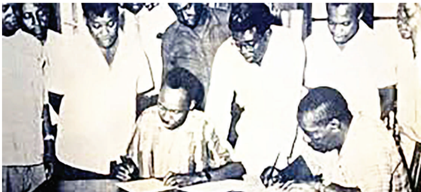
Mwalimu Julius Nyerere na Mzee Abeid Aman Karume, wakitia saini hati za Muungano.

Anataja zao la ushirikishwaji wa Zanzibar, umeleta mageuzi yatokanayo na marekebisho makubwa Kimuungano, pia mazungumzo kuhusu Zanzibar na ushirikishwaji wake katika masuala ya mikopo kutoka taasisi za fedha za kimataifa,