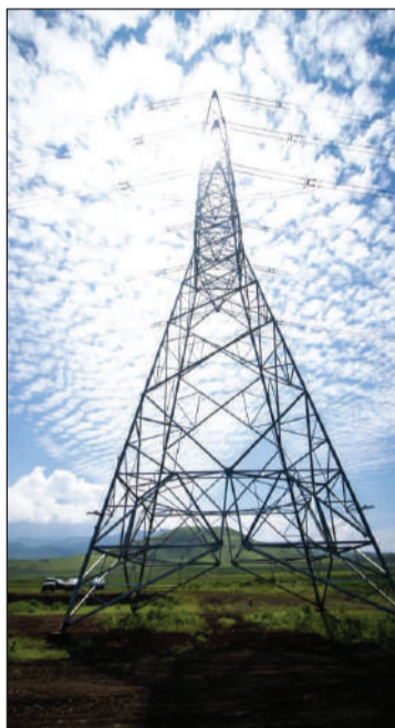
Sample ya laini ya msongo wa Kilovoti 220.