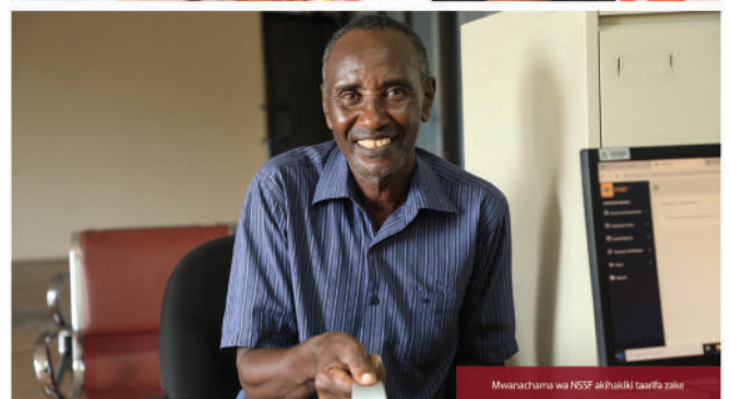
Mwanachama wa NSSF akipata taarifa zake