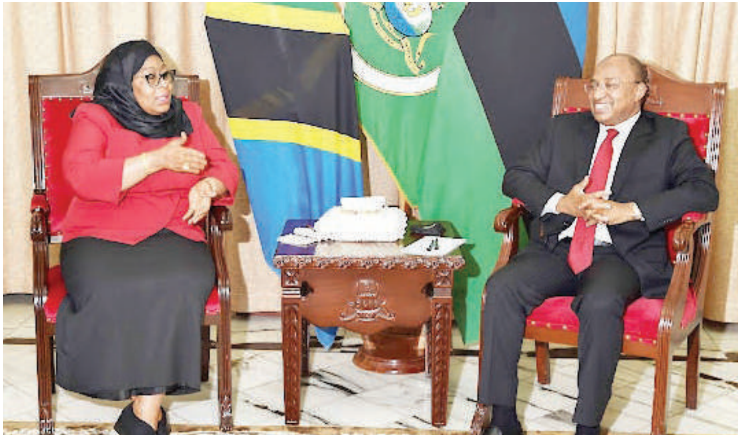
Rais Samia Suluhu Hassan, akiwa na mwenyeji wake, Dk. Hussein Mwinyi, Rais wa Serkali ya Mapinduzi Zanzibar, Ikulu ya Zanzibar.