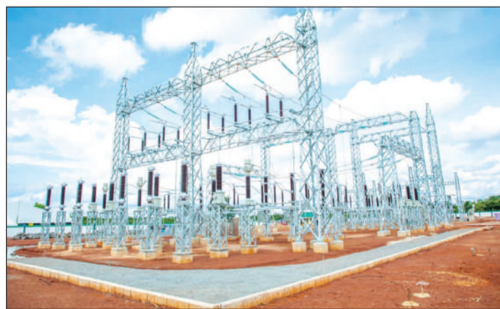
Kituo cha kupoza na kusambaza umeme.

Mradi huu unafadhiliwa na Benki ya Maendeleo ya Afrika (AfDB) kupitia Serikali ya Jamhuri ya Muungano wa Tanzania.