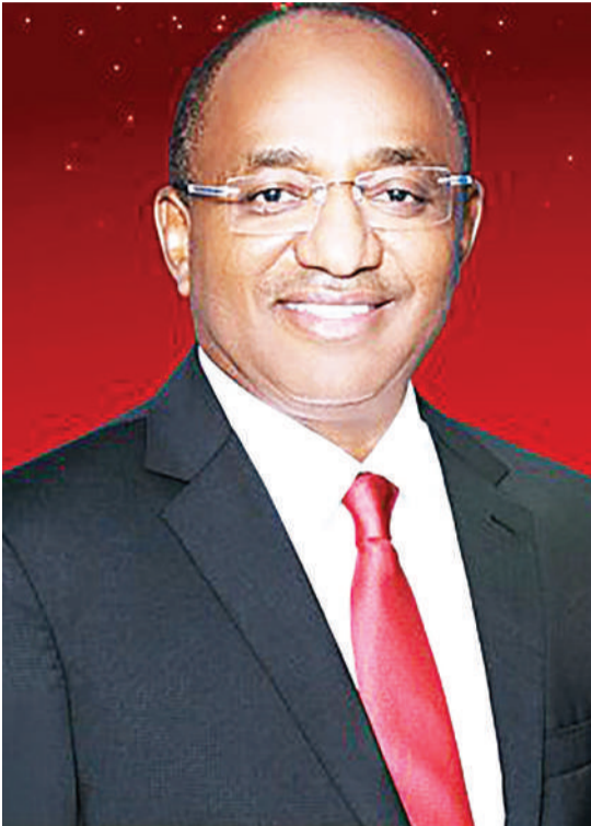
Rais wa Zanzibar, Dk. Hussein Ali Mwinyi