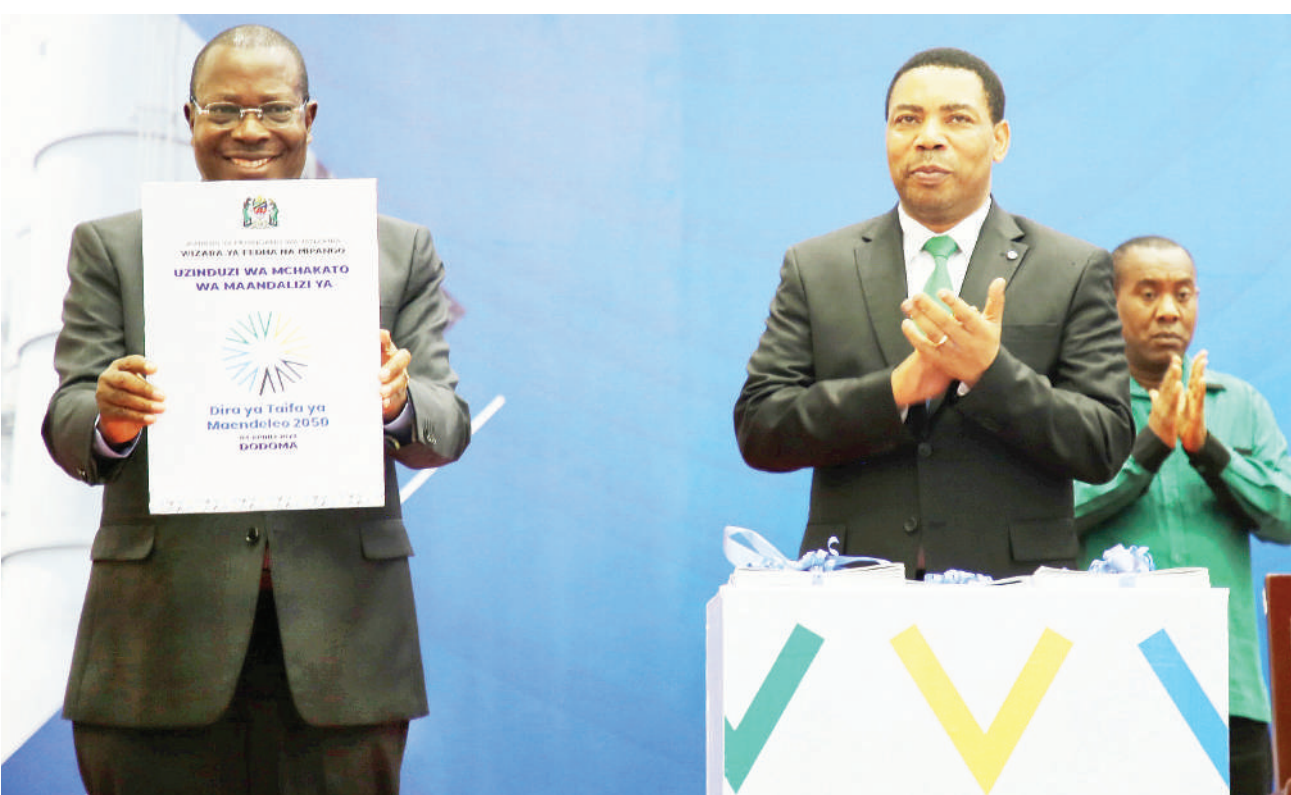
Makamu wa Rais, Dk. Philip Mpango, akionyesha kitabu chenye mchakato wa maandalizi ya Dira ya Taifa ya Maendeleo 2050, baada ya kuuzindua jijini Dodoma jana. Kulia ni Waziri wa Fedha na Mipango, Dk. Mwigulu Nchemba.

Mpango akiri Tanzania kukabiliwa tatizo la ajira UKURASA 3