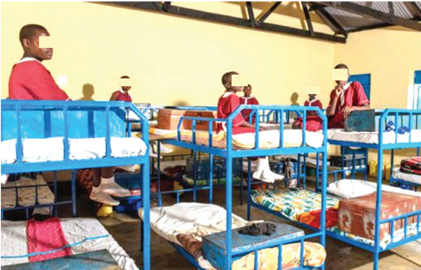
Wanafunzi wa umri mdogo wakiwa bweni.

W anaoagiza watoto wasikae bweni mpaka darasa la saba isipokuwa wakienda kidato cha kwanza ndio waruhusiwe ushauri unapokelewa na wadau wa elimu kwa udhati.