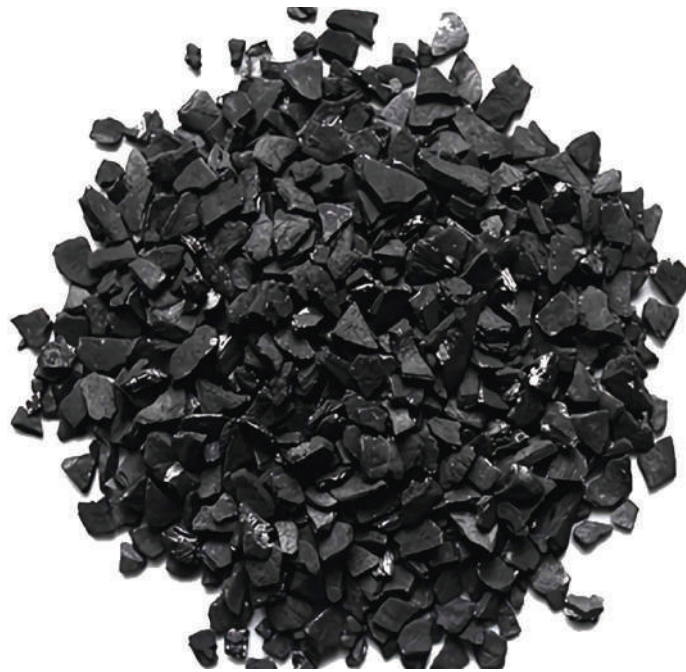
Kabon au mkaa unaotengenezwa na vifuu unaosafisha dhahabu.

"Nimebokea kutengeneza kabon au mkaa unaotumika kuchenjua dhahabu kusafisha maji taka, ninabadilisha kifuu cha nazi kwenda kwenye kabon ambayo kwenye