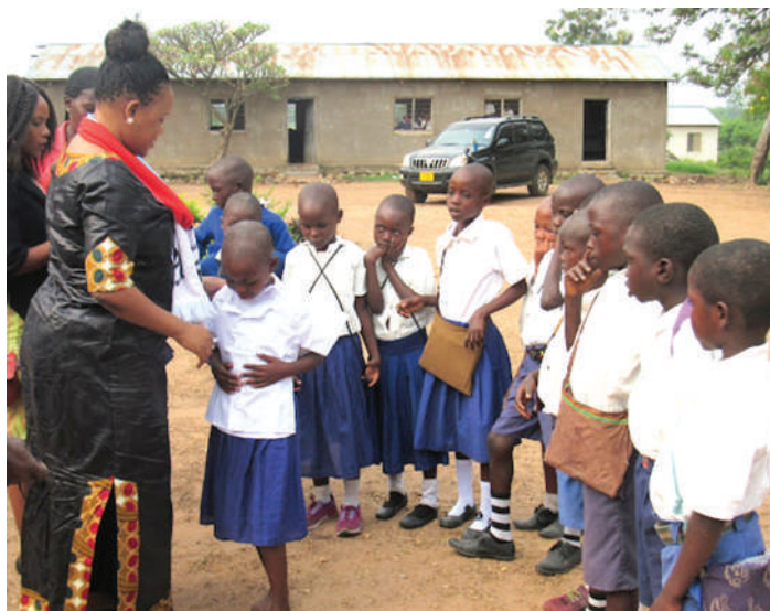
Wanafunzi wa mkoa wa Katavi, wakipatiwa sare, ikiwa ni sehemu ya kuhamasisha taaluma.