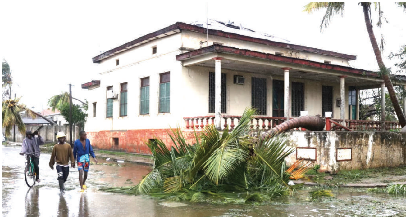
Watu wakitembea kwenye maji ya mafuriko kwenye mji wa Quelimane, Msumbiji baada ya kushambuliwa na kimbunga Freddy.

"Tunataka uchaguzi wetu uwe na maana, lakini katika kufanya hivyo tunataka kusisitiza kuwa haki ya kukusanyika, kuandamana, kuwasilisha malalamiko na kupaza sauti ni mambo ambayo yapo kitaba" alisisitiza Odinga. RFI