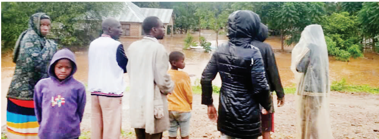
Baadhi ya wakazi wa kijiji cha Kusenyi, wakiwa barabarani baada ya nyumba zao kuzingirwa na maji, kutokana na mvua kubwa iliyonyesha kijijini hapo, Musoma Vijijini, mkoani Mara jana.