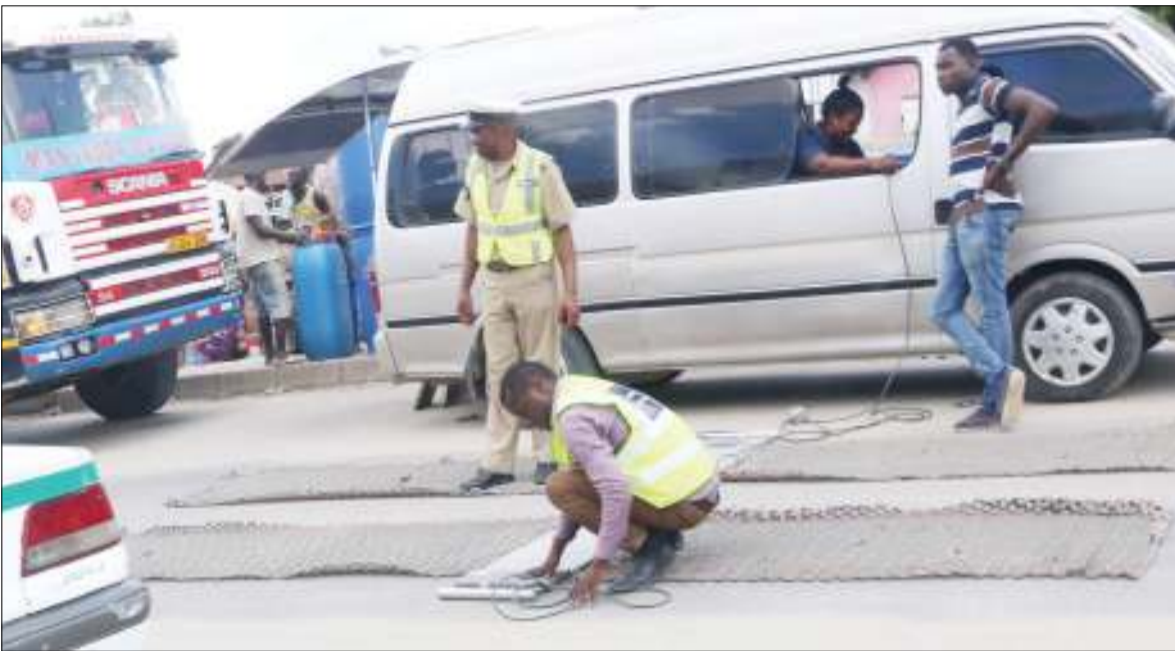
Afisa mizani akirekebisha mzani wake kabla ya kupima uzito wa magari yaliyokuwa yanapita katika mitaa ya Tandika Mwembe Yanga wilayani Temeke jijini Dar es Salaam.