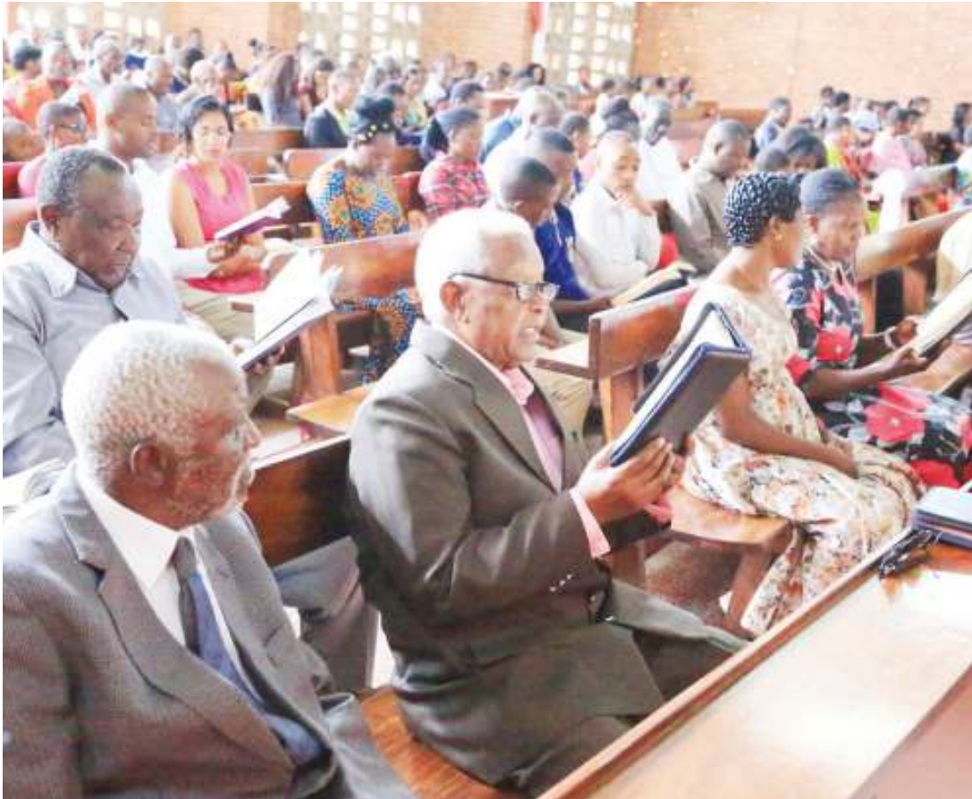
Baadhi ya waumini wa Kanisa la Kiinjili la Kilutheri Tanzania (KKKT), wakishiriki ibada ya Pasaka iliyoifanyika Kanisa Kuu la Usharika wa Dodoma Mjini, jana.

• Asema ndio msingi uchaguzi mkuu, wengine waonya rushwa... Endelea ukurasa 2&3