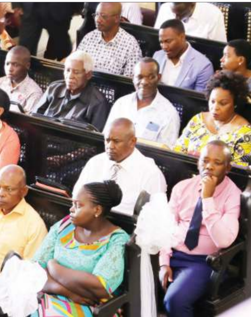
Waumini wa Kanisa la Kiinjili la Kilutheri Tanzania (KKKT) Usharika wa Azania Front jijini Dar es Salaam, wakiwa katika ibada ya Pasaka jana.