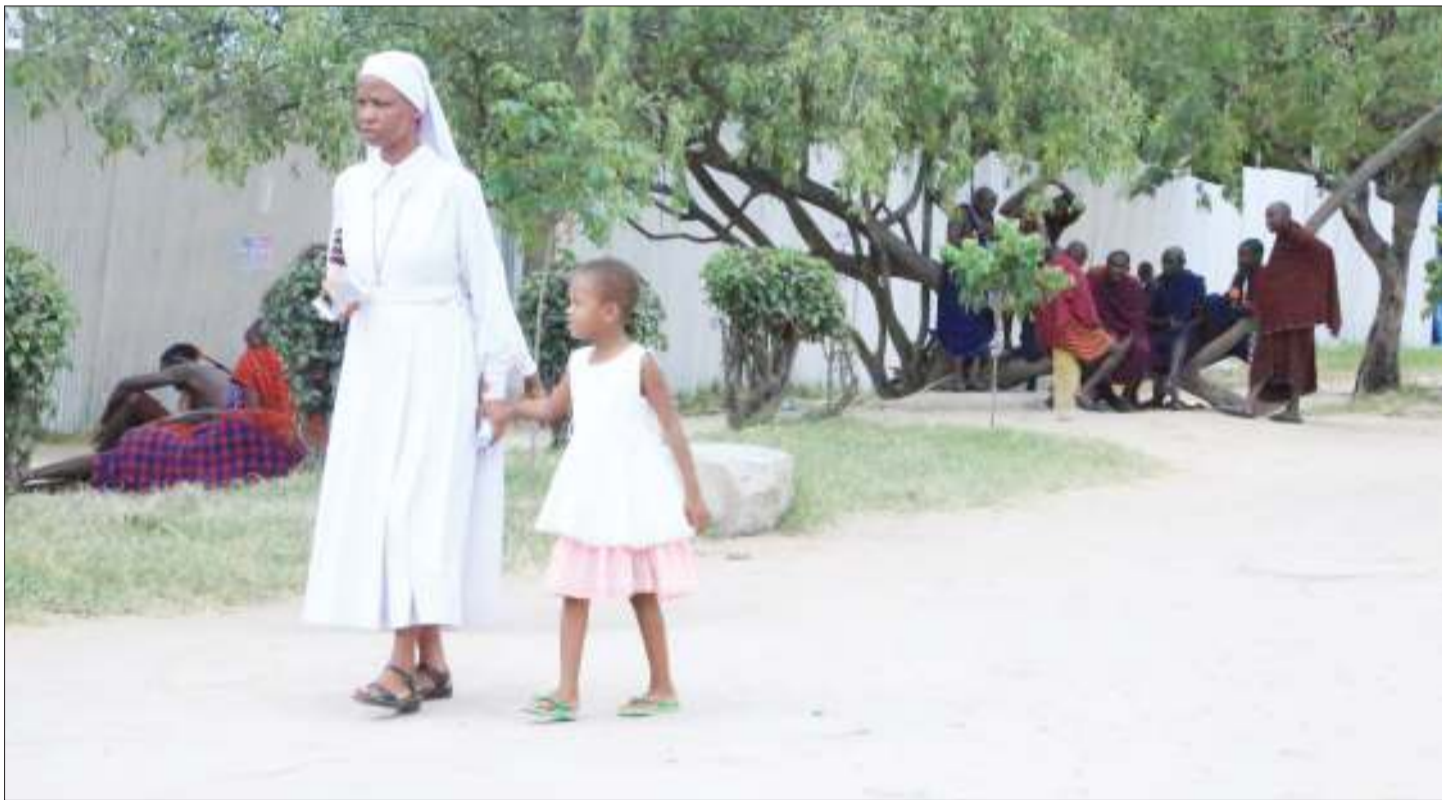
Sista wa kanisa Katoliki ambaye jina lake halikupatikana, akiambatana na mtoto kwenda kwenye Ibada ya Sikukuu ya Pasaka eneo la mjini Kati jijini Dodoma jana.

Pamoja na mambo mengine. Ole Sabaya alitumia hadhara hiyo kumtambulisha Brighton Mushi kuwa ndiye mdau wa maendeleo atakayeshirikiana naye kufanikisha azma ya kujenga ukumbi ambaye ni mwenyeji wa wilaya ya Hai anayefanya shughuli zake mkoani Arusha.