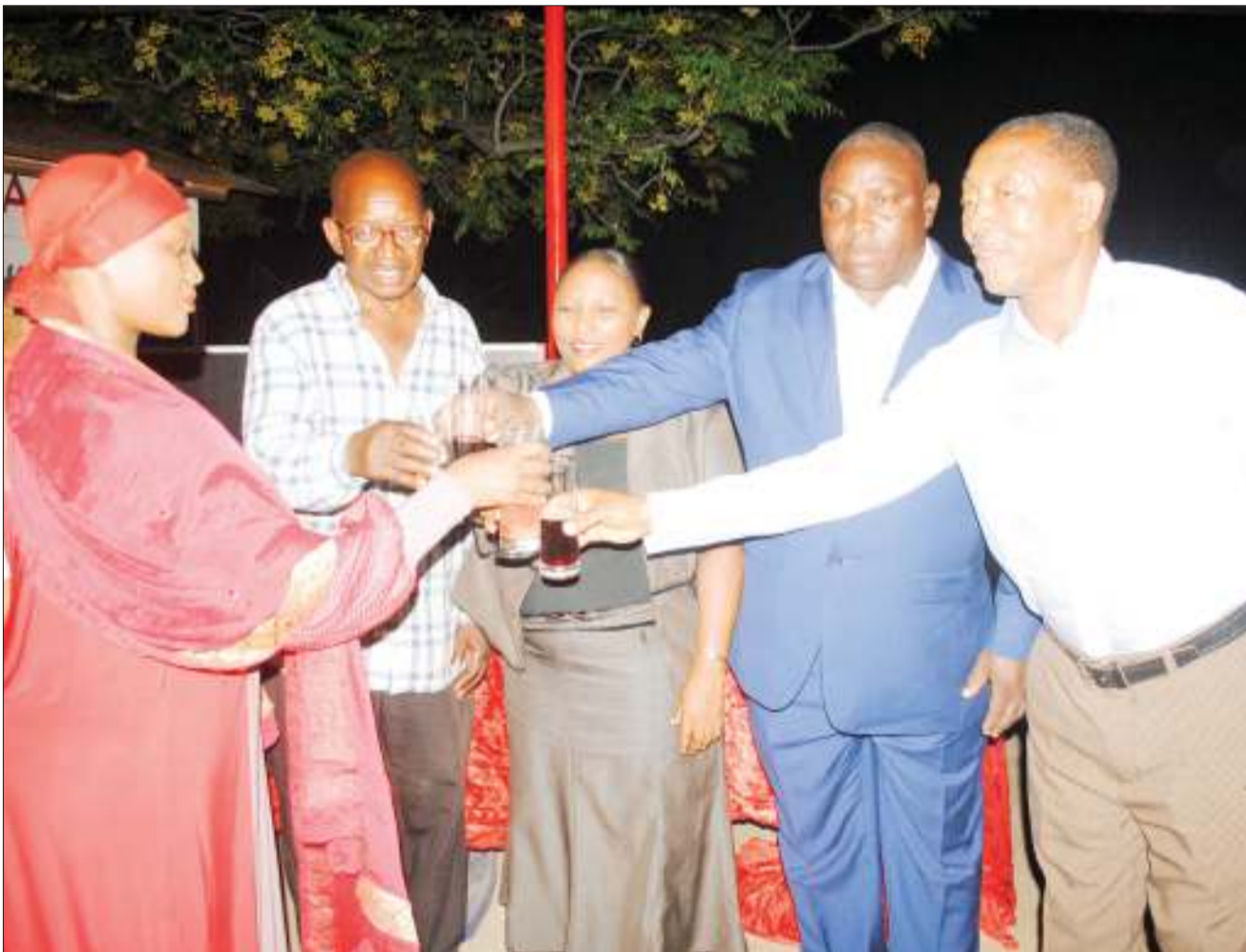
Baadhi ya wafanyakazi wa Hospitali ya Taifa Muhimbili kitengo cha Idara ya Ufundi wakigonganisha glasi yenye kinywaji cha shampeni wakiwa na wenza wao wakati wa hafla yao ya kupongezwa na wafanyakazi wenzao wa idara hiyo kwa kustaafu kazi kwa mujibu wa sheria, Dar es Salaam juzi