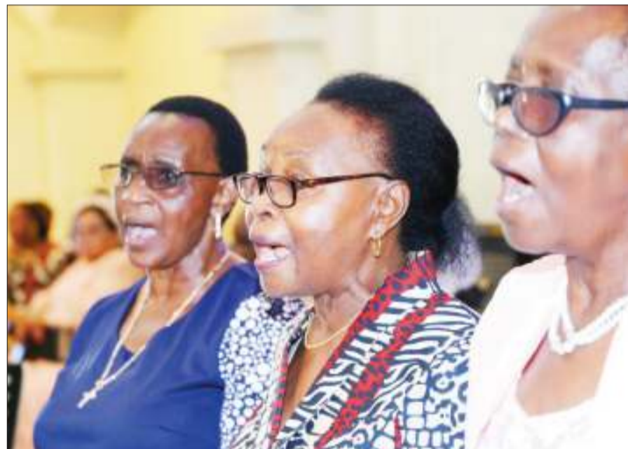
Baadhi ya wanakwya ya kinamama wa Kanisa la Kiinjili la Kilutheri Tanzania (KKKT) Usharika wa Azania Front jijini Dar es Salaam, wakiimba wakati wa ibada ya Pasaka.