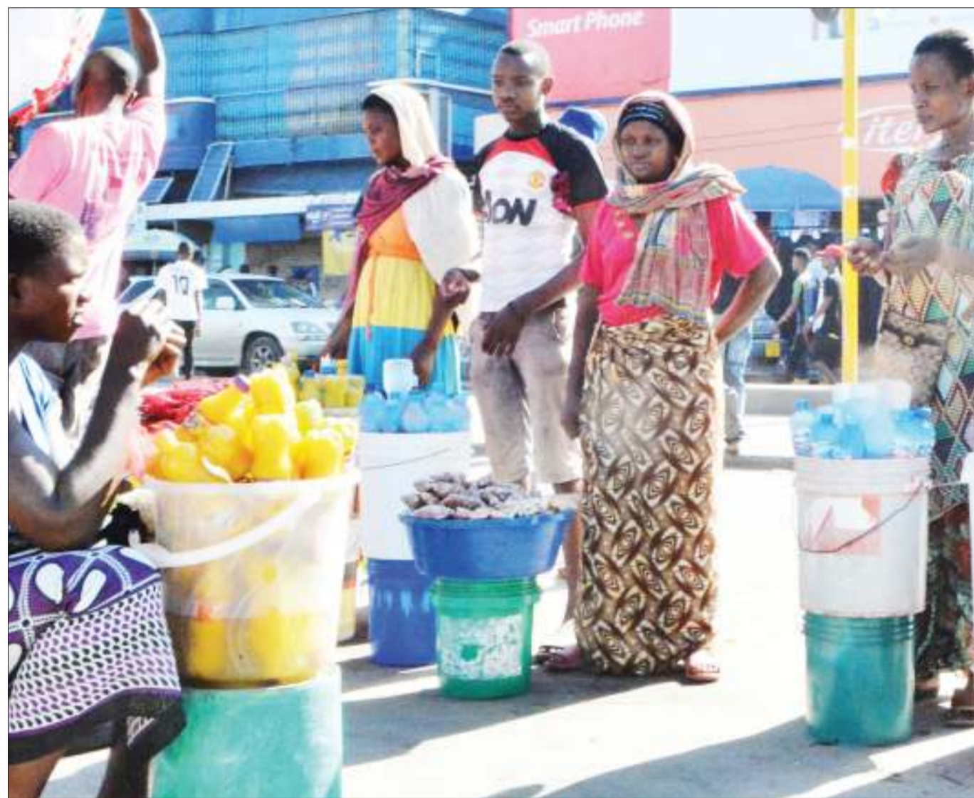
Wachuuzi wa vinywaji baridi wakisubiri wateja katika mataa Msimbazi, jijini Dar es Salaam jana.