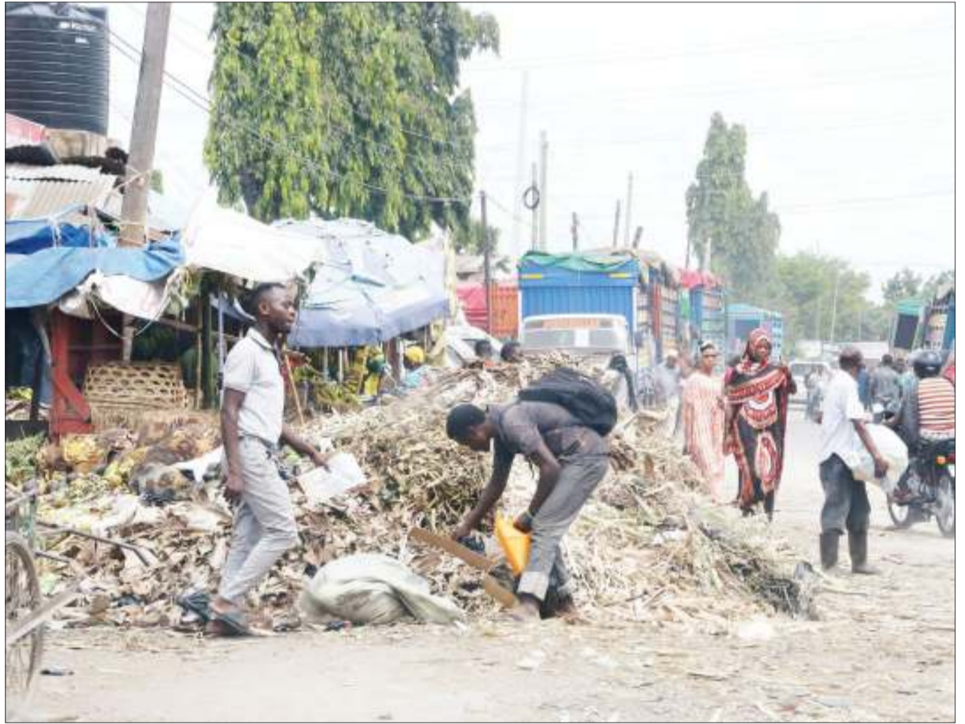
Mkazi wa Tandale wilayani Kinondoni, akiwa kwenye taka zilizowekwa kando ya soko la Tandale ambalo halijazolewa mwishoni mwa wiki.

Alisema bonde la Bugwema lina zaidi ya ekari 5,000 na kwamba kabla ya mkataba huo wananchi walishirikishwa wakakubali na sasa utekelezaji umefuata ili kuhakikisha kilimo cha umwagiliaji kinaanza haraka iwezekavyo.