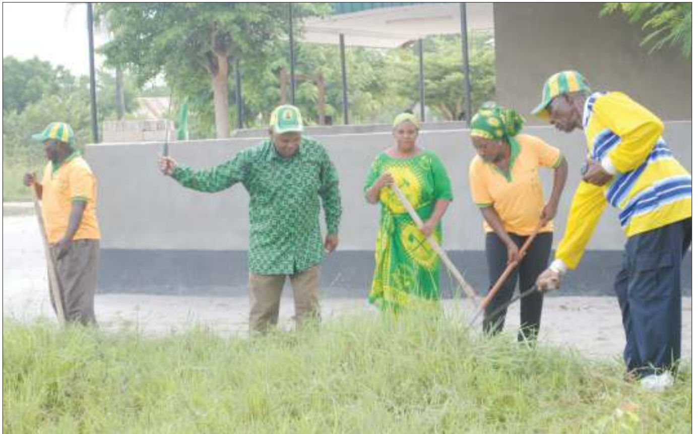
Baadhi ya viongozi wa Chama Cha Mapinduzi Tawi la Wazalendo, Kivule, Ilala jijini Dar es Salaam, wakishirikiana kusafisha mazingira kwenye eneo la Zahanati ya Kivule hivi karibuni, ikiwa ni sehemu ya maadhimisho ya miaka 42 ya CCM.

Alisema awali wao ndio wali-kuwa wanasimamia na kwamba hakukuwapo na uharibifu kama ulivyo sasa hivyo wakikabidhiwa jukumu hilo rasmi shughuli za uvamizi, ukataji na uchomaji misitu ovyo zitakwisha kwa kuwa wataweka sheria za kuwabana wananchi katika maeneo yao.