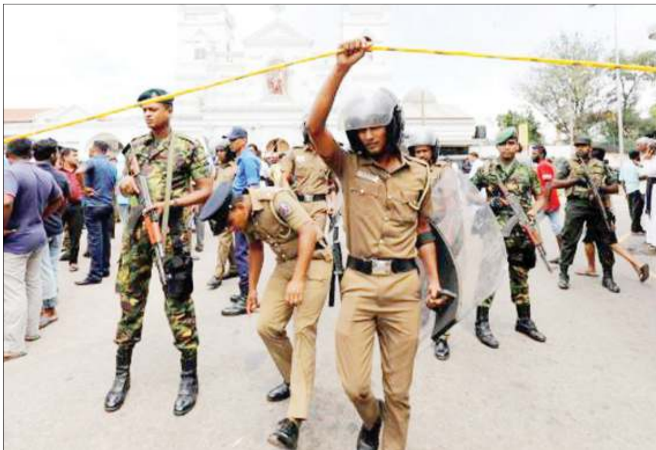
Polisi na wanajeshi nchini Sri Lanka wakiweka ulinzi kwenye moja ya kanisa lililoshambuliwa.

Rais wa Sri Lanka, Maithripala Sirisena alisema majeshi ya ulinzi na polisi wameanzisha uchunguzi, huku viongozi mbalimbali duniani wakilaani mashambulio hayo. DW