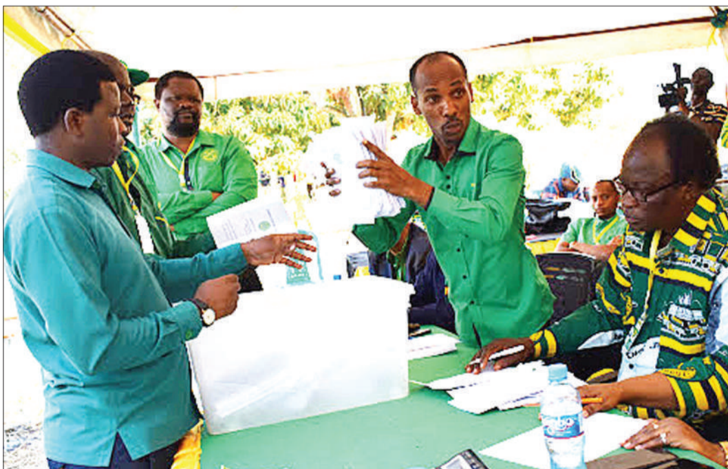
Kura za wanachama waliomba kugombea ubunge zikihesabiwa.

■Mwandishi wa makala hii ni Mchungaji wa Kanisa la Kiinjili la Kilutheri Tanzania (KKKT), Mtafiti, Mshauri, Mwanataaluma katika Theolojia, Maadili na Uongozi wa Rasilimali Watu.