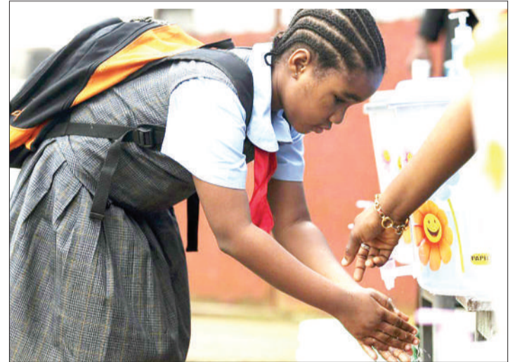
Mwanafunzi akinawa mikono ikiwa hatua ya kujikinga na corona. Takwimu kuhusu maradhi ya ugonjwa huo na madhara yake, vilikuwa chachu ya watu kuchukua tahadhari.

Chuo pia kwa kushirikiana na NBS, kilishiriki katika kuandaa makadirio ya idadi ya watu kupitia Sensa ya Watu na Makazi ya Mwaka 2012 katika ngazi za kitongoji, kijiji, mtaa, kata, wilaya, mkoa hadi taifa kabla ya Uchaguzi wa Oktoba