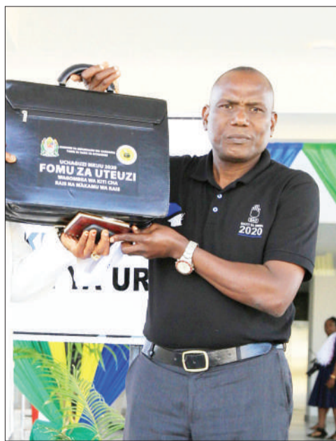
Mgombea Urais SAU, Mtamwega Mgaywa.

"Tumesujudu hii ardhi kuashiria kwamba amani itatawala na kila kitu kwenye dunia ni ardhi, ardhi ndio mama