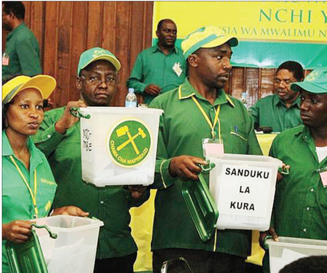
Watia nia wa CCM wakiwa wameshika maboksi ya kura zao. Vitendo vya rushwa vinaweza kusababisha kupatikana viongozi wasiofaa.

na na Rushwa (TAKUKURU) nchini Tanzania chini ya Kifungu cha (7) cha Sheria ya Kuzuia na Kupambana na Rushwa namba II/2007, imepewa jukumu la kuzuia na kupambana na rushwa katika jamii ikiwamo rushwa katika uchaguzi.