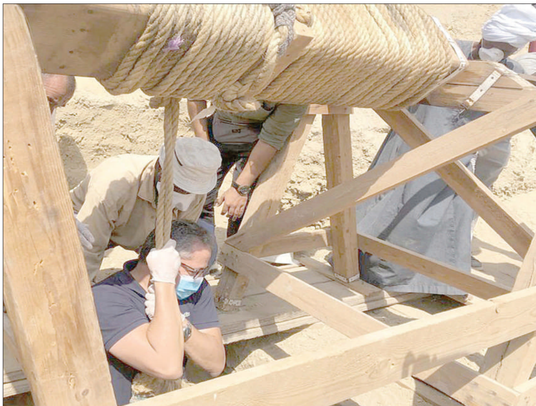
Wataalam wakifanya utafiti kugundua mali kale jangwani.