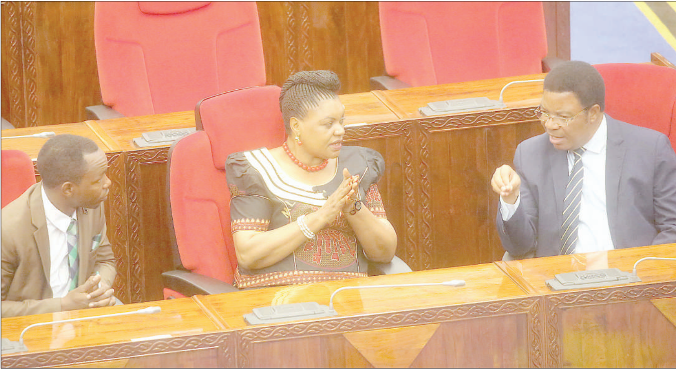
Waziri Mkuu Kassim Majaliwa, akijadiliana jambo na Waziri wa Nchi, Ofisi ya Waziri Mkuu, Sera, Bunge, Kazi, Vijana, Ajira na Wenye Ulemavu, Jenista Mhagama (katikati) na Naibu Waziri Ofisi ya Waziri Mkuu, Kazi, Vijana na Ajira, Patrobas Katambi, Bungeni jijini Dodoma, jana.