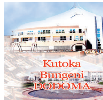
Habari zote na Augusta Njoji, DODOMA

Aidha, alisema kuanzia Desemba 2015 hadi Septemba 2020, Halmashauri ya Mji Njombe imeajiri walimu 21 wa shule za msingi na walimu 111 wa shule za sekondari.