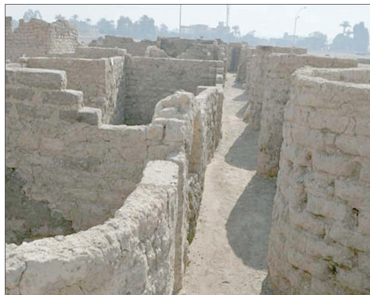
Mji wa kale uliogunduliwa eneo la Luxor.