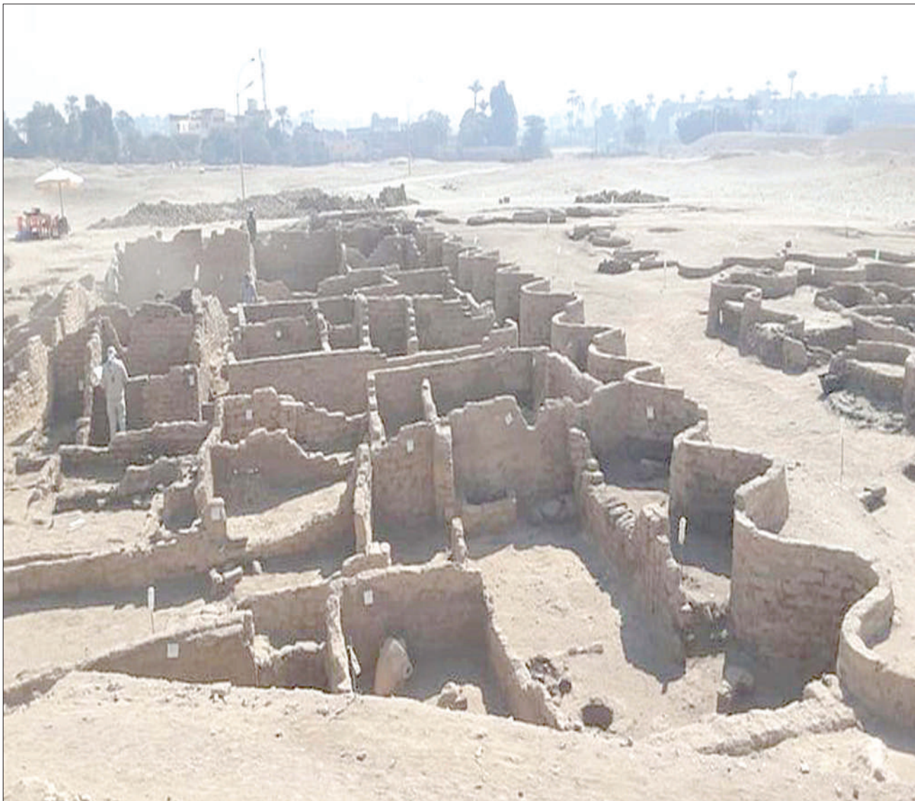
Kuta za kale ambazo zimegunduliwa na wataalamu nchini Misri ambazo zina zaidi ya miaka 3,400 tangu enzi za farao.