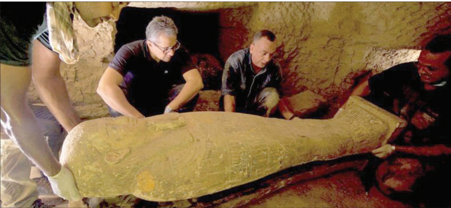
Wataalam wa mambo ya kale wakifungua moja ya jeneza lililopatikana kwenye kaburi.

Mjukuu wake, Mfalme Tut, alivutia macho ya dunia nzima baada ya wataalam kugundua kaburi lake likiwa limejaa vitu vya thamani. Mfalme huyo kijana wa chini ya miaka 20 alifariki 1324 BC.