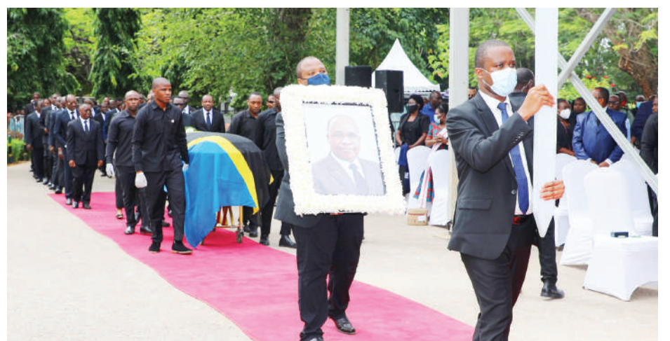
Jeneza lenye mwili wa aliyekuwa Katibu Mkuu Kiongozi, Mhandisi Balozi John William Kijazi, likiwa katika Viwanja vya Karimjee, jijini Dar es Salaam jana, kwa ajili ya ibada na hafla ya kuuga.