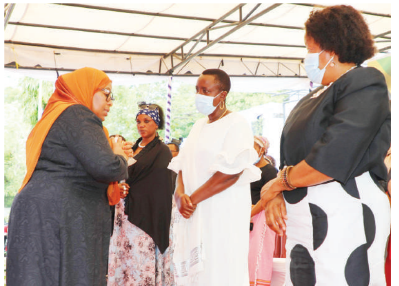
Makamu wa Rais, Samia Suluhu Hassan, akisalimiana na kuifariji familia ya marehemu Mhandisi Balozi John William Kijazi, baada ya kumalizika kwa ibada na misa maalum kwa ajili ya kumwomba.