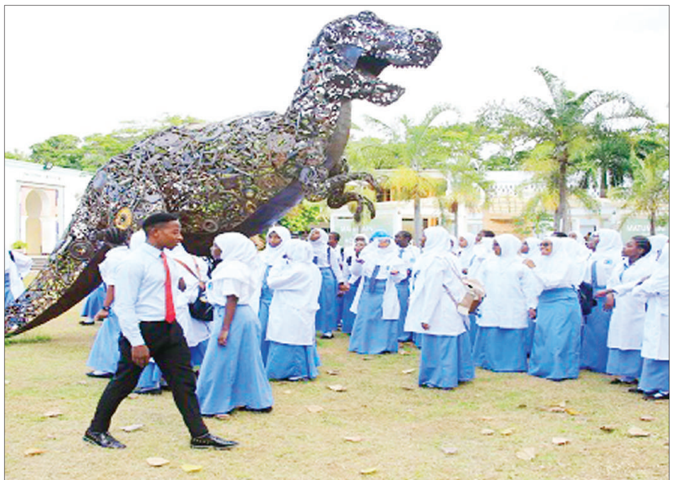
Wanafunzi wa Shule ya Sekondari Baobab ya Mapinga Bagamoyo, wakishangaa sanamu ya mjesi mkubwa, walipofanya ziara ya mafunzo katika Makumbusho ya Taifa, jijini Dar es Salaam hivi karibuni, chini ya ufadhili wa kampuni tanzu ya Global Education Link ya GEL Holiday Tours.

Baada ya Mahakama kuwaachia huru, Mkami Shirima aliendelea kuwa chini ya ulinzi wa polisi kutokana na kesi nyingine inayomkabili ya mauaji ya mfanyakazi wake wa ndani.