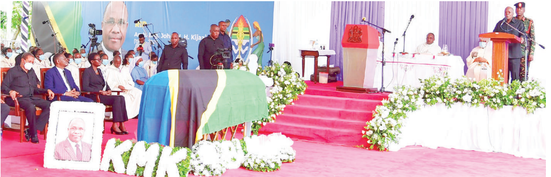
Rais Dk. John Magufuli akizungumza wakati wa kutoa hesima za mwisho kwa aliyekuwa Katibu Mkuu Kiongozi, Mhandisi Balozi John William Kijazi. Waliokaa (kutoka kushoto) ni Rais mstaafu Dk. Jakaya Kikwete, Jaji Mkuu Prof. Ibrahim Juma na Naibu Spika Dk. Tulia Ackson.