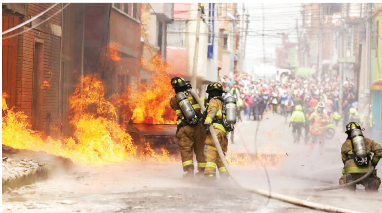
Maofisa wa kupambana na moto, wakizima moto uliotokana na mlipuko ndani ya gari katika eneo la viwanda mjini Bogota, Colombia juzi.