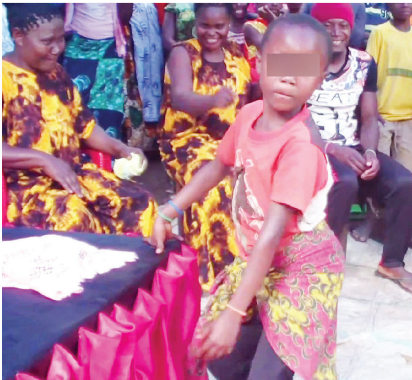
Watoto wanaposhiriki miziki ya singeli na burudani zisizo na maadili wanapotoka. Wazazi, walezi na jamii wasiruhusu mambo hayo ya kuwaangamiza yaendelezwe.