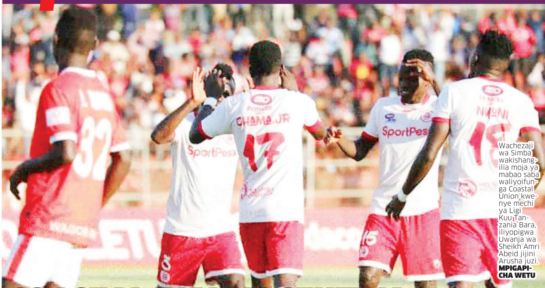
Wachezaji wa Simba wakishangilia moja ya mabao saba waliyoifunga Coastal Union kwenye mechi ya Ligi Kuu Tanzania Bara, iliyopigwa Uwanja wa Sheikh Amri Abeid jijini Arusha juzi.