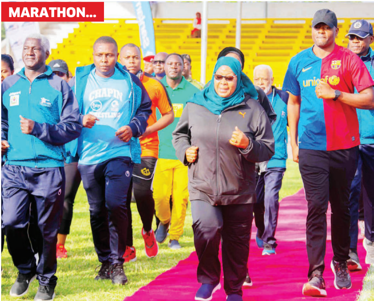
Makamu wa Rais wa Jamhuri ya Muungano wa Tanzania, Mama Samia Suluhu Hassan (katikati), akishiriki mbio za NBC Dodoma Marathon 2020, zilizofanyika jijini Dodoma jana na kushirikisha wanariadha 3,000 kutoka Tanzania, Kenya, Malawi na Uganda. HABARI UK. 23