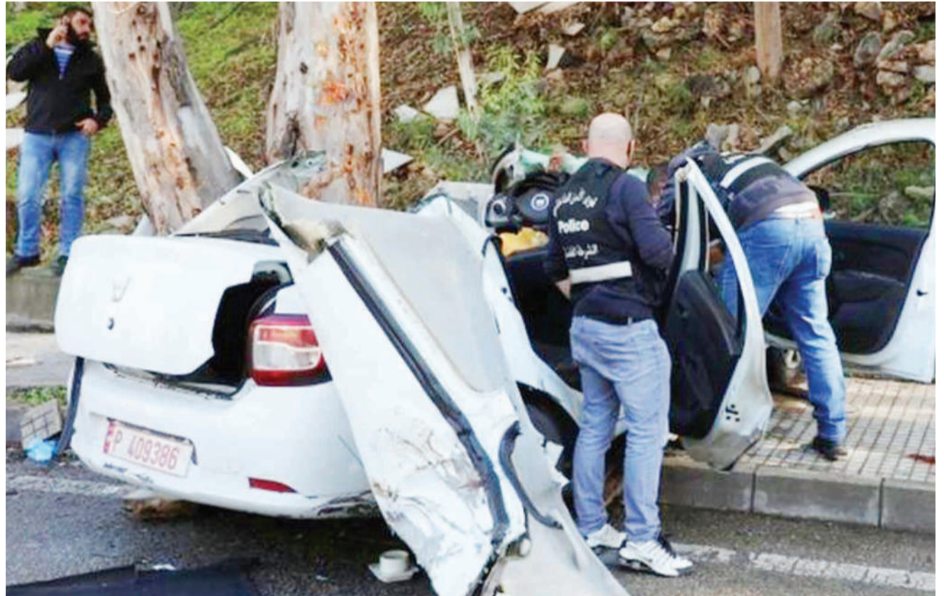
Ajali ya gari iliyoua wafungwa watano na kujeruhi mmoja, baada ya gari hiyo, kugonga mti. Wafungwa hao walikuwa wakitoroka gereza ni mwishoni mwa wiki, Beirut, Lebanoni.

Hata hivyo, wamekanusha madai kuwa wameharibu madaraja na barabara. Mamia ya watu wamefariki dunia na wengine 30,000 wakikimbilia nchi ya Sudan, tangu mzozo huo ulipoanza Novemba 4, mwaka huu. DW