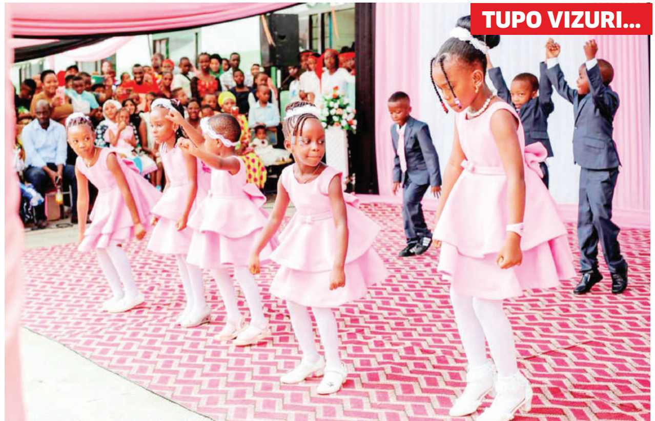
Wanafunzi wa Shule ya Awali ya St. Mary's Mbezi Makonde jijini Dar es Salaam, wakionyesha umahiri wao wa kuimba na kucheza nyimbo mbalimbali wakati wa mahafali ya elimu ya awali shuleni hapo, mwishoni mwa wiki.