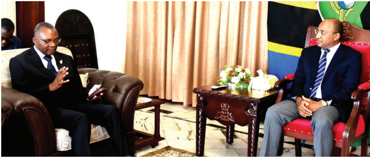
Rais wa Zanzibar, Dk. Hussein Ali Mwinyi, akisalimiana na Waziri wa Ulinzi na Jeshi la Kujenga Taifa, Elia Kuandikwa, wakati alipofika Ikulu ya Zanzibar kwa ajili ya kujitambulisha pamoja na kumpa pongezi kwa ushindi alioukata katika uchaguzi mkuu, uliopita mwaka huu.