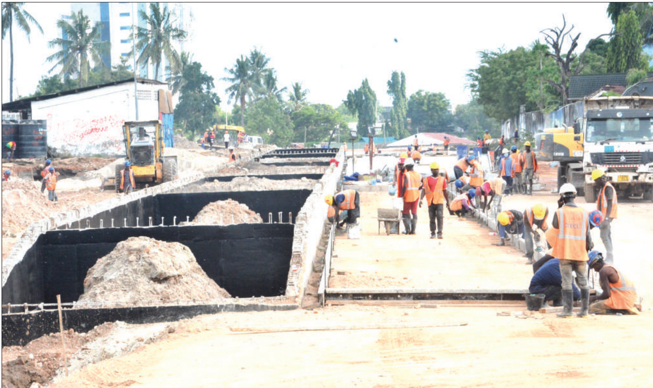
Mafundi wakiendelea na ujenzi katika kituo cha mabasi ya mwendo kasi eneo la Ubungo stendi ya mkoa, jijini Dar es Salaam.

"Wasikilizeni wananchi, tatueni mata-tizo yao mkishirikiana na serikali, nita-hakikisha nakuwa kiungo kizuri kati ya serikali kuu na halmashauri na kumsaidia mkurugenzi kutekeleza majukumu yake kwa ufanisi," alisema.