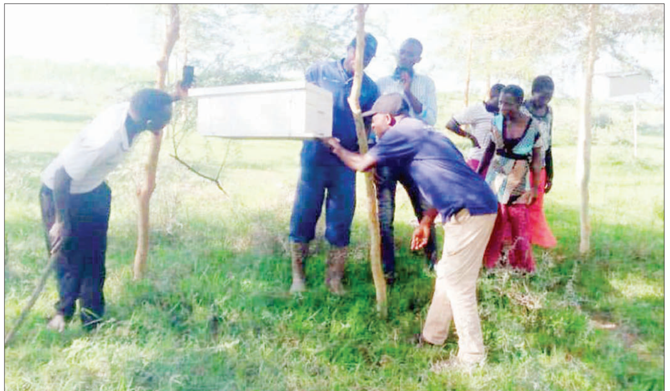
Baadhi ya wanachama wa kikundi cha wakulima cha Jipe Moyo cha Kijiji cha Buanga, Musoma Vijijini mkoani Mara, wakiangalia moja ya mizinga 11 ya nyuki waliokabidhiwa na Shirika la Swiss Contact juzi, ili kupanua wigo wa shughuli za kiuchumi.