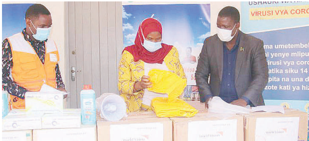
Tukio la kupokea dawa za chanjo nchini.

Kampuni kubwa ya mitandao ya kijamii ya Twitter iligonga vichwa vya habari kote duniani mnamo Mei 2020 ikisema: