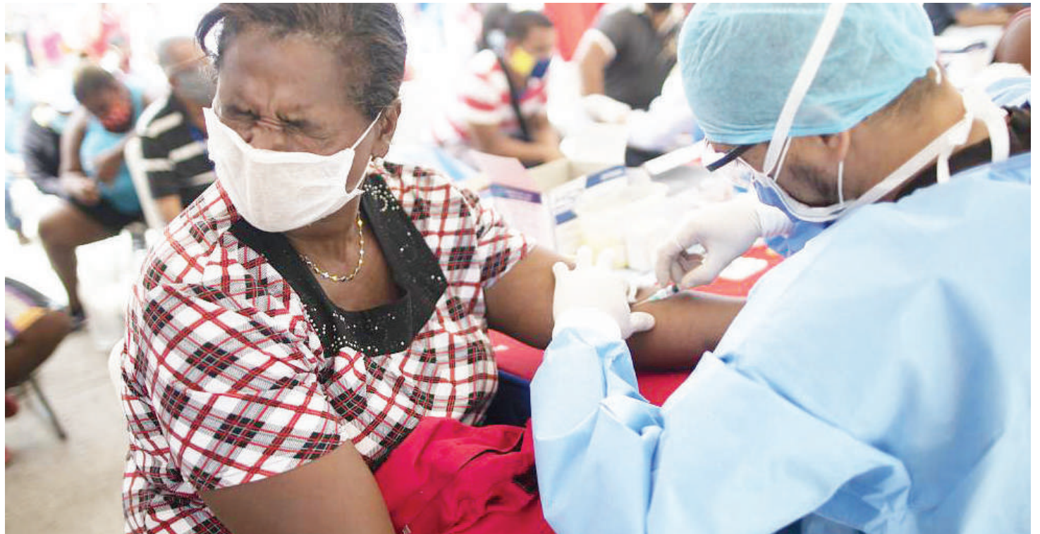
Huduma za kukabili Uviko, katika hatua ya chanjo.

zimebadili ushauri wa kuvaa barakoa na kuagiza zivaliwe katika mazingira fulani.