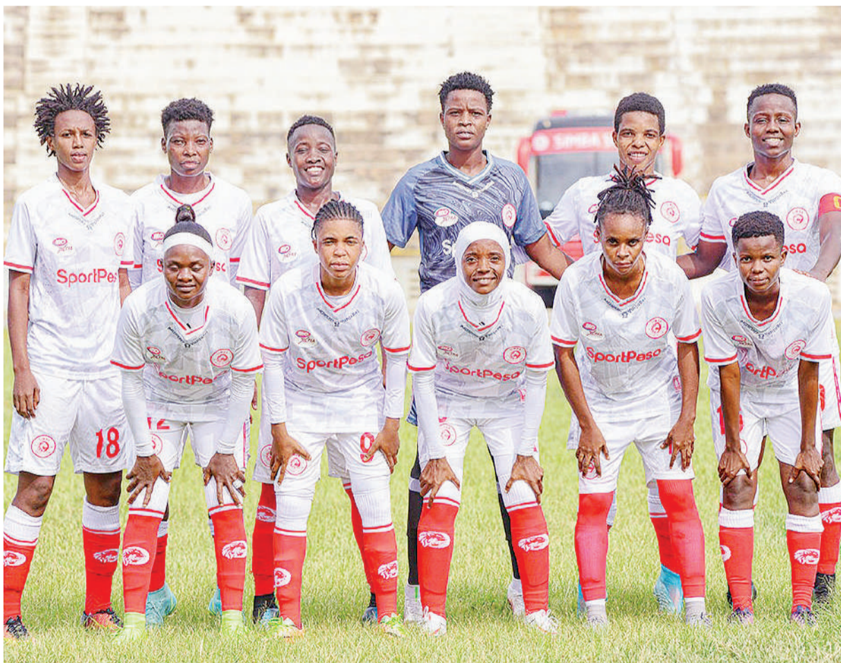
Simba Queens.

Alisema kwa kiwango wanachotendea kuonyesha wachezaji hao, TAFF inajivunia mafanikio hayo na inaendelea kutafuta fursa kwa wachezaji wengine wa ndani kwenda kucheza soka la kulipwa ili baadaye kuwa msaada kwa Tembo Warriors.