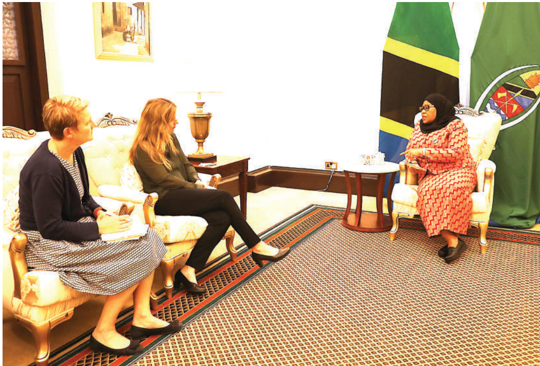
Rais Samia Suluhu Hassan, akizungumza na Waziri wa Mambo ya Nje wa Shirikisho la Jamhuri ya Ujerumani Katja Keul mara baada ya kuwasili Ikulu Jijini Dar es Salaam jana.