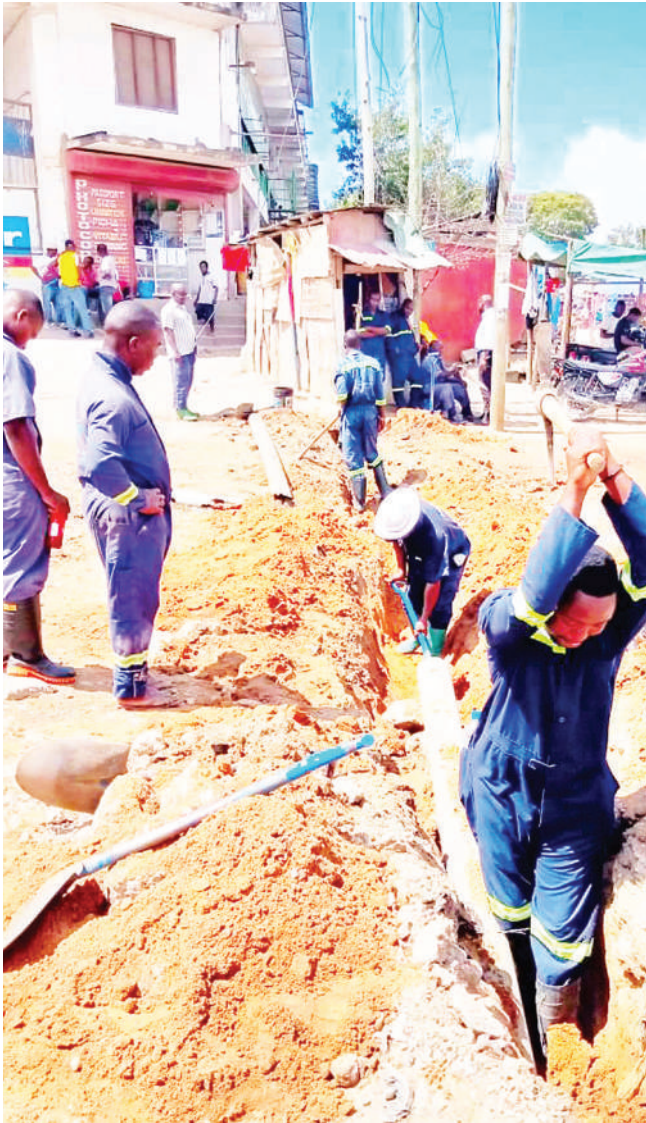
Mafundi wa Mamlaka ya Majisafi na Usafi wa Mazingira Dar es Salaam (DAWASA), mkoa wa Kihuduma Mbagala, wakifanya matengenezo katika bomba la inchi sita katika eneo la Mbagala Rangitatu, ili kuimarisha upatikanaji wa huduma hiyo.