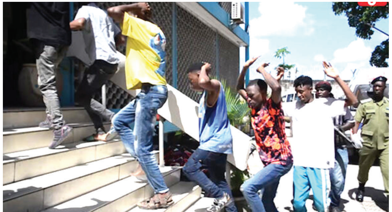
Ndivyo hali ilivyokuwa kwa watuhumiwa wa 'Panya Road'.

Kidole kimojawapo kinachonyoosha ni zao la kubadilika mifumo ya maisha, ikiwa ni pamoja na wazazi na walezi kuzama zaidi