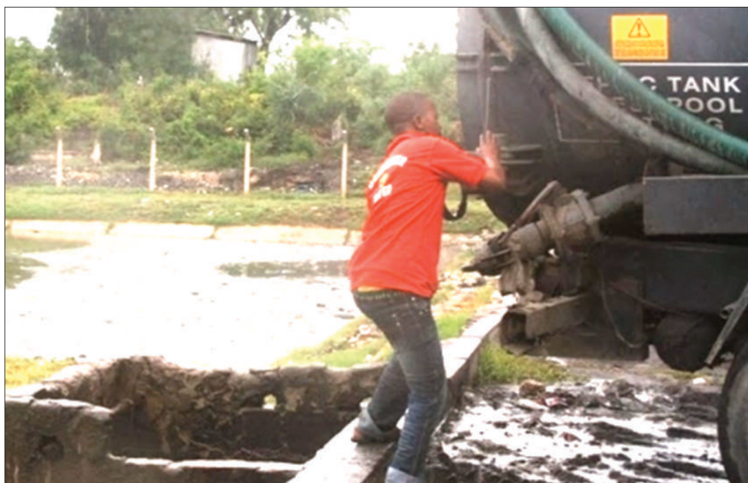
Shughuli za utiririshaji majitaka ya vyoo zikiendelea.

• Rekodi za kihistoria zinaendelea kutetea