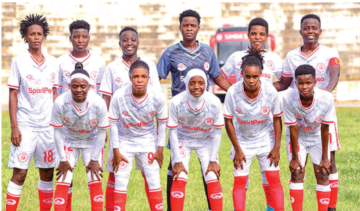
Kikosi cha Simba Queens, ambacho kimebakiza pointi tatu katika mechi tatu kabla ya kutawazwa kuwa mabingwa wa msimu wa 2021/22 wa Ligi Kuu Bara.

Matokeo ya mechi zingine zilozchezwa juzi ni Ilala Queens iliokiona cha moto kwa kufungwa nyumbani, Uwanja wa Karume, mabao 3-0 dhidi ya Ruvuma Queens, huku 'dabi' ya mkoani Pwani kati ya Mlandizi Queens na JKT Queens, ikimalizika kwa sare ya mabao 2-2.