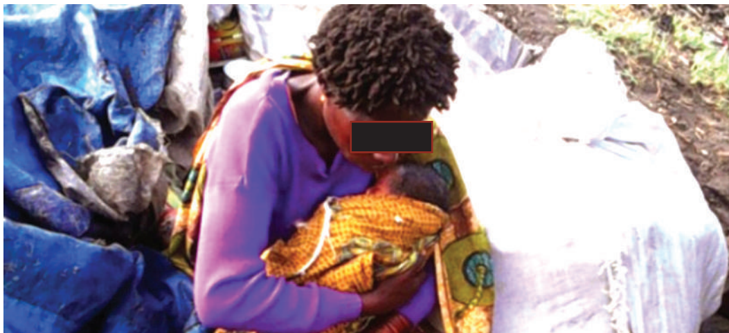
Mtu anayehisiwa kuwa na maradhi ya akili.

Magonjwa ya akili yanatajwa yanaweza kusababishwa na sababu ama za kibaiolojia au kisaikolojia.