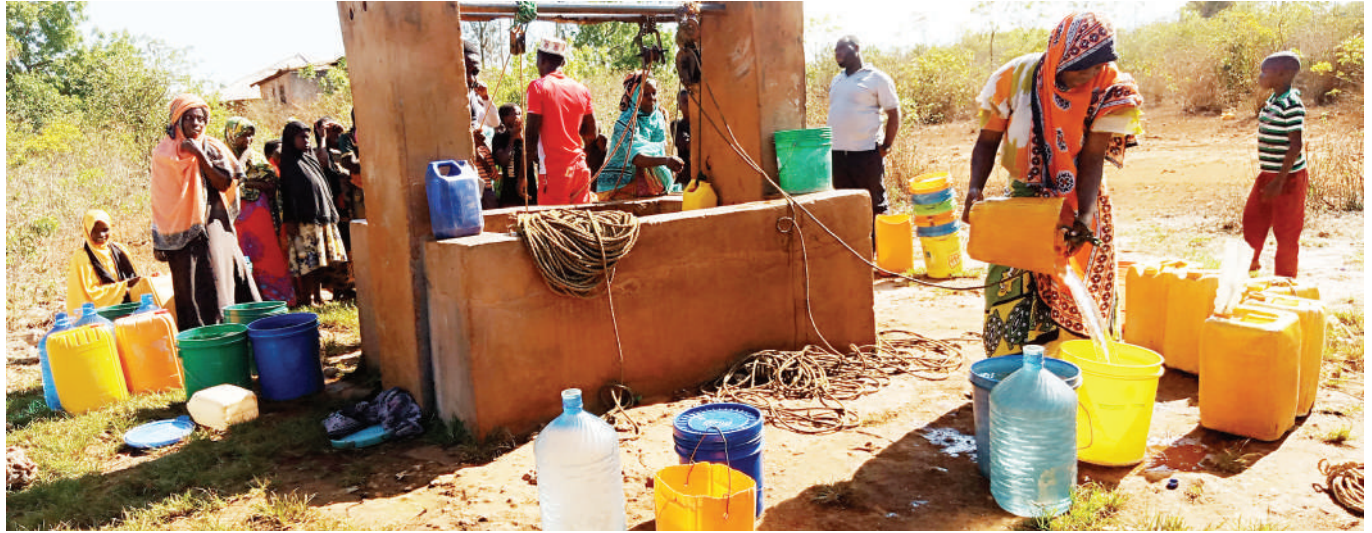
Wakazi wa Kijiji cha Kijini Matemwe, Mkoa wa Kaskazini Unguja wakipata huduma ya maji katika kisima kilichoko kijijini kwao mwishoni mwa wiki iliyopita.

awali kijiji hicho kilizungukwa na miti ikiwamo ya asili lakini kwa sasa hali ya mazingira ni mbaya, akisisitiza ndicho kiini cha uhaba wa maji katika visima vyao.