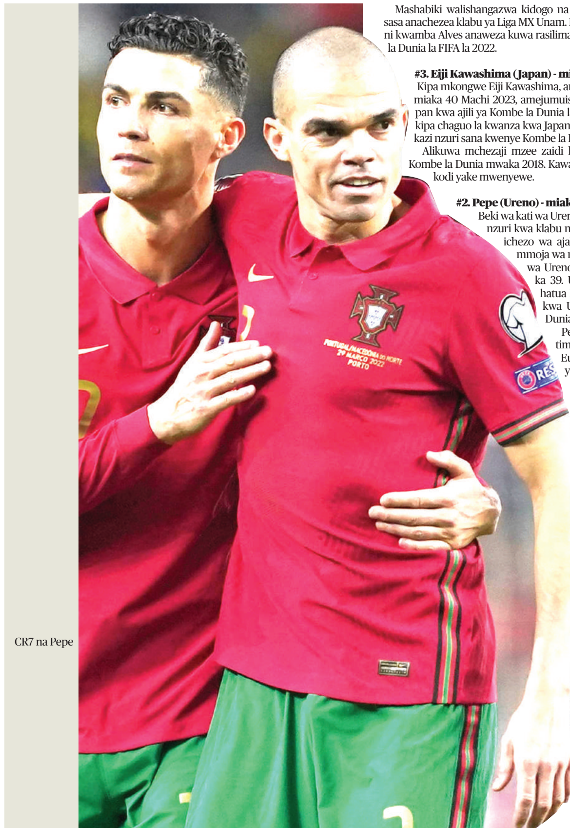
CR7 na Pepe

Hutchinson kwa sasa anaichezea Klabu ya Uturuki ya Besiktas na anashikilia rekodi ya kucheza mechi nyingi zaidi katika ngazi ya soka ya kimataifa nchini Canada (mechi 97).