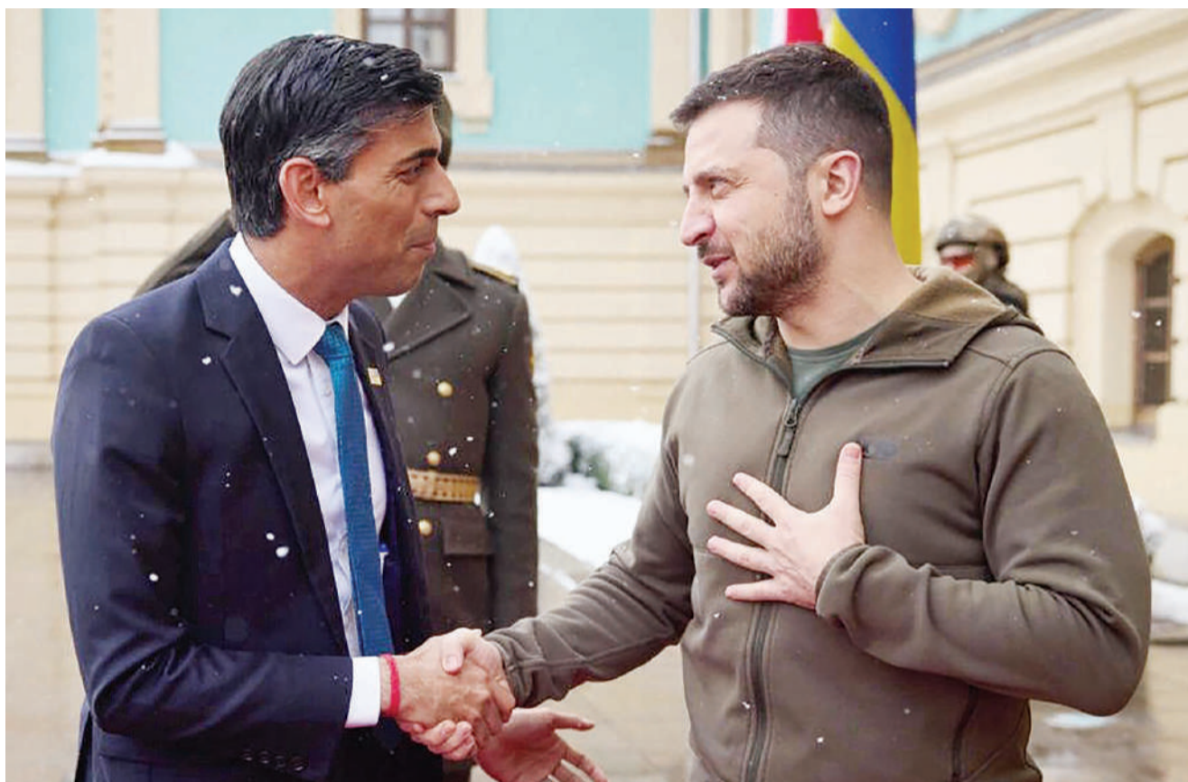
Waziri Mkuu wa Uingereza, Rishi Sunak, akisalimiana na Rais wa Ukraine, Volodymyr Zelensky, baada ya kuwasili nchini humo juzi kwa ziara ya kushtukiza.

"Huduma ya mtandao sio anasa bali ni hitaji la msingi. Kasi yake ya juu na uwezo wake wa kumudu inaweza kumaanisha kasi kubwa na upatikanaji wa haraka wa habari," alisema. BBC