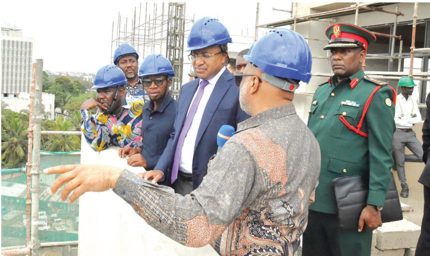
Rais wa Zanzibar, Dk. Hussein Ali Mwinyi (wa pili kulia), akipata maelezo ya maendeleo ya ujenzi wa Hospitali ya Mkoa wa Mjini Magharibi Unguja kutoka kwa Waziri wa Afya Zanzibar, Nasser Ahmed Mazrui, inayojengwa katika eneo la Lumumba Wilaya ya Mjini Unguja.

Alisema kwa sasa mahitaji mengi ya vifaa yameshakamili-ka na mafundi wanaendelea na ujenzi.