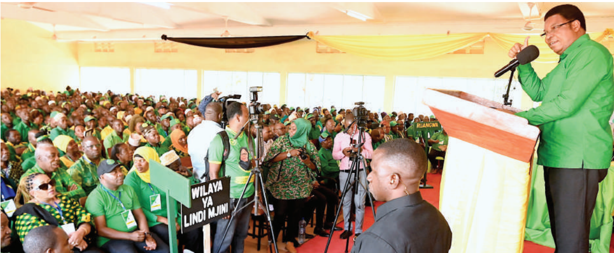
Waziri Mkuu na Mjumbe wa Kamati Kuu ya CCM Taifa, Kassim Majaliwa, akitoa salamu katika Mkutano Mkuu wa CCM wa Uchaguzi Mkoa wa Lindi kwenye ukumbi wa Chuo cha Ualimu Nachingwea mwishoni mwa wiki.