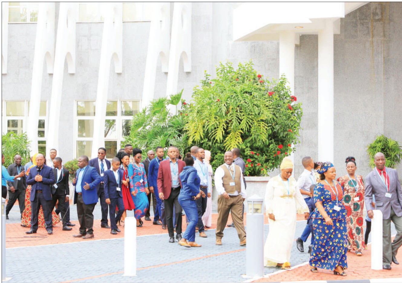
Baadhi ya wageni kutoka maeneo mbalimbali nchini wakiingia kwenye viwanja vya Bunge, jijini Dodoma jana, kwa ajili ya kushuhudia kuapishwa kwa wabunge wao.