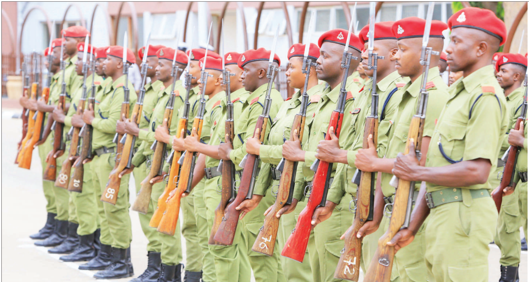
Baadhi ya askari wa Jeshi la Polisi wakiwa kwenye maandalizi ya gwaride maalum katika viwanja vya Bunge, jijini Dodoma jana, kwa ajili ya kumpokea Rais Dk. John Magufuli, atakapolizindua rasmi Bunge kesho.