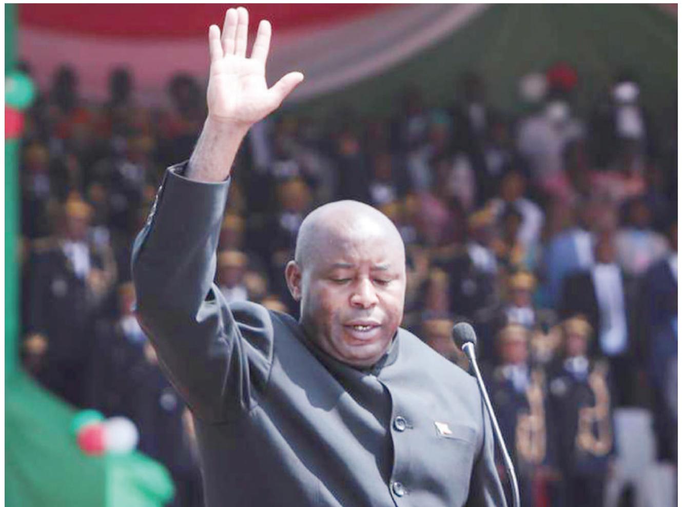
Rais wa Burundi, Evariste Ndayishimiye.

Chanzo kimoja ambacho hakikutaka kutajwa jina, kimeambia DW kuwa waandishi wa habari ndani ya Burundi hawaruhusiwi kuripoti mchakato wa mnada huo. DW