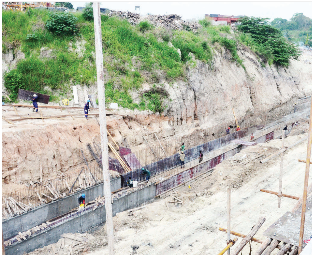
Mafundi wakijenga mfereji wa maji ya mvua katika kituo cha mabasi ya mikoani na nchi jirani, jijini Dar es Salaam juzi.

Alibainisha kwamba hali hiyo, inachangia kuahirishwa kwa kesi na wakati mwingine kuchelewa kutolewa uamuzi