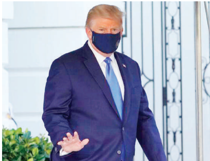
Rais Donald Trump, akiwa na barakoa hospitalini.

Tofauti kati ya utafiti tiba za chanjo au dawa nyingine kati ya nchi za Magharibi ikiwamo Marekani na China au Russia, ni kwamba nchi za Magharibi zina taratibu mgumu kwa ugunduzi wa dawa au chanjo kuthibitishwa.