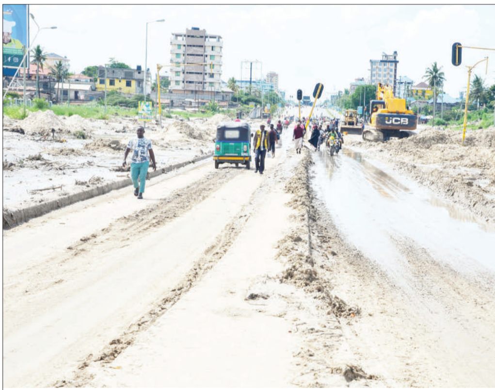
Sehemu ya Barabara ya Morogoro, ikiwa imejaa tope na mchanga katika eneo la Jangwani, jijini Dar es Salaam jana, kutokana na mvua inayonyesha na kusababisha usumbufu kwa watumiaji wa barabara hiyo.

Aidha, tangu kutoka kwa majina hayo kwenye mitandao, kume kuwa na taharuki juu ya chanzo halisi cha majina hayo, huku wapinzani, wakiwamo CHADEMA, wakiirushia lawama NEC kuwa ndiyo imehusika.