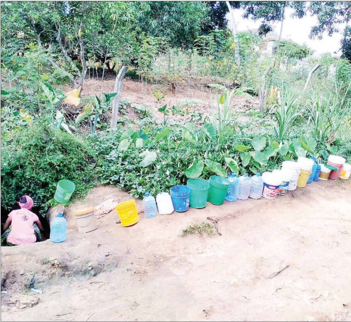
Wanawake wa Mtaa wa Tabata Kisukuru, jijini Dar es Salaam, wakiwa wamepanga foleni ya kuchota maji kwenye kisima kifupi jana, kutokana na kukosekana kwa maji ya bomba kwa muda mrefu.