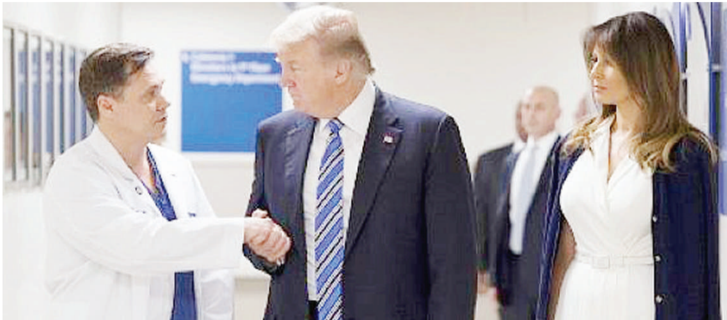
Rais Donald Trump, alipoagana na daktari wake hospitalini.