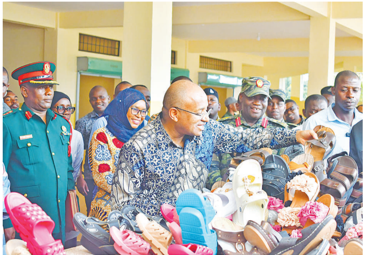
Rais wa Zanzibar, Dk. Hussein Ali Mwinyi akichagua viatu baada ya kufungua soko la wajasiriamali la Chakechake, Pemba jana.

Kuhusu wanyama wanaotoka Tanzania Bara ambao kisheria wanatakiwa kuchukua muda kabla ya kuchinjwa, alisema hawana maeneo ya kutosha ya kuwahifadhi, hivyo kusababisha kuibwa.