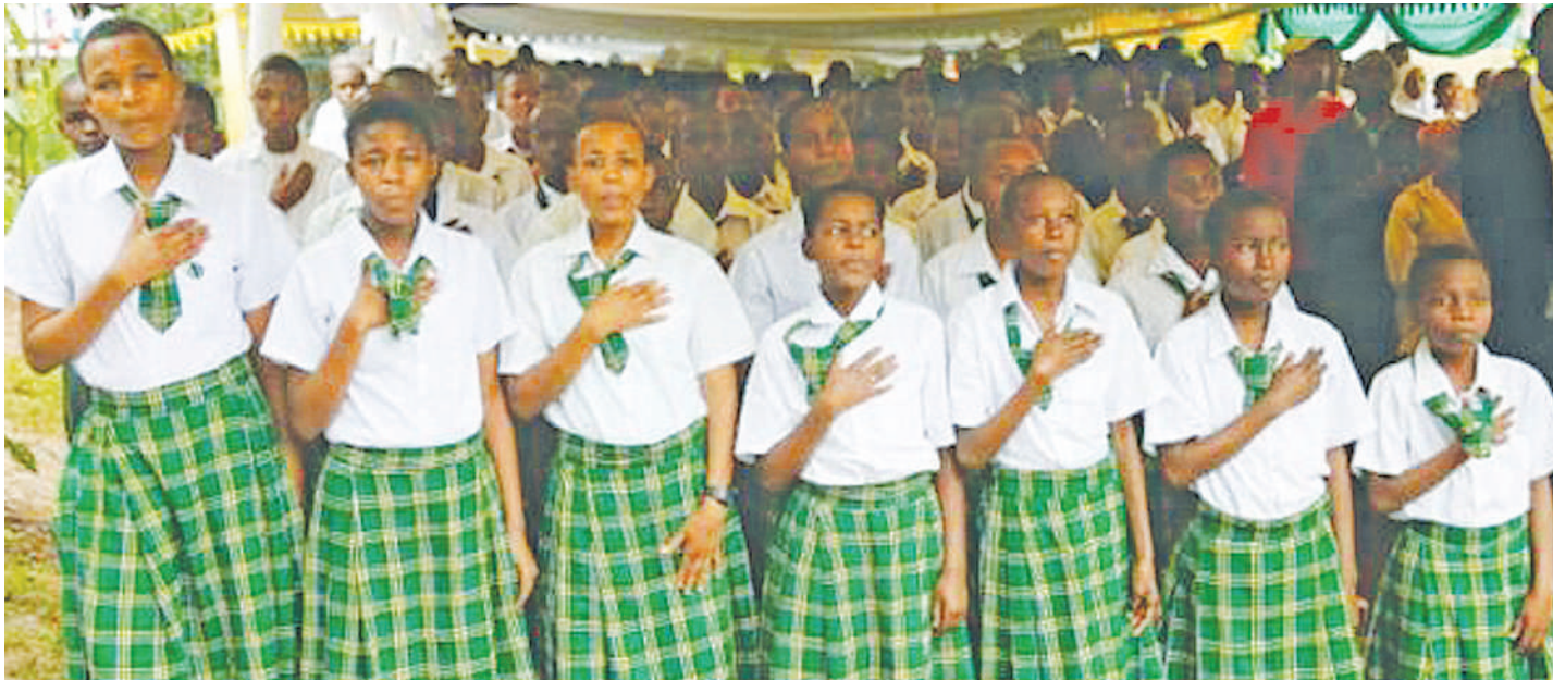
Sehemu ya mabinti masomoni, kundi linalohitaji ulinzi wa kijamii.

•Kukosa ajira nako kunageuza hukumu butu