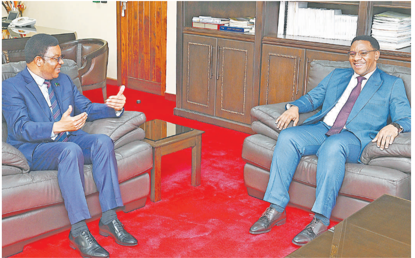
Waziri Mkuu, Kassim Majaliwa akizungumza na Katibu wa Halmashauri Kuu ya CCM Taifa Itikadi na Uenezi, Paul Makonda, ofisini kwake Bungeni jijini Dodoma, jana.