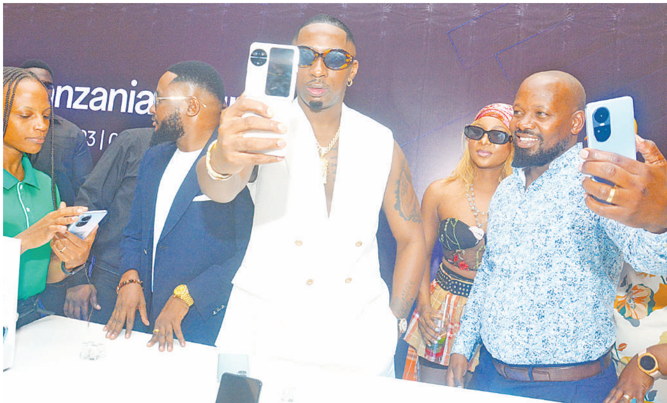
Msanii nyota wa Bongo fleva Jux (katikati) akijipiga selfie wakati wa uzinduzi wa simu mpya jijini Dar es Salaam juzi.

Ni kipigo cha kwanza kwa Mashujaa kwenye uwanja wake wa nyumbani tangu kuanza kwa ligi na sasa imebaki na pointi nane, huku Azam ikikwea hadi nafasi ya tatu ikifikisha pointi 16 kwa mechi nane ilizocheza.