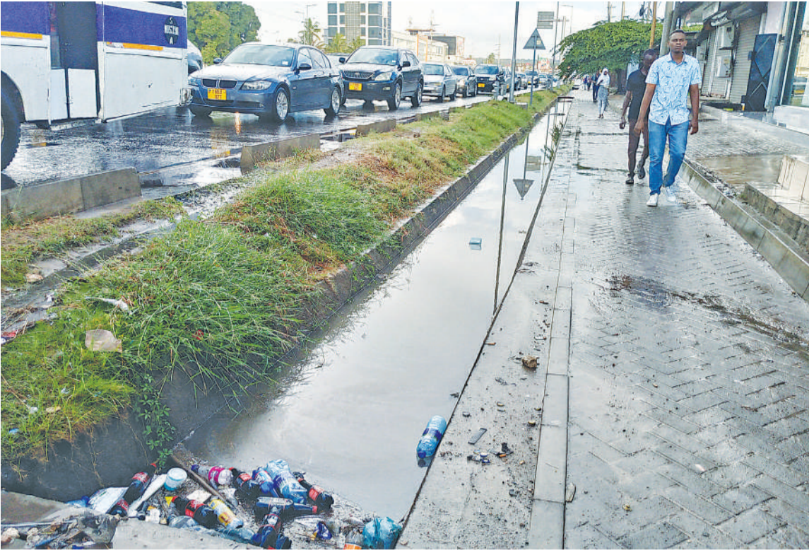
Mtaro ukiwa umeziba na kufanya maji yatuame kando ya Barabara ya Bagamoyo, eneo la Mwenge, baada ya mvua kubwa kunyesha Dar es Salaam jana.