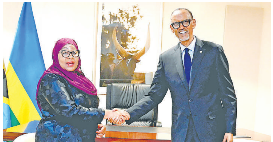
Rais Samia Suluhu Hassan akiwa na Rais wa Rwanda, Paul Kagame baada ya Mkutano wa Kimataifa wa 23 wa Baraza la Utalii Duniani (WTTC), jijini Kigali nchini Rwanda jana.

Mwinyi: Hospitali za Wilaya SMZ kuwapa chakula wagonjwa