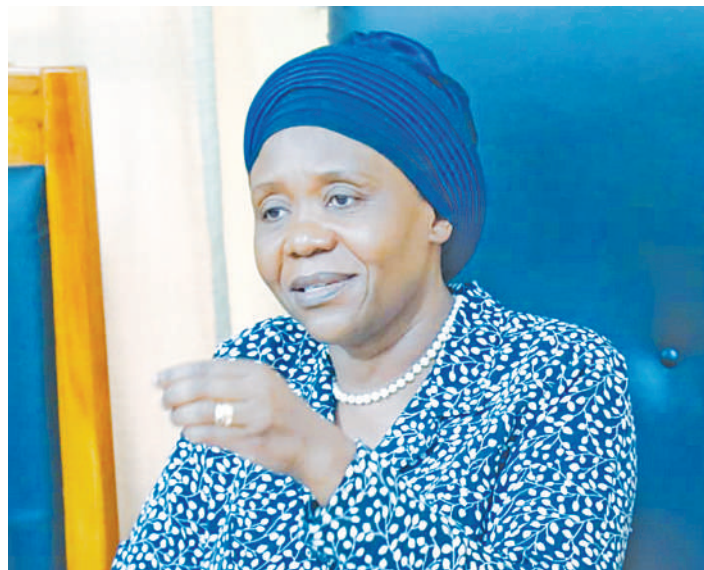
Waziri wa Maendeleo ya Jamii, Jinsia Wanawake na Makundi Maalum, Dk. Dorothy Gwajima.

Dk. Gwajima anasema, serikali inapambana na mila na desturi mbalimbali na bado kuna Watanzania wameshikilia mila na desturi wanazorithi, ambazo hazina faida kwa afya yao na mtoto.