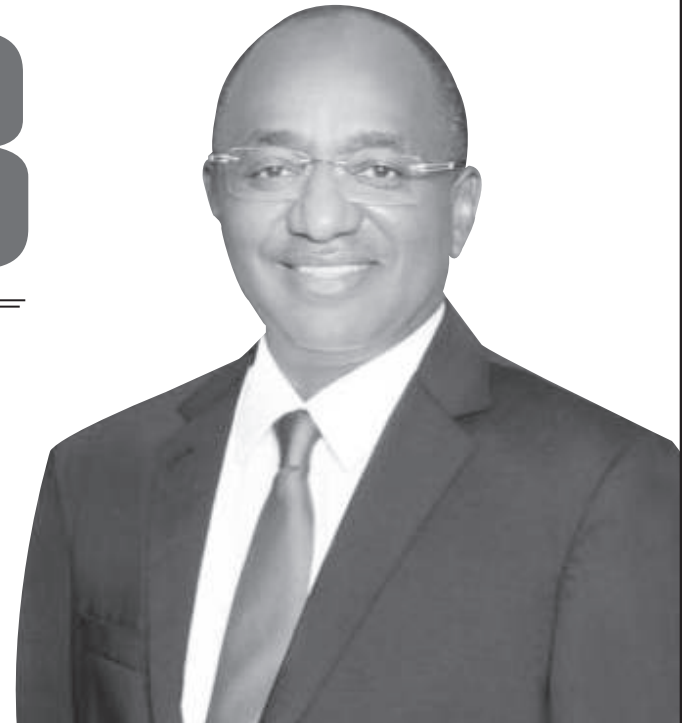
Mheshimiwa Dk. Hussein Ali Mwinyi

ZANZIBAR BILA DAWA ZA KULEVYA INAWEZEKANA