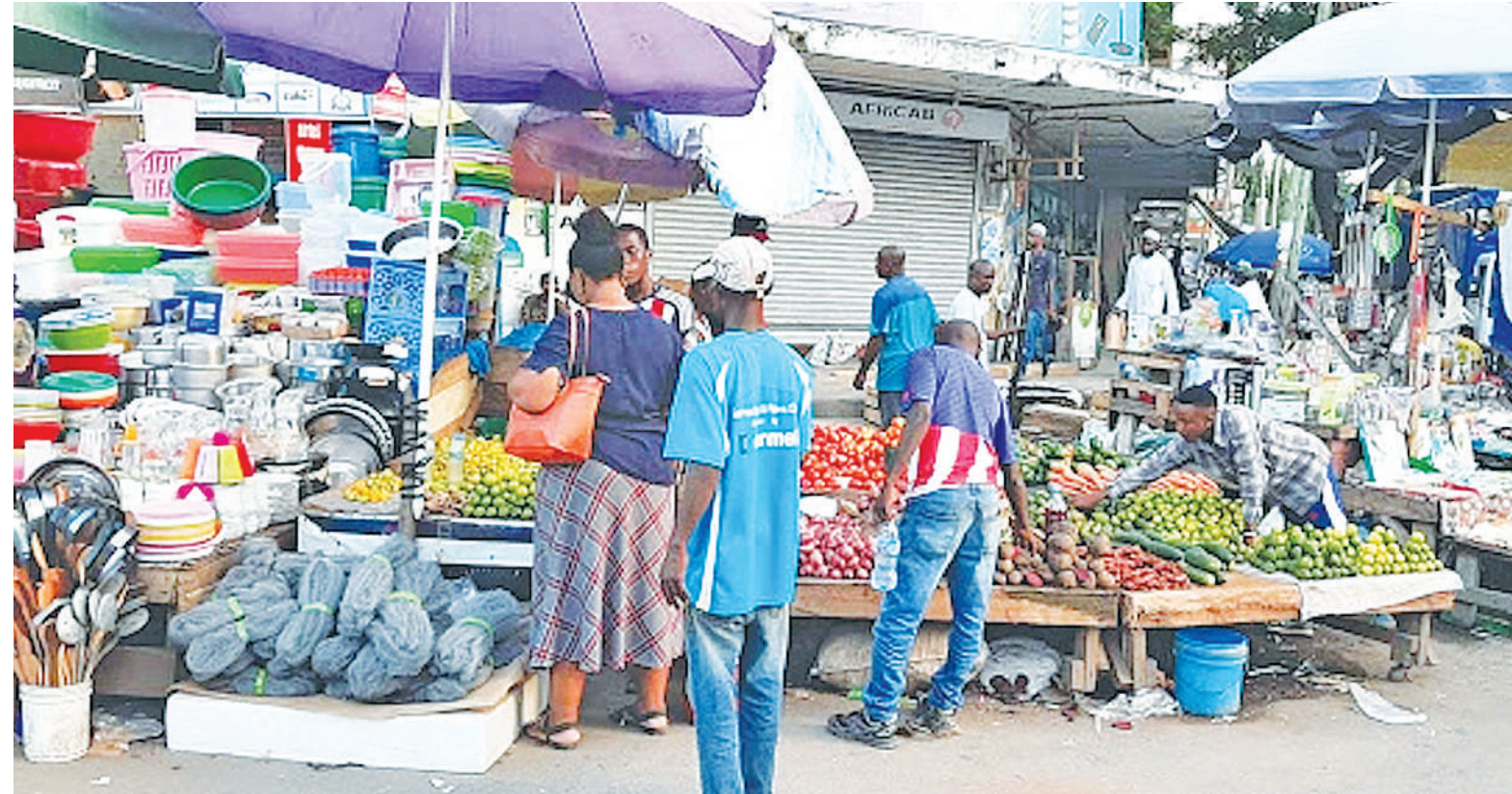
Shughuli za ujasiriamali zikiendelea, Kariakoo Dar es Salaam.

"Wengi wamebadilika, wanaendesha biashara zao kwa kufuta