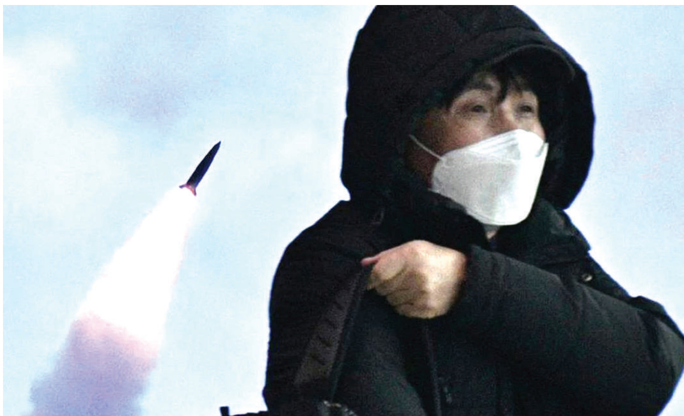
Raia wa Korea ya Kusini akipita karibu na skrini ya runinga inayoonyesha matangazo ya habari yenye kanda ya jaribio la kombora la Korea Kaskazini, kwenye kituo cha reli mji mkuu wa Seoul jana.