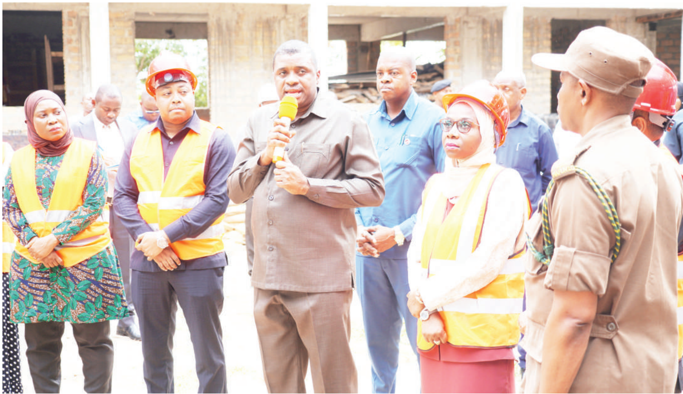
Makamu wa Pili wa Rais wa Zanzibar, Hemed Suleiman Abdulla, akizungumza alipofanya ziara ya kukagua ujenzi wa Shule ya Munduli, Wilaya ya Magharibi "A" jana, inayojengwa kwa fedha za mkopo wa ahueni ya Uviko-19.

Alisema sera ikipatikana kutakuwa na ngao ya kuwalinda wabunifu ambao awali haki zao zilikuwa hazilindwi.