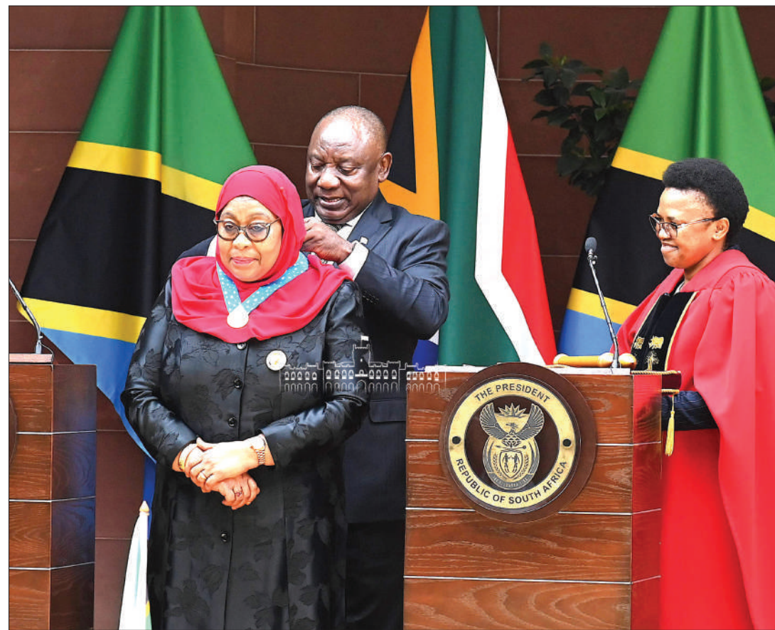
Rais Samia Suluhu Hassan akivalishwa nishani ya heshima kutoka kwa mwenyeji wake, Rais wa Jamhuri ya Afrika Kusini, Cyril Ramaphosa, kabla ya kuzungumza na waandishi wa habari jijini Pretoria jana, katika ziara yake ya kiserikali nchini humo.

WADAU waonya wengi kukosa matibabu kisa... Endelea ukurasa wa 2