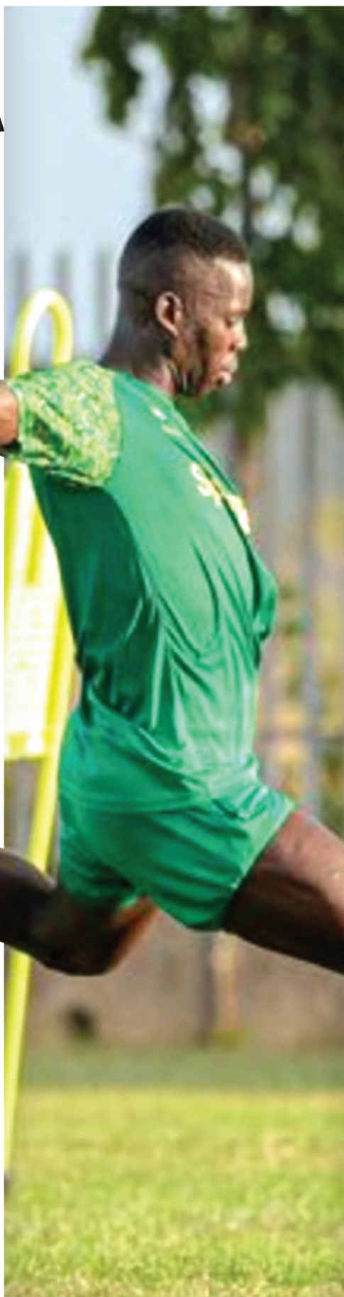
Nyota wa Yanga, Stephanie Aziz Ki.