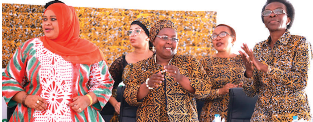
Kinamama wakiwa katika vazi lao la batiki.

Sasa anatoa wito kwa Rais Samia, awe balozi namba moja katika vazi la batiki, alisimaie na kulitumia katika safari zake za nje ya nchi na kubeba kiasi kadhaa, anazotoa zawadi.