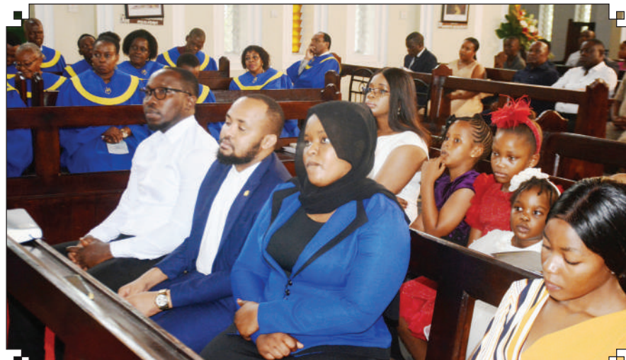
Waumini wakishiriki Ibada ya Pasaka katika Kanisa Kuu Anglikana la Mtakatifu Albano, jijini Dar es Salaam, jana.