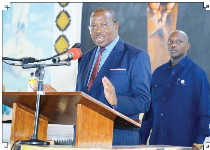
Makamu wa Rais, Dk. Philip Mpango akizungumza na waumini, baada ya kushiriki Ibada ya Pasaka katika Kanisa Katoliki Parokia ya Mtakatifu Mwe-nyeheri Maria Theresa Ledochowska, jijini Dodoma jana.