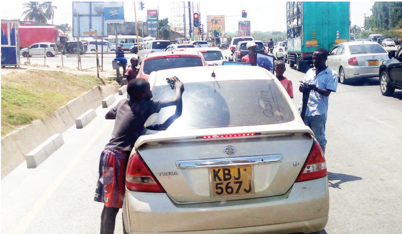
Mtoto mwenye umri unaopaswa kuwa shule, akisafisha kioo cha gari katika Barabara ya Bagamoyo, eneo la Mwenge Dar es Salaam hivi karibuni, ili ajipatie riziki. Mamlaka zinazohusika zinatakiwa kuchukua hatua kutokana na ongezeko kubwa la watoto wa mitaani.

Kamanda aliwaasa wananchi kijiji hicho wanapokabiliwa na matatizo wafike kwenye uongozi wa kijiji kutafuta namna ya kulitatua, na sio kubaki nalo rohoni na kusababisha kuchukua maamuzi ambayo hugarimu maisha yao.