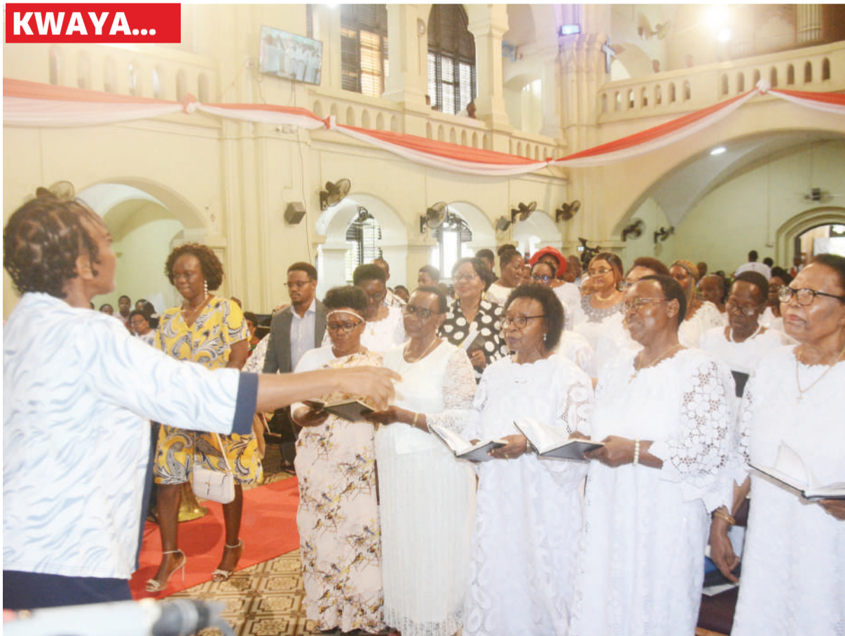
Wanakwaya wa Kanisa la Kiinjili la Kilutheri Tanzania (KKKT), Dayosisi ya Mashariki na Pwani, wikiimba wakati a Ibada ya Pasaka, katika Kanisa la Azania Front jijini Dar es Salaam jana.