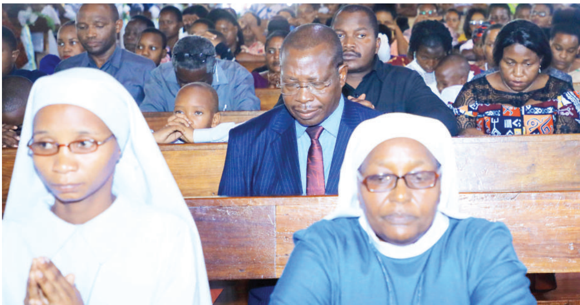
Makamu wa Rais, Dk. Philip Mpango akishiriki Ibada ya Jumapili ya Sikukuu ya Pasaka, katika Kanisa Katoliki Parokia ya Mtakatifu Mwenyeheri Maria Theresa Le-dochowska, jijini Dodoma jana.