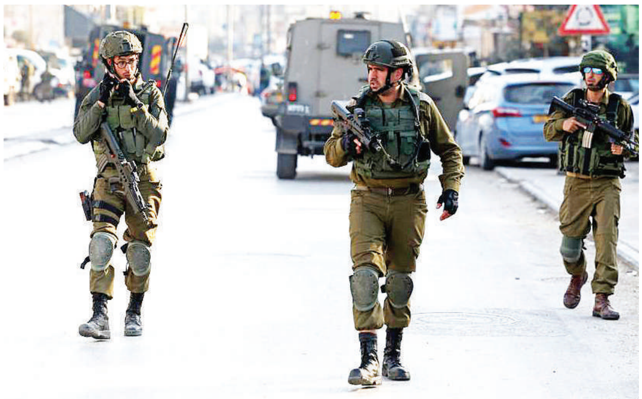
Vikosi vya usalama nchini Israel vikiwa katika doria kwa lengo la kuimarisha usalama kutokana na uwepo wa matukio ya mashambulizi ya kushtukiza katika eneo la Ukingo wa Mashariki na Ukanda wa Gaza.

Hata hivyo inabainishwa kuwa kwa miezi kadhaa sasa, watu wenye silaha wamekuwa wakiwateka wananchi Kaskazini Magharibi mwa nchi hiyo, huku katika miaka ya hivi karibuni, vitendo hivyo vikitelezwa na makundi ya kigaidi ya Kiislamu. RFI