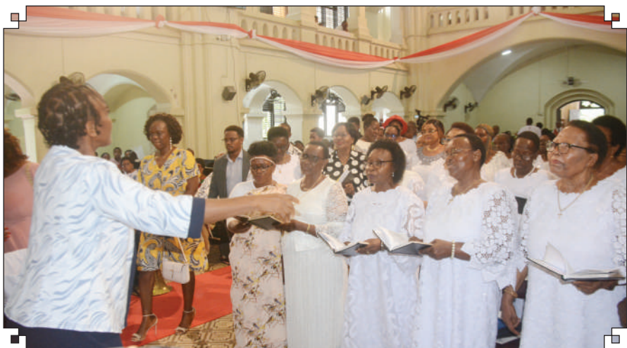
Wanakwaya wa Kanisa la Kiinjili la Kilutheri Tanzania (KKKT) Dayosisi ya Mashariki na Pwani, wakiimba wakati wa Ibada ya Pasaka, katika Usharika wa Azania Front, jijini Dar es Salaam., jana.