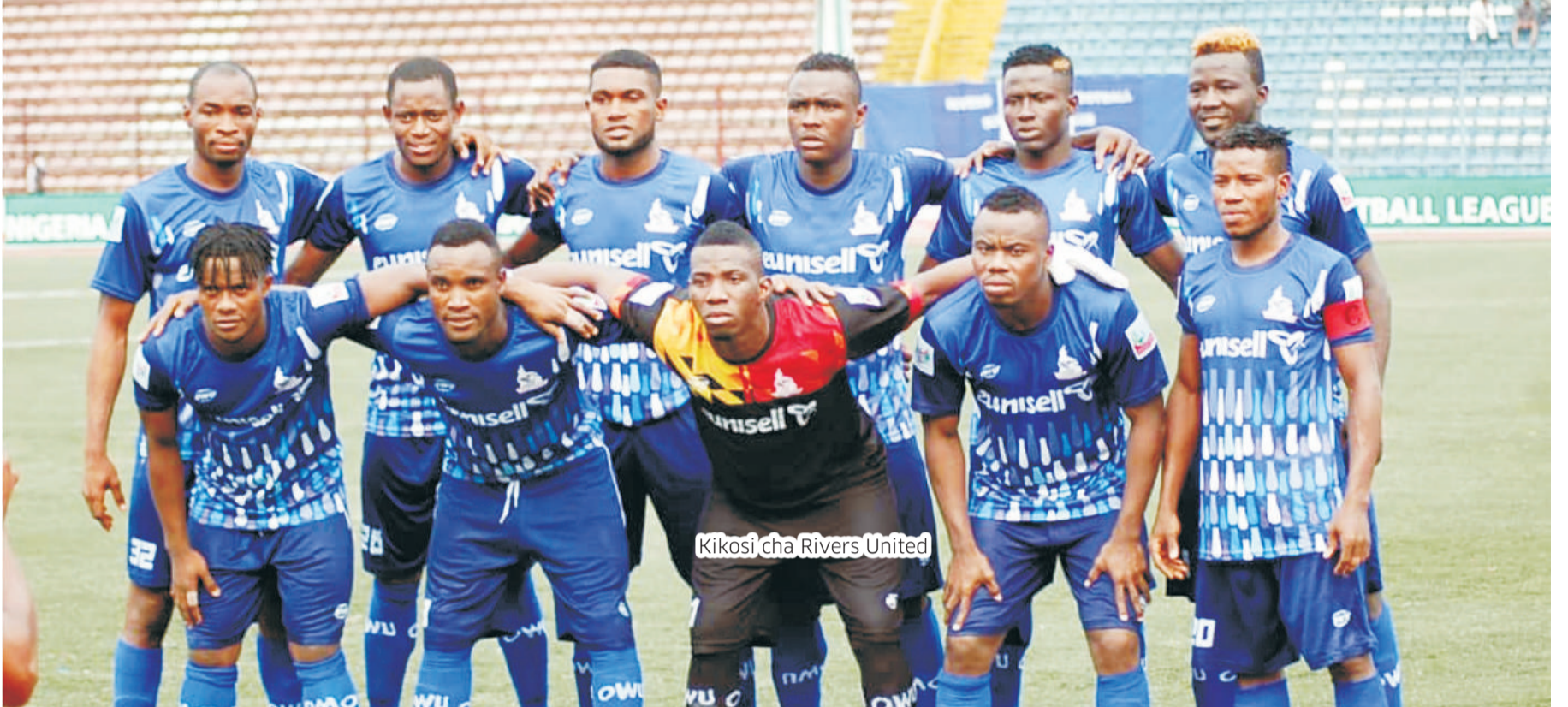
Kikosi cha Rivers United