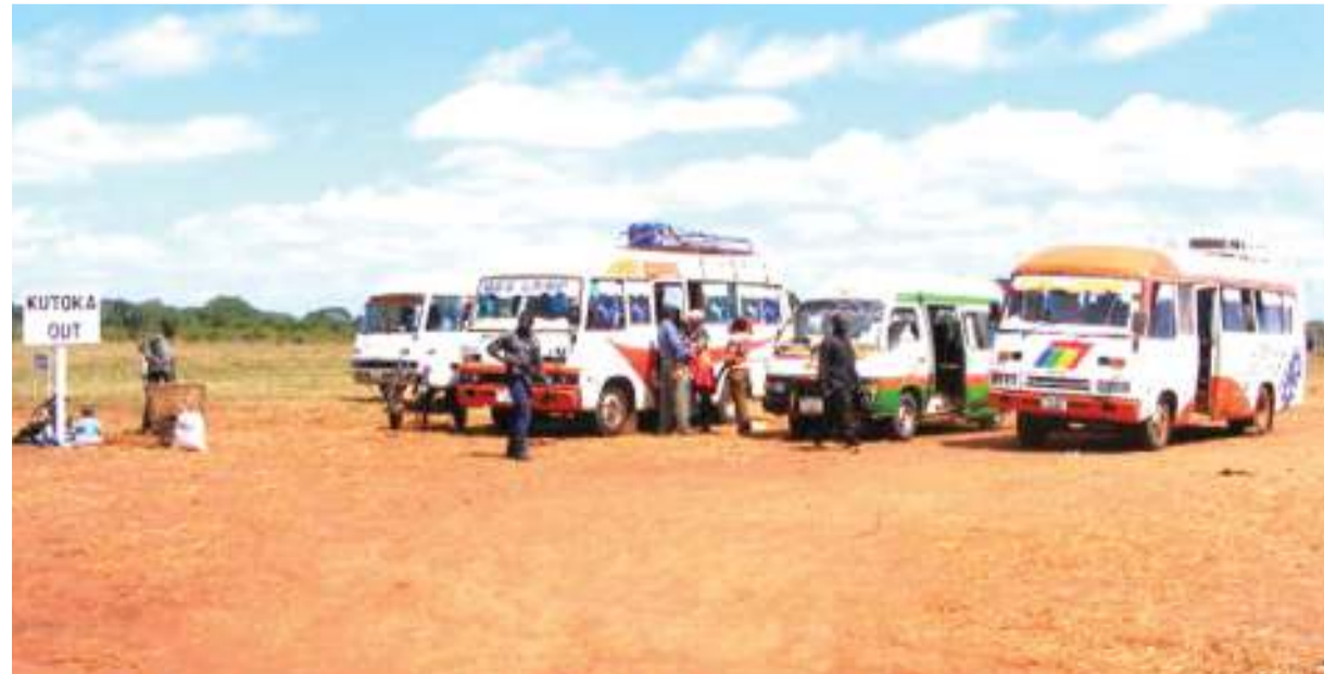
Baadhi ya mabasi yanayoenda safari fupi yakiwa katika stendi mpya.

"Bado ni mapema mno, ndio maana baadhi ya abiria wanalalamika, lakini nina uhakika watazoea tu, kwani maeneo mengi hapa nchini stendi zimejengwa nje ya mji ili kupisha shughuli nyingine za maendeleo," anasema.