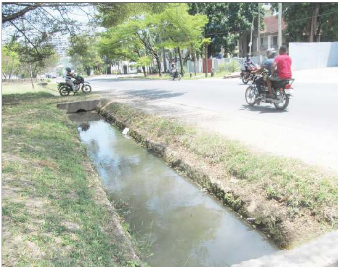
Maji yakiwa yametumama kwenye moja ya mitaro ya barabara za Mikocheni, jijini Dar es Salaam, juzi, baada ya mtaru kuziba, hali ambayo inaweza kuwa ni mazalia ya mbu na kuhatarisha afya za wakazi wa maeneo hayo.

Alisema suala la kuchukua hatua kwa watoto waliopata mimba linahitaji mikakati zaidi kwani licha ya kuwa wao wamekuwa wakiitoa, lakini linahusu zaidi udugu na mahusiano kwa sababu wengi wao wamekuwa wakimalizana nje ya sheria kwa kuzingatia maisha yao ya baadaye.