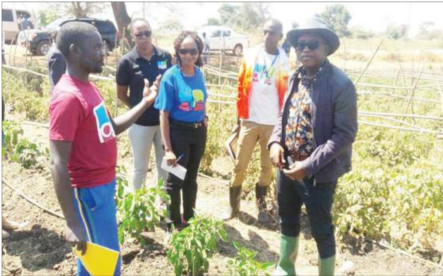
Naibu Waziri wa Nchi Ofisi ya Waziri Mkuu, Vijana na Ajira, Anthony Mavunde, akitembelea miradi ya kilimo na ufugaji inayoendeshwa na vijana katika vijiji vya wilaya za Babati mkoani Manyara na Kondo mkoani Dodoma.

"Chama cha Waandishi wa Habari Wanawake Tanzania (Tamwa-Zanzibar) waliotupa mafunzo ya utengenezaji wa mikoba, sabuni, kilimo, ufugaji na ushonaji, ili tuweze kujikomboa na tunashukuru, ingawa soko bado linatutataza," alisema.