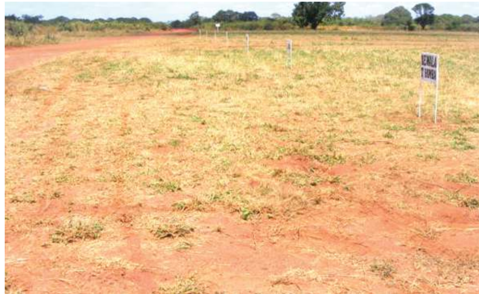
Stendi mpya ya mjini Nachingwea na mandhari yake.