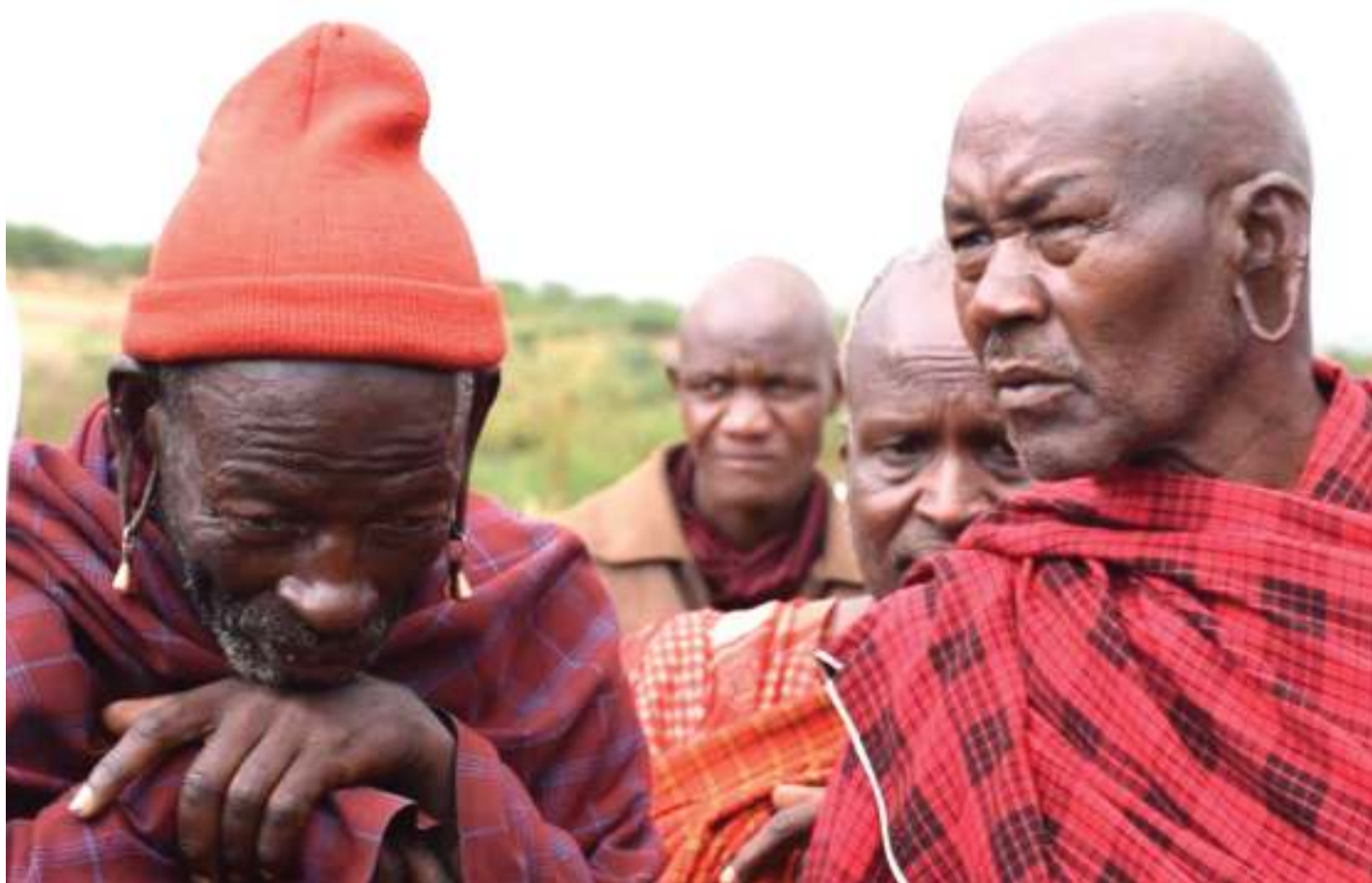
Baadhi ya wafugaji jamii ya kabila la Wamasai, wakimsikiliza Naibu Waziri wa Mifugo na Uvuvi, Abdalla Ulega (hayupo pichani).