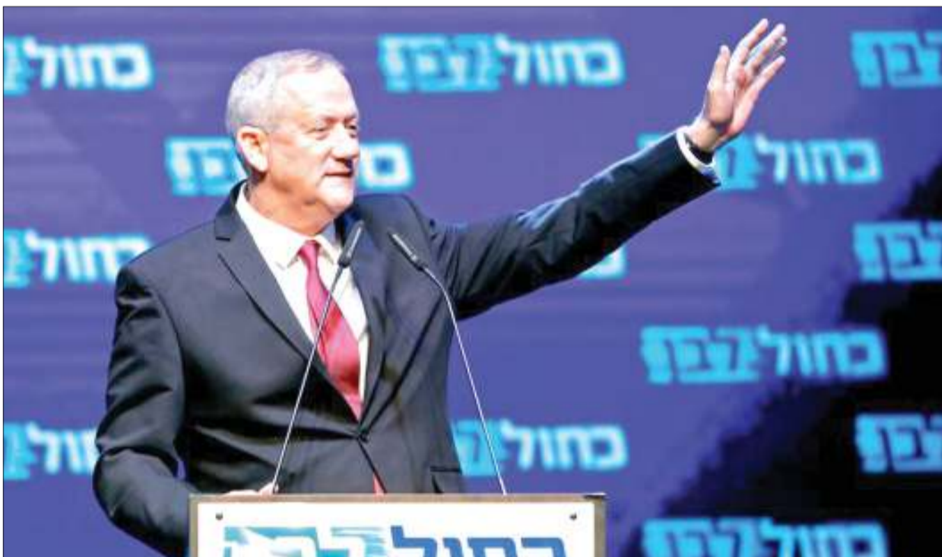
Kiongozi wa Chama cha Bluu na Nyeupe nchini Israel, Benny Gantz, akiwahutubia wafuasi wake.

Kwa upande wake Netanyahu alisisitiza kuwa wakati wa kampeni za uchaguzi, alipendelea juu ya kuundwa serikali kati ya chama chake na chama cha mpinzani wake Gantz kwa sababu taifa linawategemea kuonyesha mfano bora wa uwajibikaji na kwamba wanaweza kushirikiana. DW