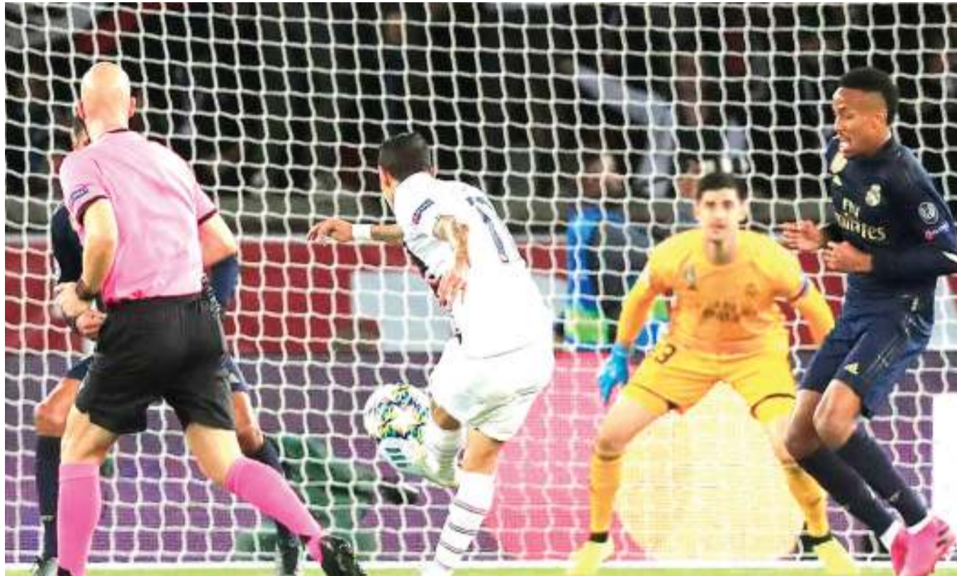
Mshambuliaji wa Paris Saint-Germain, Angel Di Maria (katikati), akifunga bao katika mechi ya Kundi A Ligi ya Mabingwa Ulaya dhidi ya Real Madrid iliyochezwa kwenye Uwanja wa Parc des Princes jijini Paris, Ufaransa juzi usiku. Madrid ilichapwa mabao 3-0.