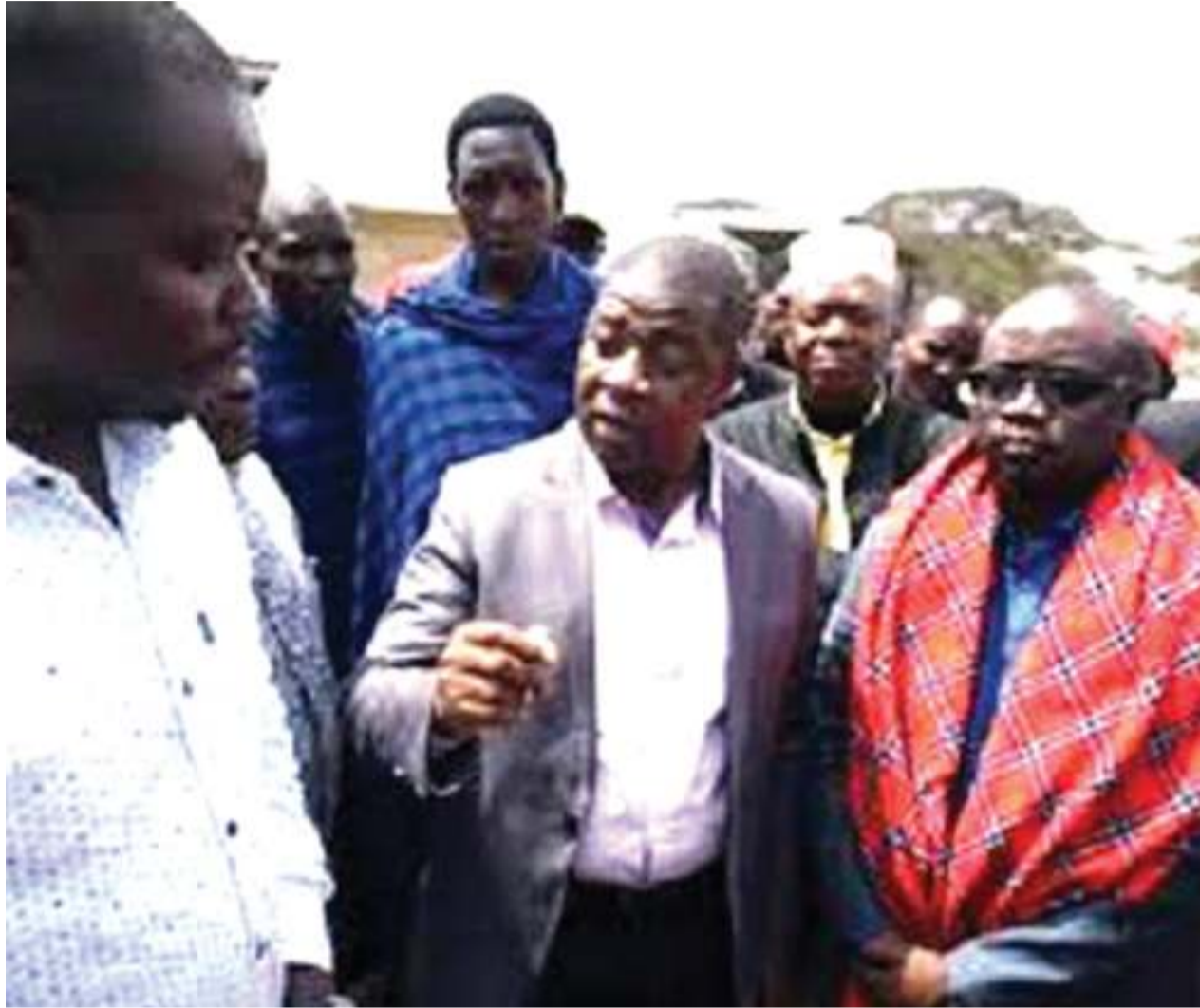
Naibu Waziri wa Mifugo na Uvuvi, Abdallah Ulega (katikati), akizungumza na wafanyabiashara wa mifugo katika Wilaya ya Longido.

Anasema, kuwapo tozo rafiki kutawashawishi hata wafanyabiashara kutoka nchi jirani, kufuata mifugo na kuinunua katika sehemu rasmi ambayo pia itaiwezesha serikali kuingiza mapato yatokayo na ushuru.