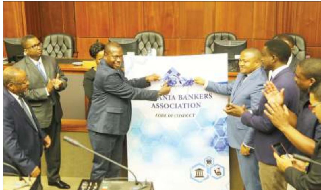
Waziri wa Fedha na Mipango, Dk. Philip Mpango (kushoto) na Mwenyekiti wa Chama cha Benki nchini, Abdulmajid Nsekela, akikata utepe kuzindua kanuni mpya kwa benki jijini Dar es Salaam jana. Wengine ni Waziri wa Viwanda na Biashara, Innocent Basungwa (kulia) na Gavana wa Benki Kuu, Prof. Florence Luoga.

“Napenda kukuahidi kuwa Benki Kuu itaendelea kuvisimamia vyombo vya fedha, ili kuhahakisha kuwa huduma kwa wateja zinazingatia tija, weledi na maadili bora,” alisema.