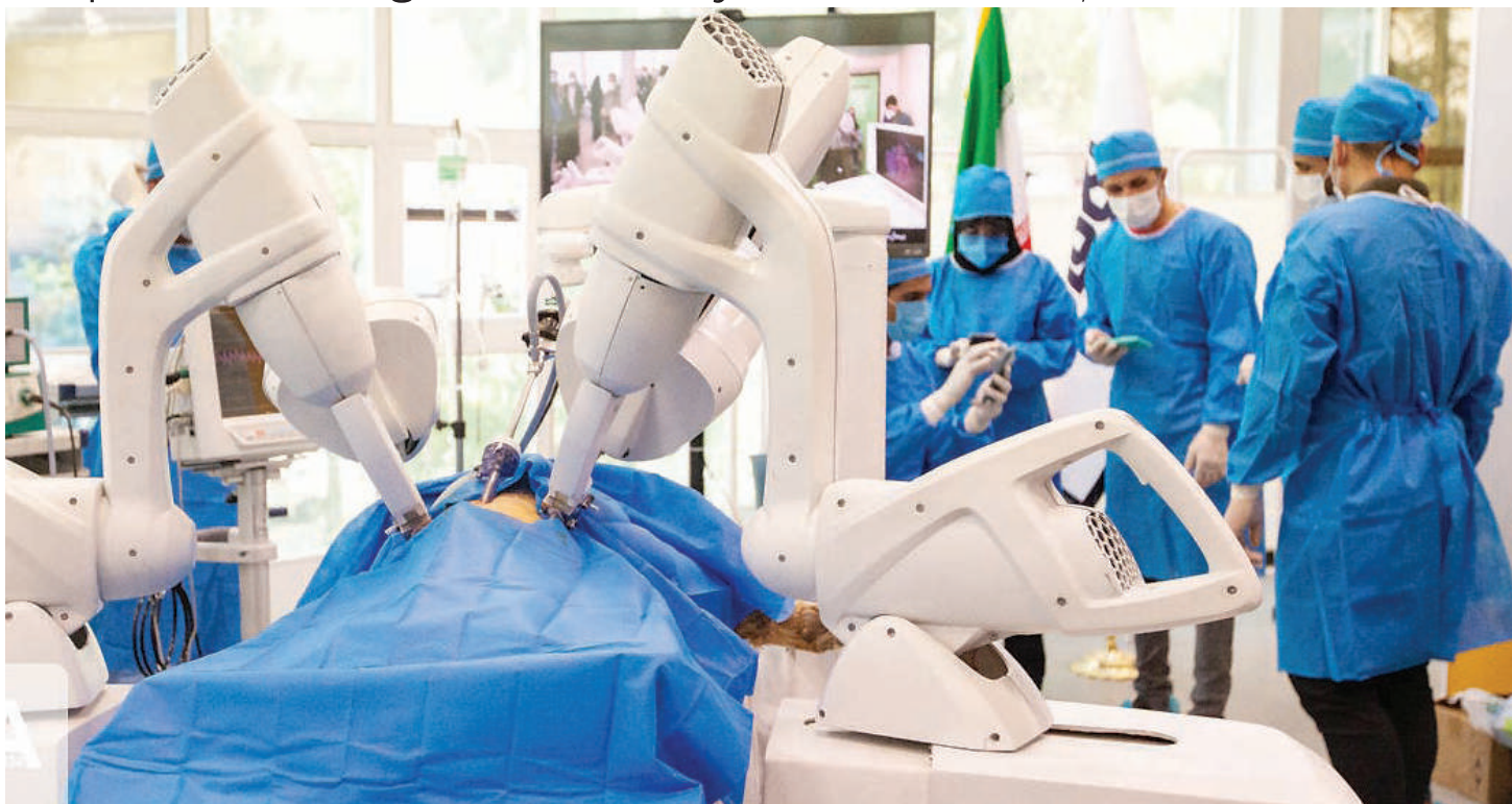
Robo dokta akiwa kazini, ni mashine za roboti zinazofanyakazi katika chumba cha upasuaji kufanikisha operesheni mbalimbali.

• Operesheni ngumu huifanya kwa weledi, ufanisi mkubwa