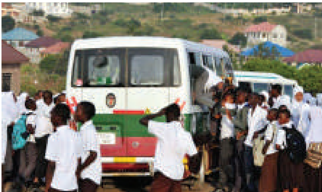
Baadhi ya wanafunzi wakitaftuta usafiri.

“Wiki hii tumepanga kukutana na wamiliki wa daladala, vyama