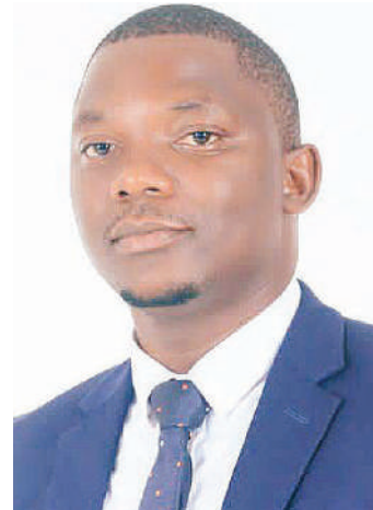
Mkuu wa Idara ya Huduma ya Usafiri kwa Wanafunzi kutoka CHAKUA Adinani Mbezi.

“Kwenye shule hizo nako kuna kero zake zikiwamo za wanafunzi kujazana kwenye mabasi na wengine kubebana, hali ambayo si salama kwao, hivyo tumeona