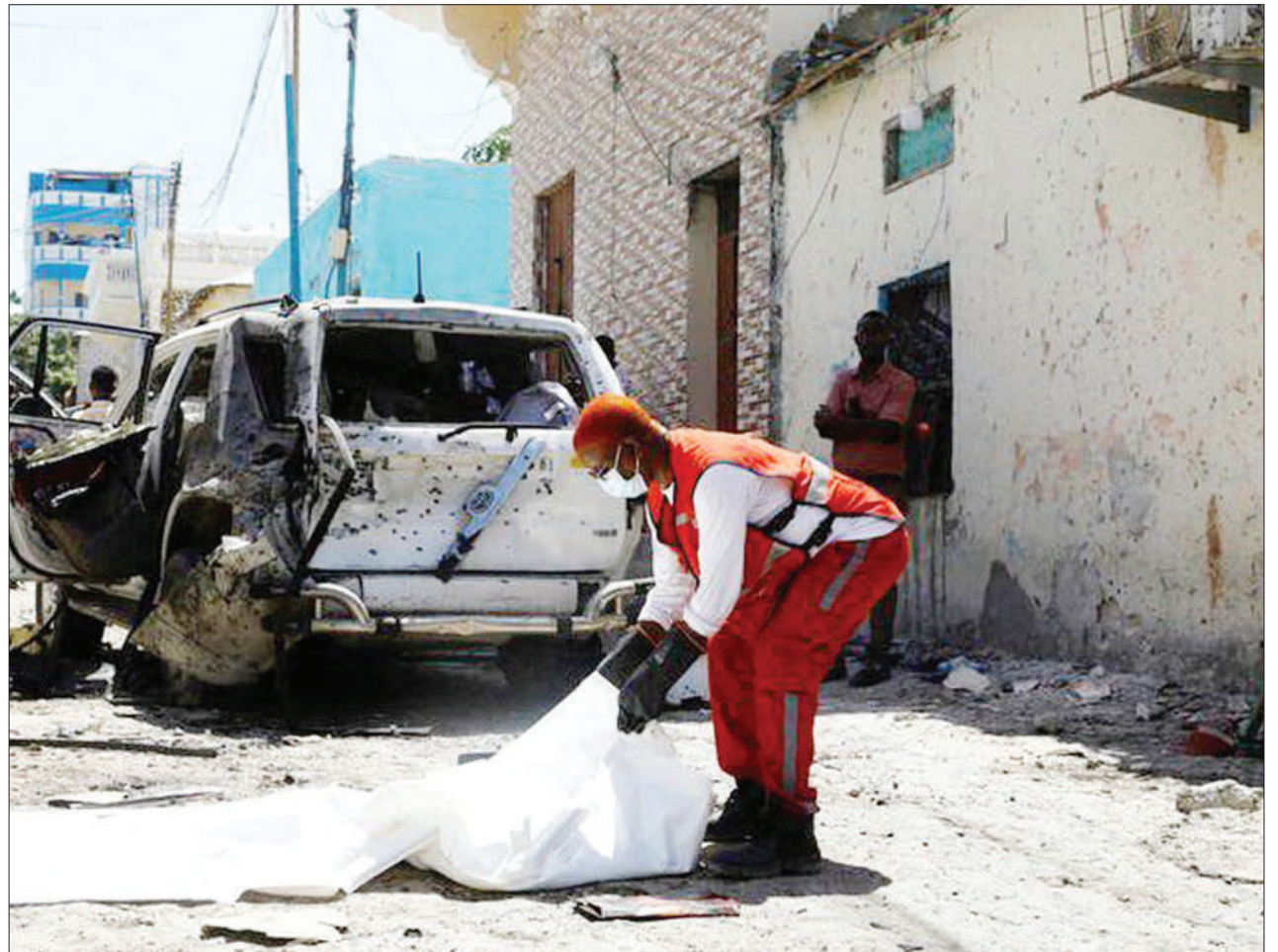
Mtoa huduma akiweka mwili katika mfuko baada ya mlipuko wa bomu kutokea eneo la Mogadishu, juzi na kuua watu kadhaa, nchini Somalia.