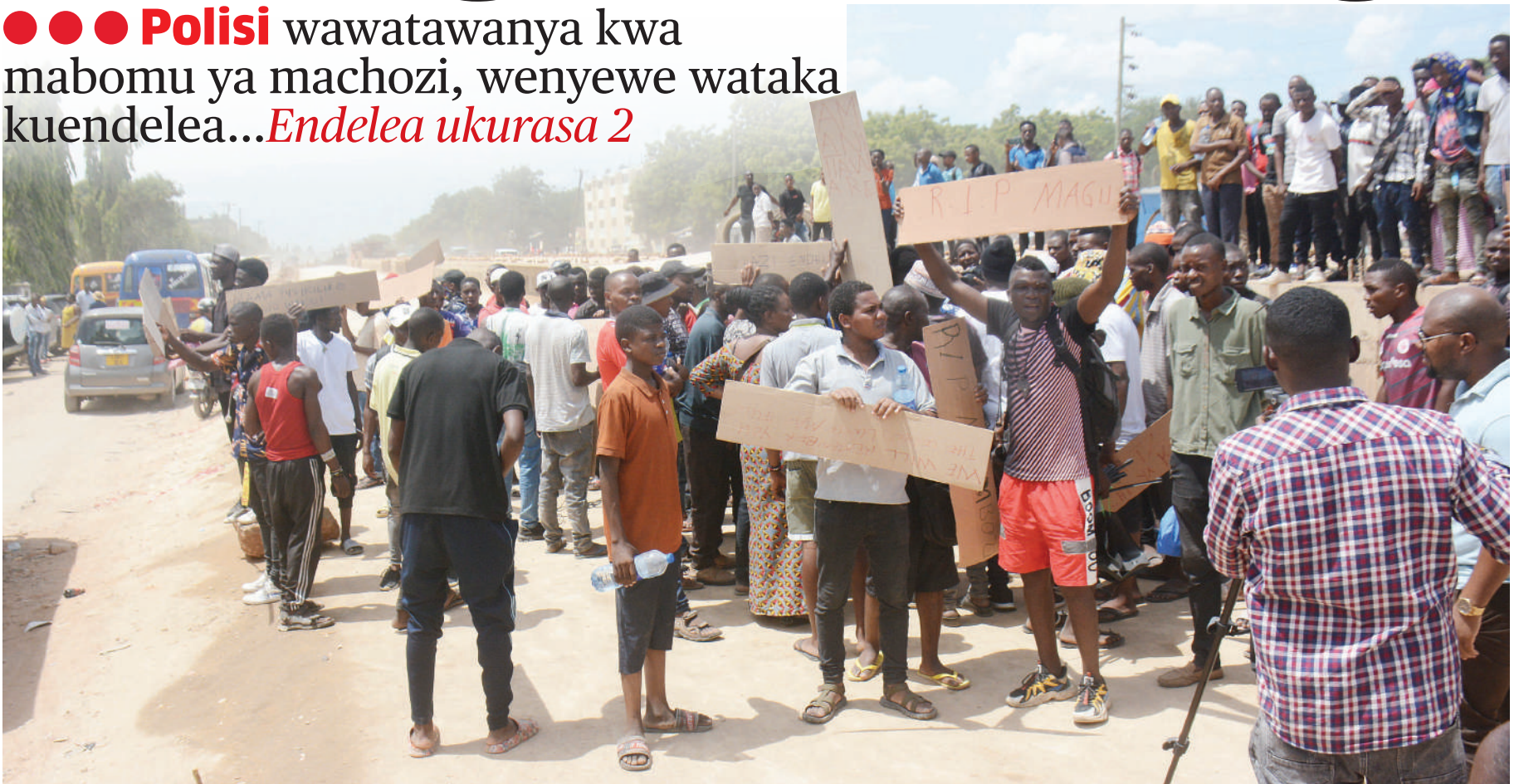
Baadhi ya wafanyabiashara wa Soko la Ilala Mchikichini lililoteketea kwa moto wakiwa na mabango yao, wakitaka kujenga mabanda wenyewe ili waendelee na biashara kabla ya kutawanywa na Polisi wa Kikosi cha Kutuliza Ghasia, jana.

●●● Polisi wawatawanya kwa mabomu ya machozi, wenyewe wataka kuendelea... Endelea ukurasa 2