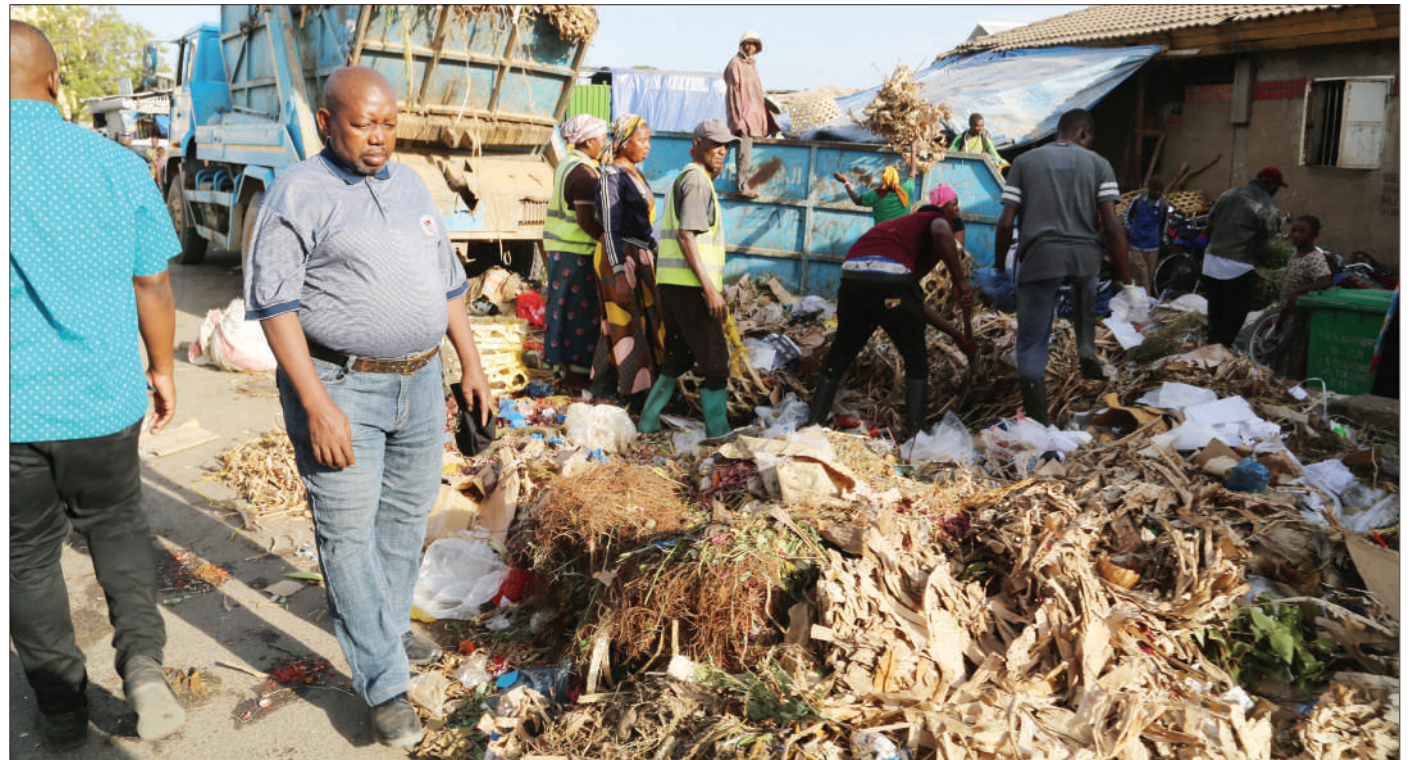
Uongozi wa Halmashauri ya Jiji la Dodoma ukiendelea na uzoaji wa taka nje ya soko kuu la Majengo jana, ikiwa ni utekelezaji wa agizo la Makamu wa Rais Dk. Philip Mpango, kuhakikisha maeneo yote ya mji yanakuwa safi.

Alifanua kuwa jukumu la kanisa halikomei ndani ya ‘kuta nne’ bali linapaswa kuwa na jukumu la kuunganisha na kuhudumia jumuiya nzima na taifa kwa ujumla kupitia kuhubiri neno la kweli ya Mungu.