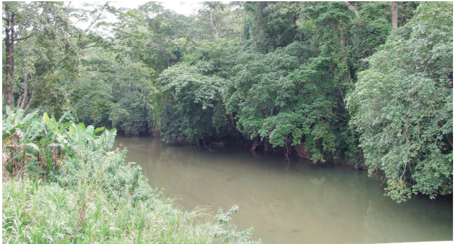
Misitu ni makazi ya wanyama, vyanzo vya maji na dawa. Miti na mimea ni malighafi zinazozalisha dawa.

Misitu ni uhai kwa maana hewa safi ya 'oksijeni' kila mtu anayavyovuta kila siku inatokana na misitu au miti. Binadamu anapopumua hutoa gesiukaa (CO 2 ) na miti huitumia na kutoa 'oksijeni' (O 2 ) ambayo ni msingi wa uhai wa kila mtu.