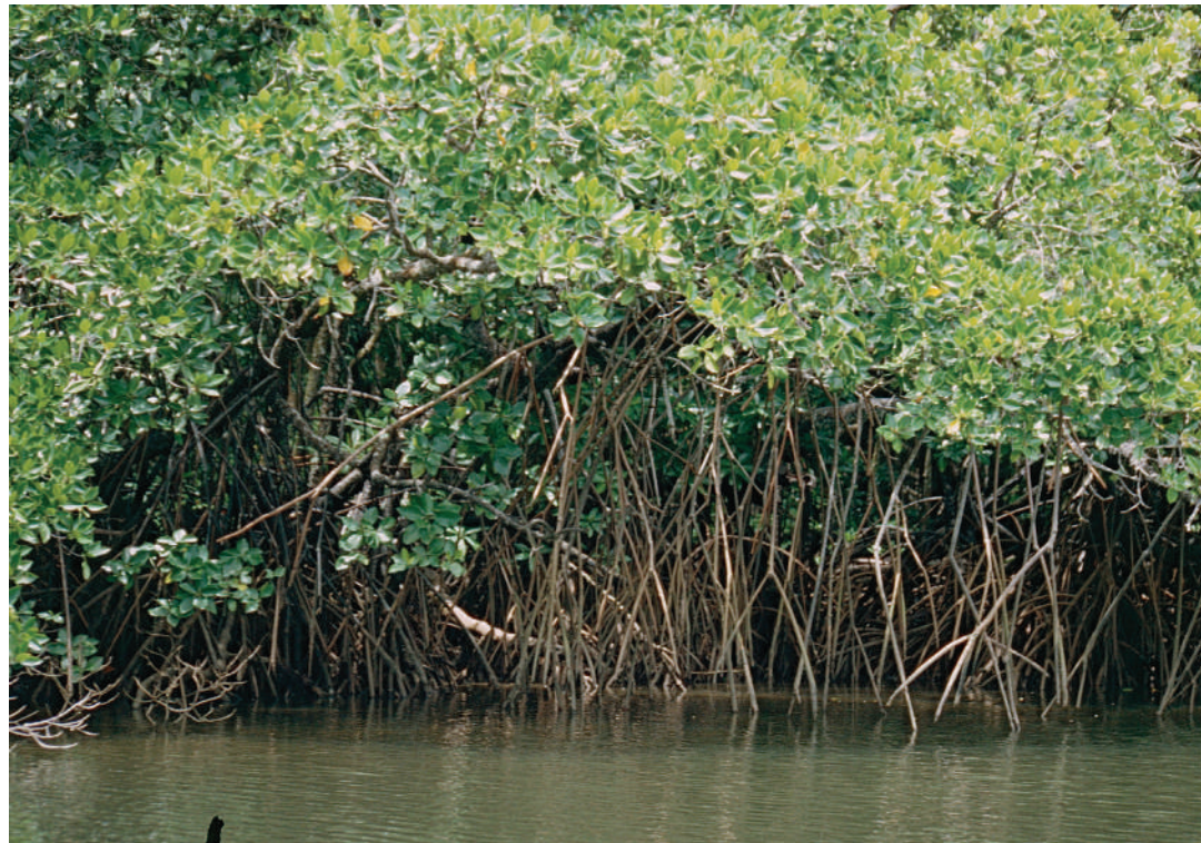
Mikoko inapunguza kasi ya tsunami na vimbunga baharini, kuikata ni kuhatarisha maisha wakati huu wa mabadiliko ya tabianchi.

Ni chanzo cha hewa safi angani na ardhini, huzuia dhoruba baharini, hasa mikoko ndiyo inayodhibiti mawimbi ya tsunami na vimbunga yasifike mbali na kusababisha madhara kwa binadamu na uwekezaji ukanda wa pwani au ufukweni. Ndiyo inayopunguza joto duniani na kitaalamu huitwa mapafu ya dunia hasa ya Amazoni iliyoko