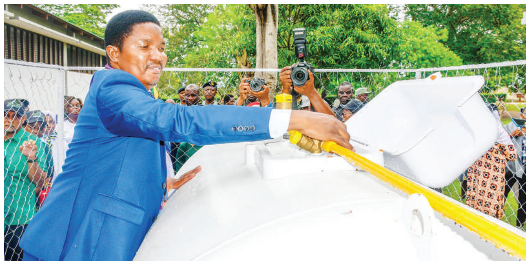
Waziri wa Nchi Ofisi ya Makamu wa Rais (Muungano na Mazingira), Dk. Selemani Jafo, alipozindua mtambo wa gesi ya kupikia katika Shule ya Sekondari ya Wasichana Ruvu wilayani Kibaha, mkoani Pwani, Aprili 19 mwaka huu.

Waziri huyo alisema serikali kupitia Mradi wa Umeme Vijijini (REA), inaendelea kutekeleza programu inayowezesha kupatikana nishati safi ya kupikia na katika mchango wake, REA inawezesha usambazaji na kupatikana mitungi bora ya gesi kutoka sekta binafsi.