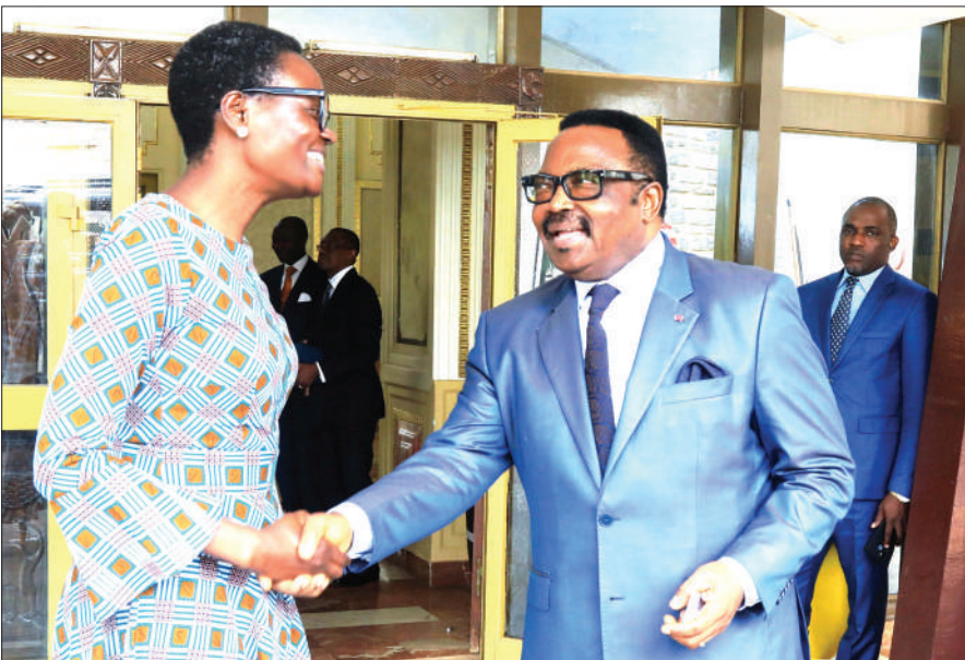
Spika wa Bunge, Dk. Tulia Ackson akisalimiana na Waziri wa Mambo ya Nje wa Cameroon, Felix Mbayu alipotembelea ofisini kwake, jijini Yaounde nchini Cameroon jana.