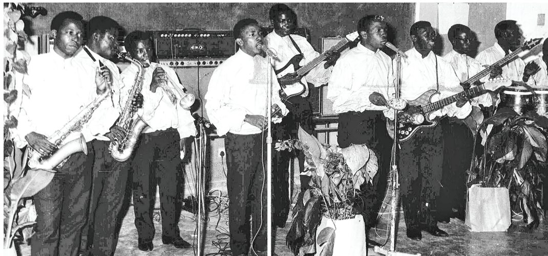
Wanamuziki wa bendi ya Nuta Jazz 'Msondo Ngoma', ambayo baadaye ilijulikana kama Juwata Jazz, Ottu Jazz na Msondo Ngoma Music band wakiwa jukwaani mwishoni mwa miaka ya 1970.

Kutokana na bendi nyingi kupiga kwenye kumbi mbalim-