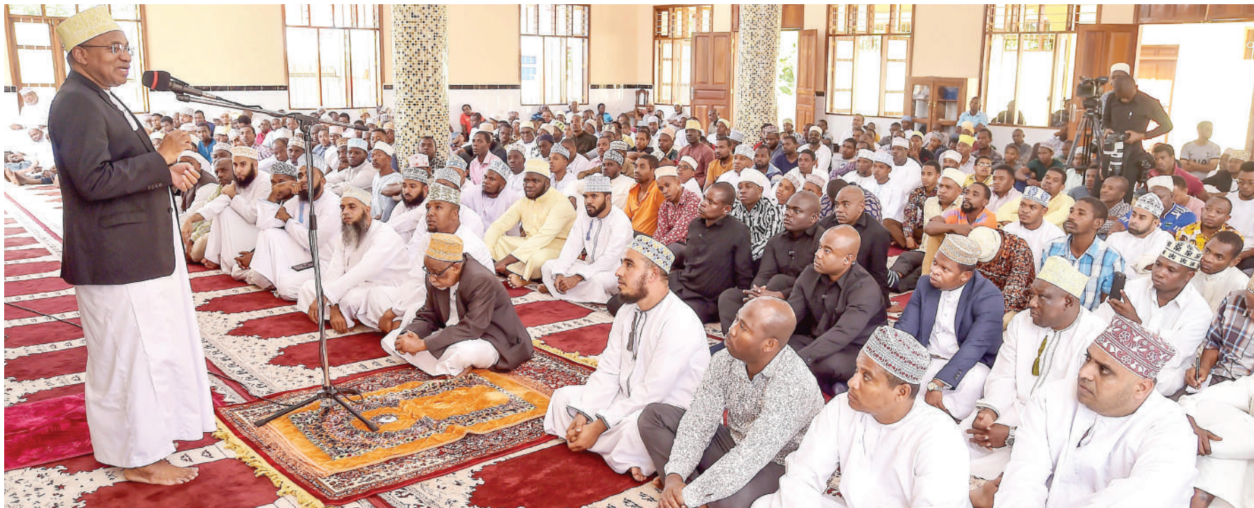
Rais wa Zanzibar, Alhajj Dk. Hussein Ali Mwinyi akizungumza na waumini wa dini ya Kiislam, baada ya kumalizika kwa Ibada ya Sala ya Ijumaa katika Masjid Imam Abu Ubaida Muslim Bin Abii Kareema Al Tamimi Fuoni, wilayani Magharibi "B" Unguja jana.