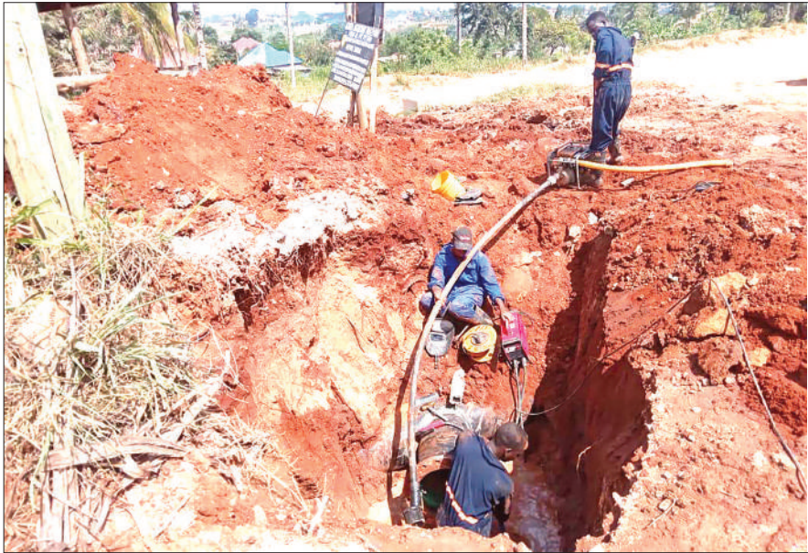
Mafundi wa Mamlaka ya Majisafi na Usafi wa Mazingira Dar es Salaam (DAWASA), wakiboresha huduma ya majisafi katika Kata ya Kwembe, Ubungo mkoani Dar es Salaam jana, kupitia mpango maalum wa kutatua changamoto ya msukumo mdogo wa maji na ukosefu wa huduma kwa baadhi ya maeneo.