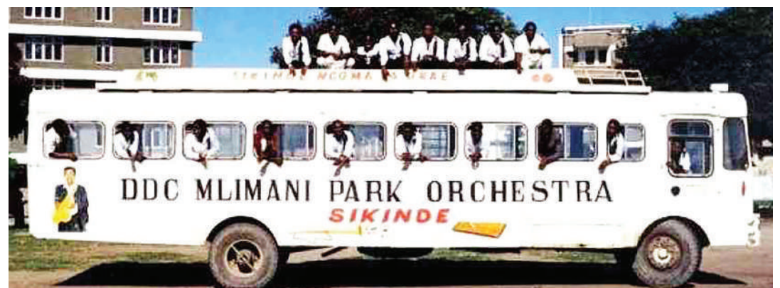
Basi lililokuwa likitumiwa na wanamuziki wa bendi ya DDC Mlimani Park Sikiinde Ngoma ya Ukae enzi hizo kupeleka kwenye maonyesho na kuwarudisha majumbani.

Bendi ziligawana mashabiki. Kuna zilizojaza sana. na zingine zilizopata mashabiki wa wastani. Lakini bendi karibu zote zinapata mashabiki. Hii ndiyo Dar iliyoyokuwa ikichemka kama bahari kama alivyoimba King Kiki.