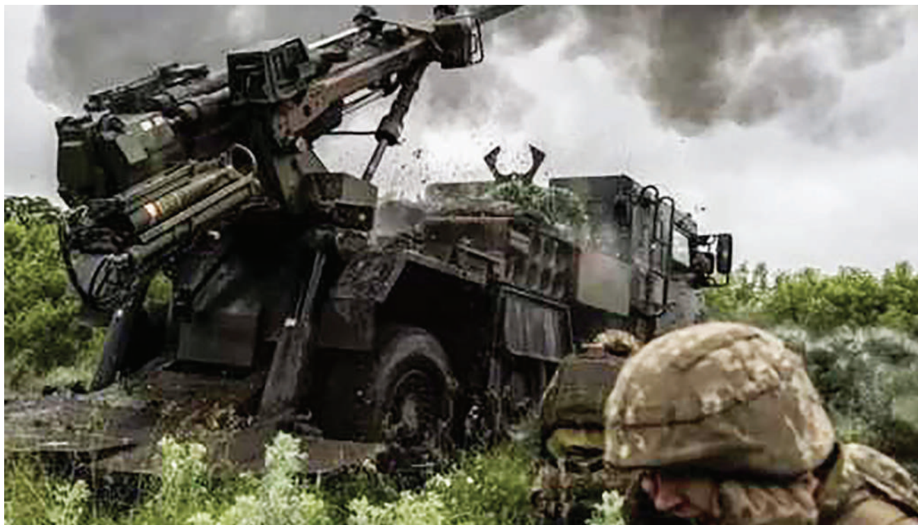
Moja ya mtambo wa kurushia makombora ya Cluster uliipelekwa nchini Ukraine hivi karibuni.