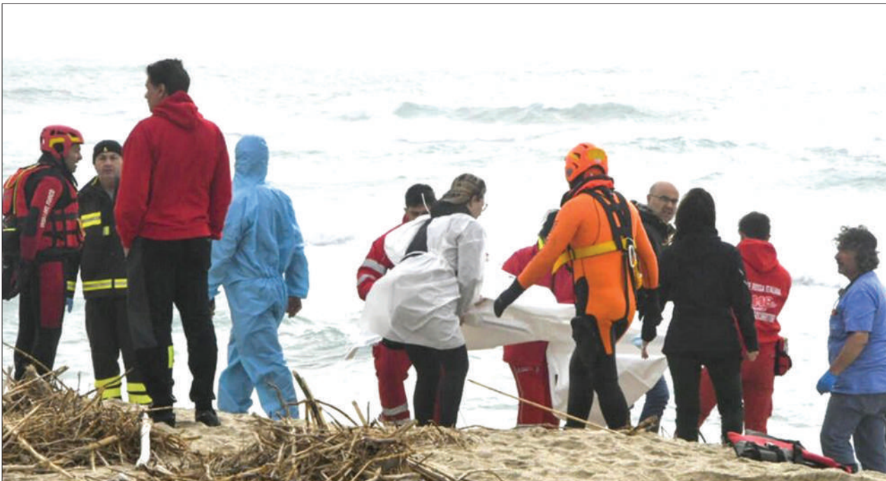
Waokoaji wakiokoa mwili kwenye fukwe karibu na Cutro, kusini mwa Italia baada ya boti lililokuwa limebeba wahamiaji kuzama baharini jana.