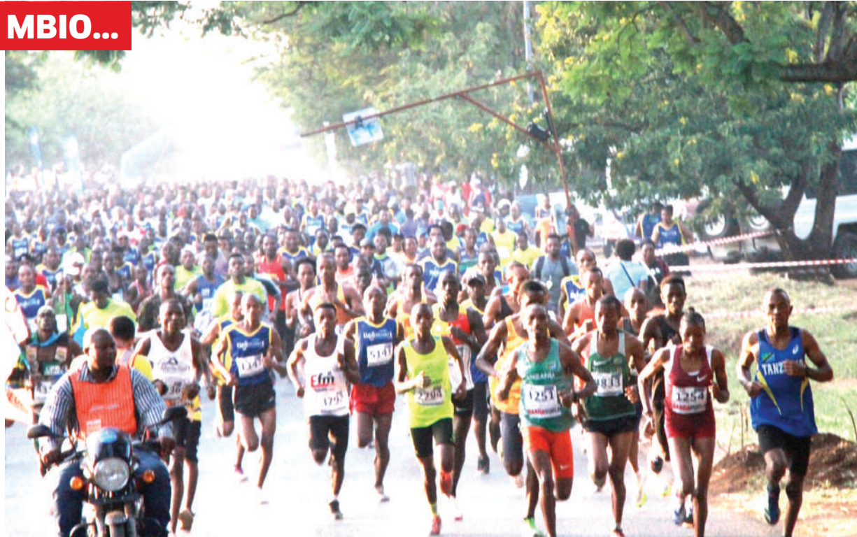
Washiriki wa mbio za tiGO Half Marathon (kilomita 21), wakianza mbio hizo katika mashindano ya Kilimanjaro Marathon yaliofanyika Moshi mkoani Kilimanjaro juzi.