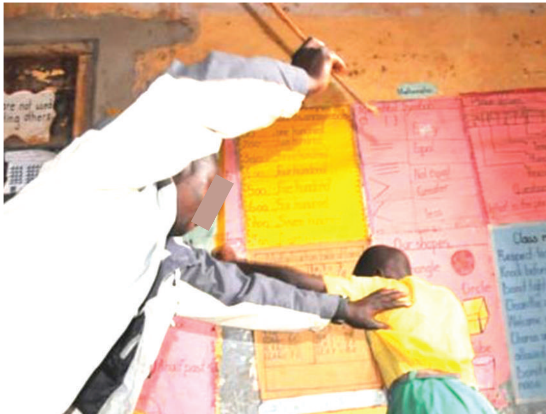
Mwalimu akimwadhibu mwanafunzi shuleni.

“Kwa mfano lile tukio la kuchapwa mwanafunzi mkoani Kagera, tuliona watoto wali-chapwa huku walimu wengine