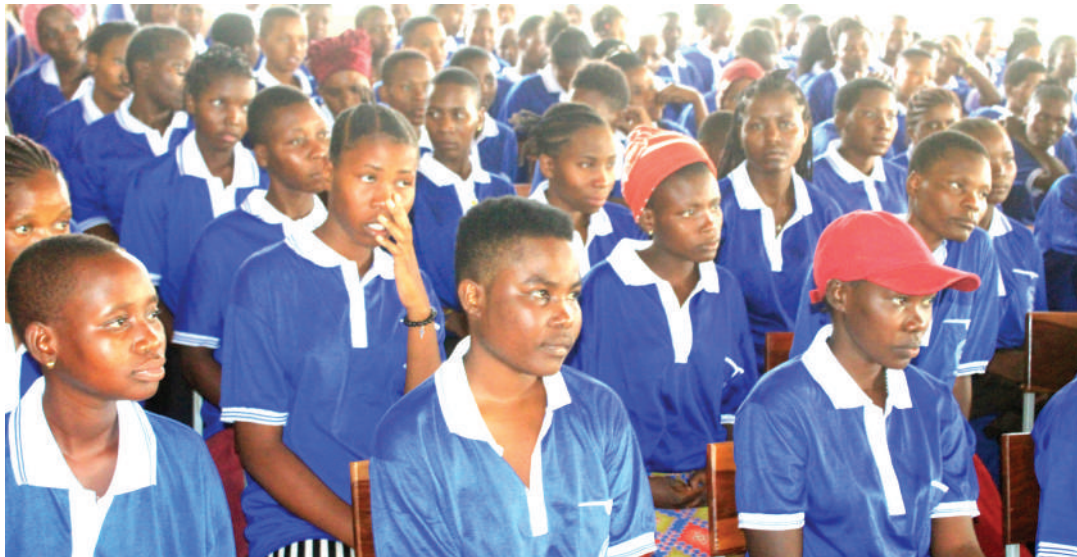
Wanufaika wa mpango wa kuwasaidia wasichana waliopata changamoto za kielimu wakiwa kwenye hafla ya kutambulishwa na kukabidhiwa kwa uongozi wa vyuo vya VETA Kishapu, Kahama na Shinyanga.

Anasema WILDAF inawagharimia kila kitu kwa kushirikiana na