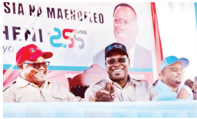
Mwenyekiti wa Chama cha Demokrasia na Maendeleo (CHADEMA) Taifa, Freeman Mbowe (katikati), akifurahia jambo na Makamu wake, Tundu Lissu wakati wa uzinduzi wa Operesheni #255 Katiba Mpya, mjini Kigoma jana. Kulia ni Katibu Mkuu wa chama hicho, John Mnyika.