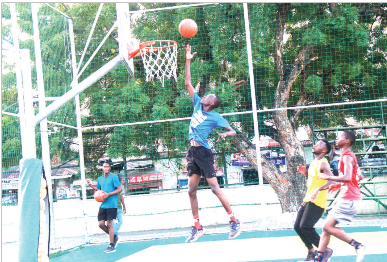
Wachezaji wa mpira wa kikapu wa timu ya JMK Park wakifanya mazoezi ili kujiimarisha katika viwanja vya Jakaya Youth Kikwete Park, Dar es Salaam hivi karibuni.

Straika wa Yanga, Fiston Mayele akiwa na mabao 16 mpaka sasa anawaongoza kwa kupachika magoli huku kiungo mshambuliaji wa Simba, Clatous Chama, yeye anaongoza kwa 'assist' za jumla, akiwa ameshatoa pasi za mwisho 14 mpaka sasa, kiungo mwingine, Saido Ntibazonkiza, ambaye aliichezea Geita Gold na baadaye Simba, yeye amechangia mabao 22, ambayo ni mengi kwenye ligi kuliko mchezaji mwingine yoyote, akiwa amefunga mabao 10 na 'assist' 12.