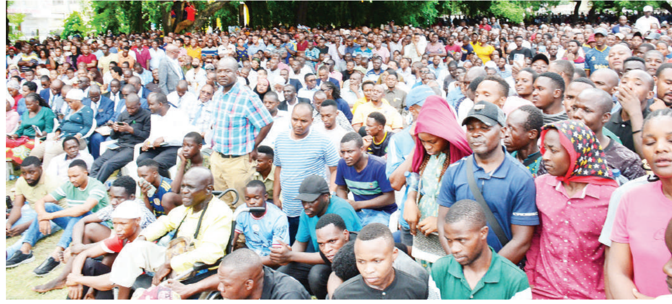
Sehemu ya wafanyabiashara wakimsikiliza Waziri Mkuu, Kassimu Majaliwa (picha juu), katika viwanja vya Mnazi Mmoja jijini Dar es Salaam jana.

• Wafanyabiashara waridhia kufungua maduka... Ukurasa 2