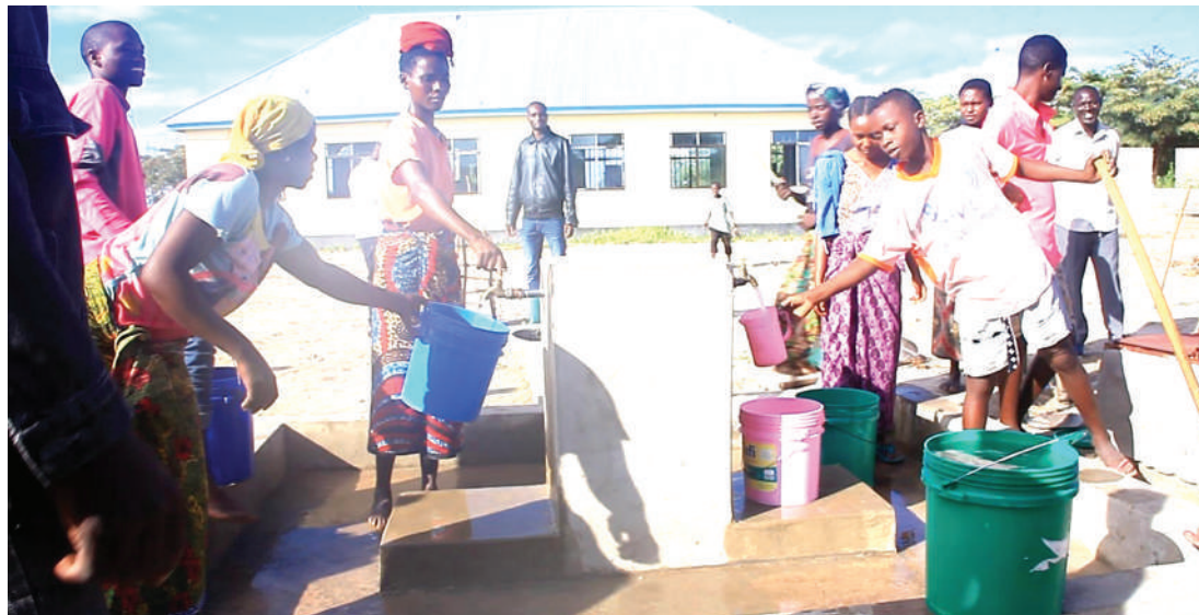
Wananchi wa Kijiji Cha Chilejeho Kata ya Chikuyu wilayani Manyoni wakichota maji kwenye bomba ambalo limewekwa katika Shule ya Msingi Chilejeho.