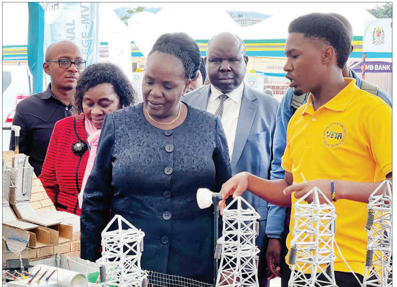
Waziri wa Nchi, Ofisi ya Waziri Mkuu (Kazi, Vijana, Ajira na Wenye Ulemavu), Prof. Joyce Ndalichako (wa pili kulia), akiangalia bidhaa mbalimbali alipotembelea maonyesho ya ufundi na mafunzo ya ufundi stadi katika Uwanja wa Sheikh Amri Abeid, jijini Arusha juzi.