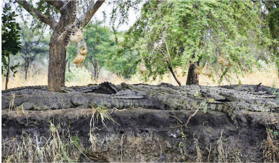
Wanyamapori, simba aliyekula mzoga na mamba katika Hifadhi ya Taifa Katavi. Wamekuwa na athari katika makazi jirani.

asili taarifa zinapotoka wamekuwa wakifika maeneo hayo, sasa wanafika sio kwa maana ya kwenda kuokoa, wanafika tukio limeishatoka, tunaishia sote kusaidiana kulia.