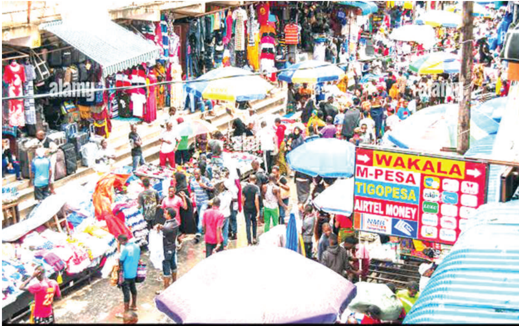
Shughuli za kibiashara katika Soko la Kimataifa Kariakoo, kunakodaiwa kuathirika sana katika zama za mlipuko wa corona. PICHA: MTANDAO.

Mbinga anasema kuwa kabla ya mlipuko wa ugonjwa huo, mauzo ya siku yalikuwa Sh. milioni tano, lakini yalishuka hadi