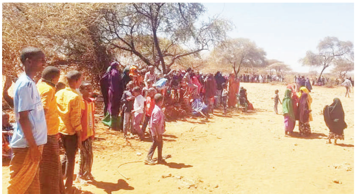
Wakimbizi wa Somalia waliokimbia mapigano huko Lasscanood, Somaliland, wakiwa katika kambi ya muda huko Qoriley katika mkoa wa Somali Ethiopia.