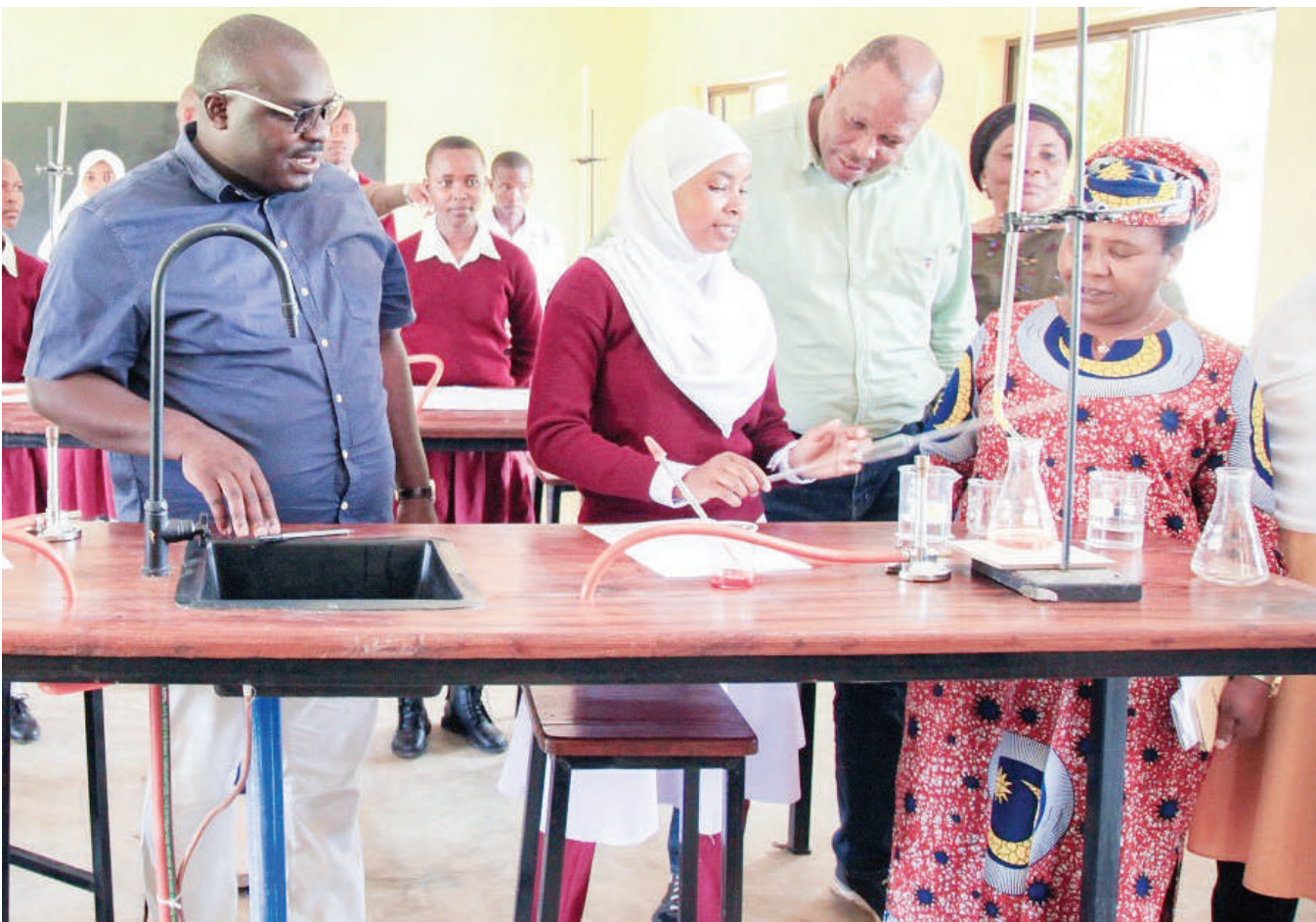
Wajumbe wa Kamati ya Kudumu ya Bunge ya Uwekezaji wa Mitaji ya Umma (PIC), wakikagua utendaji kazi wa maabara ya Fizikia katika Shule ya Sekondari Iriya, wilayani Ikungi, Mkoa wa Singida, baada ya kuunganishiwa umeme kupitia Mradi wa Usambazaji Umeme Vijijini awamu ya tatu mzunguko wa pili.

Alisema zipo njia kadhaa za kukabiliana na athari za mabadiliko ya tabianchi ikiwamo uharibifu wa mazingira na moja wapo ni pamoja na kupanda miti na kuacha kuharibu vyanzo vya maji na kulima mazao yanayostahimili ukame.