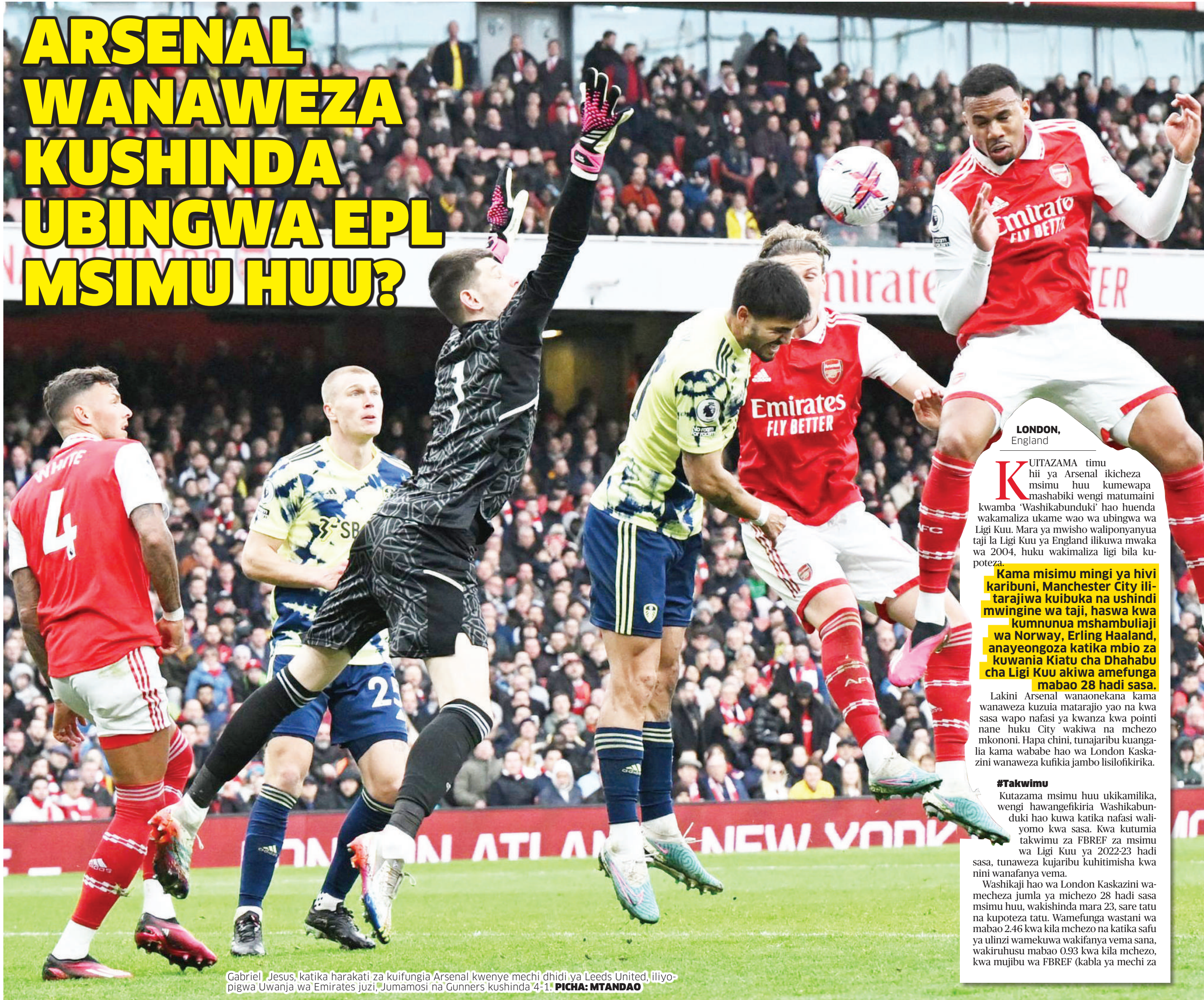
Gabriel Jesus, katika harakati za kuifungua Arsenal kwenye mechi dhidi ya Leeds United, iliyo-pigwa Uwanja wa Emirates juji, Jumamosi na Gunners kushinda 4-1.