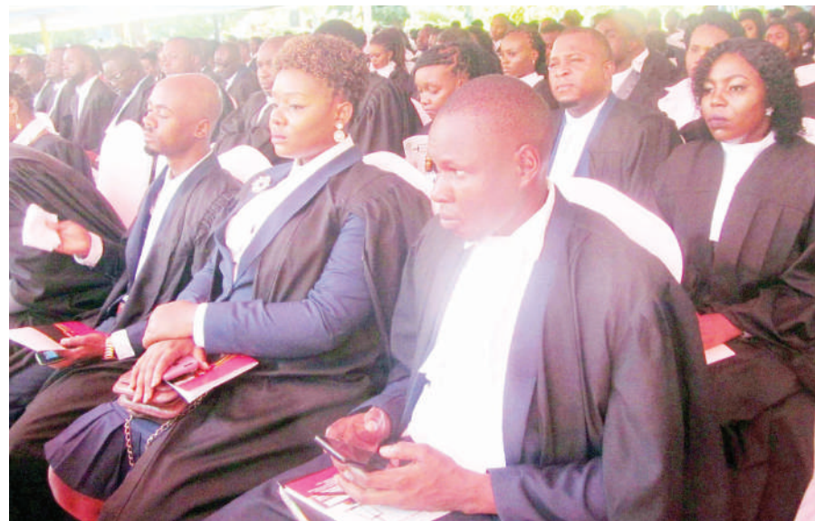
Baadhi ya mawakili wapya 166 waliopata kibali cha kuhudumu kazi hiyo, wakiwa katika sherehe iliyofanyika kwenye viwanja vya Karimjee, jijini Dar es Salaam jana, na kuhudhuriwa na Jaji Mkuu wa Tanzania, Prof. Ibrahim Juma.

Alisema kuna kila sababu ya chuo cha OUT kuendelea kuisambaza programu hiyo katika mikoa mingine.