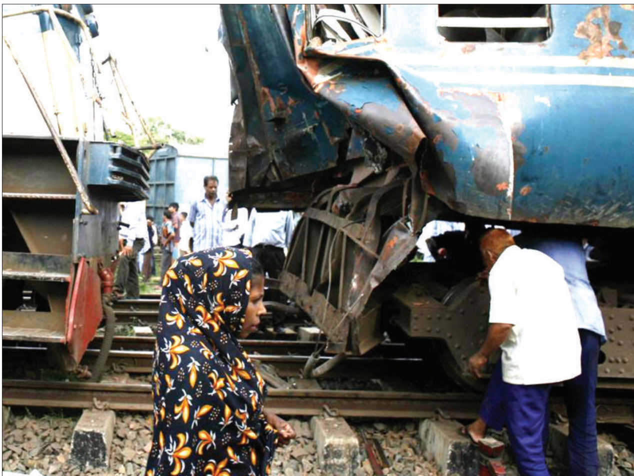
Ajali iliyosababisha vifo 12 na majeruhi wanane, iliyotokea katika mji wa Joypurhat, Kaskazini mwa Bangladesh.