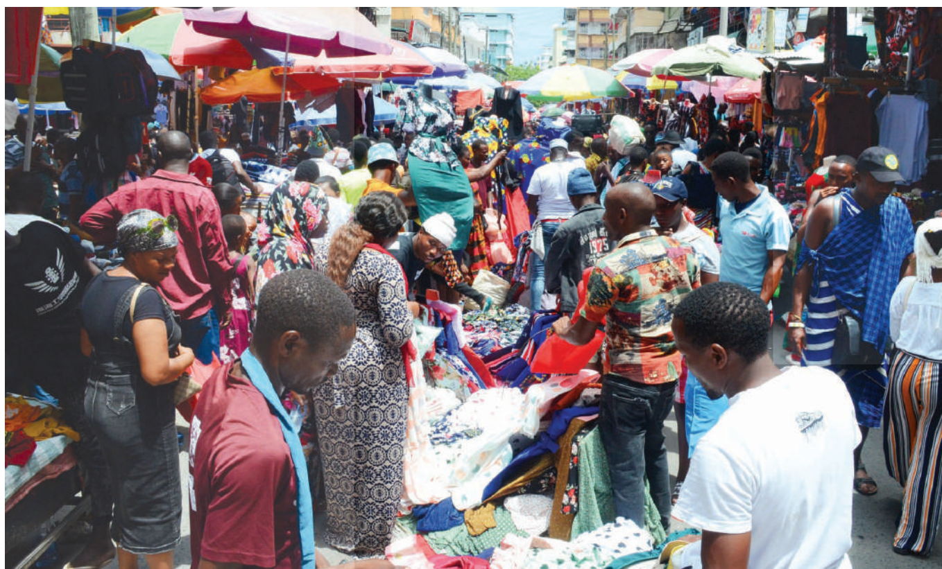
Baadhi ya wakazi wa jiji Dar es Salaam, wakinunua nguo na vitu mbalimbali katika Mtaa wa Kongo jana, kwa ajili ya maandalizi ya sikukuu ya Krismasi.