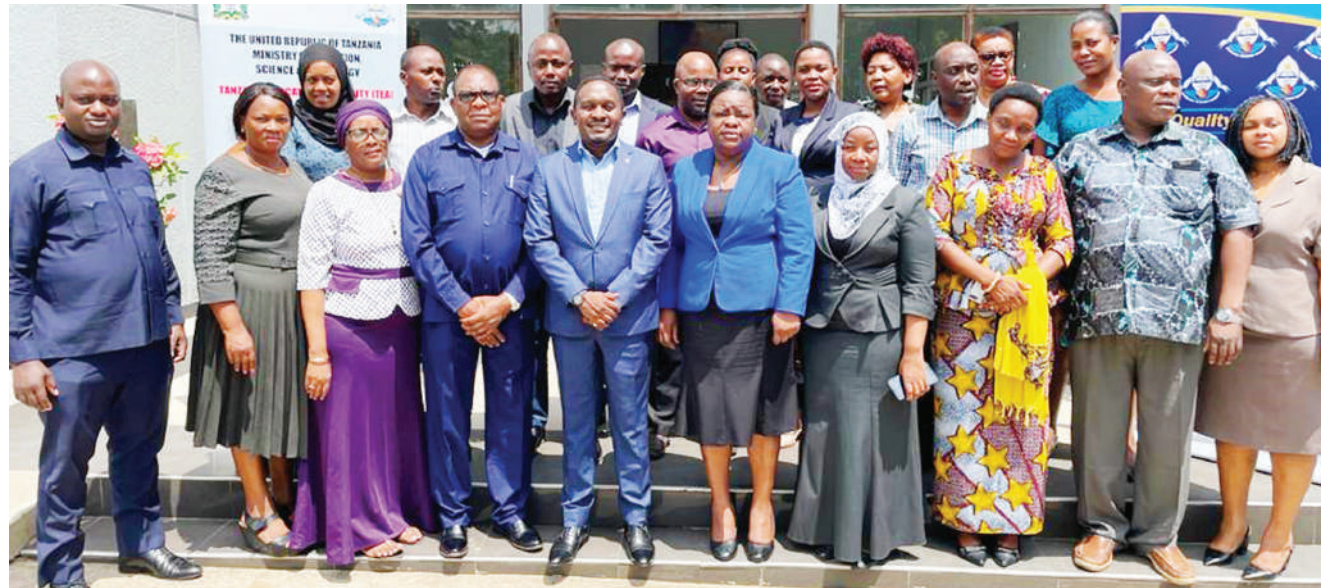
Wajumbe wa Baraza la Tatu la Wafanyakazi la Mamlaka ya Elimu Tanzania (TEA), lililofanyika katika ukumbi wa mkutano jijini Tanga, Desemba 18, wakiwa pamoja.

Naibu waziri huyo yupo Zanzibar kwa ajili ya kutembelea miradi mbalimbali ya Jeshi la Polisi ikiwa ni mara yake ya kwanza kuzungumza na watendaji wa jeshi hilo, Zanzibar baada ya kuteuliwa wadhifa huo.