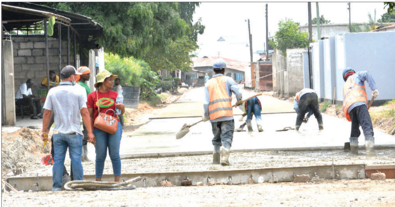
Wafanyakazi wa kampuni ya CRJE, wakiendelea na ujenzi wa barabara ya Mtaa wa Pile kwa kiwango cha zege katika Manispaa ya Temeke, mkoani Dar es Salaam jana.

“Zoezi (kazi) limechelewa (imechelewe- shwa) na waliopewa kazi hiyo wamefanya vibaya sana na kuhoji chuo kinachofundi- sha wataalam wa ardhi, inakuwaje kinao- nyesha mfano mbaya?” Alihoji Lukuvi.