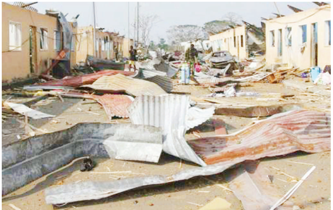
Nyumba zilizoharibiwa baada ya mlipuko ulitokea juzi na kusababisha takribani vifo vya watu 100 katika kambini ya jeshi mjini Bata, Equatorial Guinea.

Kati ya waliojeruhiwa 299 walilazwa hospitalini kwa mujibu wa ujumbe wa Twitter wa wizara ya afya.