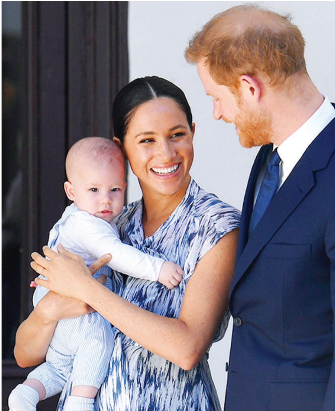
Mwanamfalme Harry, mkewe Meghan Markle na mtoto wao.

"Katika dunia yenye huzuni nyingi, tafadhali jitahidi kuwa mzuri!" anasema na katika maandishi yake hayo ya mtan-