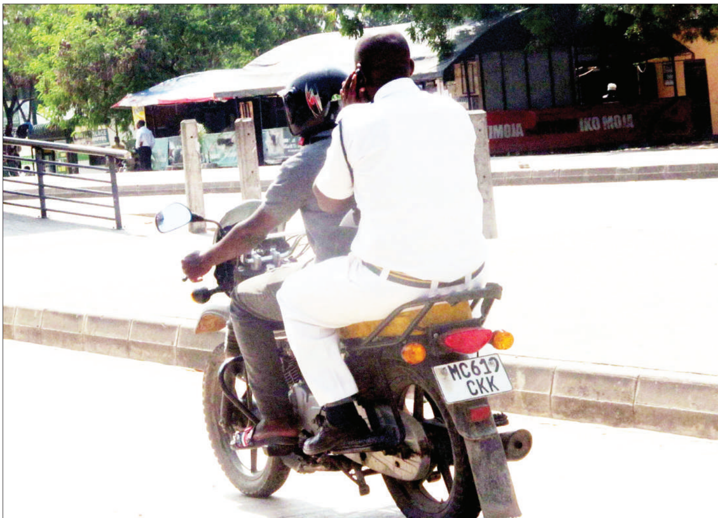
Askari wa Kikosi cha Usalama Barabarani akiwa amepanda bodaboda huku akiwa hajavaa kofia ngumu 'helmet' katika Barabara ya Morogoro, eno la Ubungo Kibo, jijini Dar es Salaam juzi, kitendo ambacho ni hatari kwa usalama barabarani.

Ndikilo alisema mkoa huo unalenga kufikisha huduma ya maji kwenye maeneo ambayo hayajafikiwa kwa asilimia 84 vijijini na 95 kwa mijini.