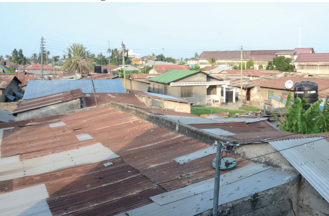
Sehemu ya nyumba 120 zilizo hatarini kubomolewa kwa amri ya mahakama ifikapo Jumanne ya wiki ijayo, katika eneo la Mabibo Kisimani, mkoani Dar es Salaam.

MAMIA Dar waingiwa hofu kukosa makazi... Endelea Uk. 2