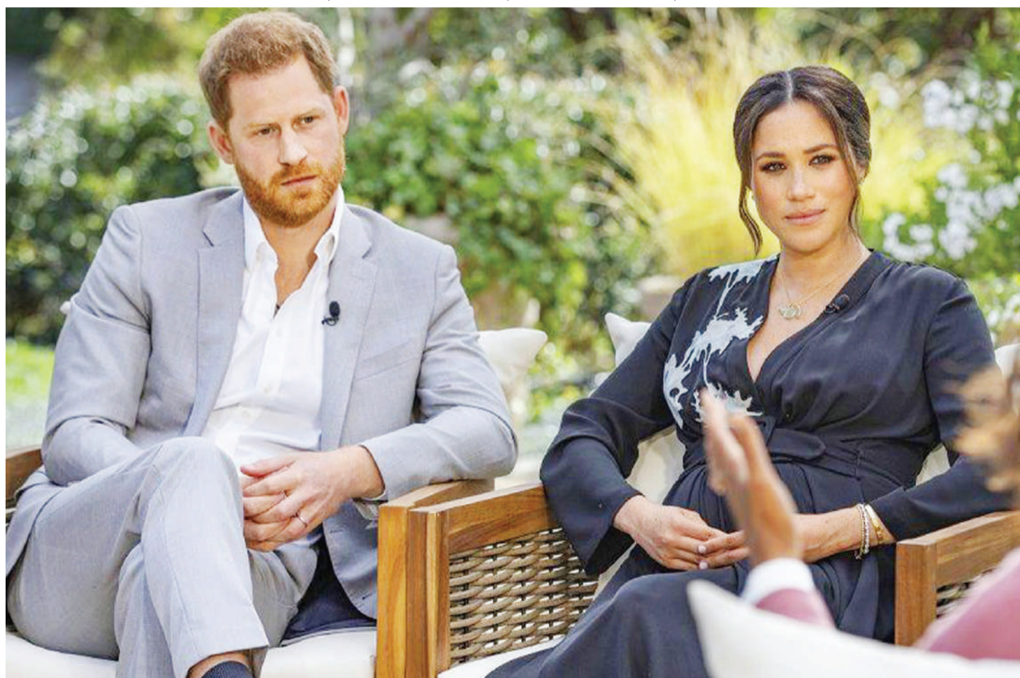
Mwanamfalme Harry, akiwa na mkwe Meghan Markle.

Meghan anasema, alihisi kuzongwa na picha ya hafla rasmi waliokuwa wamehudhuria na