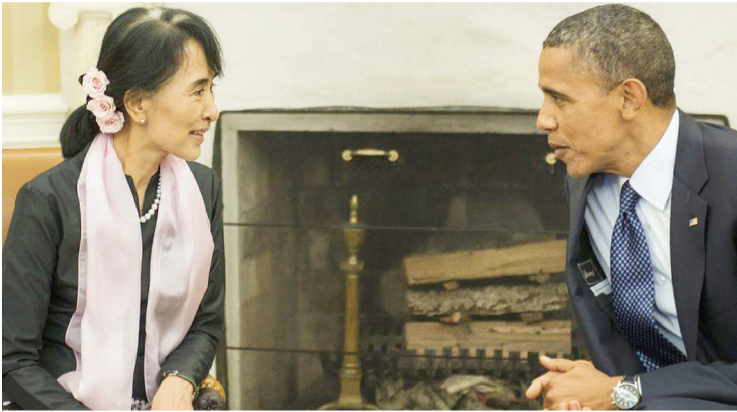
Aung San Suu Kyi, alipokutana na Rais Barack Obama.

• Binti pekee wa Jenerali aliyepigania uhuru