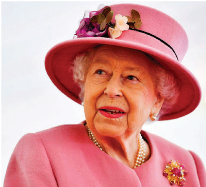
Bibi Malkia Elizabeth wa Uingereza.