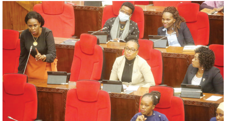
Mbunge wa Viti Maalumu kupitia Chama cha Demokrasia na Maendeleo (CHADEMA), Ester Bulaya, akiuliza swali la nyongeza bungeni jijini Dodoma jana.