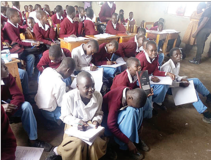
Wanafunzi wa Shule ya Sekondari Mwatenga wilayani Mbarali, mkoani Mbeya, wakifuatilia masomo, huku wakiwa wamekaa chini kutokana na shule hiyo kukabiliwa na uhaba wa madawati.