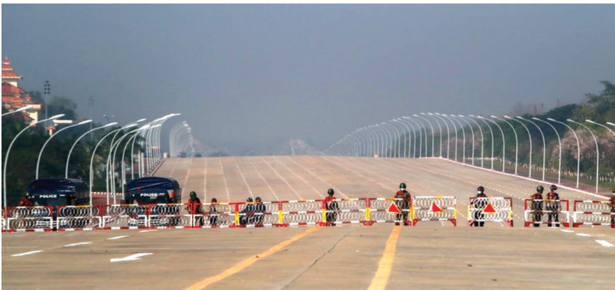
Wanajeshi wa nchini Myanmar wakilinda barabara iliyowekwa viziwi inayoelekea jengo la bunge, jana, huku mamia ya wabunge nchini humo, wakifungwa ndani ya nyumba zao katika mji mkuu wa nchi hiyo, Naypyitaw.