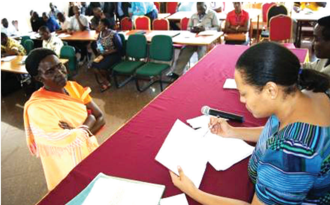
Aliyekuwa Waziri wa Nchi, Ofisi ya Rais-Menejimenti ya Utumishi wa Umma, Angellah Kairuki, alipokuwa kazini kupitia taarifa za watumishi wa umma mkoani Kagera.

tumishi, kuondoa watumishi hewa na jumla ya watumishi hewa 19,708 waliondolewa katika mfumo.