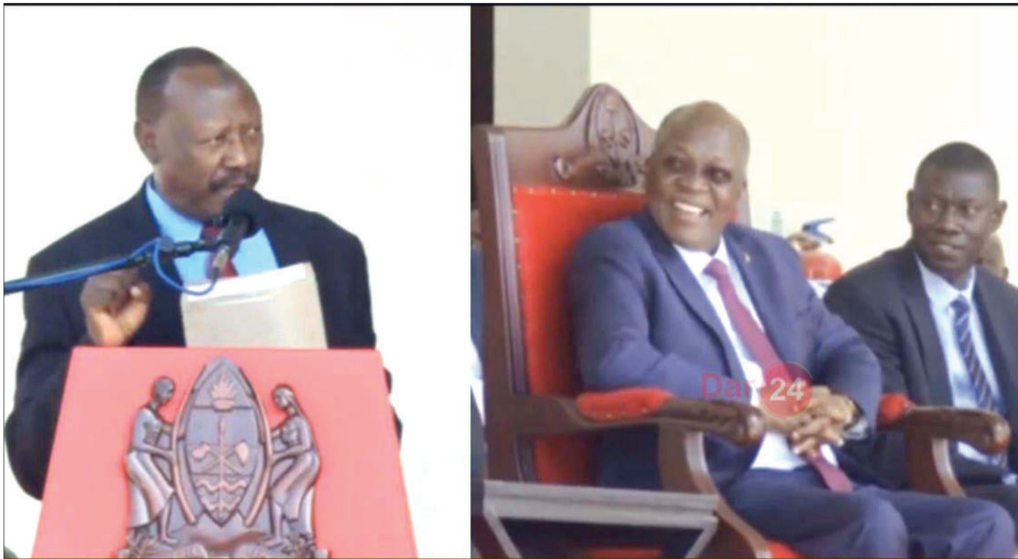
Prof. Ibrahim Lipumba, alipozungumza katika Siku ya Sheria nchini jijini Dodoma. Kushoto kwake ni Rais Dk. John Magufuli.