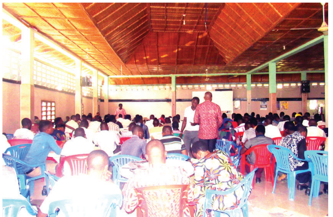
Walimu Wakuu, Wakuu wa Shule na Waratibu Elimu kutoka Wilaya ya Busega, wakifuatilia mafunzo ya madeni.

Mwandishi wa makala hii ni Ofisa Habari Mkuu, katika Ofisi ya Rais, Menejimenti ya Utumishi wa Umma.