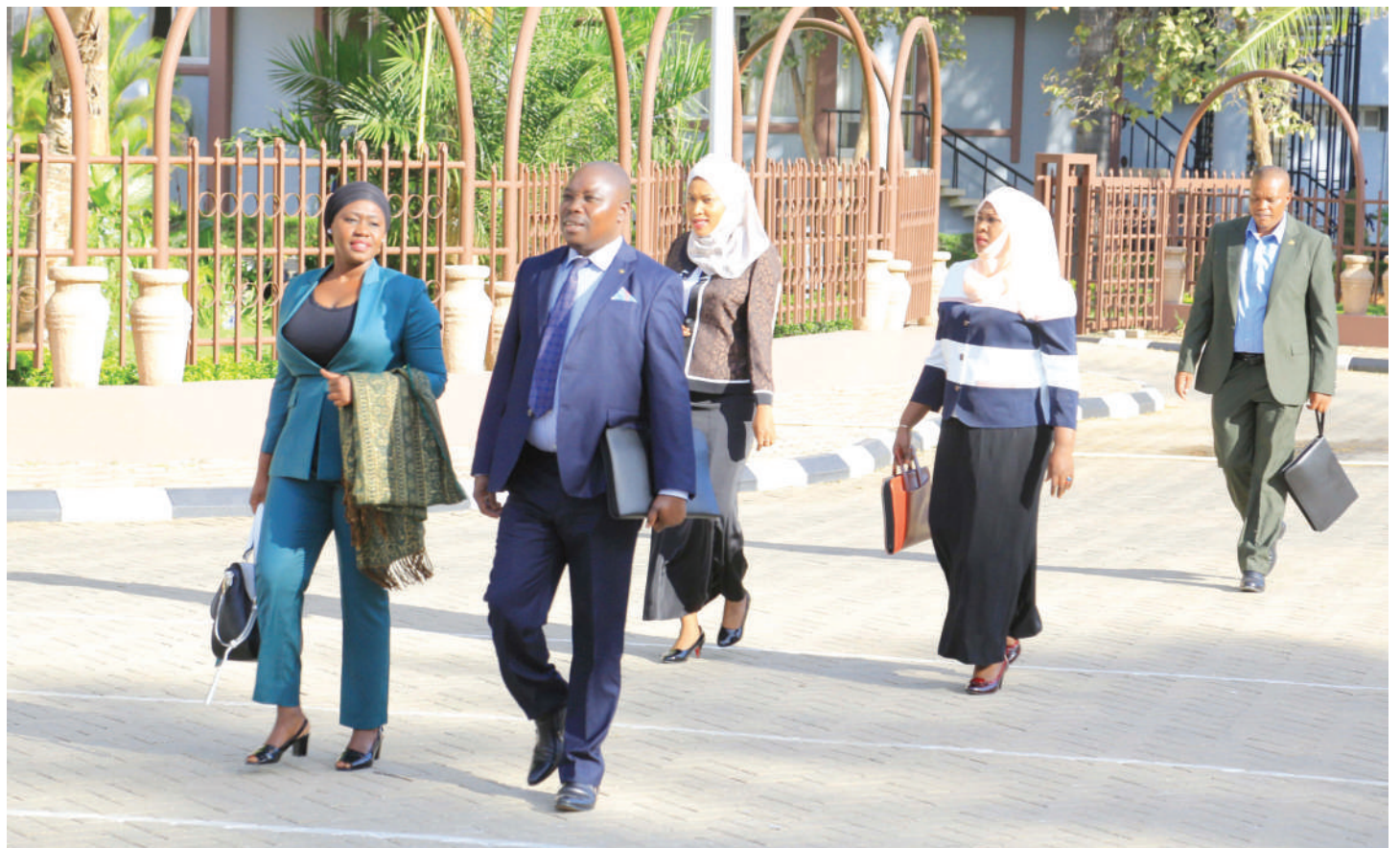
Baadhi ya wabunge wakiingia katika viwanja vya Bunge tayari kwa kuhudhuria Bunge la 12, mkutano wa pili, kikao cha kwanza, jijini Dodoma jana..

"Watambue umuhimu wa kurejesha mikopo kwa kuwa mikopo hiyo inasaidia wengine wanufaike na mikopo hiyo," alisema.