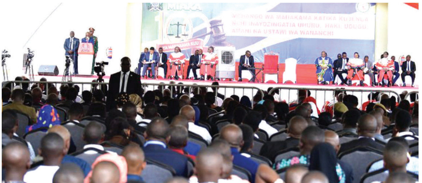
Hadhira katika Siku ya Sheria Tanzania, ikimsikiliza Rais Dk. John Magufuli alipowahutubia.

Mkasa mojawapo ni kilichotokea katika kikao cha Bunge la Katiba, pia ilishuhudiwa mara kadhaa katika vikao vya kawaida vya Bunge la Jamhuri ya Muungano.