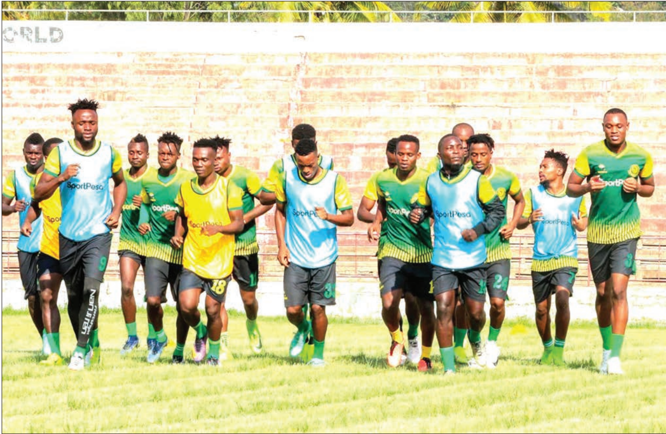
Wachezaji wa Yanga wakifanya mazoezi kwenye uwanja wa CCM Kirumba jijini Mwanza jana, kujiandaa kwa ajili ya mchezo wa kombe la FA dhidi ya Mbao FC utakaopigwa leo kwenye dimba hilo.