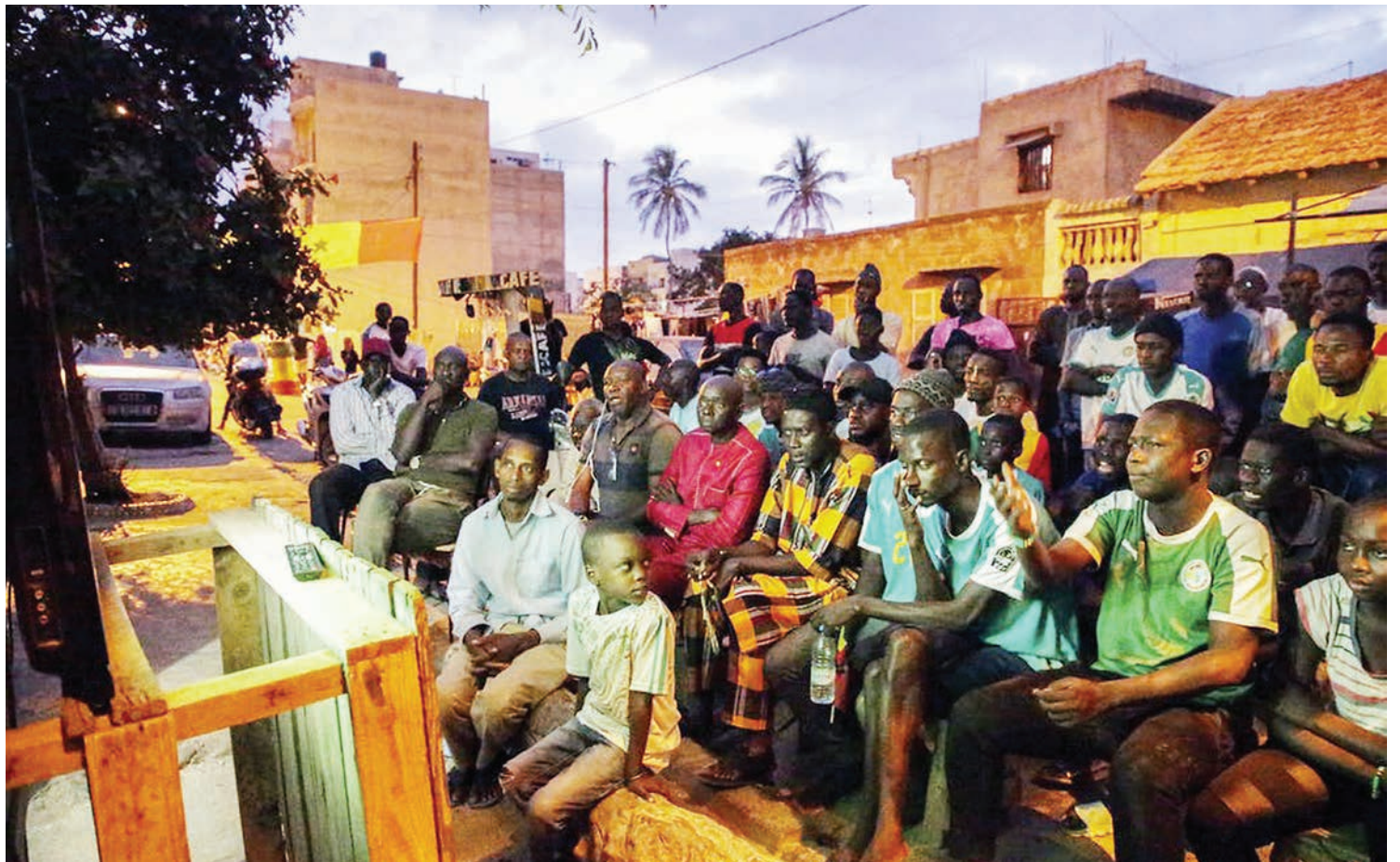
Watu wakiwa katika mkusanyiko kufuatilia matangazo ya runinga, wengi wao vijana.

“Kuna baadhi ya vipindi vinatufundisha kuwa na maadili mema, pia kujifunza masomo kama vile hesabu kwa mfano katika kipindi