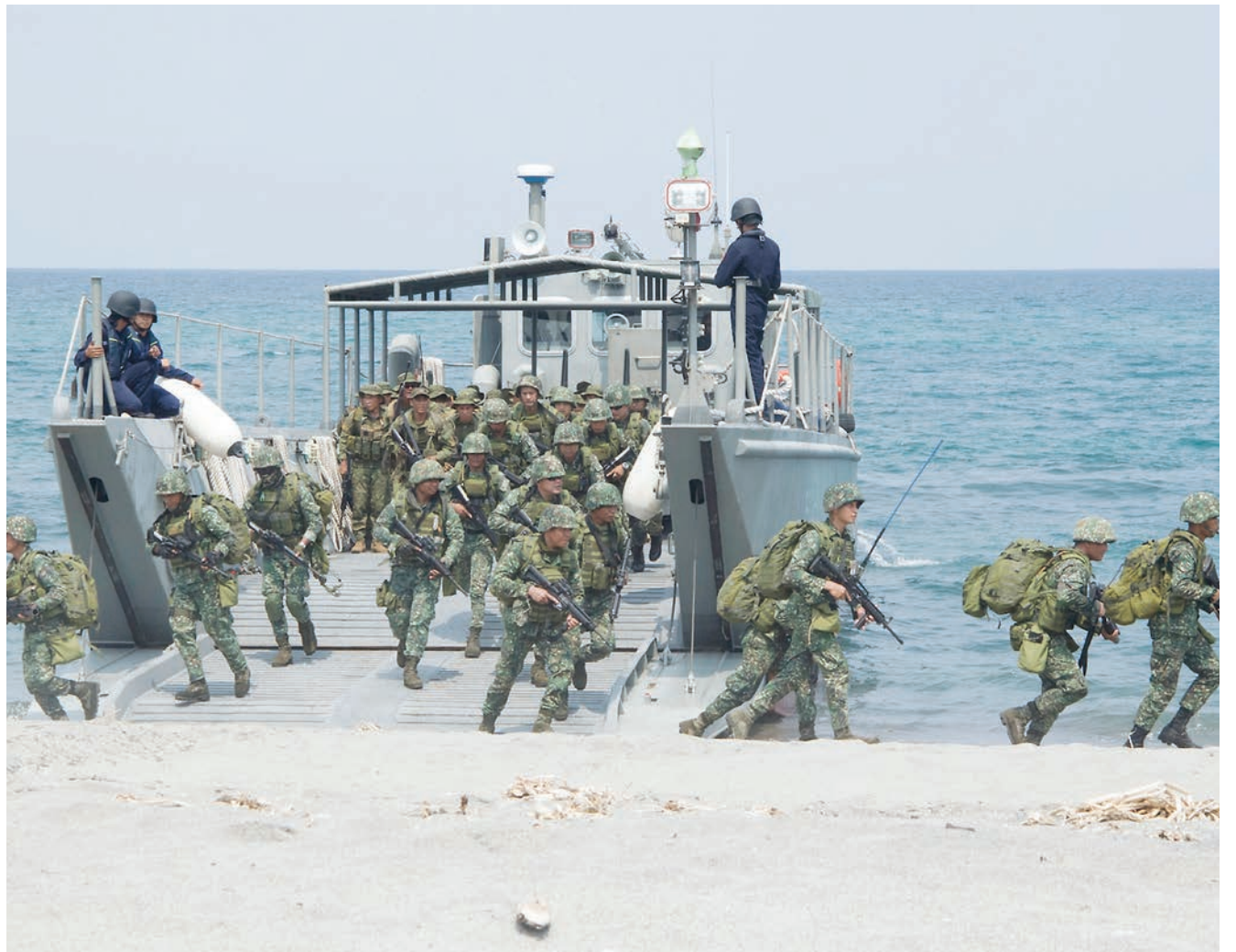
Wanamaji wa Marekani na Ufilipino wakifanya mazoezi katika bahari ya kusini mwa China