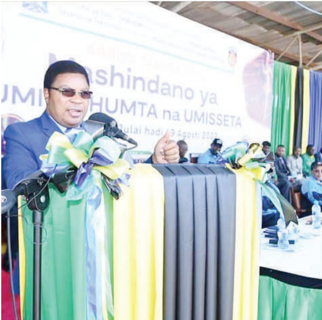
Waziri Mkuu, Kassim Majaliwa (kushoto), akizungumza katika uzinduzi rasmi wa mashindano ya Umoja wa Michezo na Taaluma kwa Shule za Msingi (UMITASHUMTA) na Sekondari (UMISSETA) uliofanyika katika Uwanja wa Ali Hassan Mwinyi mkoani Tabora jana.