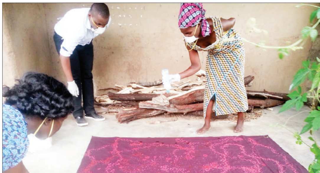
Uzalishaji batiki unafanyika mahali popote.

ni katika hafla ya uzinduzi wa Siku ya Batiki Tanzania na ku- fafanua kuwa kumekuwapo na vipimo vya mita 2.5 hadi nne na sasa wanataka wakubaliane kuwa na vipimo vya aina moja.