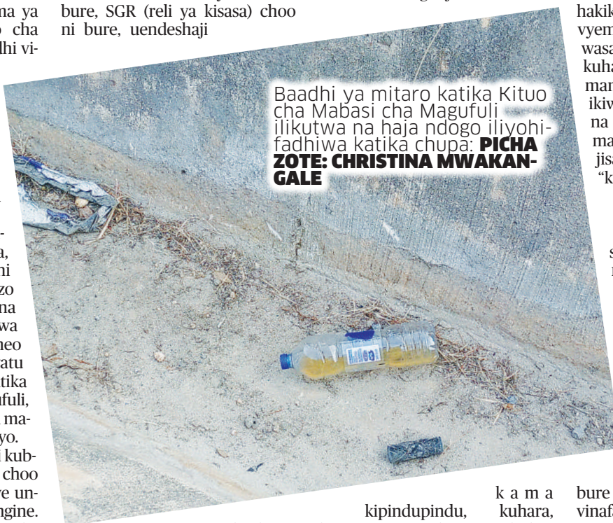
Baadhi ya mitaro katika Kituo cha Mabasi cha Magufuli ilikutwa na haja ndogo iliyohifadhiwa katika chupa

Ujenzi wa Kituo cha Mabasi cha Magufuli uligharimu Sh. bilioni 50.9. Kilizinduliwa rasmi Februari 22, 2021 na Rais wa wakati huo, Dk. John Magufuli.