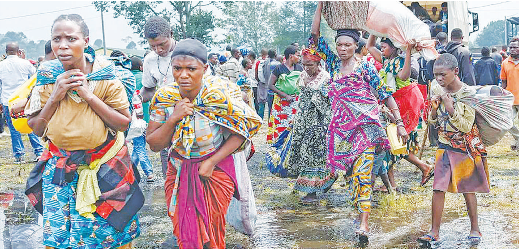
Raia wa DRC wakiwa na hofu wakiwasili katika kambi ya wakimbizi ya Gisenyi, wakikimbia mapigano mashariki ya Congo.