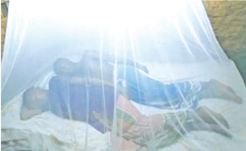
Watu wakilala ndani ya vyandarua, mbinu mojawapo ya kukabili malaria.

Hata hivyo, WHO inaonyesha tahadhari kwamba asilimia 95 ya vifo hivyo (wastani 567,150) vimetokea katika nchi za Kiafrika na idadi iliyobaki (wastani 29,850) ndio vina- tokea katika mabara mengine duni- ani.