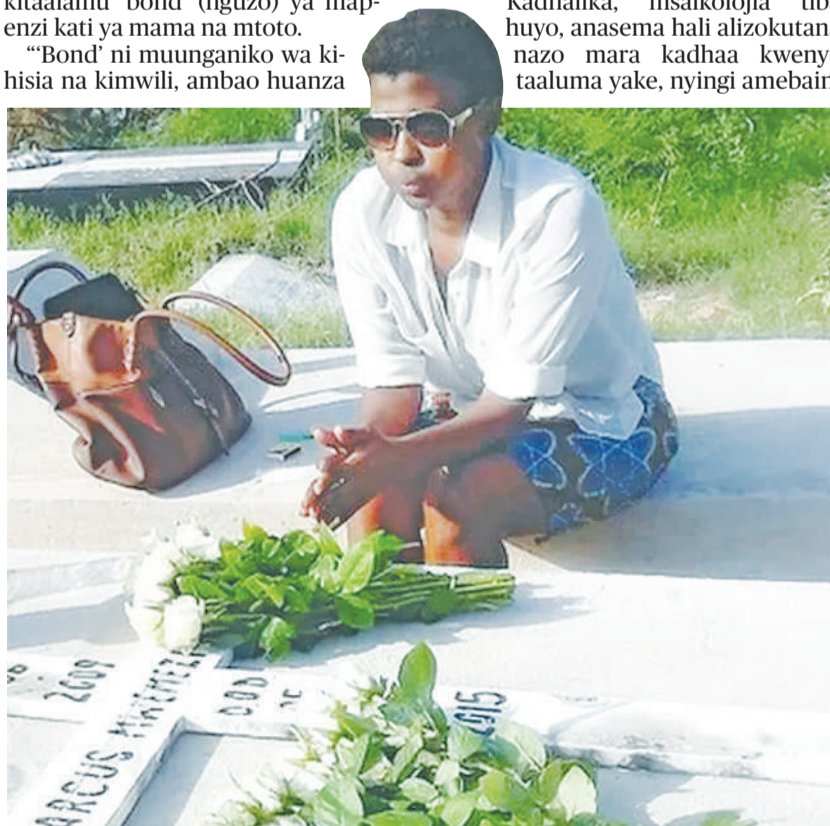
Mtu anayeonekana katika lindi la mawazo.

Homoni ya mapenzi ikiachiliwa inaweka 'bond' ya mapenzi kati ya mama na mtoto aliyeko tumboni na mama. Ingawa mama akiwa mjamzito si kwa kupenda kwake, bali kile alichokuwa anakiwaza, akaingia katika sonona, muunganiko wao utapotea.