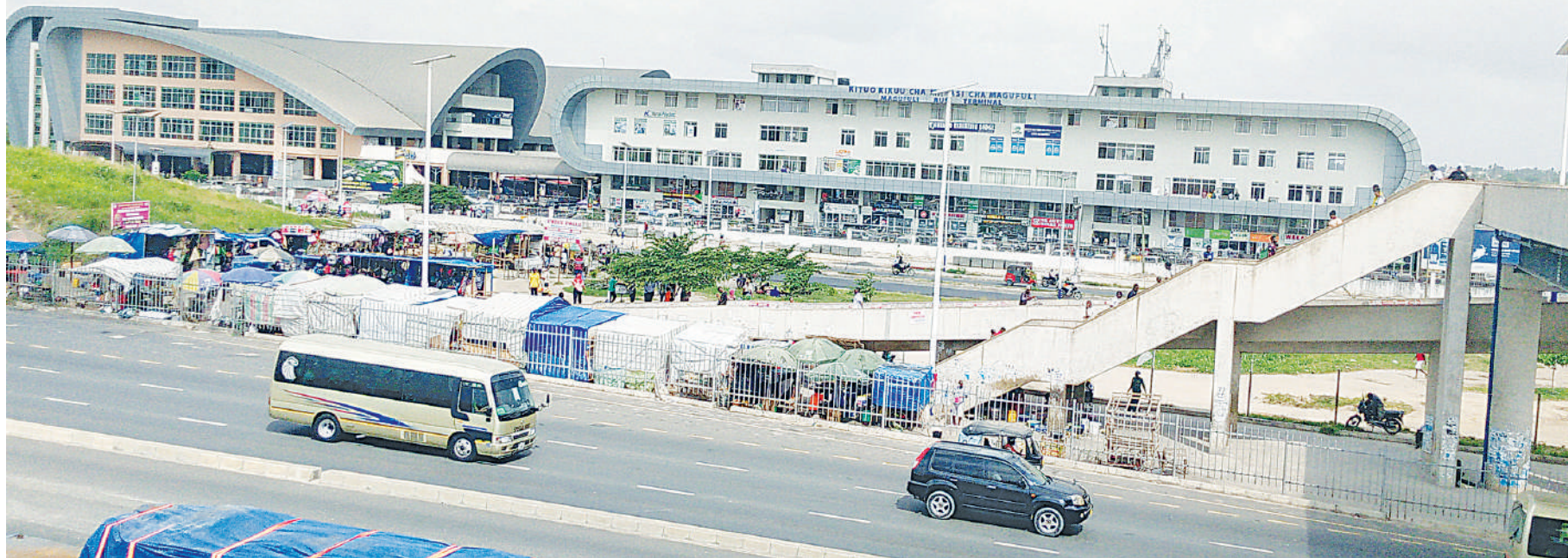
Mwonekano wa nje wa Kituo cha Mabasi cha Magufuli