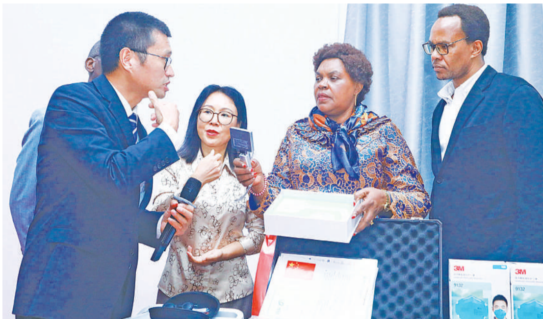
Waziri wa Afya, Jenista Mhagama katika tukio la kupokea msaada wa vifaa tiba kutoka China, vyenye thamani ya Shilingi milioni 125, vilivyokabidhiwa katika Hospitali ya Taifa Muhimbili, Dar es Salaam Januari 24, 2025.

Mheshimiwa Rais Dk. Samia Suluhu Hassan amewezesha usimikwaji wa mashine tatu za 'Cathlab carto' kwa ajili ya upasuaji kwa njia ya tundu dogo.