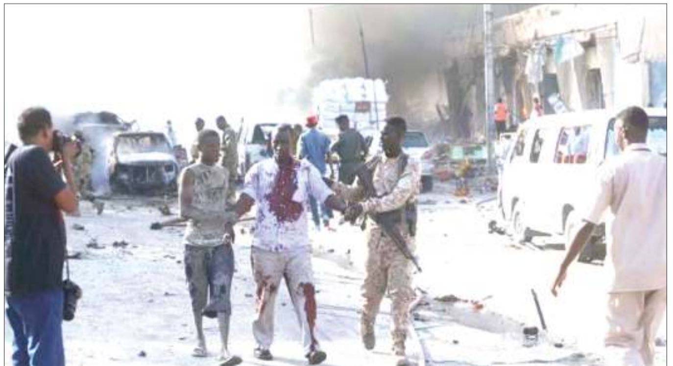
Mwanajeshi wa Somalia akiokoa majeruhi katika jengo lililoshambuliwa mjini Mogadishu.