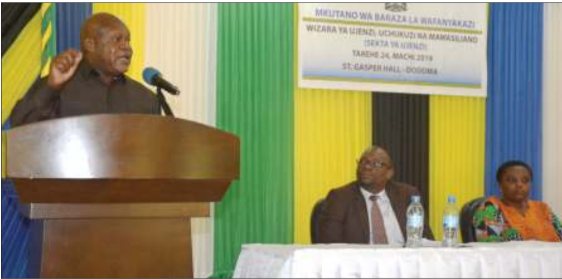
Waziri wa Ujenzi, Uchukuzi na Mawasiliano, Mhandisi Isack Kamwelwe, akisisitiza jambo kwa wajumbe wa Baraza la Wafanyakazi wa Sekta ya Ujenzi (hawapo pichani), wakati akihutubia baraza hilo mjini Dodoma.