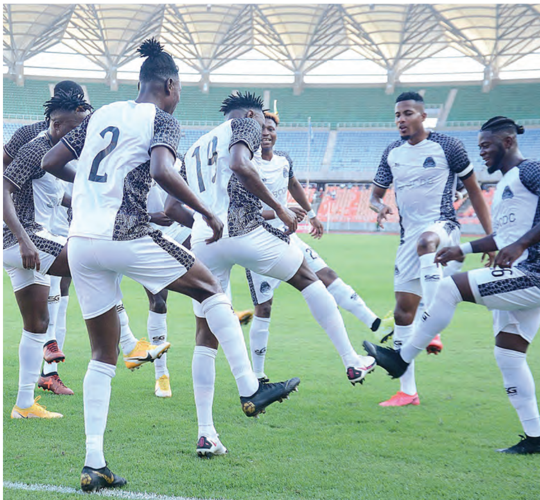
Wachezaji wa TP Mazembe, wakishangili baada ya kupata bao la kuongoza kabla ya Al Hilal kutokea nyuma na kushinda 2-1 katika mechi ya Simba Super Cup, iliyopigwa Uwanja wa Benjamin Mkapa jijini Dar es Salaam jana. TP Mazembe itashuka tena dimbani hapo kesho kuvaana na Simba.