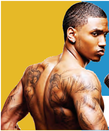
TREY SONGZ MATATANI Uk.14