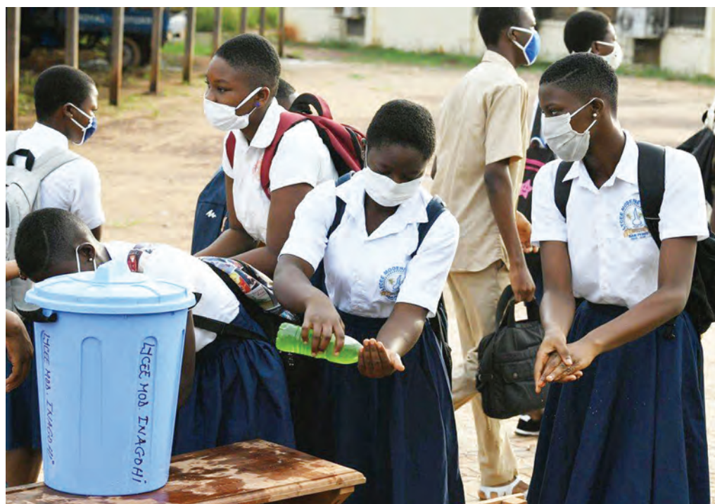
Wanafunzi waliovaa barakoa, wakinawa kwa maji tiririka na vitakasa mikono ikiwa ni namna ya kujihami dhidi ya virusi vya corona.

Ni funzo lililopo siku nyingi, mashahidi mojawapo ni wanaougua maradhi ya kifua kikuu, kuwalinda majirani na maambukizi, pia sehemu ya ustaarabu wa jamii walio karibu kujaliana kifa.