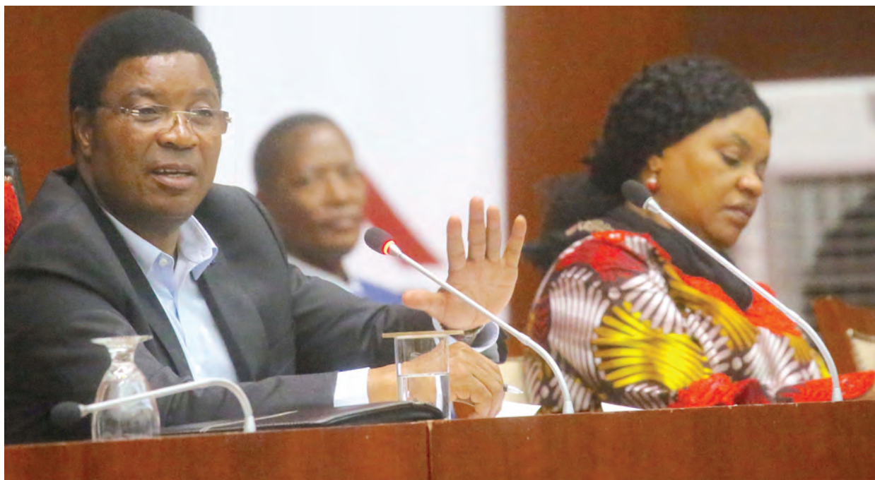
Waziri Mkuu, Kassim Majaliwa, akiingiza majadiliano baada ya kufungua mkutano wa viongozi wa wamachinga kutoka mikoa yote Tanzania Bara kwenye Kituo cha Mkutano cha Kimataifa cha Julius Nyerere jijini Dar es Salaam juzi. Kulia ni Waziri wa Nchi, Ofisi ya Waziri Mkuu, Sera, Bunge, Kazi, Vijana, Ajira na Wenye Ulemavu, Jenista Mhagama.

Pia alitoa wito kwa wananchi ambao wanaoneva wapige simu namba 0754497122, 0739900100 kwa msaada zaidi.