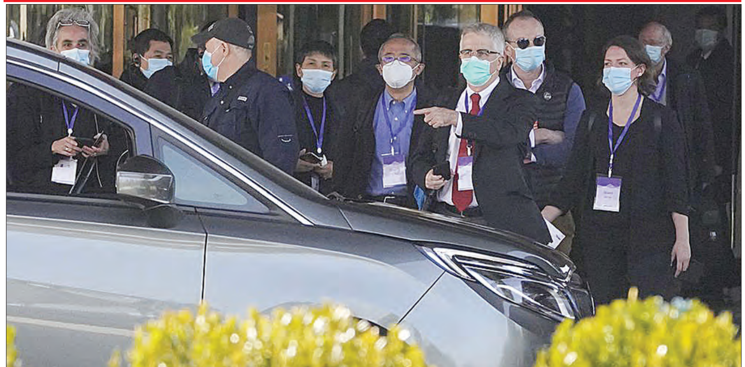
Watafiti wa Shirika la Afya Duniani (WHO), wakijiandaa kuelekea Wuhan, mkoa wa Hubei nchini China, jana, kwa ajili ya kuanza kufanya utafiti wa chimbuko la corona.