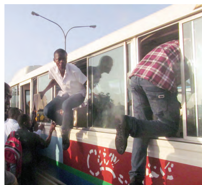
Abiria wakipita madirishani kwenye kituo cha daladala cha Mbezi Mwisho jijini Dar es Salaam, jana, ili kuwahi kupata sehemu ya kukaa, kutokana na shida ya usafiri.

Alisema matumizi ya Teknolojia ya Habari na Mawasiliano (TEHAMA) kwa mashirika hayo pamoja na serikali yakiboreshwa, yatasaidia mashirika hayo kutochukua muda mwingi kusafiri umbali mrefu ili kuandaa tarifa za utendaji kazi na kuwasilisha serikalini.