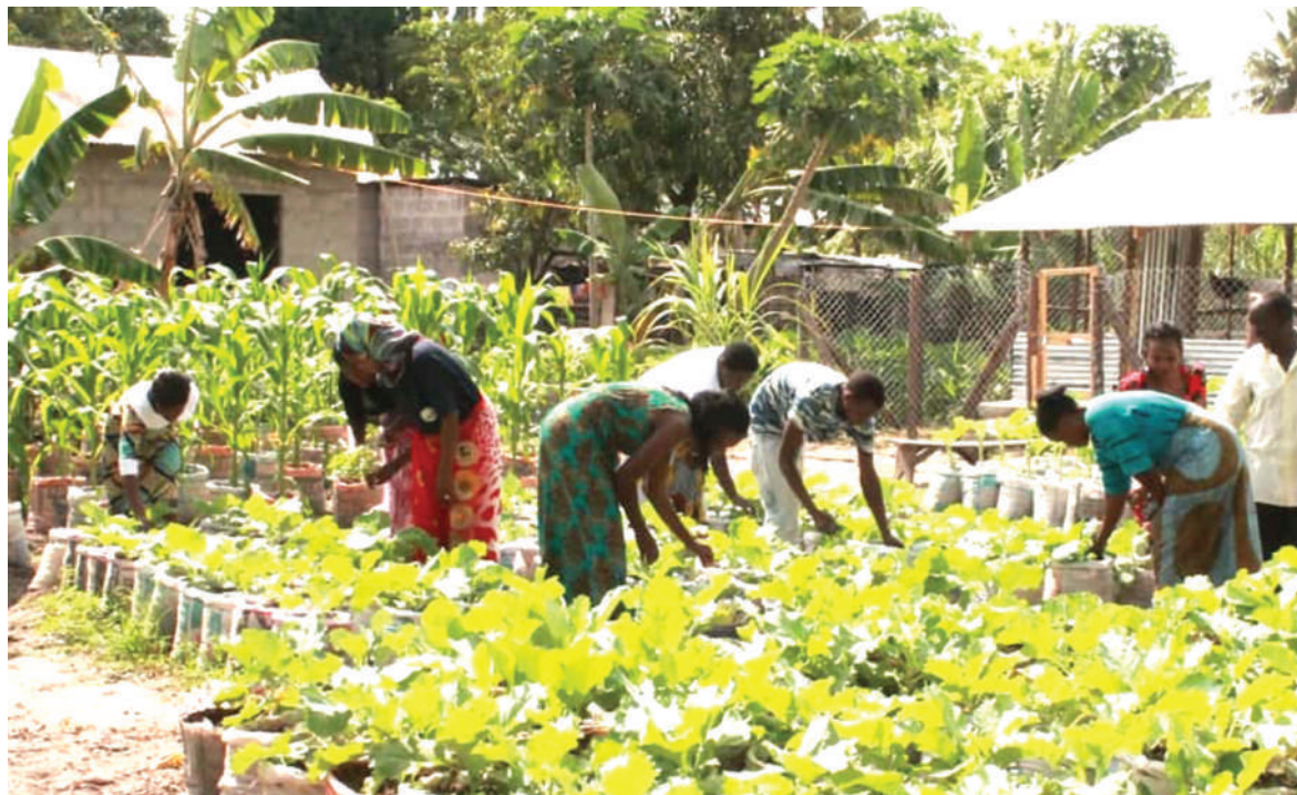
Baadhi ya wajasiriamali wa Kata ya Majohe wakiwa katika shamba darasa la mboga linalomilikiwa na Kituo cha Sauti ya Jamii Kipunguni jijini Dar es Salaam mwishoni mwa wiki, wakijifunza jinsi ya kulima kilimo bora cha bustani za mboga.