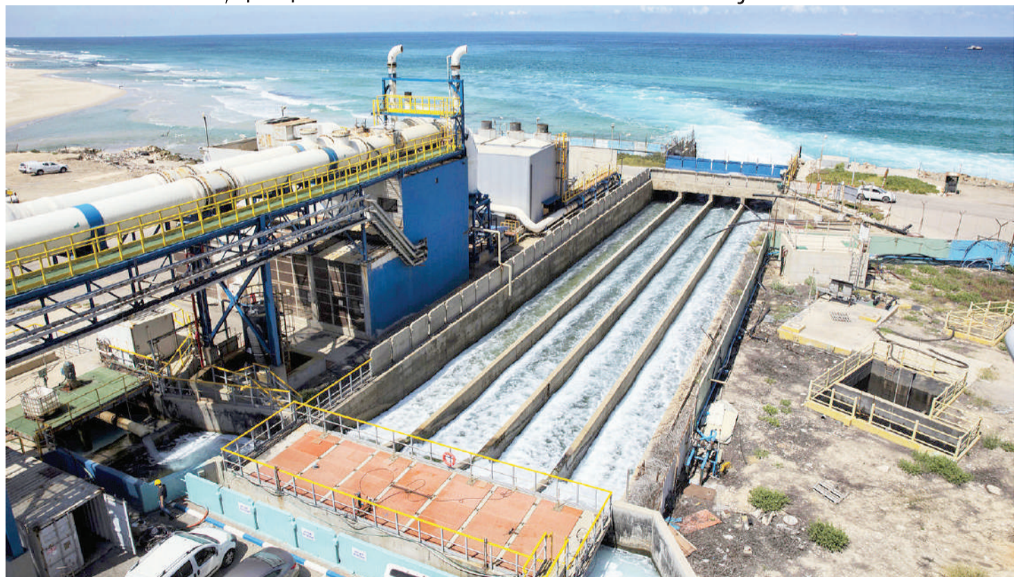
Miundombinu ya kusafisha maji ya bahari kuondoa chumvi.

Tanzania ina ukanda wa Bahari ya Hindi wenye urefu wa takribani kilometa 1,424 au maili 800 kuanzia Mtwara hadi Tanga, eneo ambalo maji hayo yanaweza kuvunwa kwa ajili ya kilimo, ufugaji, matumizi nyumbani na viwandani na sekta zote