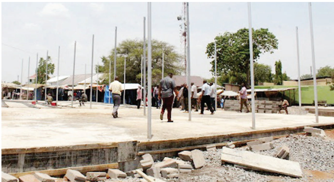
Ujenzi wa soko la biashara katika Mji wa Manispaa ya Shinyanga ukiendelea ambao utagharimu Sh. milioni 120 kupitia fedha za mapato ya ndani.