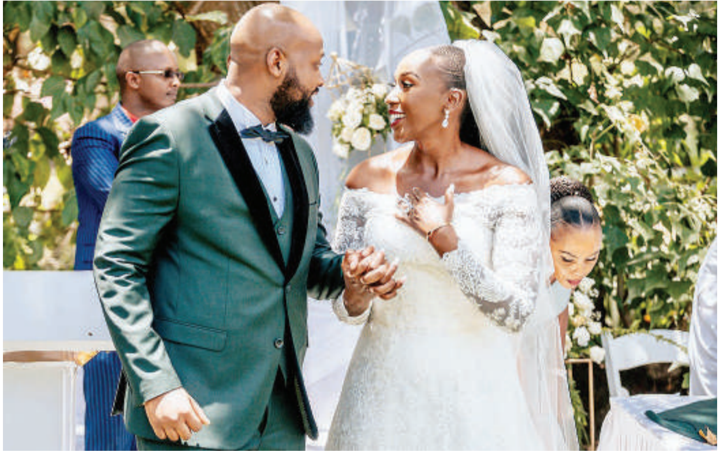
Jamii na wazazi wanapotamani ndoa, wengine hufikia hatua ya kulazimisha watoto wao kuoa au kuolewa wakiamini ni jambo la lazima.

Wengine huwapelekea kuwa na msongo wa mawazo hivyo kupata matatizo ya afya ya akili pia huondoa uwezo wa kujiamini na kuthubutu pamoja na ubunifu miongoni mwa vijana. Mbaya zaidi wengine kufikia hatua ya kujidhuru wenyewe kwa kunywa sumu au kujinyonga ili kukwepa