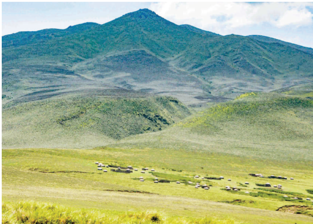
Mwonekano wa Bonde la Ngorongoro ambalo ni maajabu ya dunia, likisheheni rasilimali nyingi za kiuchumi, kihistoria na malikale. PICHA ZOTE: MAKTABA

Leo ni kivutio cha aina yake kama ilivyo Kilimanjaro, mlima ambao ni mrefu zaidi barani Afrika na kilele chake kufunikwa na barafu kama yalivyo baadhi ya