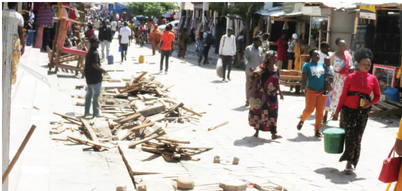
Wakazi wa Jiji la Dodoma wakipita bila msongamano kwenye Mtaa wa One Way baada ya Halmashauri ya Jiji kuwaondoa wafanyabiashara wadogo (machinga) jana.

Hata hivyo, mkurugenzi huyo aliwataka madiwani hao kusimamia miradi ambayo ipo kwenye kata zao ili iweze kukamilika kwa wakati na wananchi wanufaike nayo.