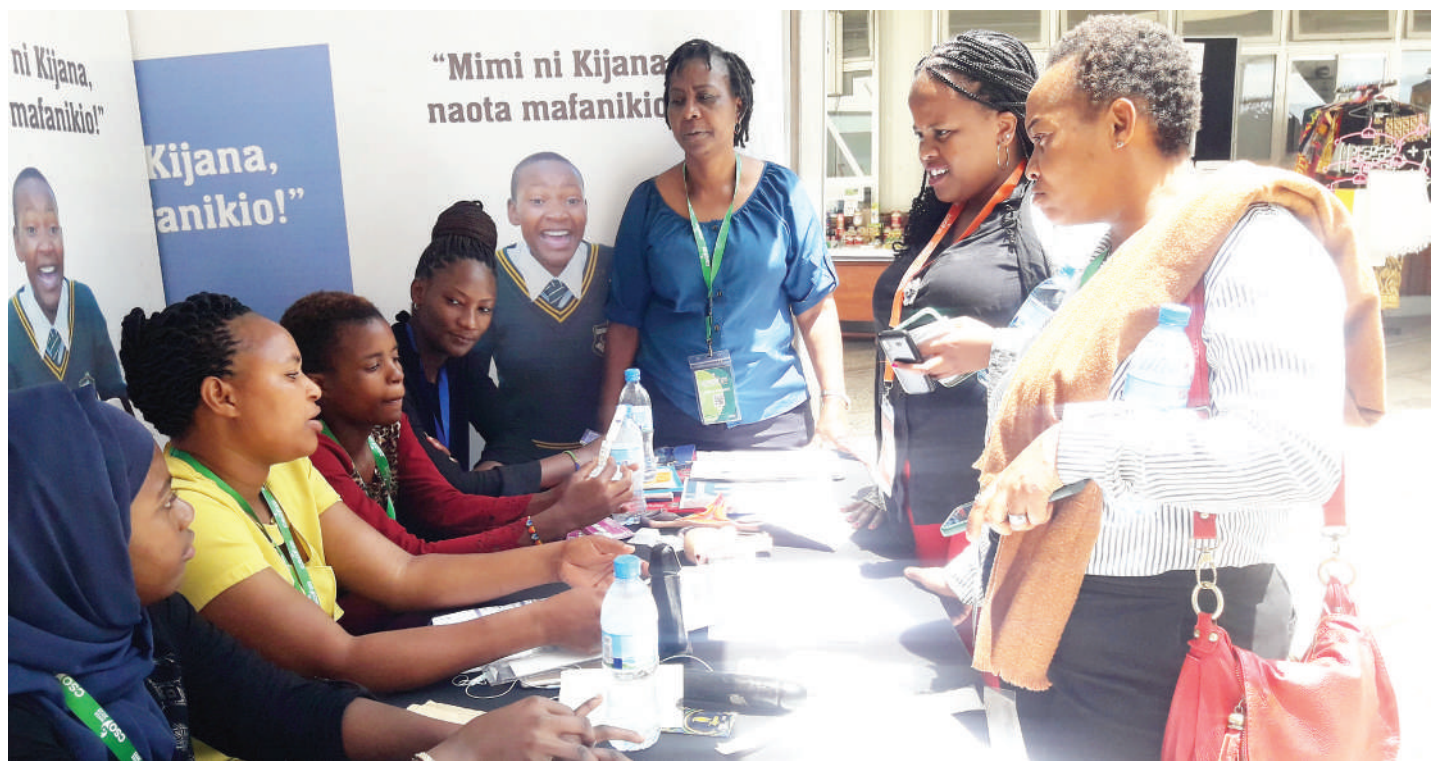
Baadhi ya wananchi wa Jiji la Arusha wakipata maelezo kwa wataalamu wa afya kutoka Hospitali ya Tengeru kuhusu uzazi wa mpango na kipimo cha kupima Virusi vya UKIMWI kwa njia ya mate katika ukumbi wa Mikutano ya Kimataifa AICC jana.

"Sehemu kama Mbuguni kwe-nye visima vikubwa hatukati umeme. Pia visima vya Seed Farm eneo la Ngaramtoni kwa kuwa inaleta maji jijini hapa na Monduli kwa kuwa hatugawi umeme tunahakikisha muda wote uko ili wananchi wapate huduma ya maji," alisema.