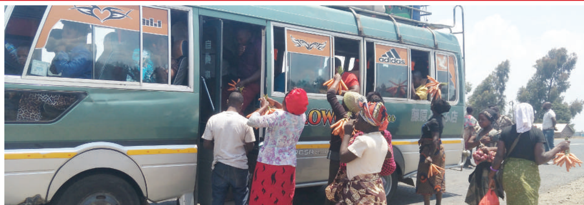
Baadhi ya wachuuzi wa eneo la Kawetere jijini Mbeya wakiwauzia karoti na vitunguu abiria kwenye mabasi jana.

Kijiji cha Idugumbi ni miongoni mwa vijiji vinavyozunguka hifadhi ya misitu asilia ya Mlima Mbeya na eneo ambalo mara nyingi wananchi wanaanzisha moto unaoeteketeza misitu.