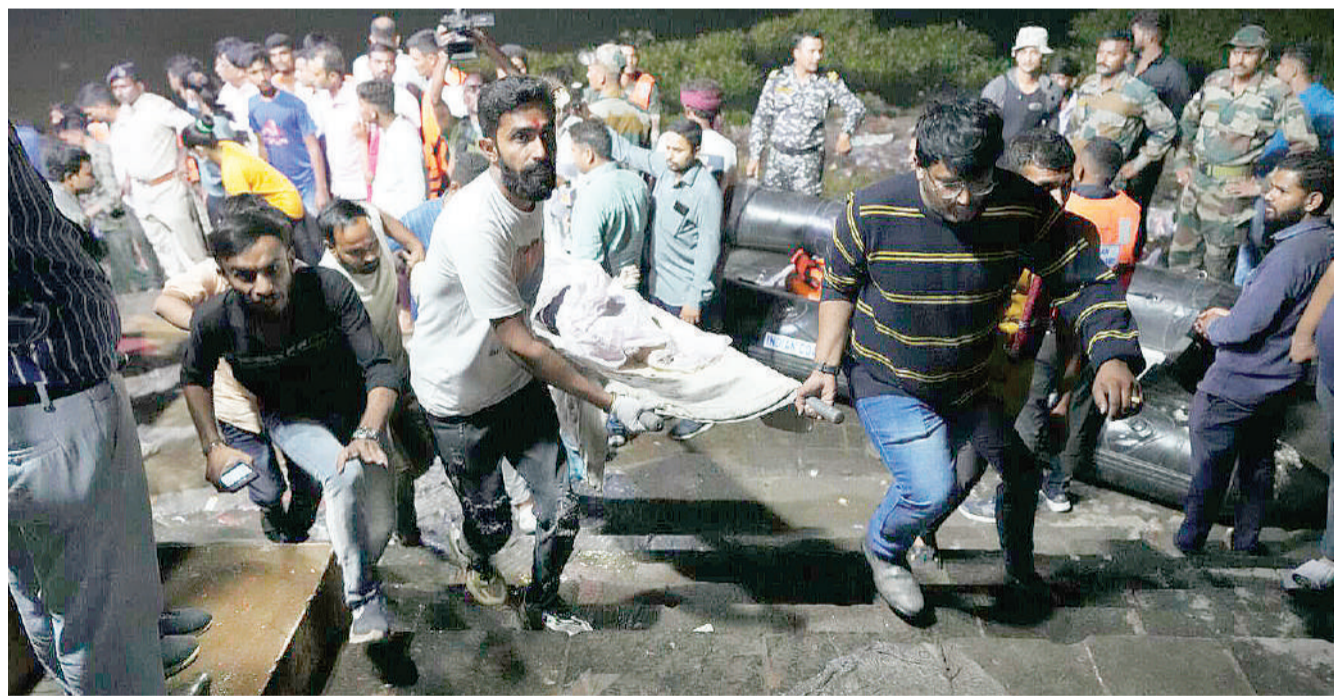
Wafanyakazi wa uokoaji wakibeba miili ya watu waliopolewa kwenye maji ya mto baada ya daraja la zamani kuvunjika na kusababisha mamia ya watu kuzama majini nchini India jana.

Aligharamikia vilivyo usajili wa wanajeshi wa ziada kwa kutembea nchi nzima akitoa hamasa licha ya mamia wa raia kutoroka nchini humo huku wengine wakifanya maandamano ambayo hayajawahi kutokea.