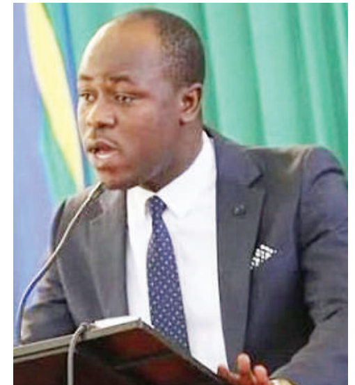
Waziri wa Maji, Jumaa Aweso

“Tunafanya hivyo kwa sababu tunagopa kunaweza kutokea magonjwa ya mlipuko na ndiyo maana tukachukua tahadhari hizo za haraka na serikali kupitia Waziri wa Maji, Jumaa Aweso, imeidhini-