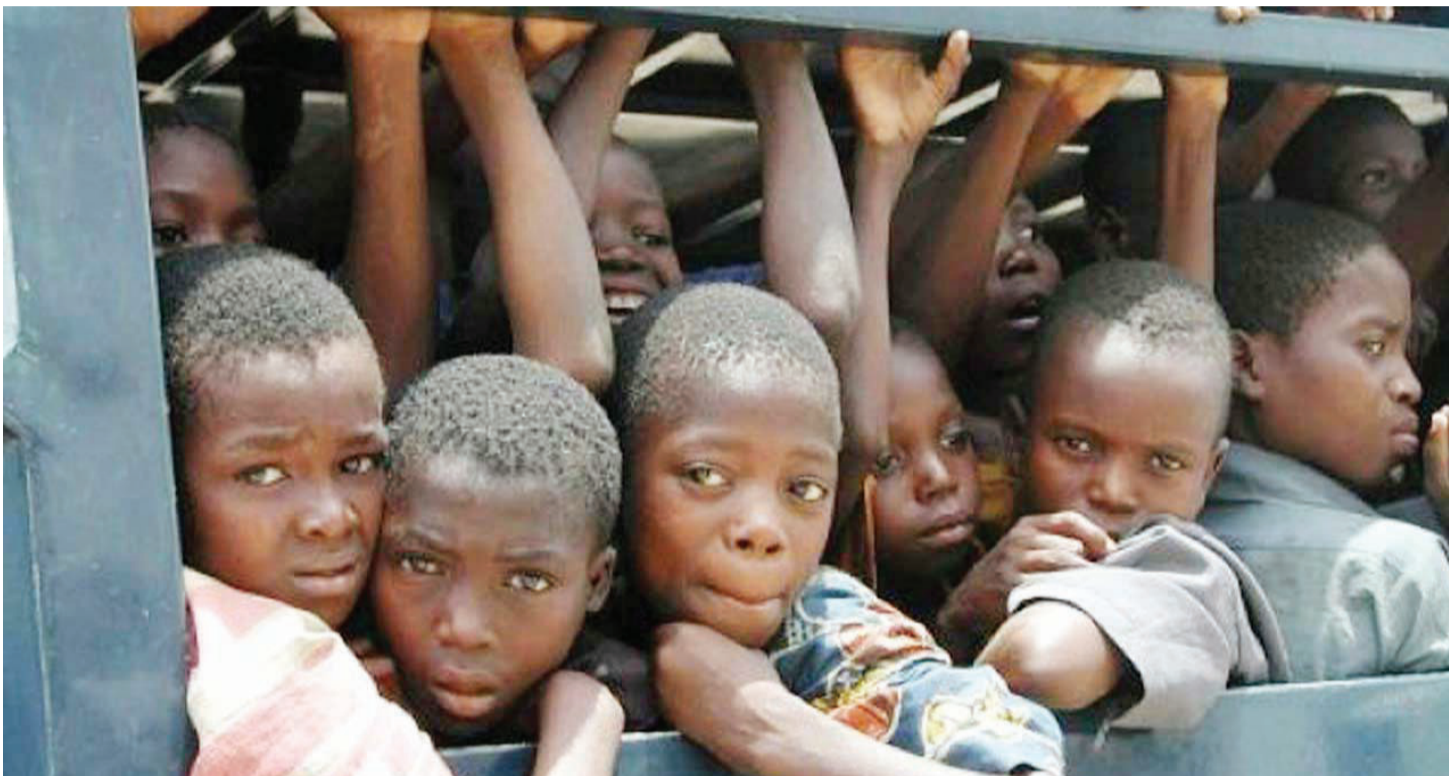
Watoto wanapokosa uangalizi, maadili nyumbani na shuleni huishia kushiriki uhalifu.

S HULE za binafsi na za serikali kuanzia za awali, msingi na sekondari zina-chuana kitaaluma, licha ya kuwa mashindano haya si rasmi, vinara wa matokeo bora kwenye mitihani ya kitaifa hutangazwa, hata hivyo imebainika kuwa pamoja na ushindani wa kitaaluma kuna eneo ambalo halijapewa msukumu. Ni suala la upungufu wa kimaadili.