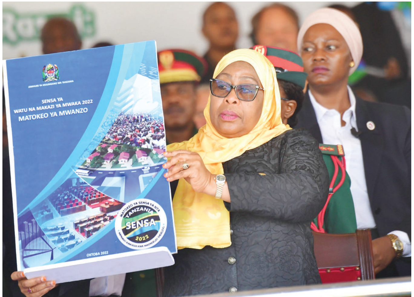
Rais Samia Suluhu Hassan akionyesha kibao chenye idadi ya watu nchini baada ya kuzindua rasmi matokeo ya awali ya sensa ya watu na makazi 2022 katika hafla iliyofanyika Uwanja wa Jamhuri jijini Dodoma jana.

“Inawezekana idadi hiyo ikawa si tatiizo la kuumiza kichwa kwa nchi kubwa kama yetu, lakini ni mzigo mkubwa kwa taifa letu, jamii na uchumi kwa ajili ya kuwahudumia, kuanzia sasa lazima kuwapo mikakati madhubuti ya mipango ya maendeleo ya jinsi ya kuwahudumia