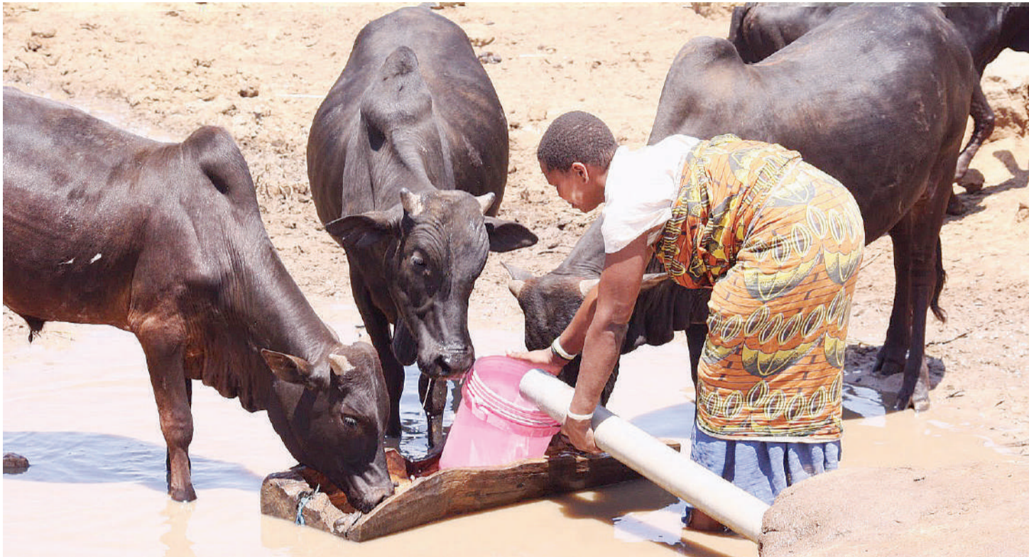
Ukame unavyosababisha watu kusotea maji.