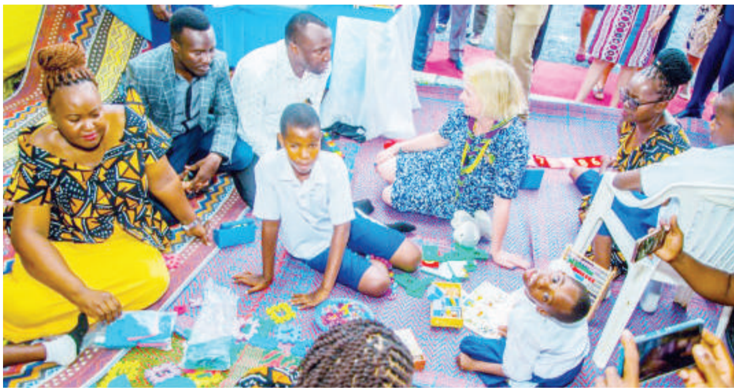
Wanufaika, wanafunzi wa Shule ya Msingi Mkoani Kibaha, wakiwa na wataalamu wa mradi unaowaboreshea elimu.

katika Halmashauri ya Mji Kibaha, iko katika zitakazonufaika kwenye mkakati wa kuwakwama wanafunzi wa kike, wenye ulemavu na wenye mazingira magumu kupata elimu bora.