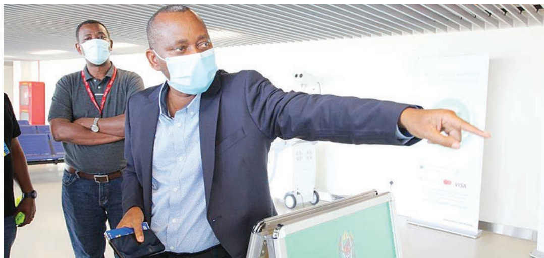
Sehemu ya maandalizi ya kupimia corona Uwanja wa Ndege wa Julius Nyerere, Dar es Salaam.

Anasema, wananchi wavae barakoa, wawe na vitakasa mikono na kuwapo na maji tiririka kwenye maeneo yote yenye mkusanyiko na anaongeze kuwa, Rais Samia Suluhu Hassan alivyosema Tanzania tayari ina wagonjwa