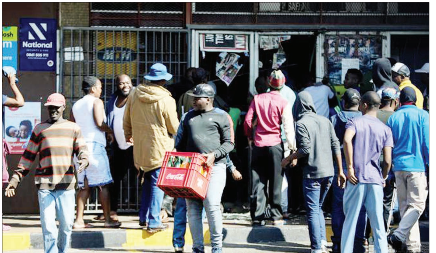
Waandamanaji nchini Afrika Kusini wakiingia kwenye maduka na kupora baadhi ya vitu hali iliyosababisha vurugu na vifo vya watu 72 hadi jana.