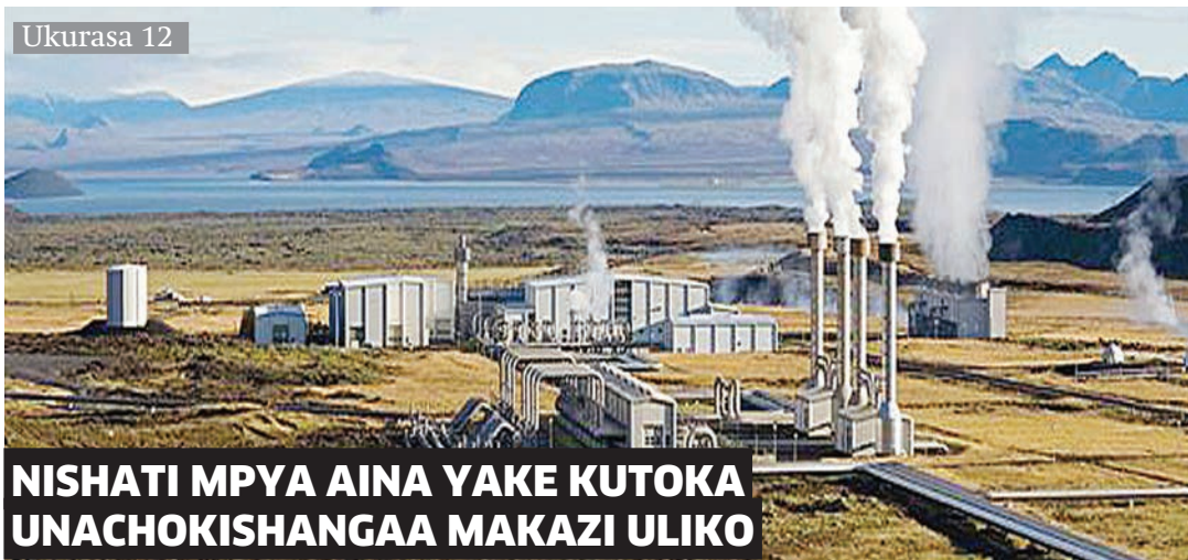
NISHATI MPYA AINA YAKE KUTOKA UNACHOKISHANGAA MAKAZI ULIKO