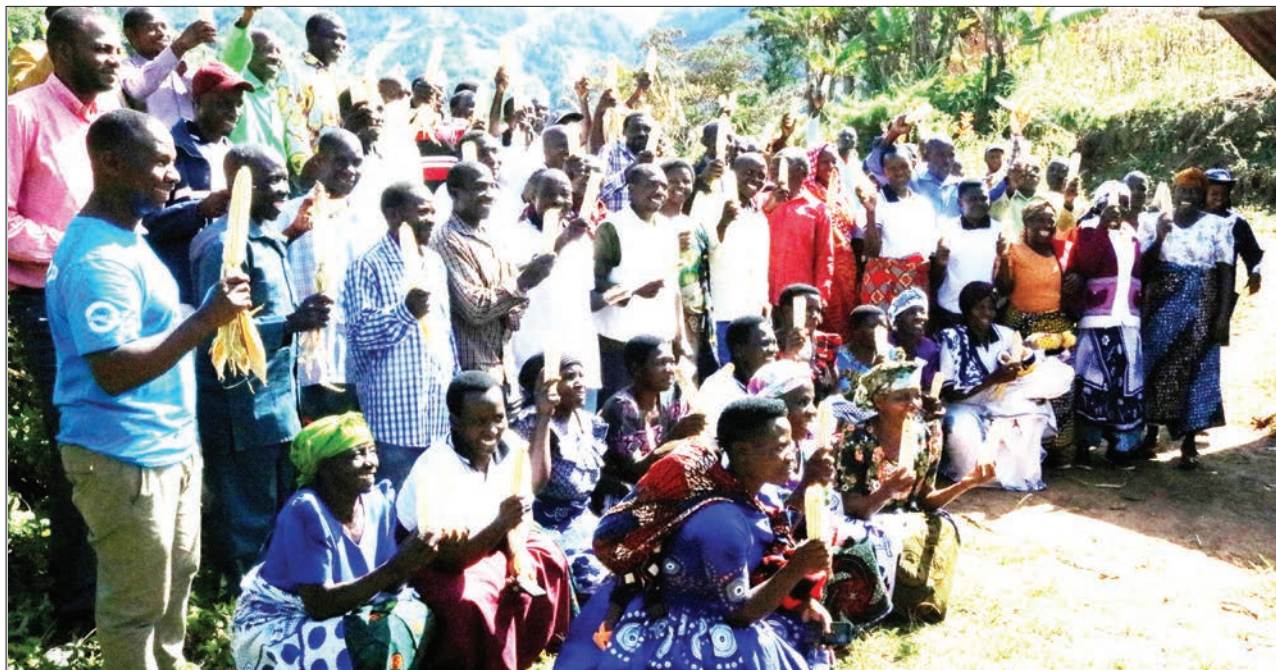
Baadhi ya wakulima wa Kijiji cha Chibila, katika Halmashauri ya Wilaya ya Ileje, mkoani Songwe, wakiwa wamenyanjua mahindi juu wakati walipotembelewa na maofisa wa Taasisi ya HRNS waliowawezesha elimu ya kilimo hifadhi, hivi karibuni.

Ujenzi wa maabara za kisasa na kuboresha miundombinu ya vyumba vya madarasa ni mkakati mwingine ambao unatajwa na halmashauri hiyo katika kuinua kiwango cha ufaulu kwa wanafunzi.