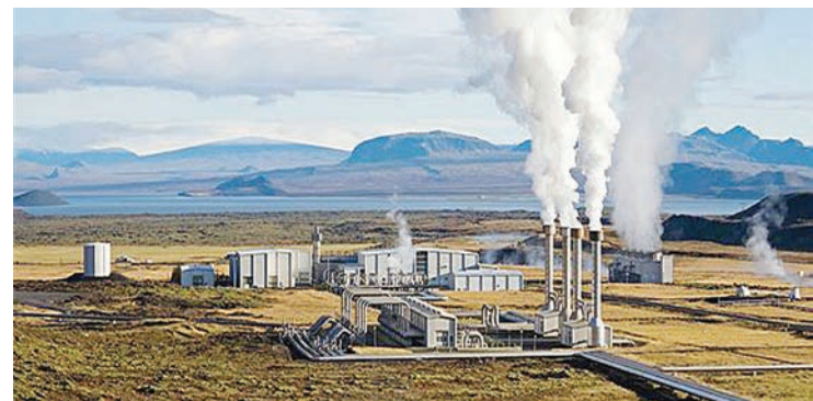
Sehemu ya mradi wa umeme wa joto ardhi