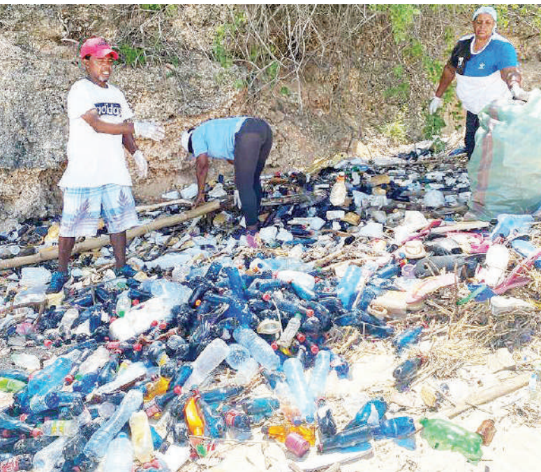
Watumishi wa Mfumo wa Maeneo Tengefu Dar es Salaam (DMRS) chini ya Kitengo cha Hifadhi za Bahari na Maeneo Tengefu (MPRU) na wadau mbalimbali wakifanya usafi katika ufukwe wa Kisiwa cha Bongoyo, Dar es Salaam, kuadhimisha Siku ya Mazingira Duniani juzi. Picha ndogo: Baadhi ya sindano zilizookotwa ufukweni mwa bahari.