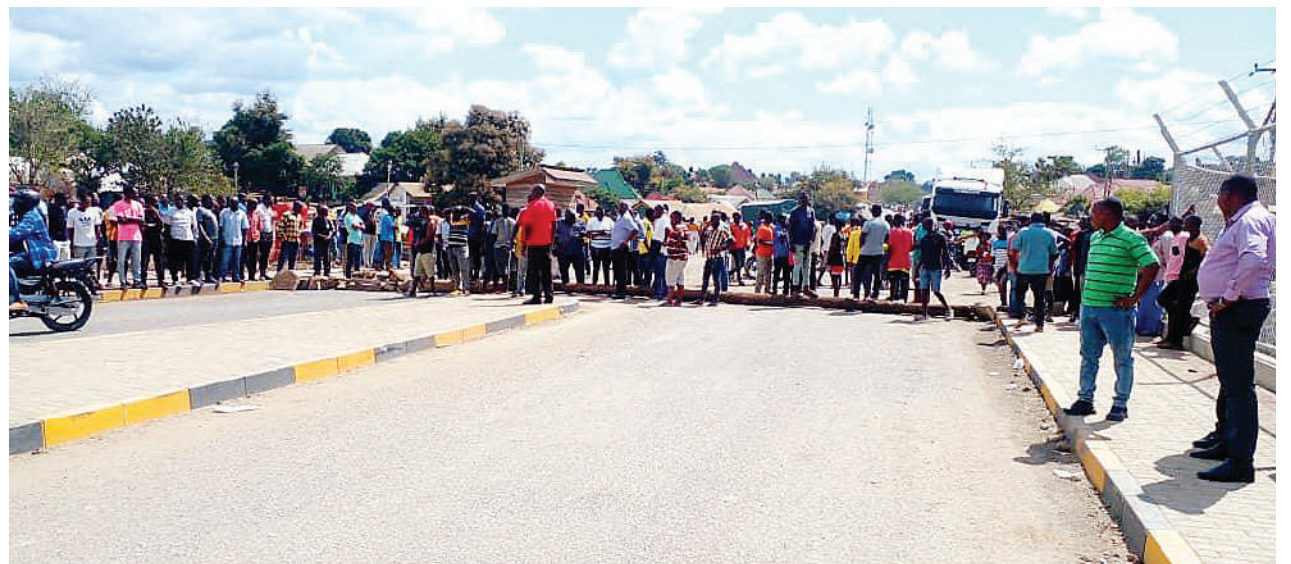
Baadhi ya wafanyabiashara wa mpakani mwa Tanzania na Malawi eneo la Kasumu wilayani Kyela mkoani Mbeya jana waliandamana katika mpaka huo, wakishinikiza serikali ya Malawi kuyaachia magari 60 ya mizigo yaliyozuiwa ili kulipa tozo mpya za ukusanyaji mapato na usafirishaji mizigo zilizopitishwa na kuanza kutumika Aprili 18, mwaka huu.

Masauni ameitwa mbele ya Tume Chande, wakati ambao tayari imeanza kuchakata maoni kwa ajili ya kuandika ripoti ambayo itawasilishwa kwa Rais Samia Suluhu Hassan. Tume ya Jaji Chande ilianza kazi Februari Mosi mwaka huu na ilipaswa kumaliza kazi yake mwisho ni mwa mwezi uliopita.