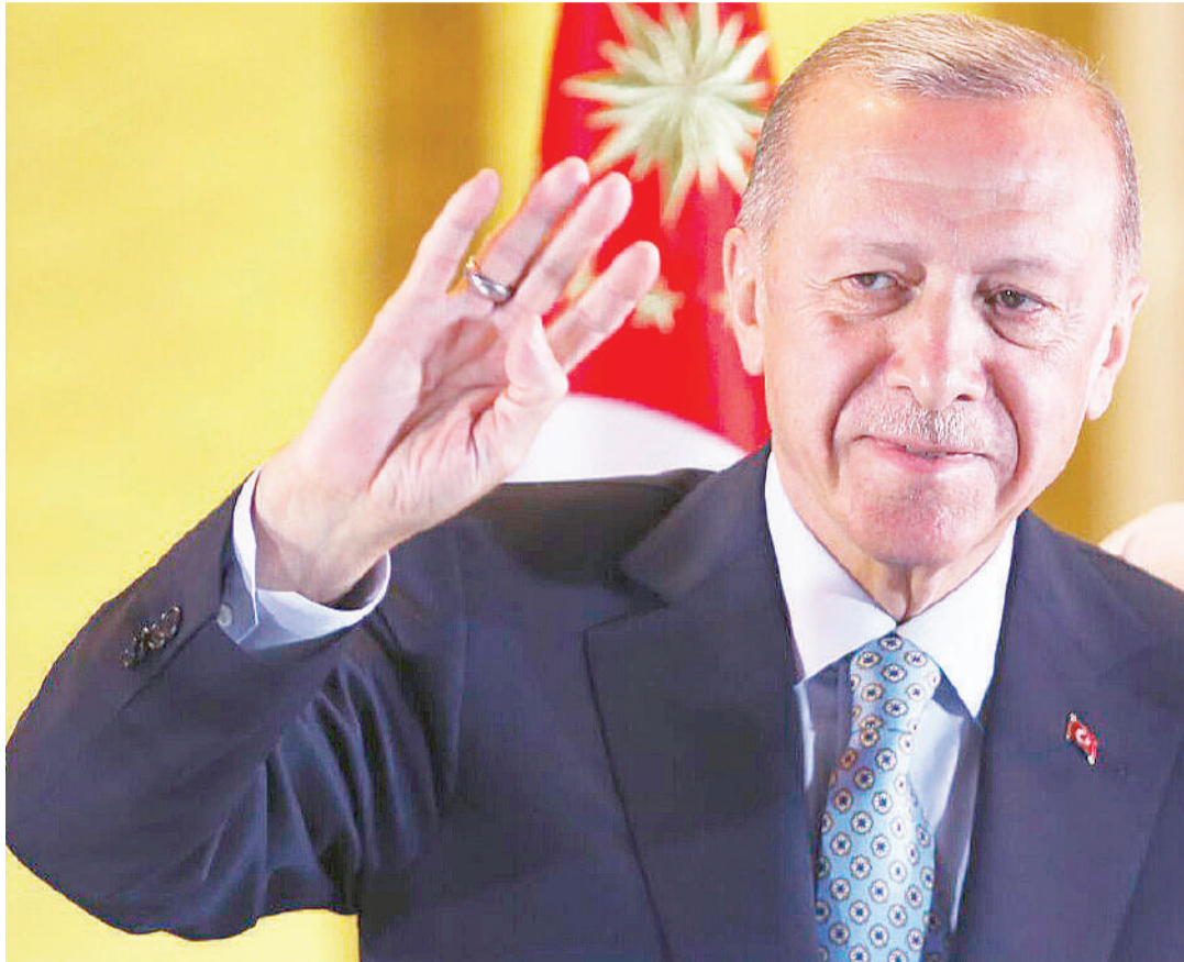
Recep Tayyip Erdogan

Si rahisi kusema nini kingebadilika endapo Erdogan asingeshinda uchaguzi kwa hapa kuwapo na uwezekano wa mpinzani