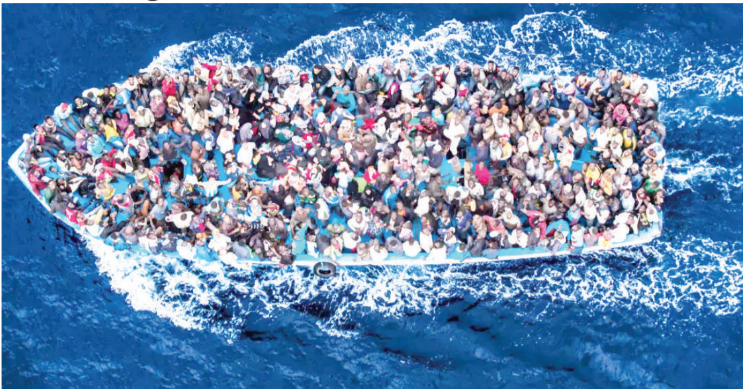
Wakimbizi wa Afrika wakizama baharini kukimbilia Ulaya ili kukwepa shida kwenye nchi zao.