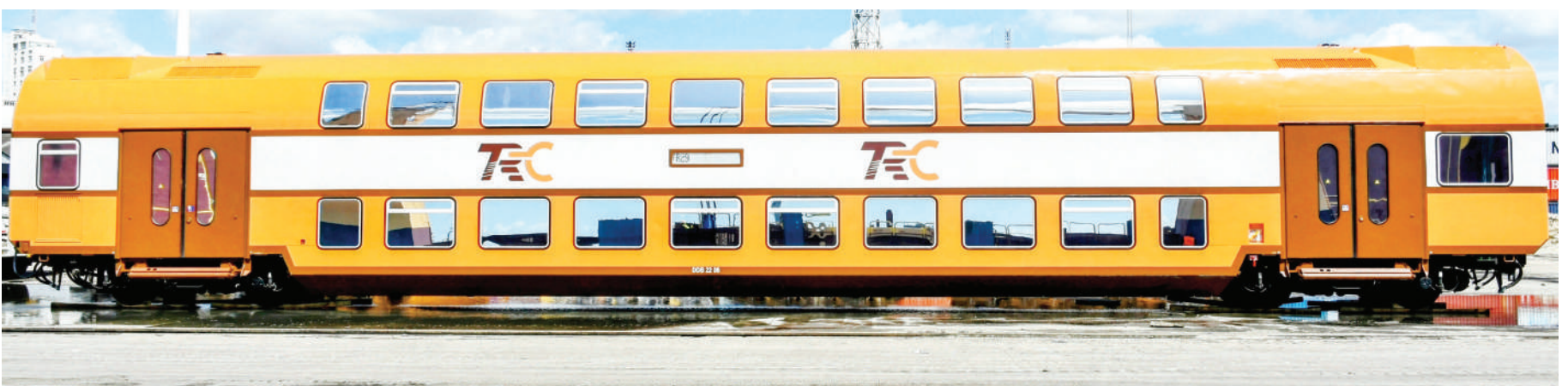
Moja ya mabehewa sita ya treni ya abiria yaliyokarabatiwa nchini Uturuki kwa ajili ya kutumika katika reli ya kisasa (SGR) yalipowasili Bandari ya Dar es Salaam jana.

• Taka za plastiki nazo zabainika... Endelea ukurasa wa 2