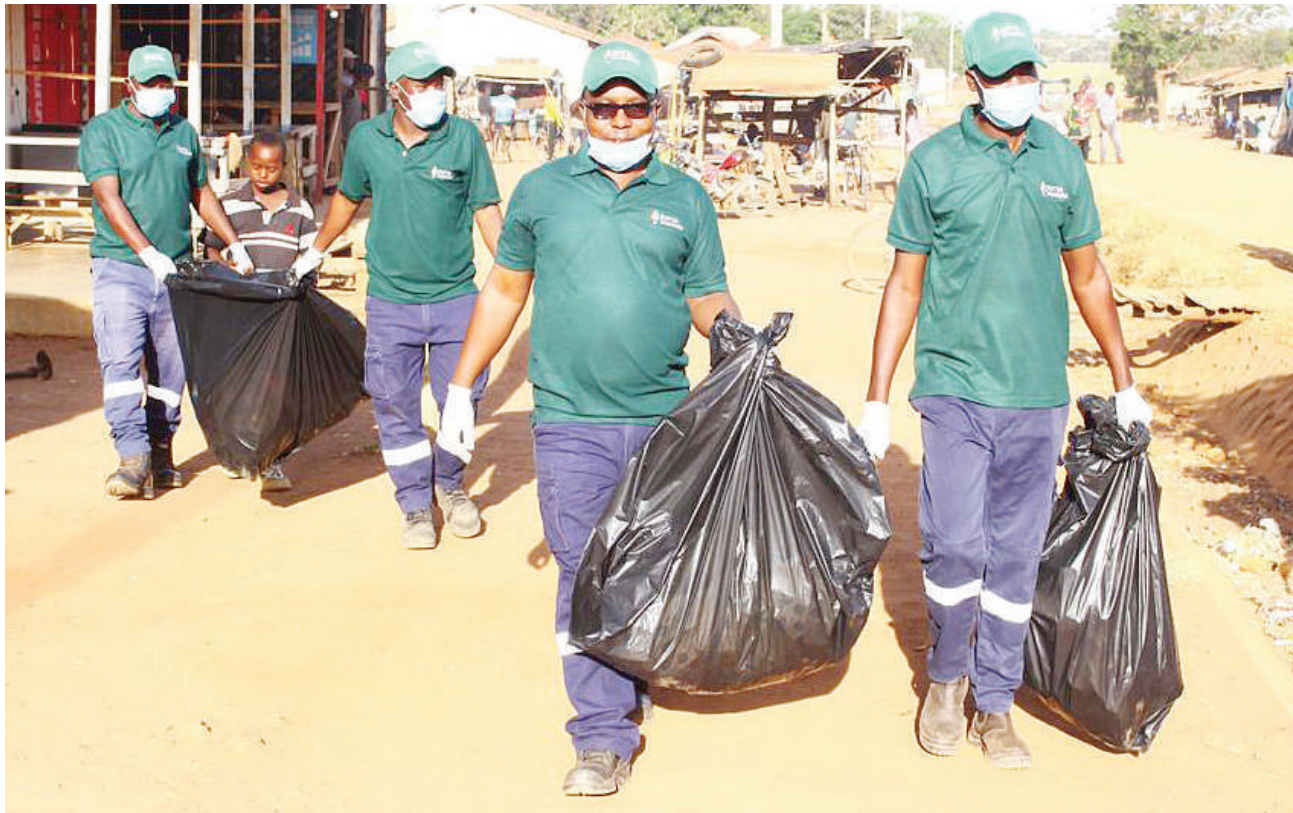
Wafanyakazi wa mgodi wa dhahabu wa Sotta na wakazi wa Kijiji cha Ngoma wilayani Sengerema mkoani Mwanza, wakiokota taka za plastiki kwa lengo la kusafisha mazingira kijijini hapo juzi, ikiwa ni sehemu ya maadhimisho ya Siku ya Mazingira Duniani.

Nao baadhi ya wafanyabiashara mkoani Shinyanga waliomba serikali kuendelea ujenzi wa uwanja huo wa ndege ili kuanza kuwahudumia wasafiri kutoka mkoani humo na kuondokana adha ya kusafiri kuelekea mkoani Mwanza ili kupata usafiri wa ndege.