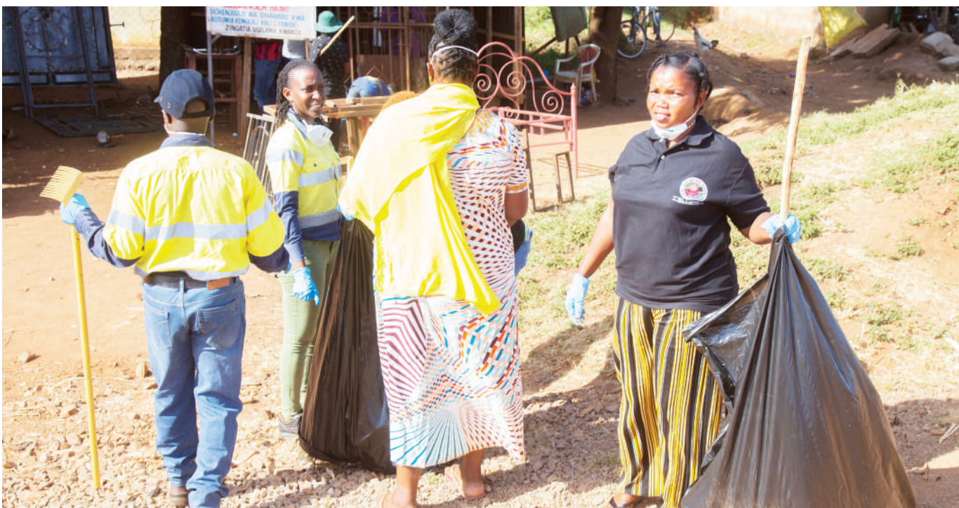
Baadhi ya wafanyakazi wa Mgodhi wa Barrick Bulyahulu wilayani Msalala mkoani Shinyanga, wakishiriki kupanda miti katika Kitongoji cha Kakola wakati wa maadhimisho ya Siku ya Mazingira Duniani juzi.

Kiwia alisema katika kuadhimisha Siku ya Mazingira Duniani wamefanikiwa kupanda miti 850 aina ya mivenge.