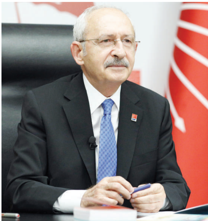
Mpinzani mkuu, Kemal Kilicdaroglu.

Jeshi la ardhini lina usomi hafifu zaidi, na hivyo ni rahisi kuathiriwa na mihemko ya kimapinduzi inayochochea harakati zikiwamo za waasi, za kujitenga na hata zinazoanzishwa na mamluki.