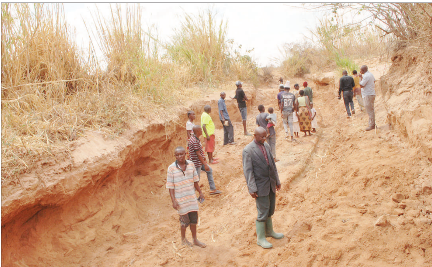
Wanakikundi cha Tupendane cha Chikola, kinachojishughulisha na kilimo cha zabibu, nyanya na mboga wakiangalia maeneo yao yanayotumika kwa shughuli za mashamba ambayo hivi sasa yamevamiwa na wachimbaji wa mchanga na kusababisha uharibifu mkubwa wa mazingira, katika Mtaa wa Kisisiri, Kata ya Matumburu, Wilaya ya Dodoma, jana.

Hata hivyo, alisema ranchi zote zinapaswa kuwa na viwango bora, ili kuwavutia watumiaji wa nyama na maziwa kuwa na imani na bidhaa zinazozalishwa katika maeneo mbalimbali nchini.