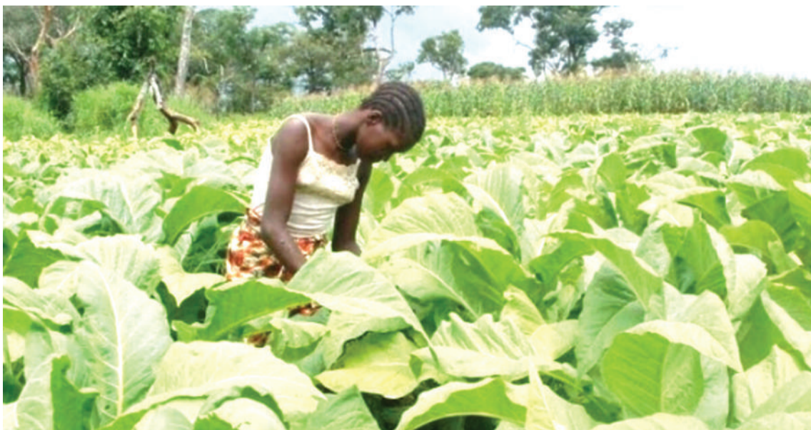
Kilimo cha tumbaku kikiendelea shambani.

Serikali kwa upande wake inaendelea kuchukua hatua kubwa, ikiwamo katika tafsiri yake kuwa zao la kimkakati, mfano hai ufuatiliaji wa kiwango cha juu kuhusu kasoro zinazojitokeza kukwaza soko la uzalishaji uliopo.