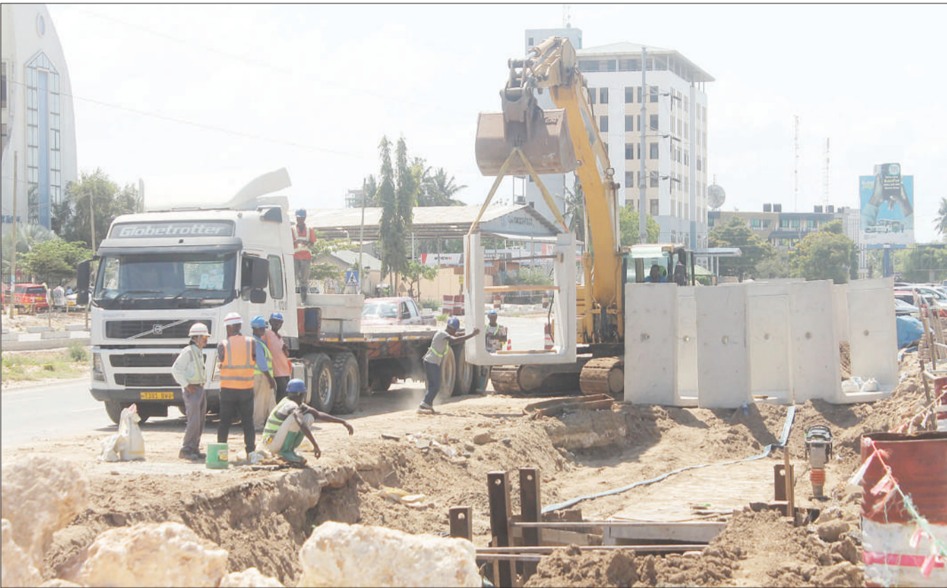
Mafundi wa kampuni ya Nipo, wakishusha vifaa vya ujenzi wa barabara katika eneo la Makumbusho, jijini Dar es Salaam jana.