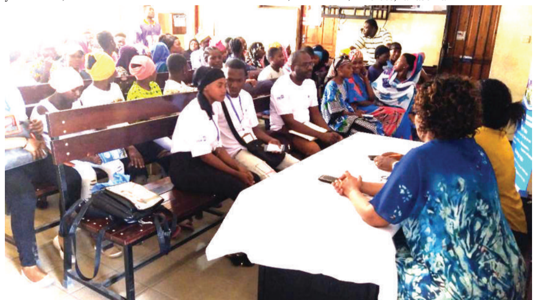
Mafunzo kwa vijana kujihami dhidi ya maradhi, yakiendelea katika Zahanati ya Tandale, Dar es Salaam. Aiiyekaa mbele ni Ofisa Ustawi Jamii wa zahanati.

"Hivi sasa tunahamasisha wananchi wafikie angalau maisha ya kati hasa kwa upande wa elimu na sasa hivi tukikuta unampa mtoto wa kike mimba 'tuna - deal' (kushughulika) na wewe naomba pia Ofisa Maendeleo na Mganga Mkuu, tushirikiane kwa jambo lolote," anasema