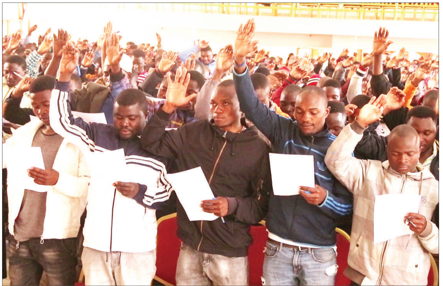
Baadhi ya mawakala wa vyama vya siasa jijini Mbeya wakiapa jana kwa ajili ya kusimamia Uchaguzi Mkuu wa Oktoba 28, mwaka huu.

Pia alisema taasisi hiyo ilifanya uchambuzi wa mifumo sita na kufuatilia thamani ya fedha katika miradi 10 katika sekta ya maji, elimu na afya mkoani humo ili kuangalia kama inaendana na thamani ya fedha zilizotolewa na serikali.