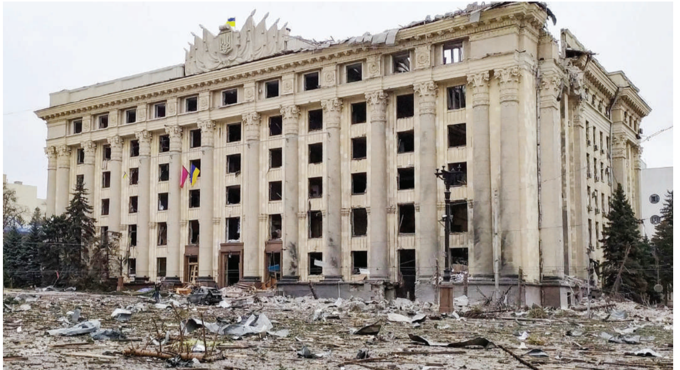
Jengo la Utawala Mkoa wa Kharkiv, lilikuwa kati ya majengo yaliyoshambuliwa jana. Inakadiriwa raia 350 wamepoteza maisha, ikiwa ni takriban wiki moja tangu mashambulizi ya Russia dhidi ya Ukraine, yaanze.

Hakukuwa na malengo ya kijeshi katika uwanja huo - wala hawako katika maeneo ya makazi ya Kharkiv ambayo yanapigwa na makombora,” aliongeza.