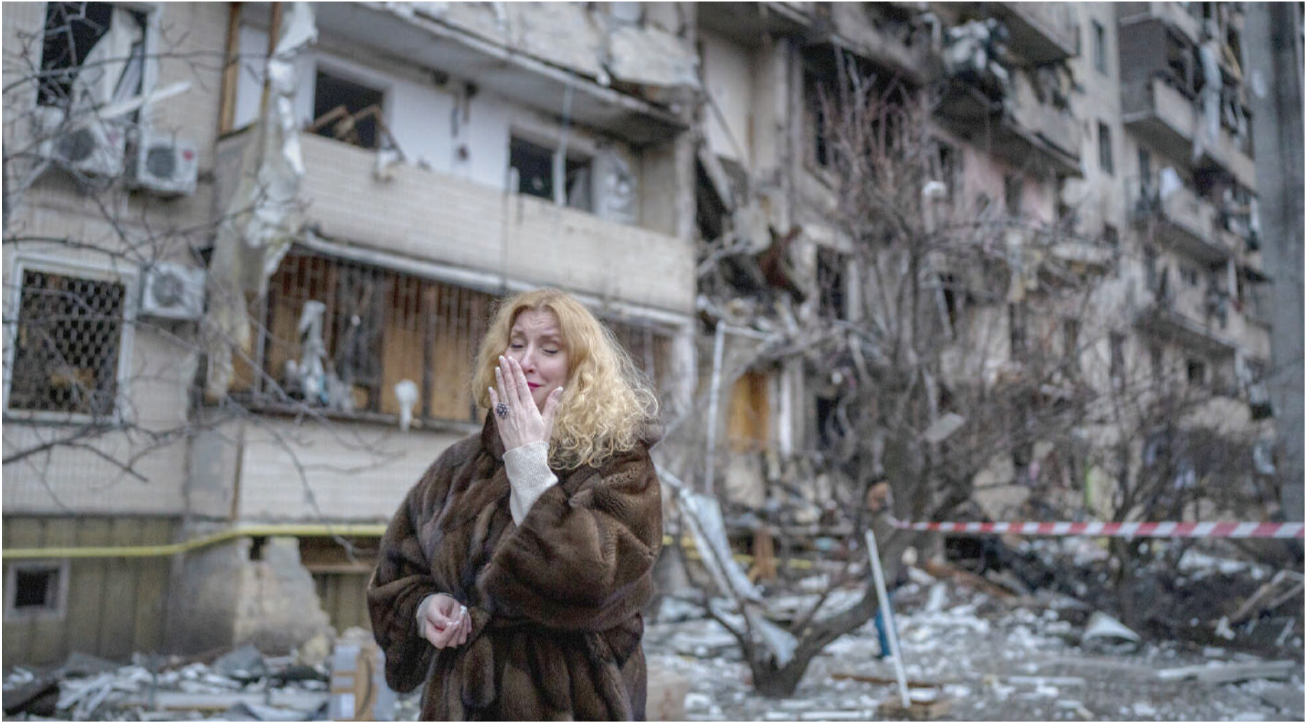
Raia wanashangaa maafa watu kuuawa, majengo na mindombinu kuharibiwa na majeshi ya Russia nchini Ukraine.