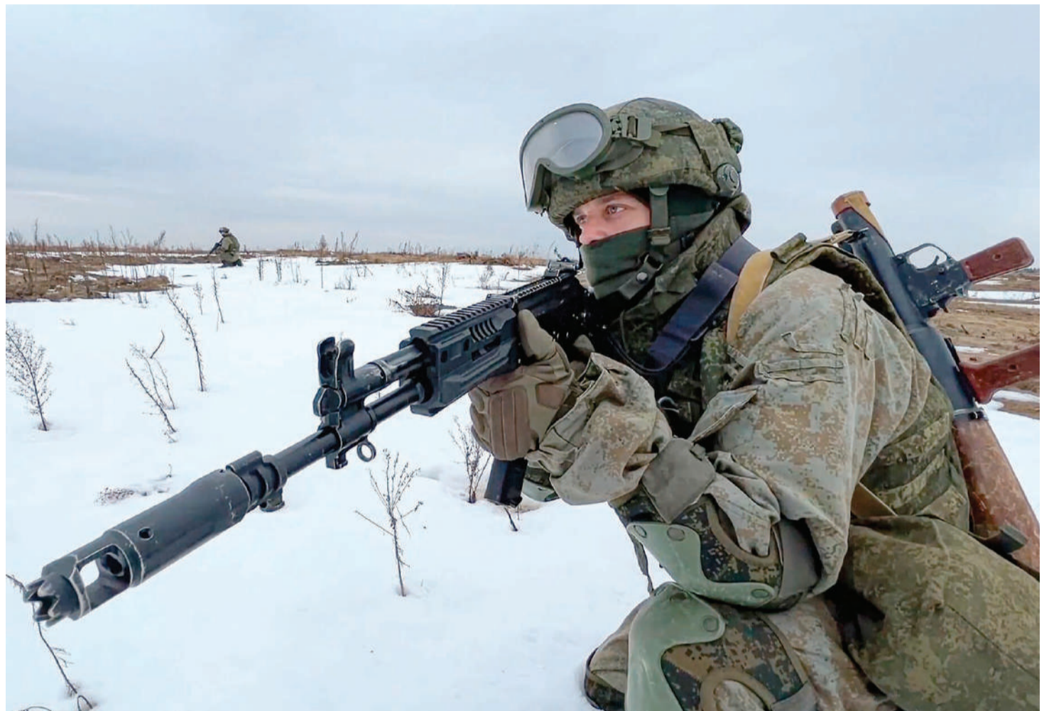
Wanajeshi wa Russia wakiwa tayari mpakani.

Hadi ilipojitenga na Russia kuanzia mwaka 1991, Russia imekua ikiifuatilia kila wakati lakini Rais wake Zelenskyy, hataki na muda wote anaonyesha ari ya