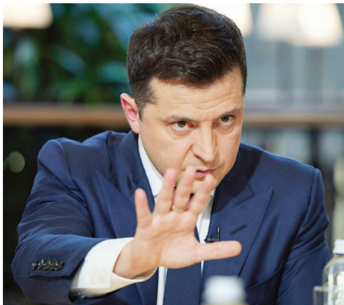
Rais wa Ukraine Volodymyr Oleksandrovyh Zelensky, anasubiriwa kufanya maamuzi ya kumaliza au kuendeleza vita yake na Russia.

Hofu hiyo inaweza kuibuka kutokana na maelezo kuwa yeyote atakayeingilia na kuishambulia Russia atapata kipigo cha kihistoria.