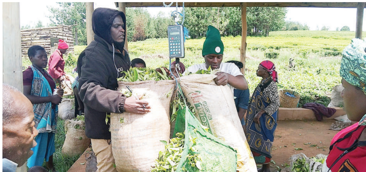
Wakulima wa zao la chai wa Igoda, Kata ya Luhunga wilayani Mufindi, mkoani Iringa, wakipima majani ya chai jana, kwa ajili ya kuuza kwenye viwanda vya uchakataji chai ambapo kilo moja ya majani mabichi inauzwa 12/-

“Kwa kawaida mzabuni anatakiwa kutoa huduma ya vifaa kabla ya kulipwa fedha zake. Sasa katika halmashauri yetu wazabuni wanatoa huduma halafu fedha zao hawalipwi kwa wakati, hivyo kitengo cha ununuzi kinapata wakati mgumu kuwamba wazabuni kuendelea kutoa huduma wakati madai yao mengine ya nyuma hayajalipwa,” alisema.