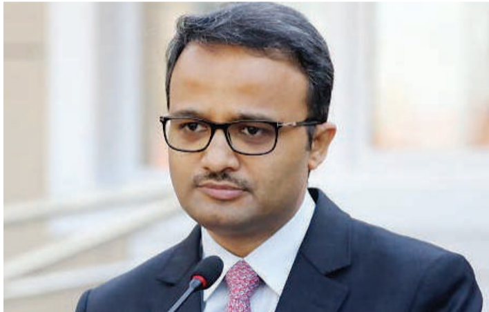
Balozi wa India, Binaya Pradhan.

Uwekezaji na biashara vinatoa fursa pia kwa mafuta ya karanga, alizeti na matunda kama maembe kutoka Tanzania kuuzwa nchini mwake na kwamba kuna soko kubwa na la uhakika.