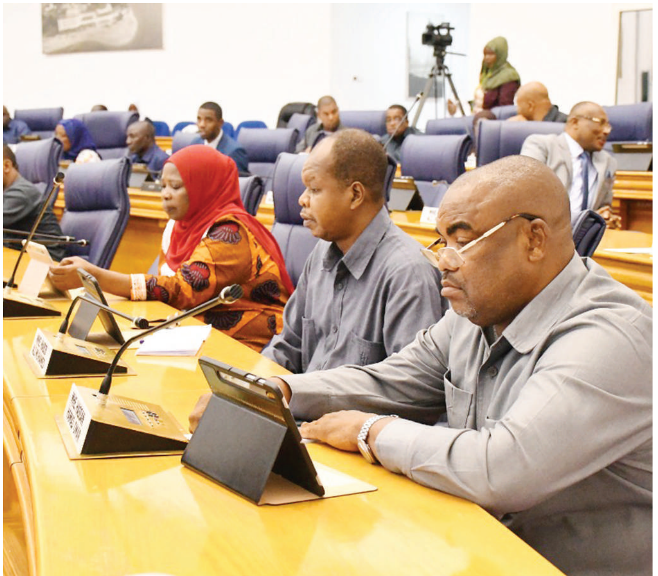
Baadhi ya wajumbe wa Baraza la Wawakilishi, wakifuatilia kikao cha baraza hilo, kinachoendelea Chukwani, nje ya Mji wa Zanzibar jana.

“Mgawo wa fedha zinazotokana na tozo za simu tumejipanga kuzielekeza moja kwa moja katika kuimarisha sekta ya afya ikiwamo ujenzi wa vituo vya afya kwa ajili ya wajawazito na watoto hadi vijijini Unguja na Pemba,” alisisitiza.