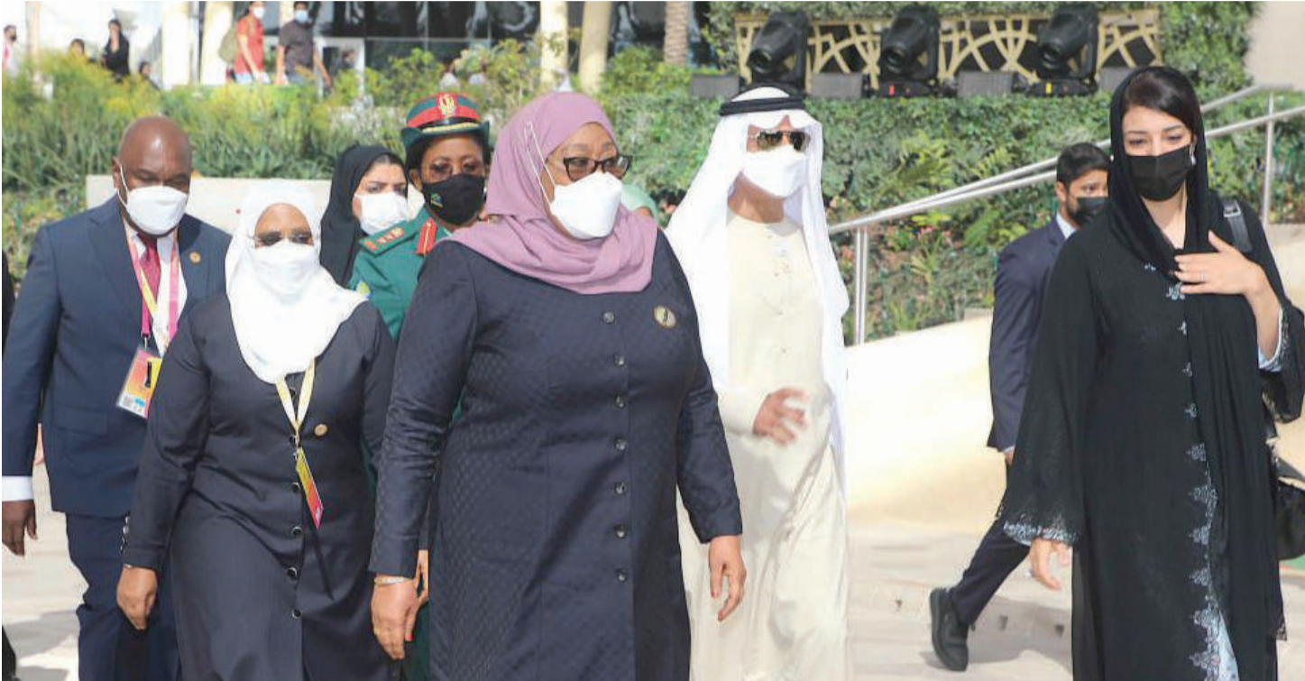
Rais Samia Suluhu Hassan, katika ziara ya nchi za ughaibuni hivi karibuni.

• Wawekezaji waja kwenye gesi, matibabu kibingwa