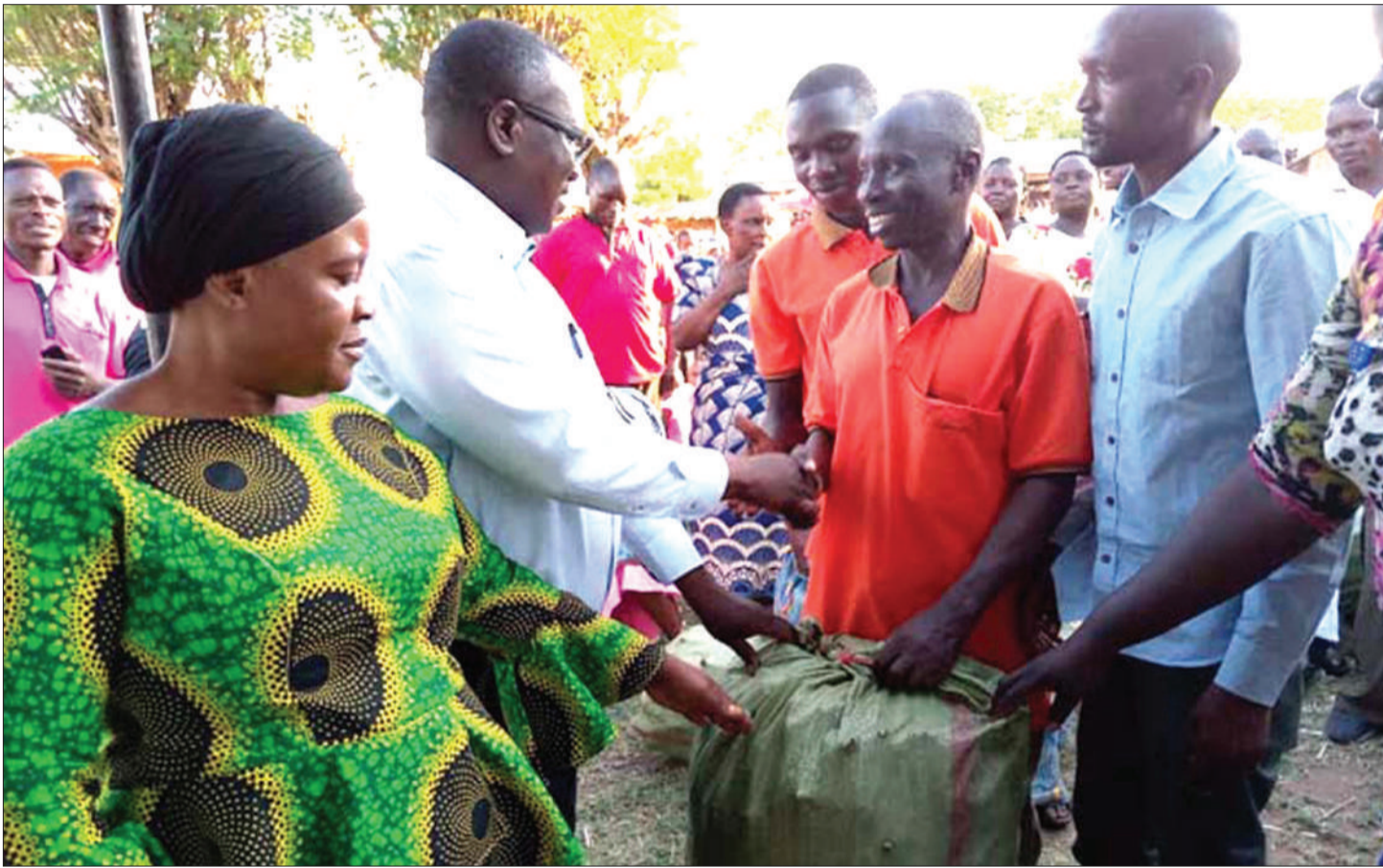
Mbunge wa Butiama (mwenye miwani), akikabidhi moja ya magunia yenye vipande vya miti ya mihongo aina ya mkombozi, kwa ajili ya kuboresha kilimo cha zao hilo jimboni mwake.