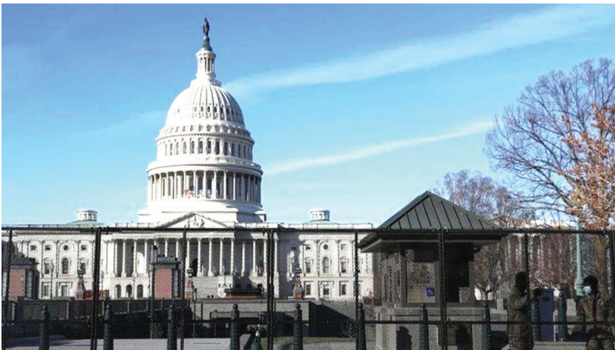
Jengo la Capitol eneo linalotarajiwa Rais mteule, Joe Biden na Makamu wa Rais, Kamala Harris, kula kiapo wiki ijayo. Usalama umeimarishwa kuelekea hafla hiyo kufuatia wiki iliyopita wafuasi wa Rais Donald Trump, kuvamia eneo hilo na kusababisha vifo.

Inafahamika kuwa, Israel imechukua hatua kama hiyo muda mfupi kabla ya Rais mteule, Joe Biden, kuchukua wadhifa wake. TRT