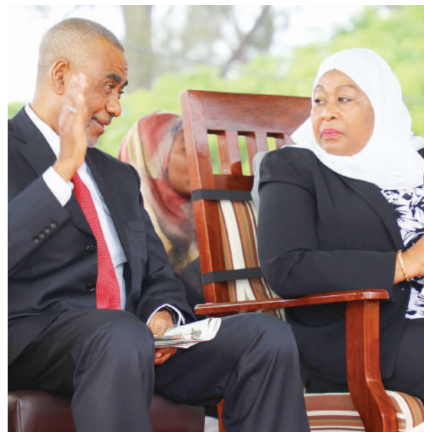
Makamu wa Rais wa Jamhuri ya Muungano wa Tanzania, Samia Suluhu Hassan, akijadiliana jambo na Makamu wa Kwanza wa Rais wa Zanzibar, Maalim Seif Sharif Hamad, katika maadhimisho ya miaka 57 ya Mapinduzi Matukufu ya Zanzibar.