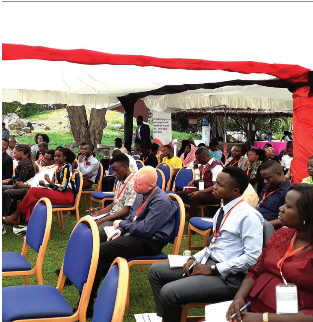
Wadau wa AZAKI za Afrika Mashariki kwenye jukwaa la kutathimini mchango wa taasisi za kiraia lililofanyika Arusha.

"Zinawajibika kuhoji matumizi ya fedha za umma mathalan, Afrika ina wanasiasa ambao wakiwa kwa wapigakura ni kama malaika wanahimiza na kuchangia maendeleo na kusaidia wananchi kutatua matatizo. Hata hivyo, wakiwa ndani ya ofisi za umma ni waba-