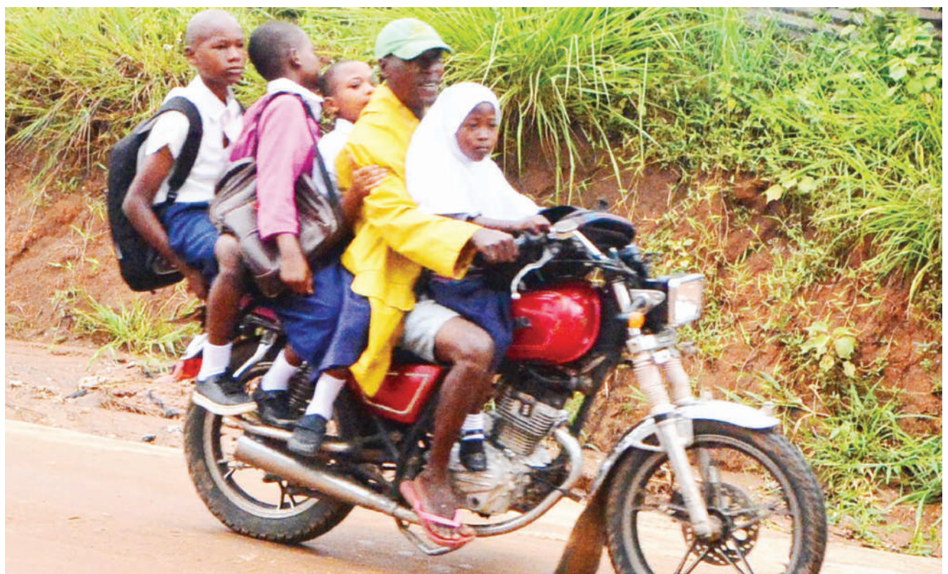
Dereva wa bodaboda akiwa amepakia wanafunzi kwa mtindo maarufu kama mshikaki katika eneo la Tegeta A, jijini Dar es Salaam jana, kitendo ambacho ni hatari kwa usalama barabarani.