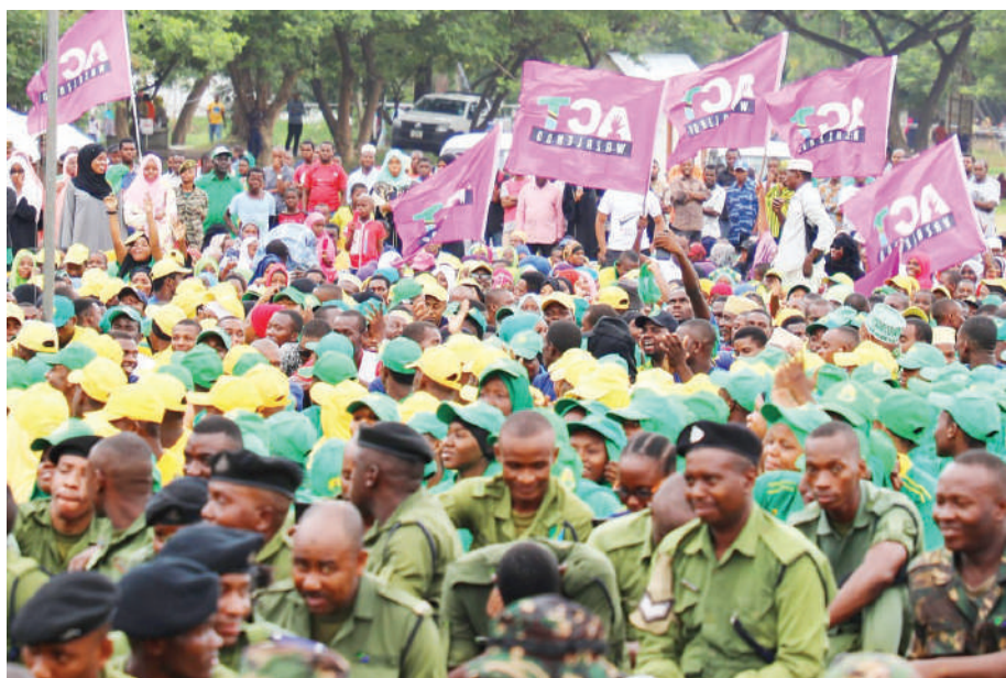
Wanachama wa vyama mbalimbali vya siasa wakiwa katika maadhimisho hayo.