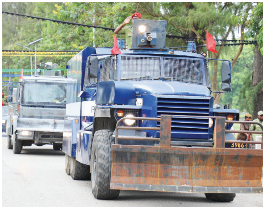
Magari maalum ya Jeshi la Polisi yakipita katika maadhimisho hayo.