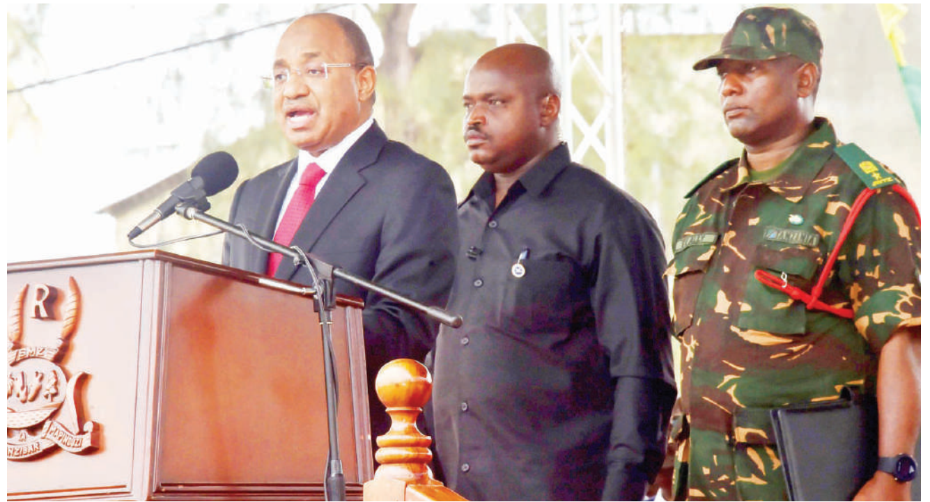
Rais wa Zanzibar na Mwenyekiti wa Baraza la Mapinduzi, Dk. Hussein Ali Mwinyi, akihutubia wananchi wakati wa sherehe za kilele cha maadhimisho ya miaka 57 ya Mapinduzi Matukufu ya Zanzibar katika viwanja vya Mnazi Mmoja, jijini Zanzibar jana.

Sherehe hizo pia zilipambwa na shangwe za wafuasi wa vyama vya siasa ikiwamo Chama Cha Mapinduzi (CCM) na ACT-Wazalendo.