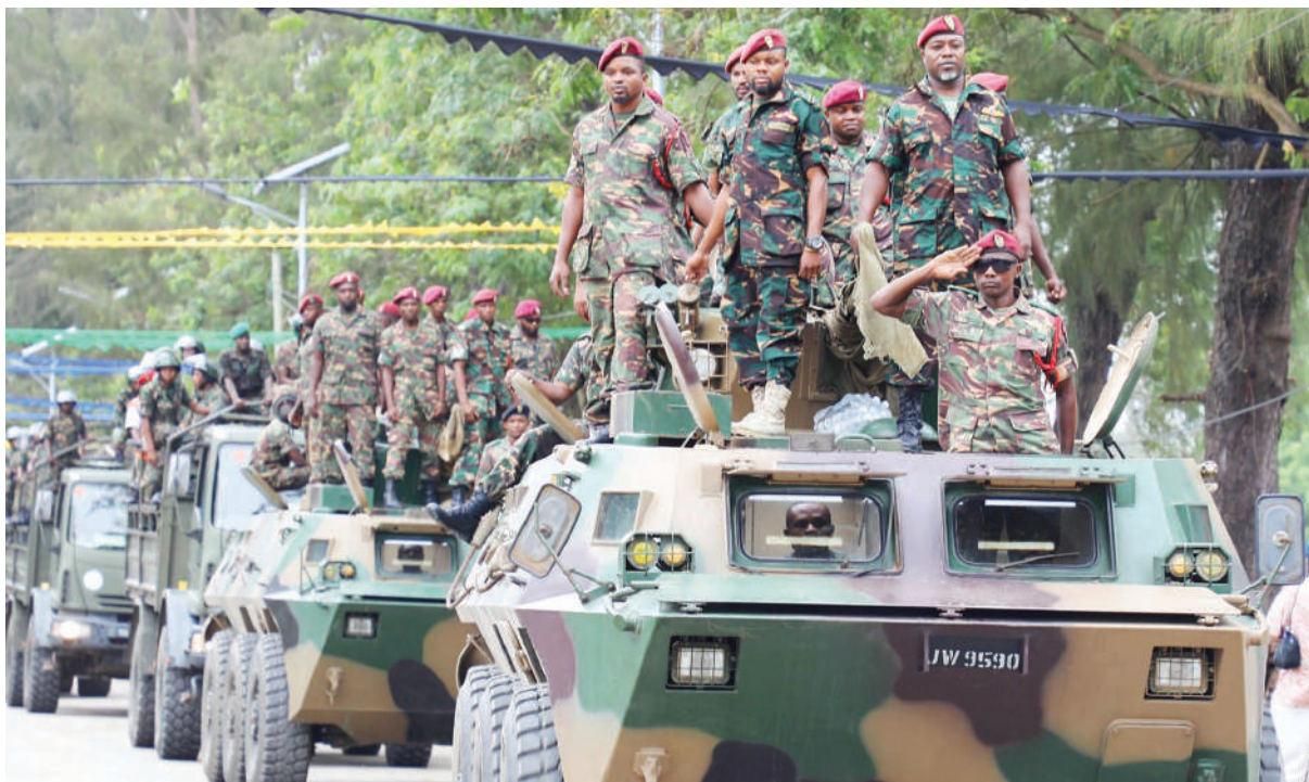
Askari wa Vikosi vya Ulinzi wakipita na vifaru wakati wa maadhimisho hayo.