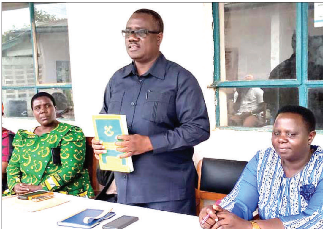
Mbunge wa Butiama (katikati), akiwa katika moja ya mikutano yake jimboni.

Anakusudia kushirikiana na wapigakura wake ili kuifanya iwe ya kisasa na yenye maendeleo makubwa. Sensa ya mwaka wa 2012, inataja idadi ya wakazi kuwa ni 241,732 wanaojishughulisha na kilimo cha mazao ya chakula na biashara.