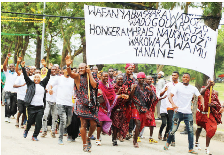
Wafanyabiashara wadogo wakiwa na bango la kumpongeza Rais Dk. Hussein Ali Mwinyi, wakati wa maandamano ya maadhimisho hayo.