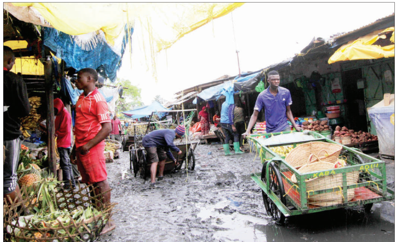
Msukuma toroli akipita kwa shida kwenye soko la Sabasaba, jijini Dodoma jana, kutokana na kujaa maji machafu na tope, lililosababishwa na mvua kubwa inayoendelea kunyesha katika Jiji hilo.

“Utaratibu huo uende sambamba na wafanyabiashara wadogo kufanya biashara zao katika maeneo waliyotengwa ili kutosababisha adha kwa watumiaji wengine wa kituo cha mabasi,” alishauri.