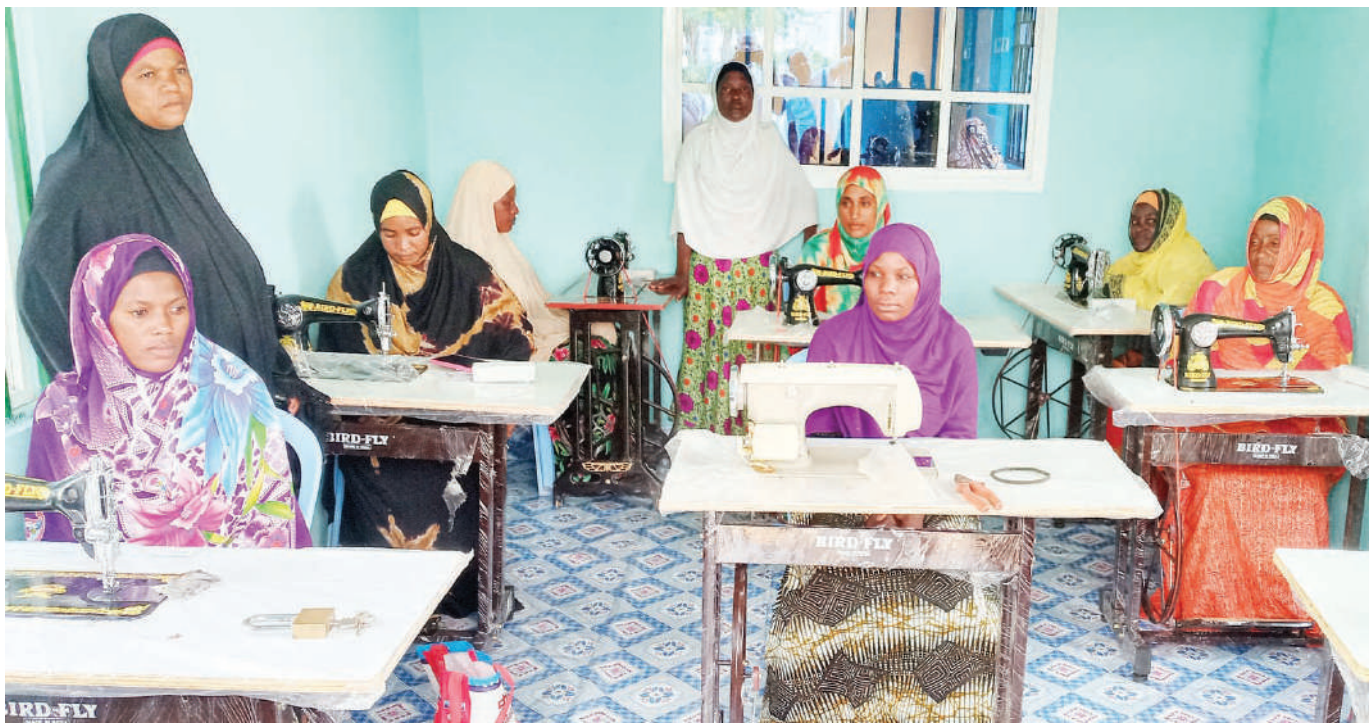
Sehemu ya kinamama 50 wa kiislamu kutoka Kata ya Muhungula, Halmashauri ya Mji wa Kahama, mkoani Shinyanga, wakiwa wamekalilia vyereheni 10 vilivyotolewa bure na Jumuiya ya Kimataifa ya Istaqaama Muslimu Community jana, kwa ajili ya kujikwama kiuchumi.

Sambamba na hilo, alisema ramani zitapelekwa kwa taasisi za kuombea fedha, lakini si benki kutokana na kukatwaza na serikali kuomba fedha katika taasisi hizo.