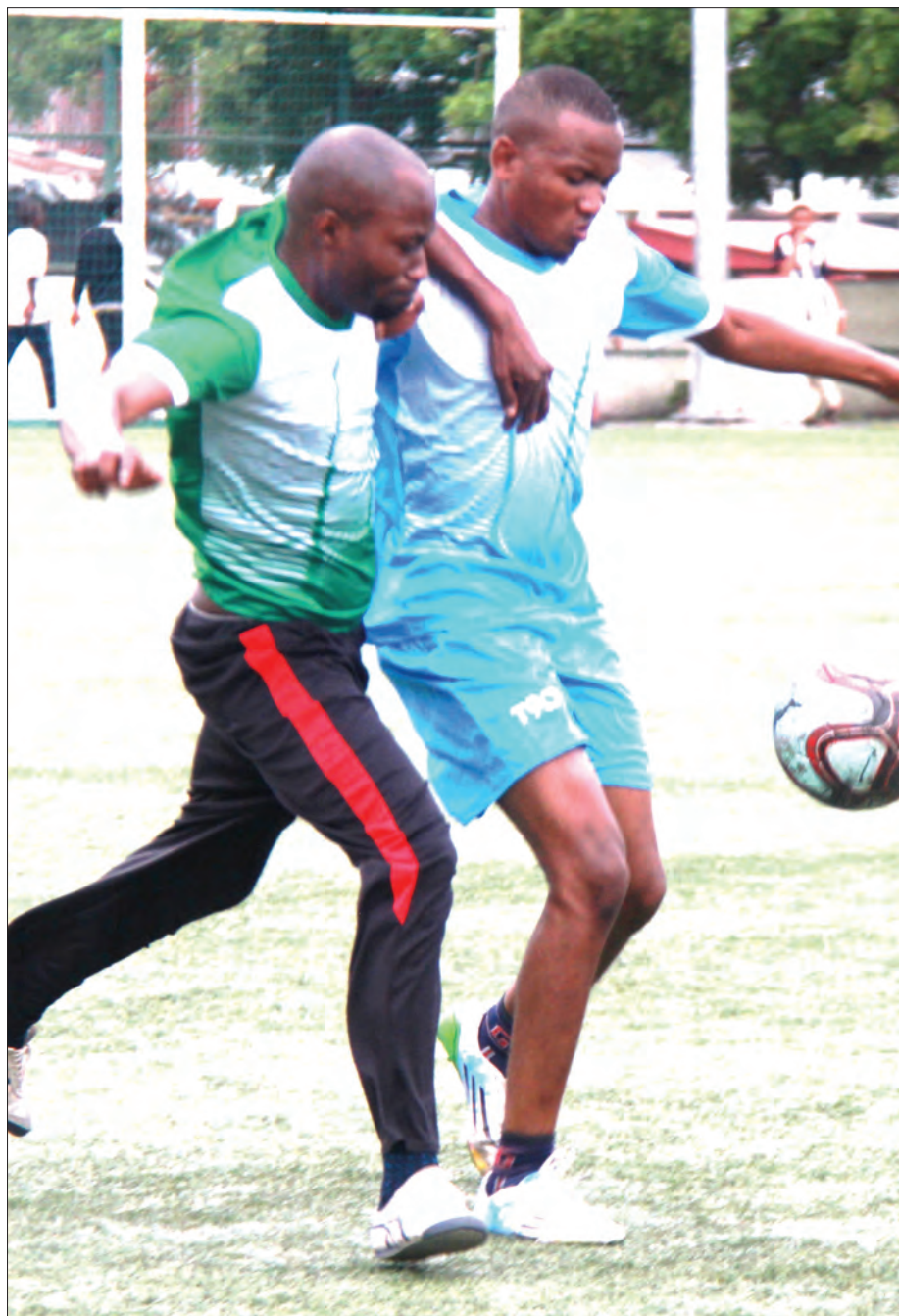
Wachezaji wa timu ya maveterani wakifanya mazoezi ili kujiweka fiti kwenye Uwanja wa Jakaya Kikwete Youth Park, Dar es Salaam mapema wiki hii.

Wakati Mkwawa Queens inaburuza mkia ikiwa na pointi mbili, Amani Queens ipo juu yake ikishika nafasi ya tisa na pointi zake nne.