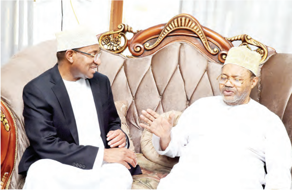
Rais wa Zanzibar, Dk. Hussein Ali Mwinyi aki-zungumza na Rais mstaafu wa Zanzibar, Dk. Salmin Amour Juma, alipofika nyumbani kwake Migombani Wilaya ya Mjini Unguja, jijini Zanzibar jana, kwa ajili ya kumsalimiana na kumjuliana hali.