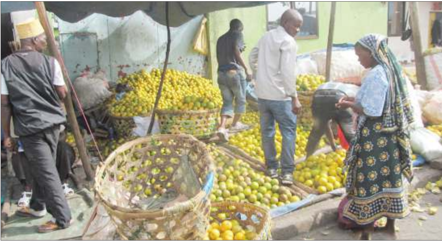
Wachuuzi wa machungwa sokoni Buguruni, wakisubiri wateja wa jumla na rejareja. Matunda hayo kwa sasa yanapatikana kwa wingi katika masoko mbalimbali ya Dar es Salaam huku baadhi yakiharibika kwa kukosa wateja.