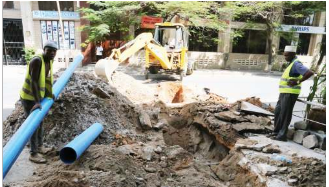
Mafundi kutoka Mamlaka ya Majisafi na Maji Taka jijini Dar es Salaam (Dawasa), wakifanya maandalizi ya kubadilisha bomba la maji taka katika mtaa wa Ali Hassan Mwinji jana.

Naye meneja mtetezi na sera kutoka Tamwa, Hawra Shamte, alisema chama hicho kinatoa mafunzo mbalimbali kwa wanawake ili waweze kumiliki ardhi kisheria.