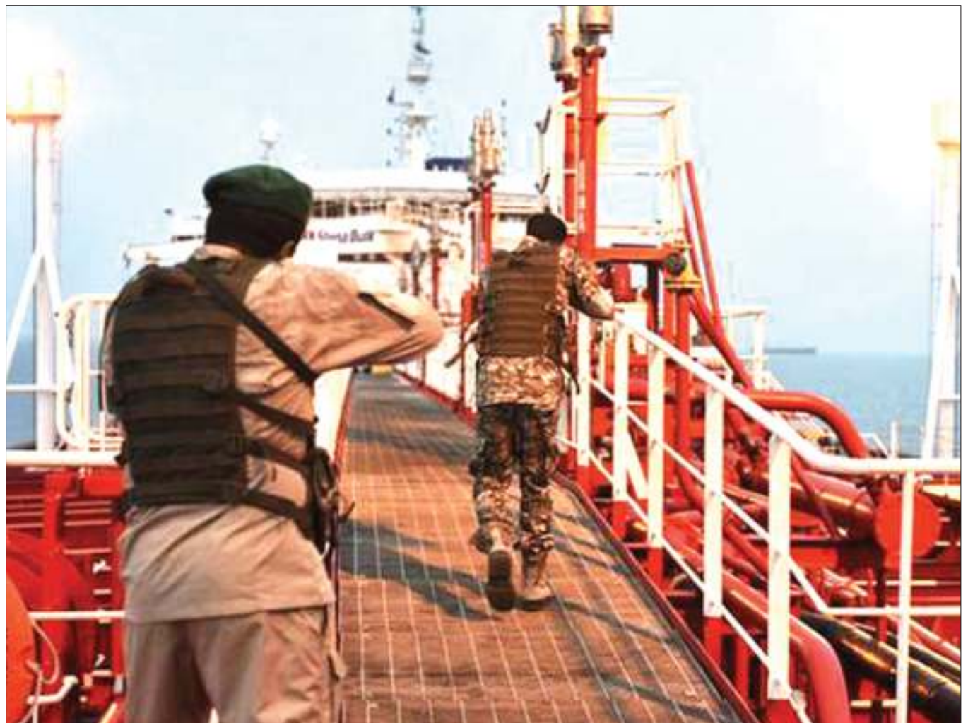
Wanajeshi wa Uingereza kutoka kikosi cha ulinzi wa bahari wa Ulaya katika Ghuba ya Uajemi wakifanya doria.

Wanasiasa kadhaa na baadhi ya maafisa wa ngazi ya juu katika vikosi vya usalama na ulinzi nchini DRC wamewekwa kwenye orodha ya vikwazo vya UN kwa tuhuma za kuhusika na vitendo vya ukiukaji haki za binadamu. RFI