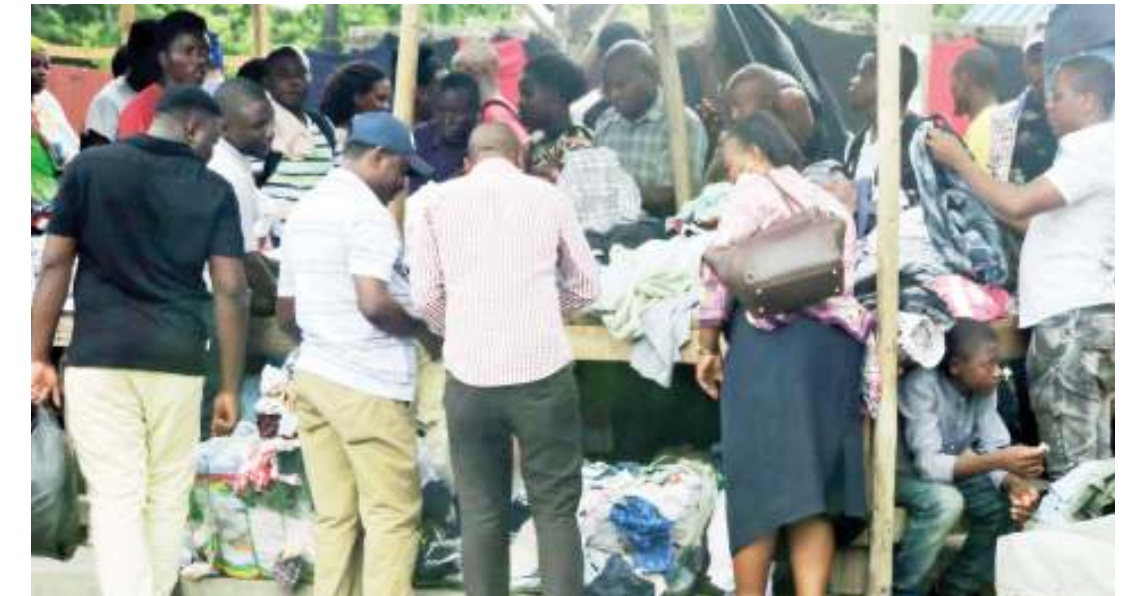
Wakazi wa jiji wakichagua nguo za mitumba katika soko la Ilala, jijini Dar es Salaam jana.