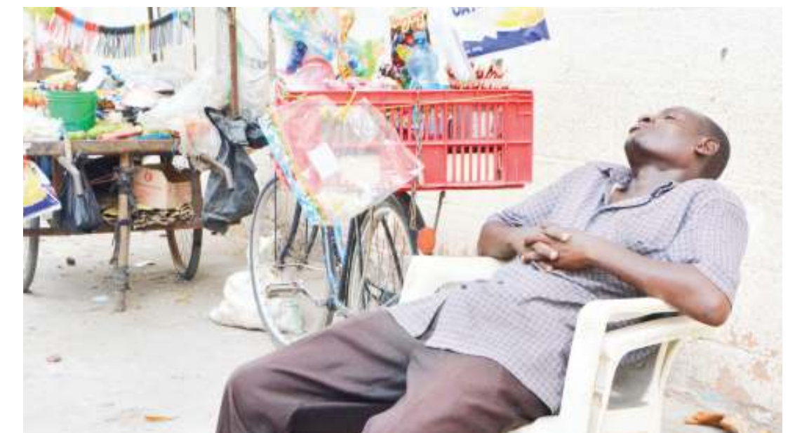
Muza pipi akiwa 'amechupa' usingizi wakati akisubiri wateja katika eneo la shule ya msingi Dai- mond, jijini Dar es Salaam mapema wiki hii.