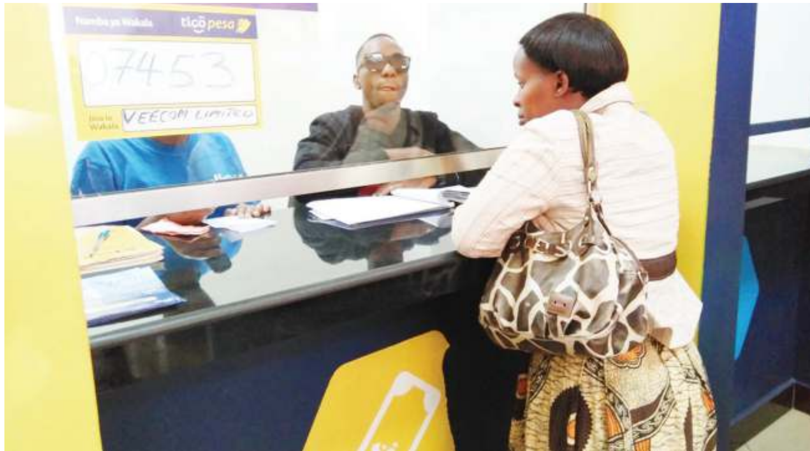
Moja ya wakala wa simu za mkononi, mjini Moshi.

Albou anasema, ni mfumo uli-otengenezwa kwa namna rafiki na rahisi kila mtumiaji nchini. Anafafanua: "Tunasikiliza na kupokea