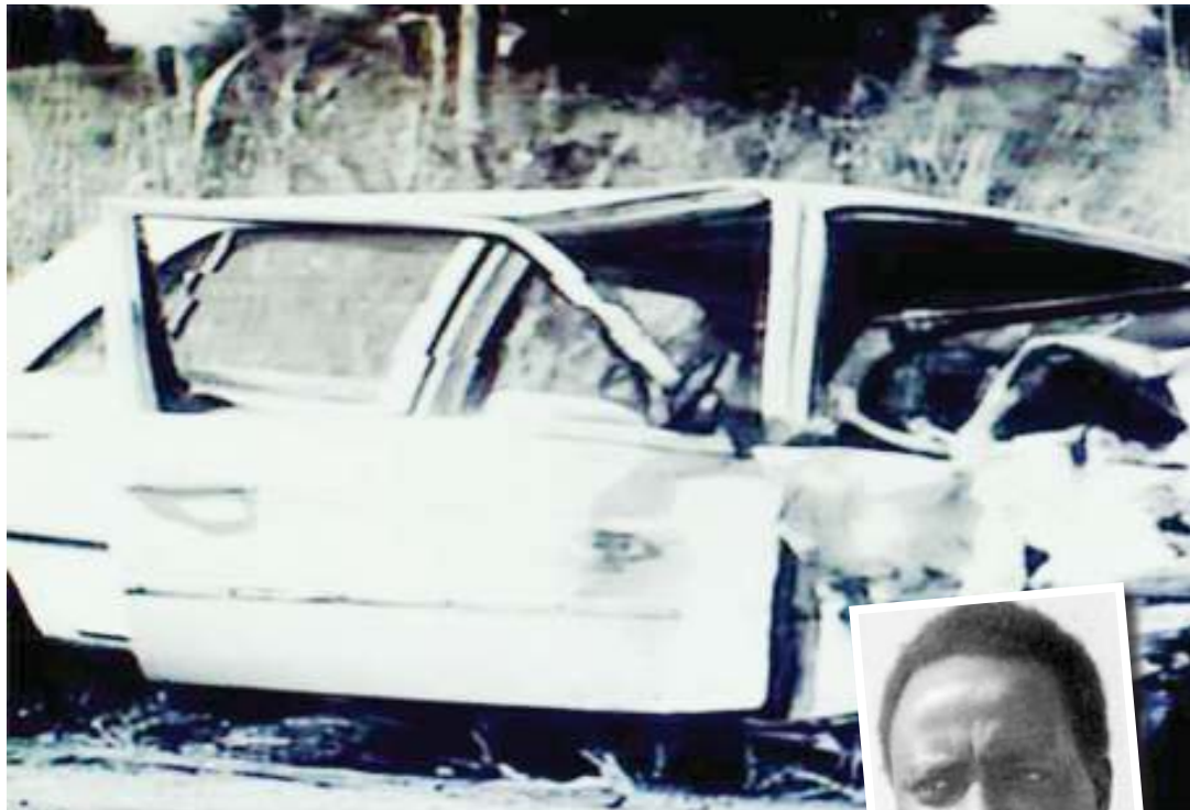
Gari alilopatia ajali Edward Sokoine (picha ndogo kulia)