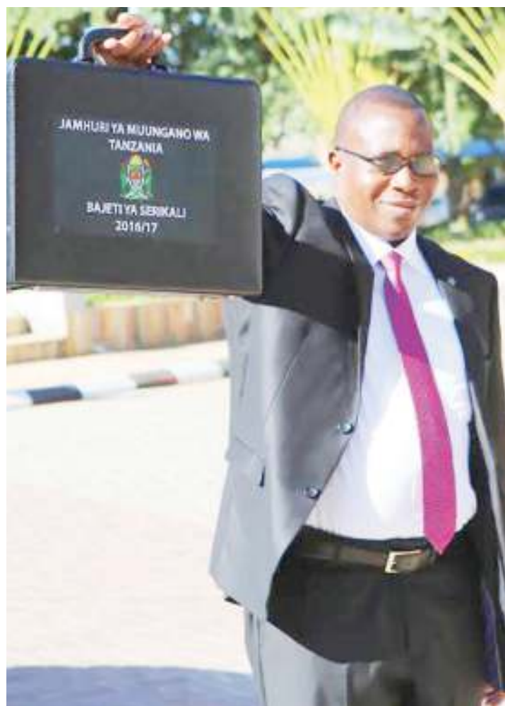
Waziri wa Fedha na Mipango, Dk. Philip Mpango, akionyesha bungeni, begi lenye hotuba ya bajeti.