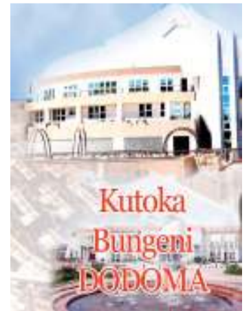
Habari zote na Augusta Njoi, DODOMA

"Tabora Mjini zaidi ya wakazi 12,992 wamefikishiwa huduma za mawasiliano katika kata za Kabila na kampuni ya Halotel, Kalunde na Vodacom na Uyui Vodacom," alisema. Pia alisema kwa Iramba zaidi ya wakazi 12,320 wamefikishiwa huduma za mawasiliano katika kata za Mtekente na kampuni ya Vodacom na Urughu na TTCL kupitia mfuko wa mawasiliano kwa wote.