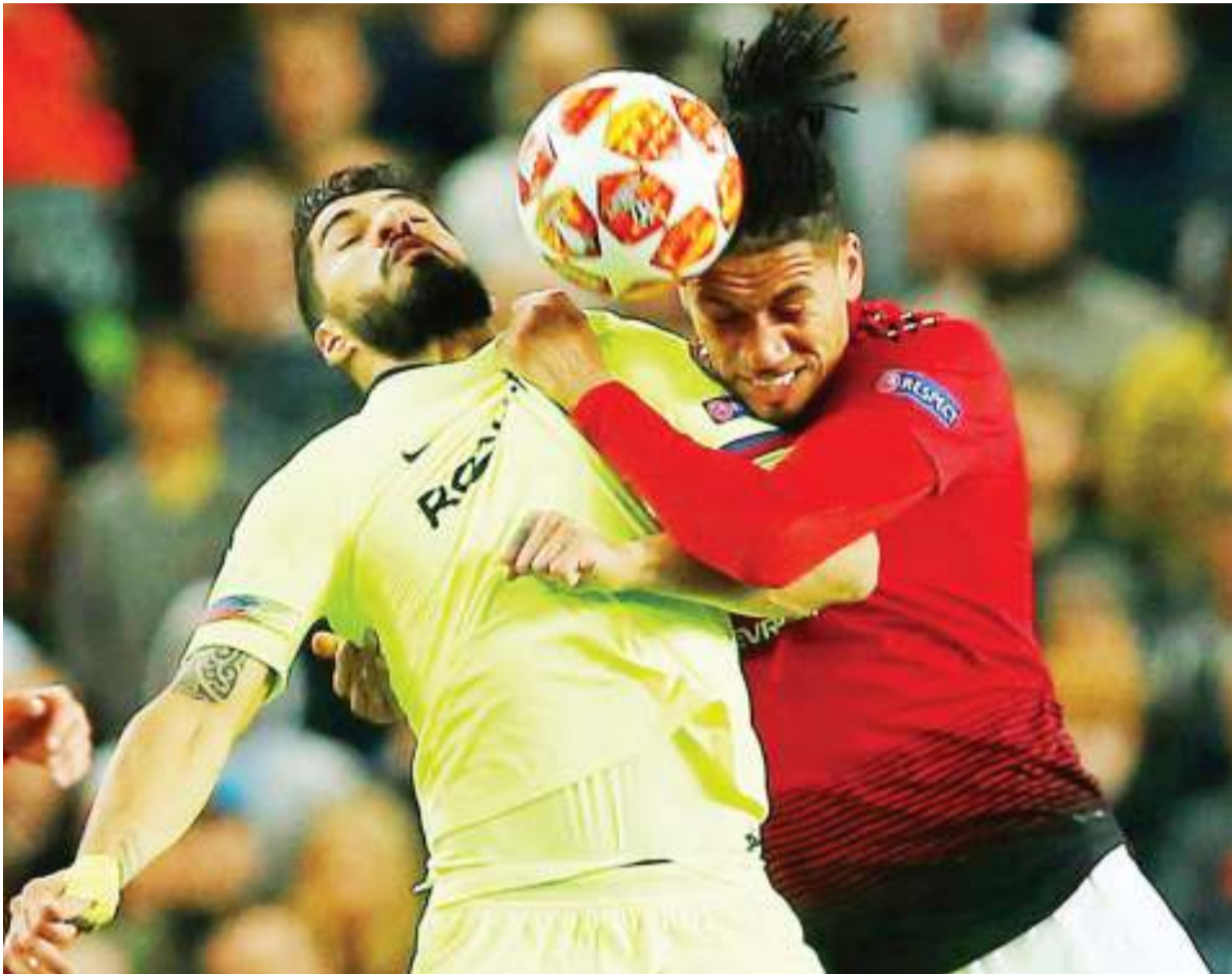
Beki wa Manchester United, Chris Smalling (kulia), akipambana kumkaba straiika wa Barcelona, Luis Suarez katika mechi ya kwanza ya hatua ya robo fainali ya Ligi ya Mabingwa Ulaya iliyochezwa juzi usiku, kwenye Uwanja wa Old Trafford. Barca ilishinda bao 1-0.