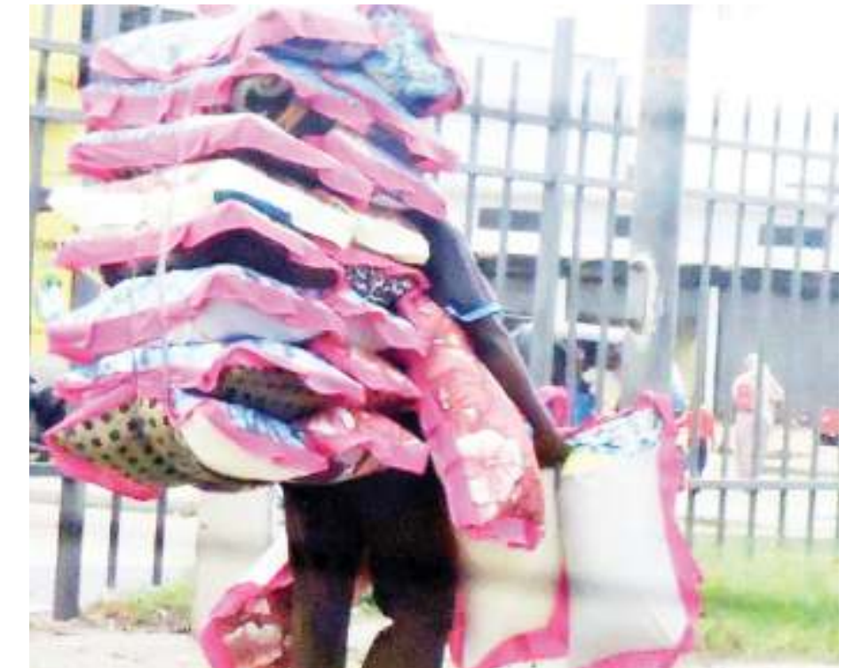
Mchuzi wa mito akisaka wateja kando ya Barabara ya Mandela, eneo la Bugu- runi jijini Dar es Salaam mapema wiki hii. Mto ali- uza kwa bei ya 5,000/-