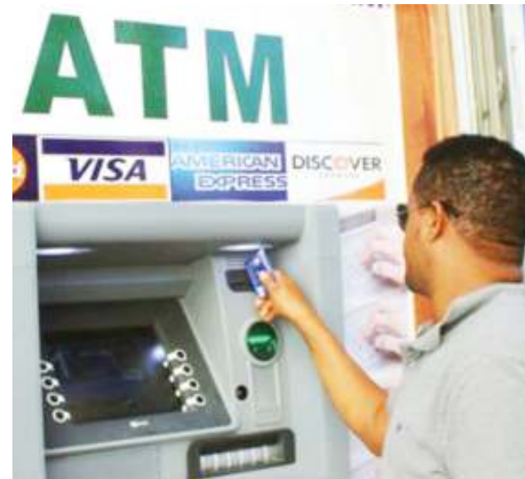
Huduma za ATM.

maoni yanayotolewa na watumiaji na huwa tunachukua maoni pamoja na mapendekezo yanayotolewa na watumiaji 'App' hii na kuyaongezea kwenye mapitio ya kila mwezi.