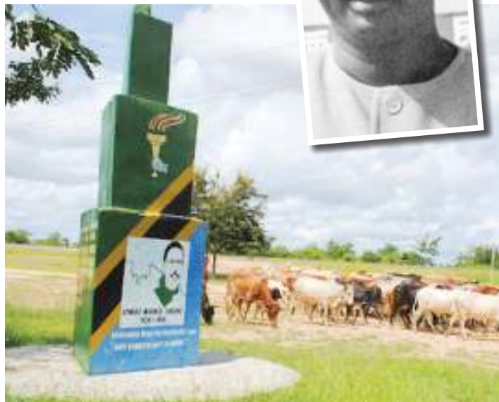
Mnara wa kumbukumbu katika eneo alikopata ajali marehemu Edward Sokoine, wilayani Mvomero, Morogoro.

“ Mwaka 1970, alipandish-shwa, akishika nafasi ya uwaziri wa nchi na miaka miwili, 1972, baadaye aliteuliwa, Waziri wa Ulinzi na Jeshi la Kujenga Taifa.