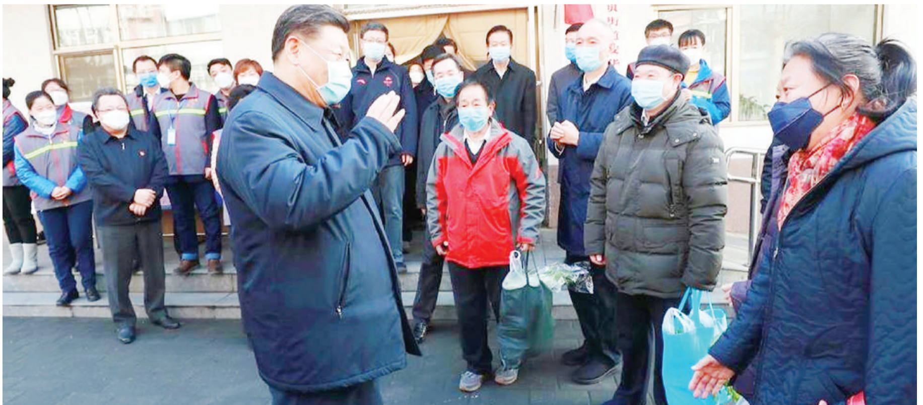
Rais wa China, Xi Jinping akiongea na wakazi wa Beijing.

Waziri wa Mambo ya Nje wa Marekani, Mike Pompeo, alipongeza hatua hiyo ya Ghani ingawa alipinga vikali kuanzishwa kwa serikali mbili mjini Kabul. DW