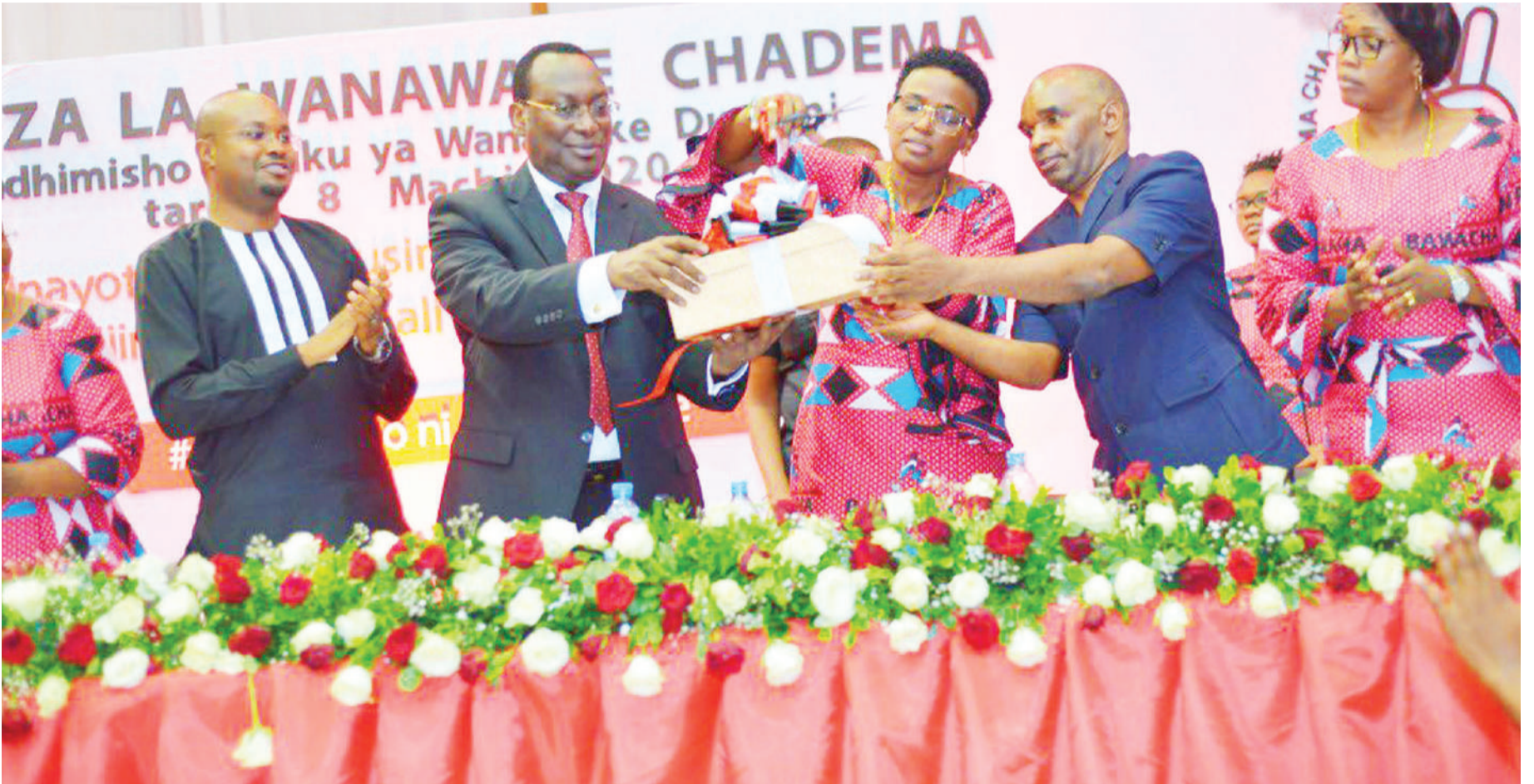
Mwenyekiti Mbowe akiwa na wanachama wa Bawacha kuadhimisha Siku ya Wanawake Duniani, Jumapili Machi 8, 2020.