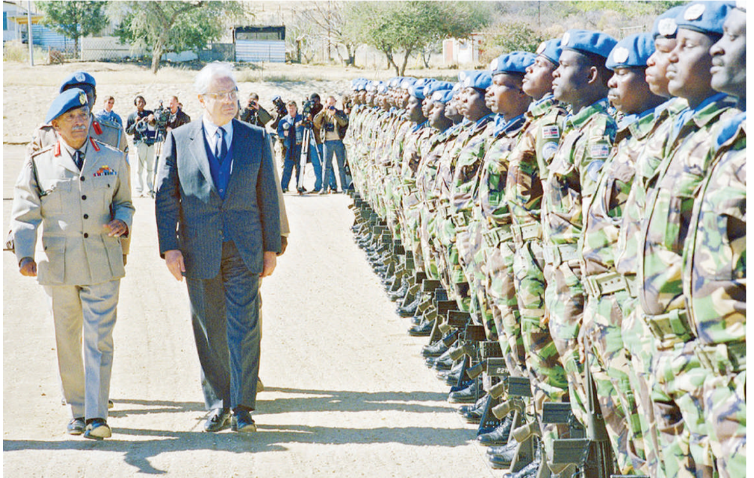
Katibu Mkuu Javier Perez de Cuella, akiwa nchini Namibia kulitembelea kundi la mpito la msaada wa jeshi la kulinda amani (UNTAG) lililofanyakazi Namibia na Angola. De Cuella alikuwa kwenye makao makuu ya jeshi hilo nchini Namibia mwaka 1989.