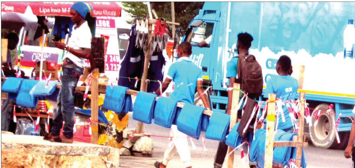
Wachuuzi wa maturubai wakiwa wameyapanga kwenye eneo ambalo barabara inaendelea kujengwa, Mwenge, jijini Dar es Salaam jana, kitendo kinachoweza kuleta usumbufu kwa wajenzi.

Alisema baada ya mkutano huo vijana hao watatembelea hifadhi za taifa na kuchangia kwenye uchumi wa nchi.