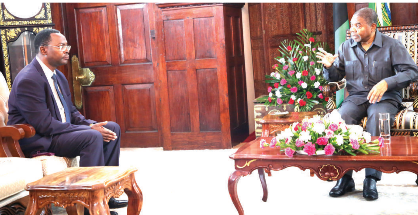
Rais wa Zanzibar na Mwenyekiti wa Baraza la Mapinduzi, Dk. Ali Mohamed Shein, akizungumza na Waziri wa Mambo ya Ndani, George Simbachawene, wakati alipofika kujitambulisha na kufanya mazungunzo, Ikulu Zanzibar, jana.

Akizungumzia kuhusu kituo cha afya kijiji hapo, alisema kuwa kituo hicho kina uwezo wa kutoa huduma za uzazi, lakini tatizo hawana wataalamu kwa ajili ya kuwazalisha wajawazito.