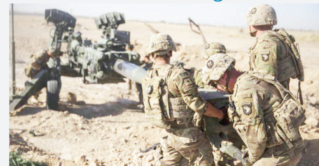
Baadhi ya askari wa Marekani wakiwa kazini nchini Afghanistan.

MAOFISA wa Marekani wamesema baadhi ya wanajeshi wake wameanza kuondoka nchini Afghanistan, kama ilivyokubaliwa kwenye mazungumzo ya amani na kundi la Taliban.