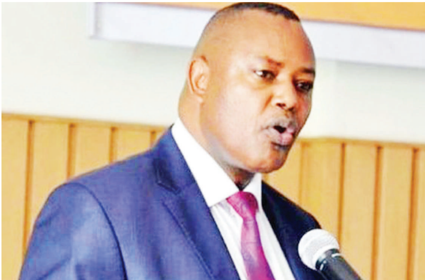
Mkuu wa Mashtaka nchini Kenya, George Kinoti.