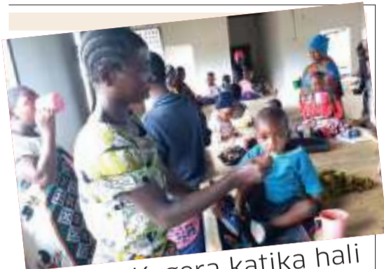
Watoto Kagera katika hali mbaya, wenye utapiamlo idadi inatisha