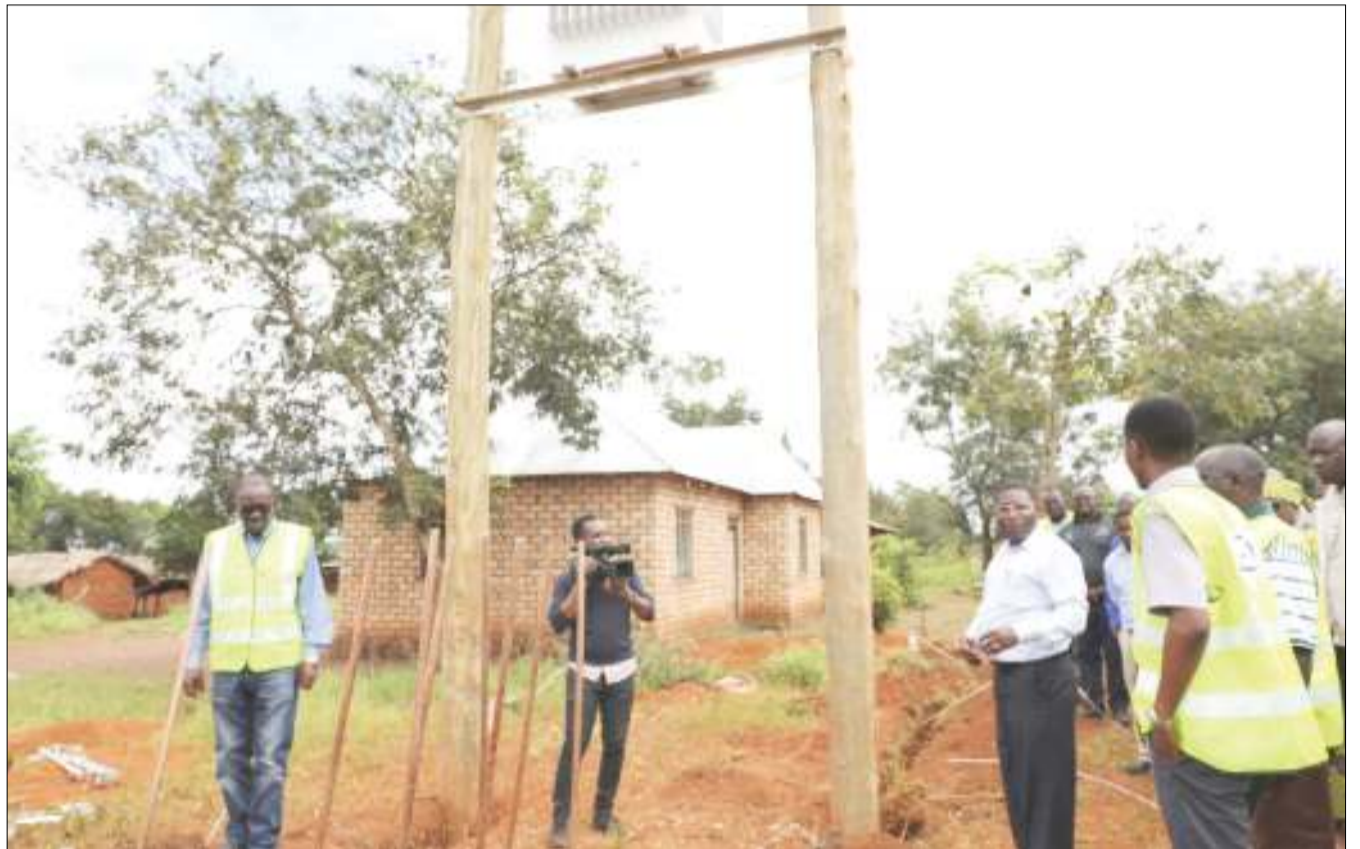
Waziri wa Nishati, Dk. Medard Kalemari (wa tatu kushoto), akikagua miundombinu ya umeme katika Kijiji cha Kazuramimba, wilayani Uvinza, Mkoa wa Kigoma juzi. Habari Uk. 9.

Alisema SCCULT imejiendesha kwa udhaifu kwa kutotoa huduma stahiki kwa wanachama wake kwa muda mrefu takribani miaka 10, ambapo kipindi hicho ikiwa na wanachama 1,247, na kwamba hadi Januari, 2019 zoezi la uhakiki juu ya uwapo wa wanachama hao kama wapo hai na wanafanya shughuli zao umebaini takribani vyama vina wanachama 500 tu ambavyo vipo hai na vinafanya kazi.