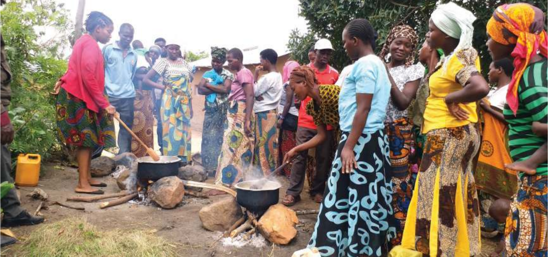
JUU NA CHINI: Kinamama wakifundishwa kupika chakula cha watoto.