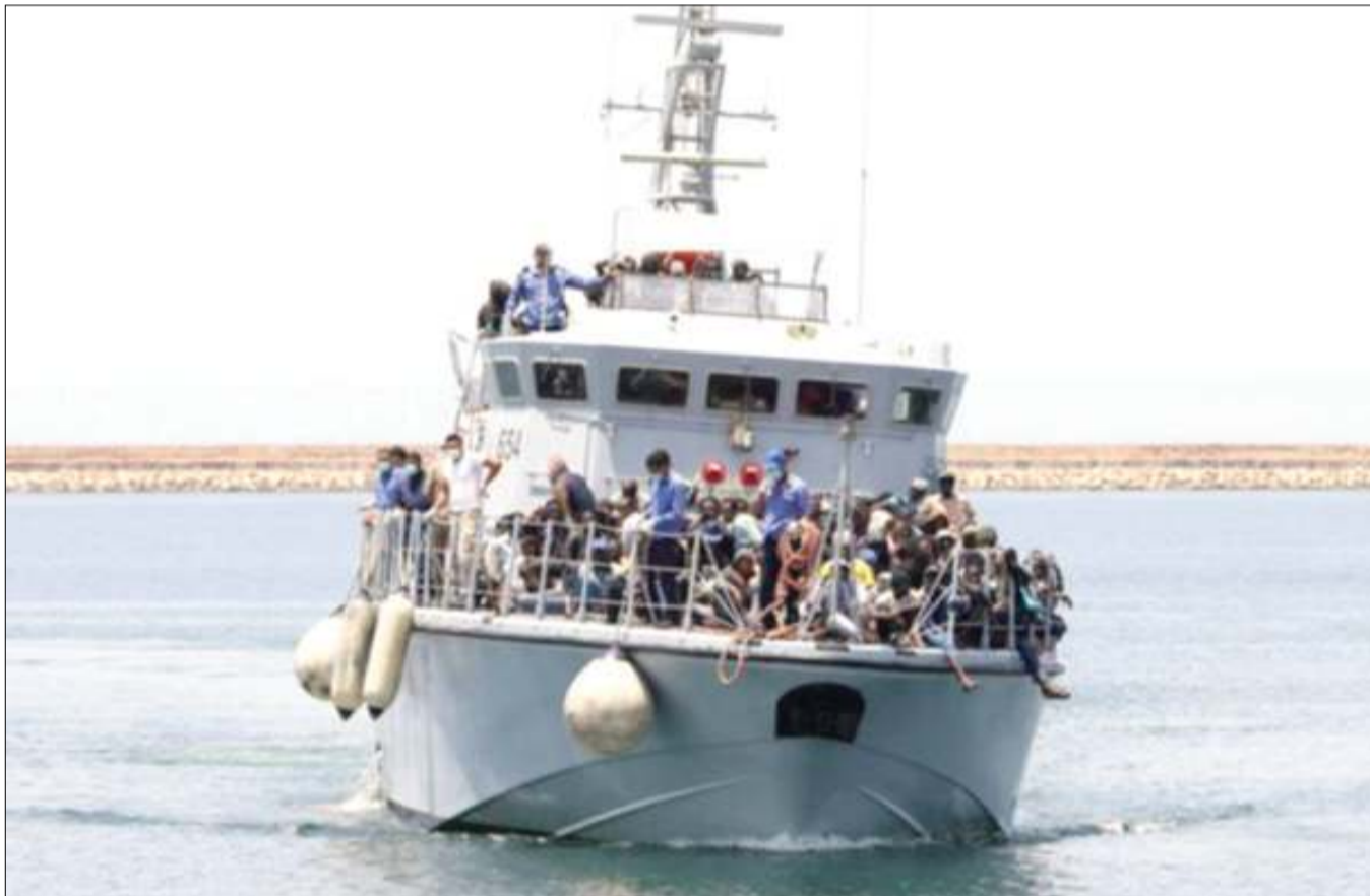
Wahamiaji haramu wakiwa katika meli Bahari ya Mediterania wakisafirishwa kuelekea nchi za Ulaya.