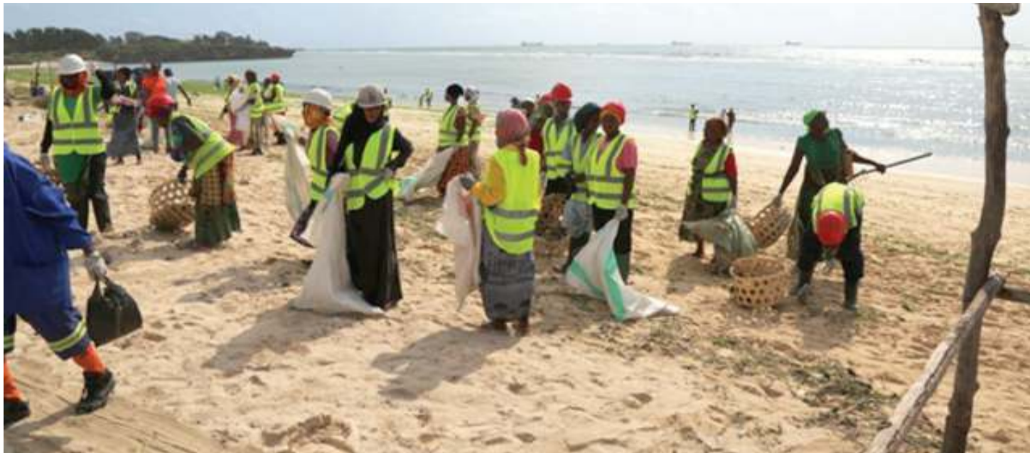
JUU NA CHINI: Kampeni ya usafishaji ufukwe wa Coco, jijini Dar es Salaam, ambayo si mbali na Msasani, kulikofanyiwa usafi na vijana wa Skauti.