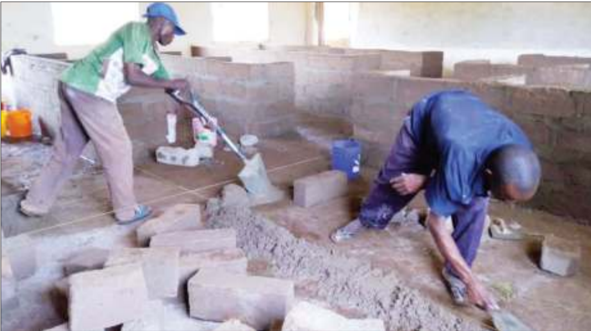
Mafundi wakijenga miundombi-nu kwa ajili ya maabara ya Shule ya Sekondari Nyanja, iliyoko katika Kata ya Bwasi, Jimbo la Musoma Vijijini mkoani Mara juzi. Shule hiyo ina jumla ya wanafunzi 510.