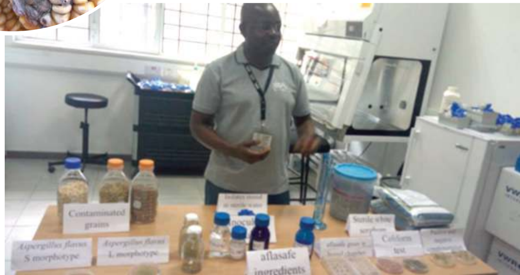
Mtaalamu akiwa katika maabara inayohudumia kukabili sumu kuvu.

Hili ni tatizo, idadi ya vifo na watu walioathirika kwa tatizo hilo ni wengi, inawezekana hawa waliogundulika ni wale waliopima tu, ambao hawajapima huenda tatizo likawa kubwa."