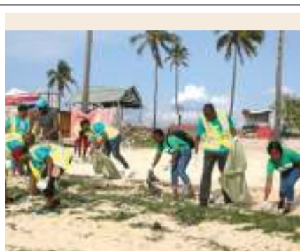
Skauti wahamia ufukweni kukabili uchafu uliokithiri