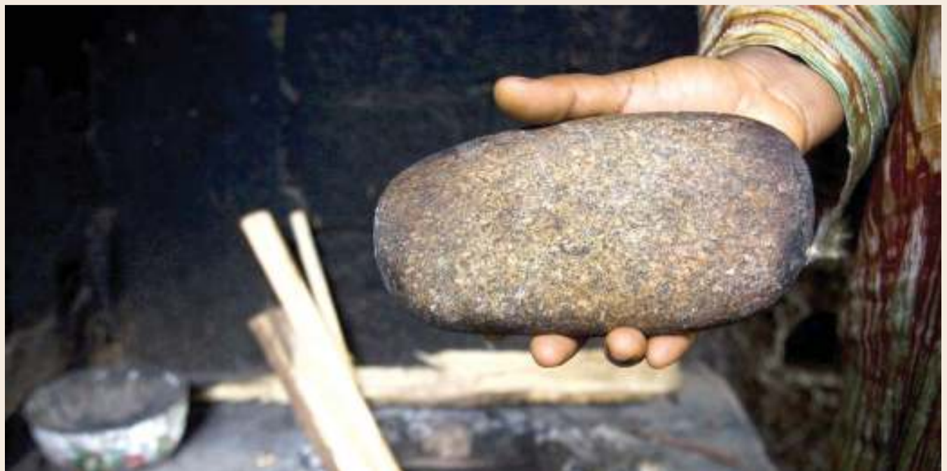
Hii ndio hali halisi na vifaa vinavyotumika.

Aidha, kunaelezwa kuwepo elimu kuhusu ukeketaji dhidi ya wasichana, lakini ni wachache wanaofahamu kuhusu 'uchomaji' matiti.