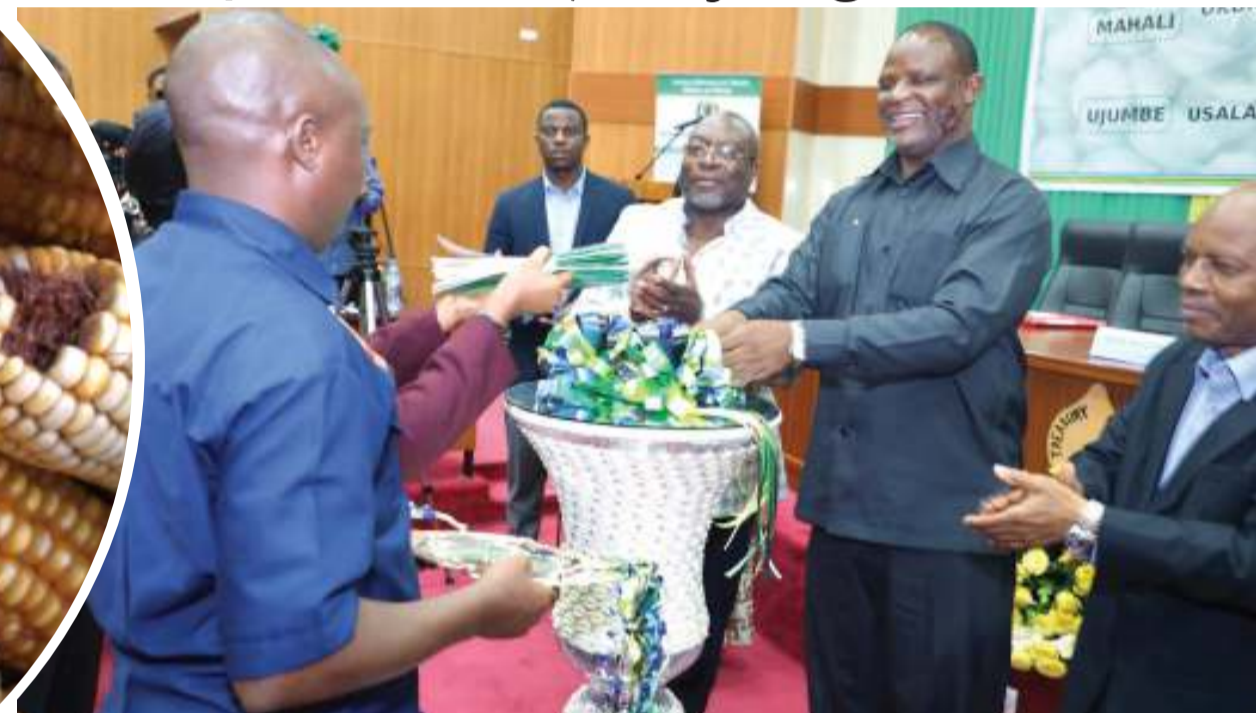
Waziri wa Kilimo, Japhet Hasunga, akipokea maandiko yanayohusu sumu kuvu.