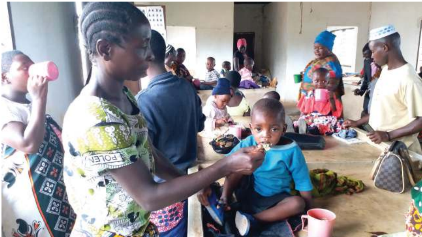
Kinamama wakiwalisha watoto, baada ya kufundishwa namna ya kuandaa chakula cha watoto.