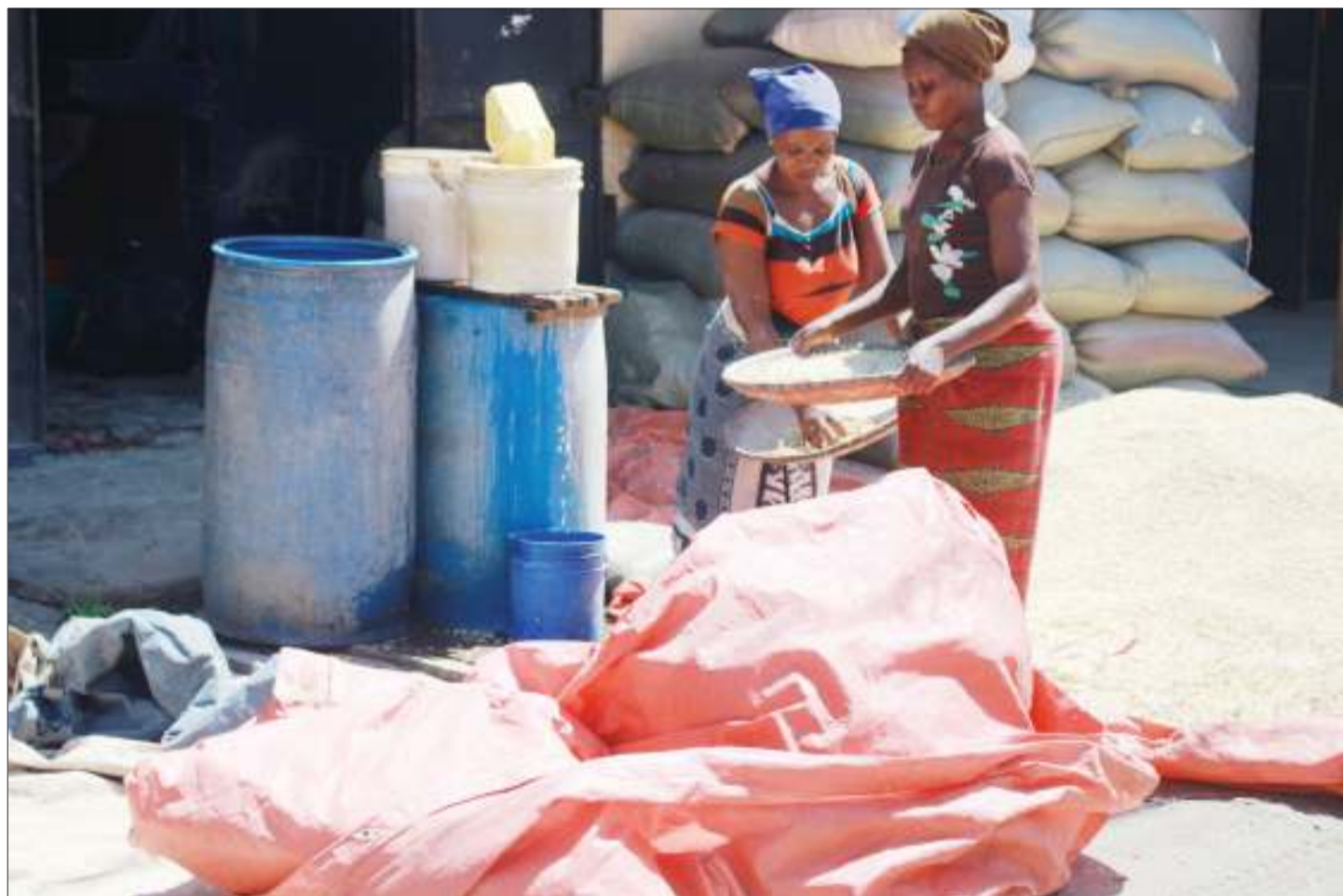
Wanawake wakipepeti mahindi kabla ya kuyasaga kuwa unga katika mashine iliyopo eneo la Manzese, jijini Dar es Salaam juzi.

"Boma lingine la vyumba viwili na ofisi moja, wanafunga rentu, huku wakiendelea na ufyatuaji wa matofali ili kuanza ujenzi wa vyumba vingine vya madarasa na nyumba ya kuishi walimu," alisema.