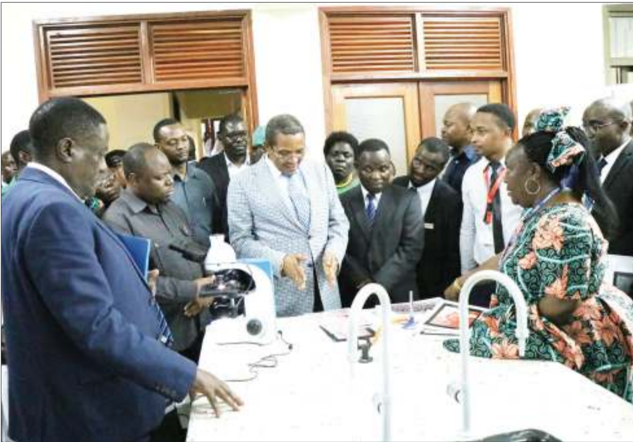
Mkuu wa Chuo Kikuu cha Dar es Salaam, Rais mstaafu, Jakaya Kikwete na viongozi wengine wakiangalia moja ya maabara inayotumiwa na wanafunzi wa Chuo cha Udaktari Ndaki ya Mbeya, kilichopo katika Hospitali ya Rufani Kanda ya Mbeya, katika ziara yake mkoani humo jana, kukagua eneo la ekari 3,000 zilizotolewa na serikali kwa ajili ya ujenzi wa chuo kikubwa cha udaktari na kiwanda cha dawa.