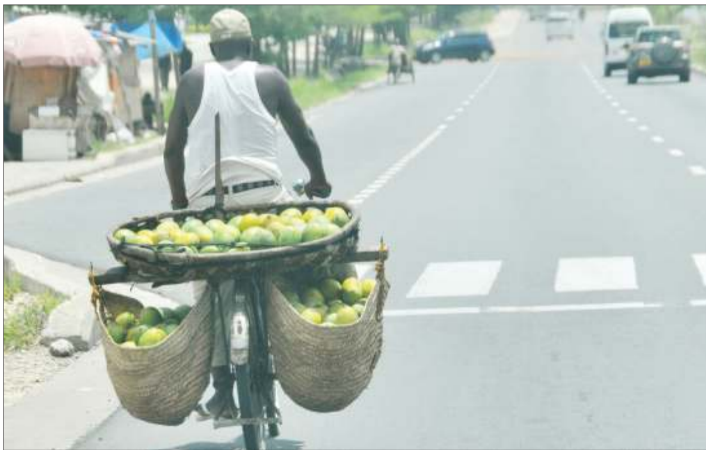
Mchuzi wa maembe akiwa kwenye harakati za kutafuta wateja katika Barabara ya Nyerere, akielekea katikati ya Jiji la Dar es Salaam jana.

"Tunaamini viongozi wa dini wakismama kwa pamoja na serikali kutoa elimu juu ya vitendo hivi vya ukatili watakuwa wamesaidia kwa nafasi kubwa kupunguza matukio ambayo yamekuwa yakijitokeza mara kwa mara na kusababisha kuwanyima haki wanawake na watoto,"