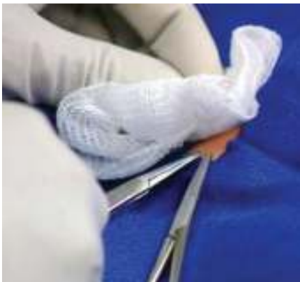
Tohara ikifanyika.