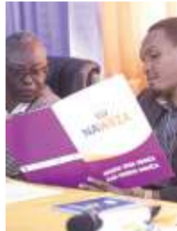
UNAIJUA Naweza? Mkakati unaosuka upya mwelekeo kukabili magonjwa hatari nchini