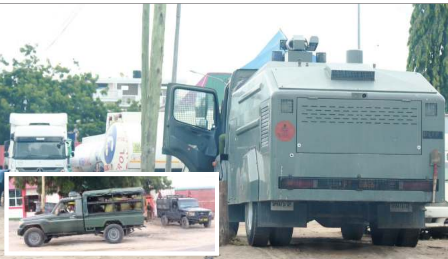
Polisi wakiweka ulinzi karibu na mlango wa kuingia katika Hoteli ya PR Stadium, katika Manispaa ya Temeke, jijini Dar es Salaam jana, ambapo viongozi wa kitaifa wa chama cha ACT -Wazalendo walikuwa na mkutano wa ndani.

Yawatupa miaka 315 jela wawili kwa makosa 105... Uk. 3