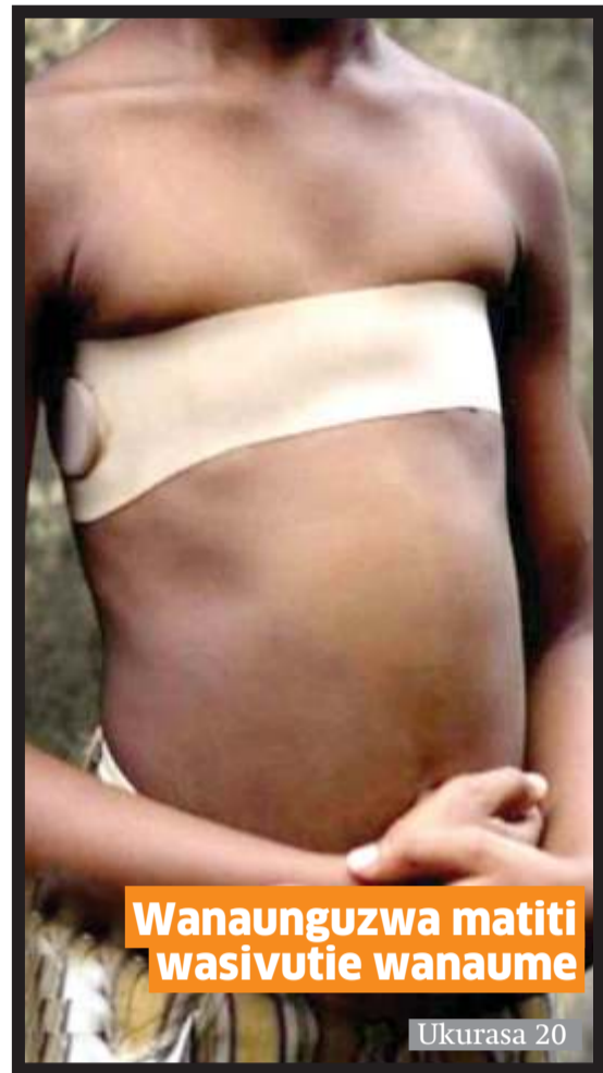
Wanaunguzwa matiti wasivutie wanaume